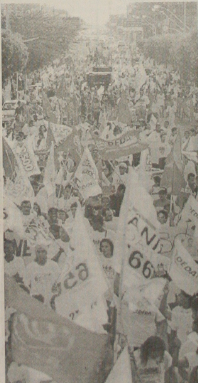
Uma passeata ontem à tarde reuniu cerca de 20 mil adeptos da candidatura do petista Marcelo Déda. (Página 3A)

A Associação Sergipana de Proteção Animal protocolou denúncia ao Ministério Público de Sergipe acusando o Centro de Zoonoses do município de sacrificar indiscriminadamente animais apreendidos pela Empresa Municipal de Serviços Urbanos (Emsurb) e encaminhados ao curral localizado nas proximidades do Centro Administrativo Augusto Franco. Segundo a entidade protetora, os animais são abatidos de forma brutal e arbitrária. (Página 1B)