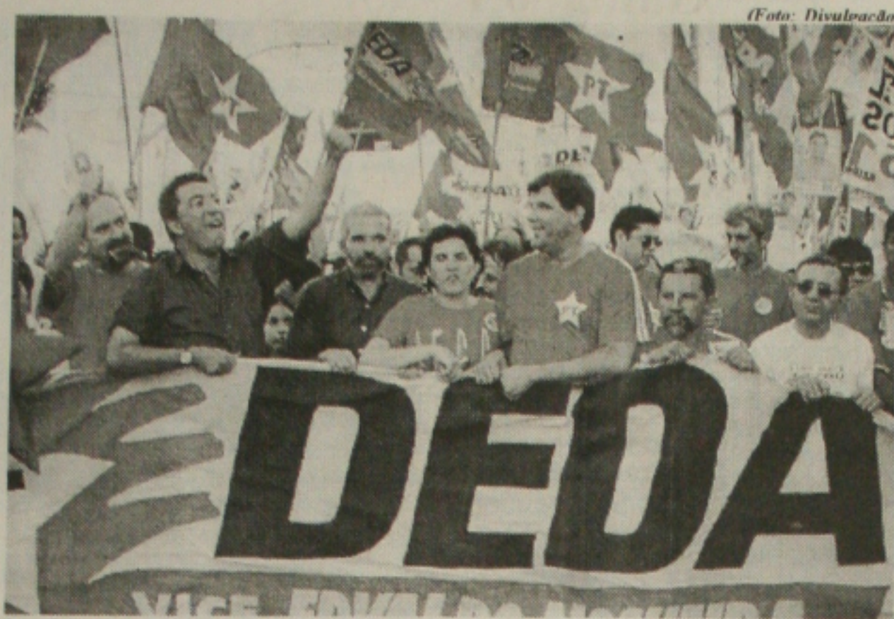
Caminhada de Marcelo Déda atrai mais de 20 mil pessoas, segundo organizadores