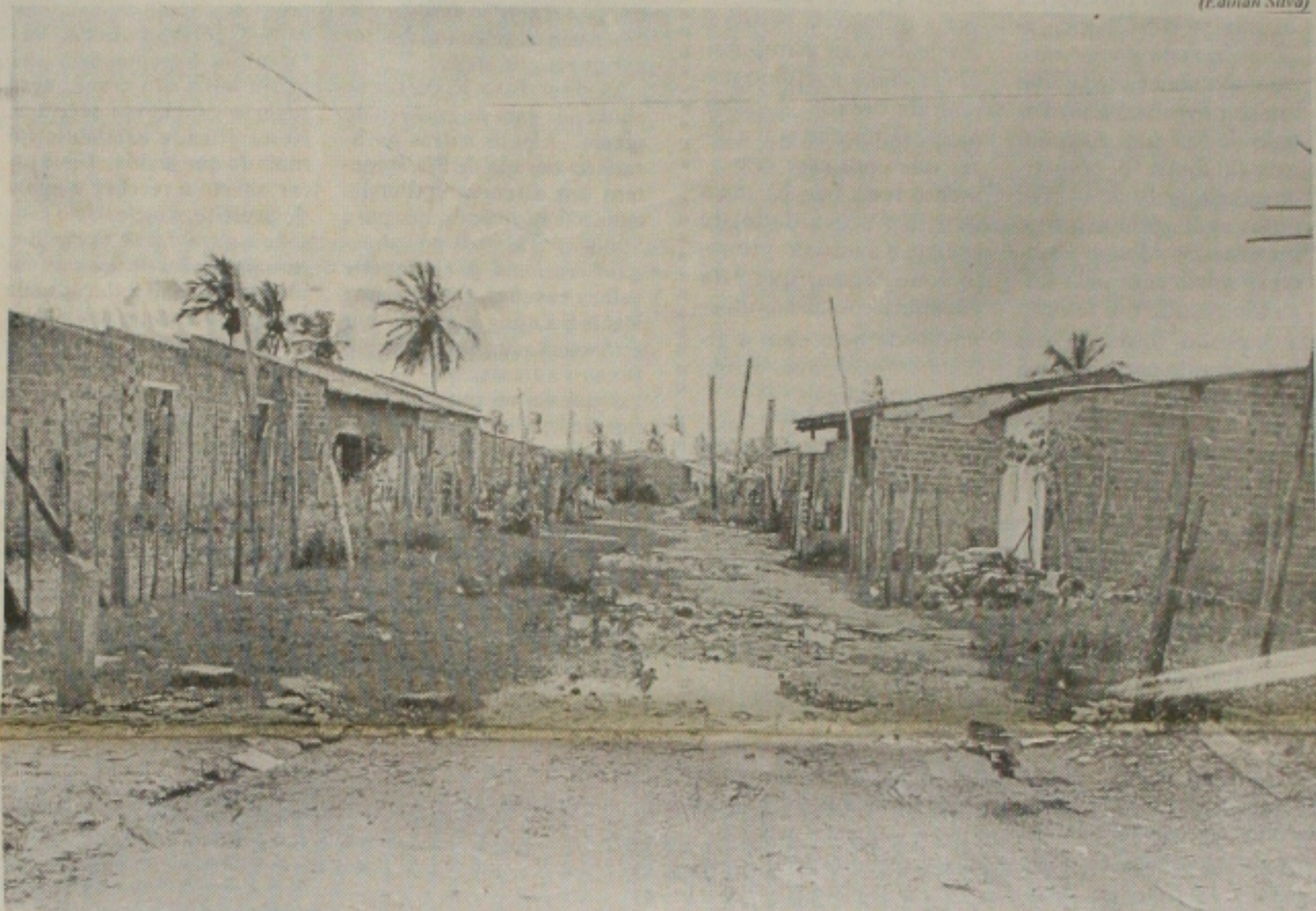
As chuvas vêm tornando diariamente mais difícil a vida dos moradores de favelas como a da Invasão Tamandaré. (Página 1B)