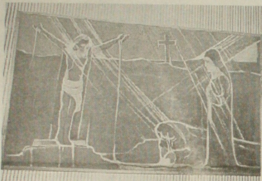
Quadro de J. Inácio, em exposição na Biblioteca Pública

A exposição fica em cartaz até o dia 06 de setembro, no hall da Biblioteca Pública Epifânio Dórea, aberta das 07 às 18 horas (Luciana Chaves)