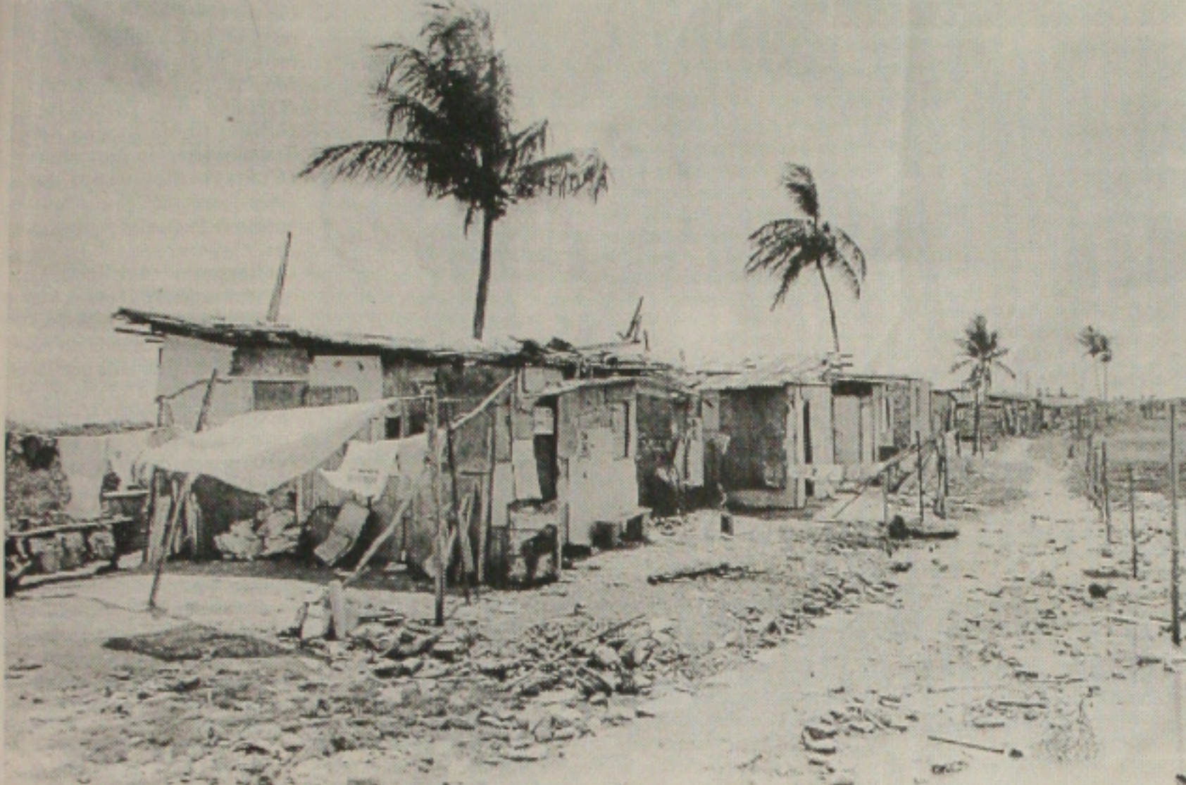
A falta de estrutura na invasão deixa os moradores sem qualquer tipo de proteção durante as chuvas