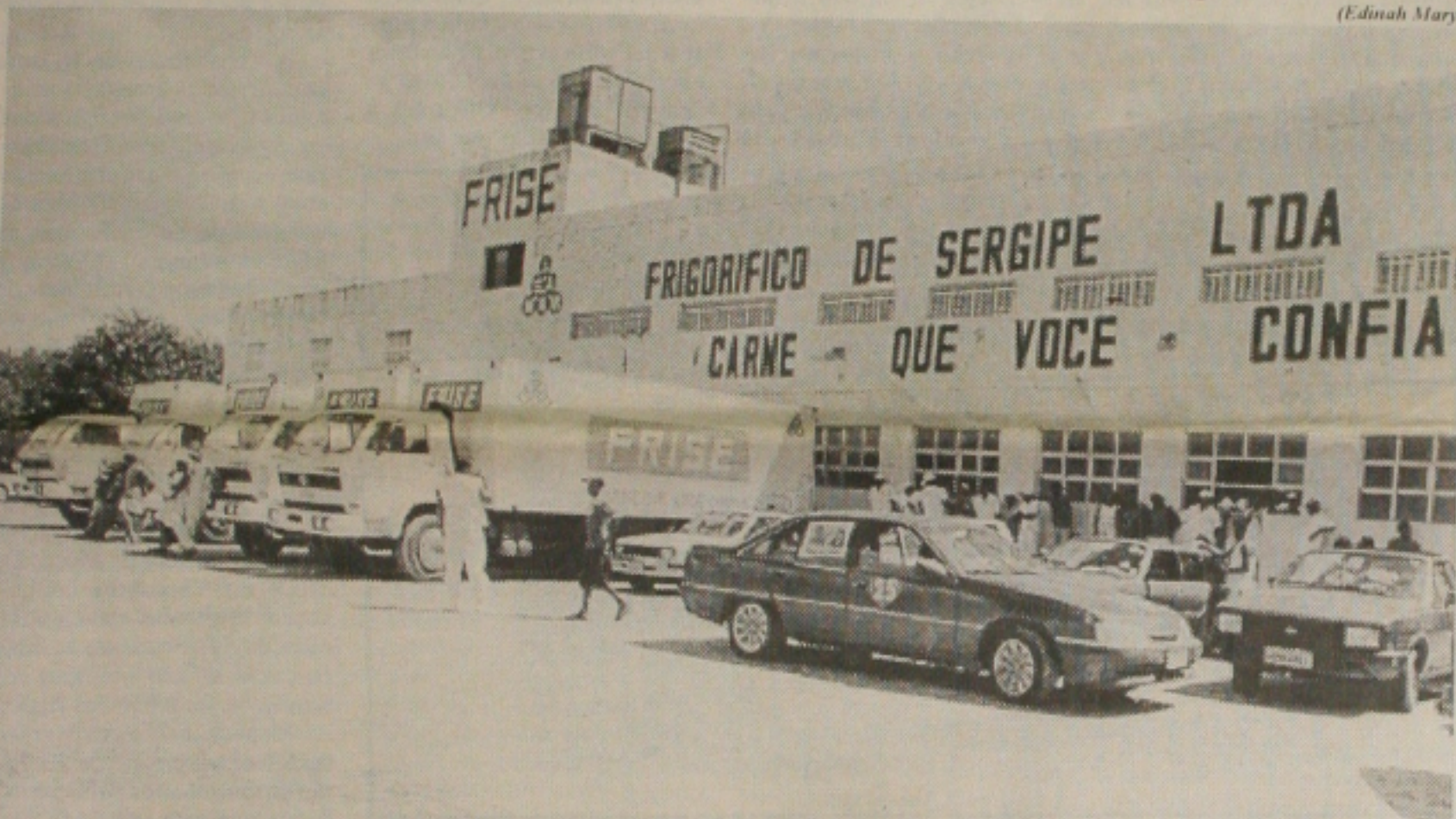
Interditado desde o dia 21, o Frise tem capacidade para abater 100 bois por dia em média