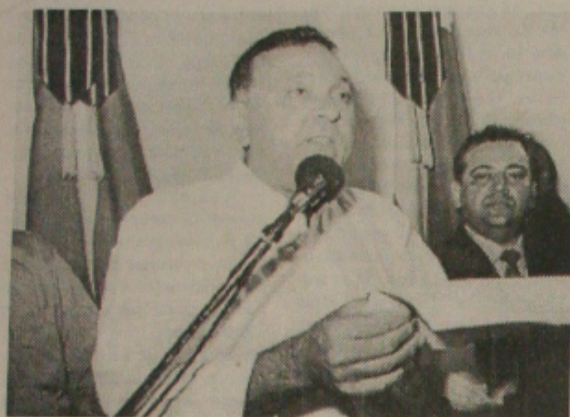
O prefeito Gama confirmou ontem apoio a Valadares. (Página 3A)