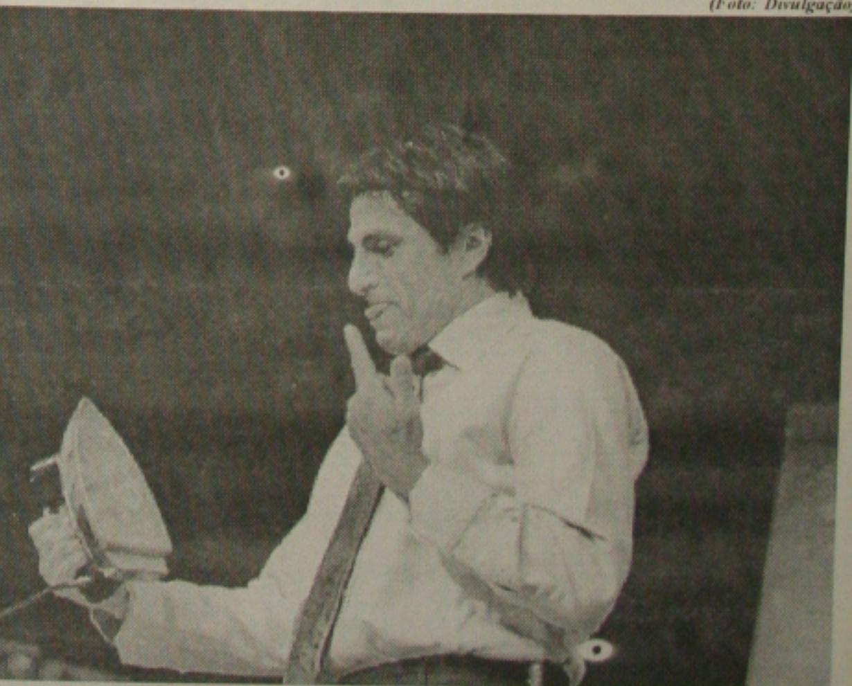
Evandro Mesquita escravo da moda e das grifes