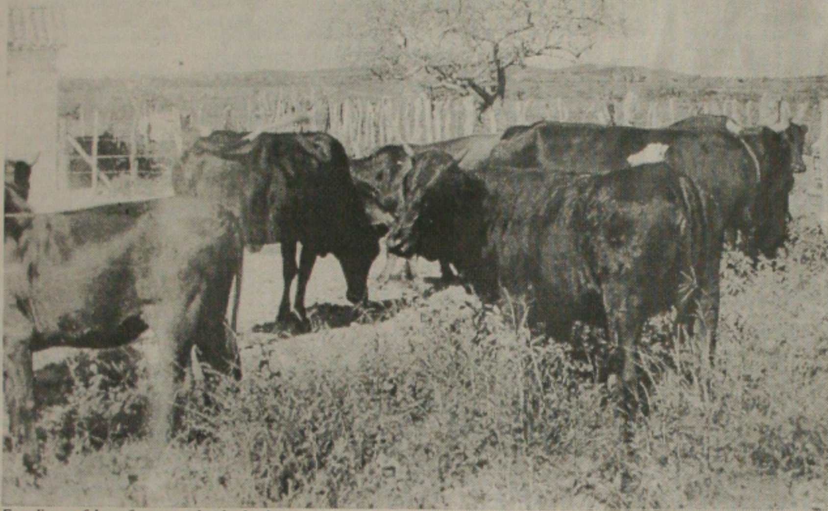
Erradicar a febre aftosa no rebanho bovino em todo o País tem sido a luta dos governos federal e estadual