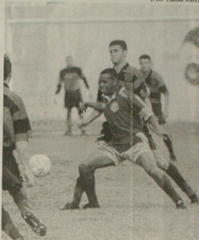
Levi vai acertar o sistema de jogo, mas pretende manter Orlando