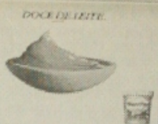
Outdoor categoria profissional - classificado em 1999