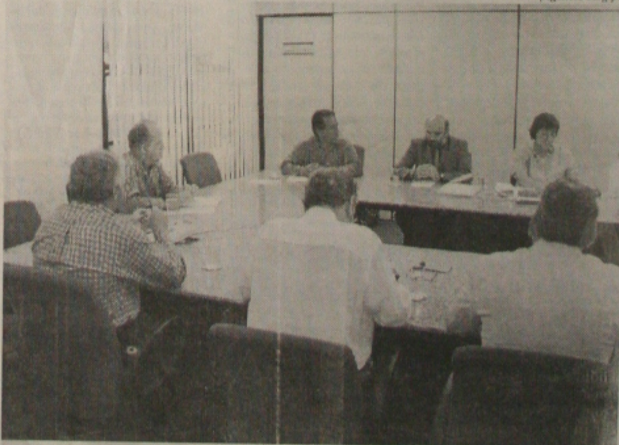
Acompanhado de secretários, o governador obteve informações detalhadas sobre o programa