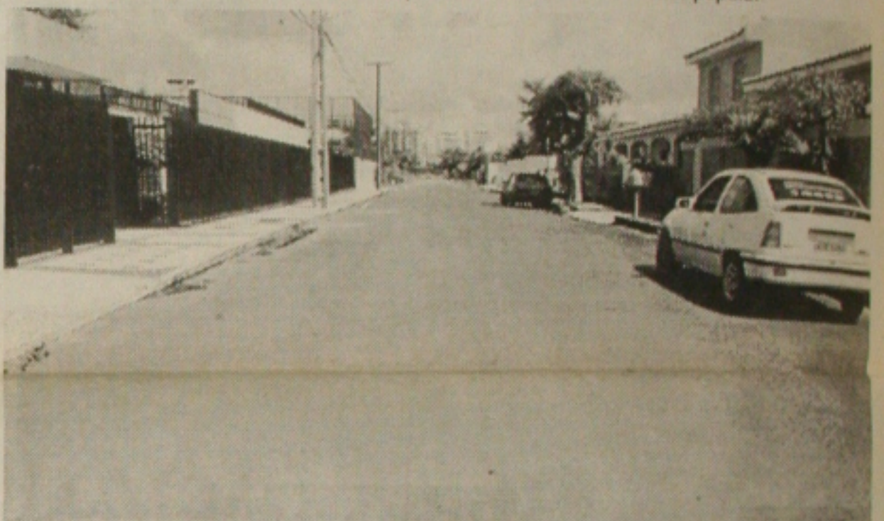
A pavimentação asfáltica começa a mudar o visual do Loteamento Garcia, no Bairro Salgado Filho

Considerada uma das comunidades mais carentes de Aracaju, a Matinha agora oferece maior qualidade de vida aos seus moradores. No Bairro Industrial, foram realizadas as obras de pavimentação em paralelepípedo e serviços de drenagem. A partir de agora, a lama e as frequentes inundações do local são coisas do passado.