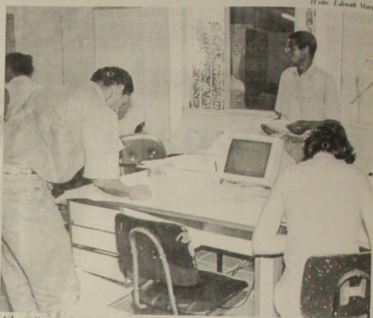
A Junta Comercial de Sergipe registrou em apenas oito meses o registro de mais de 2,6 mil empresas