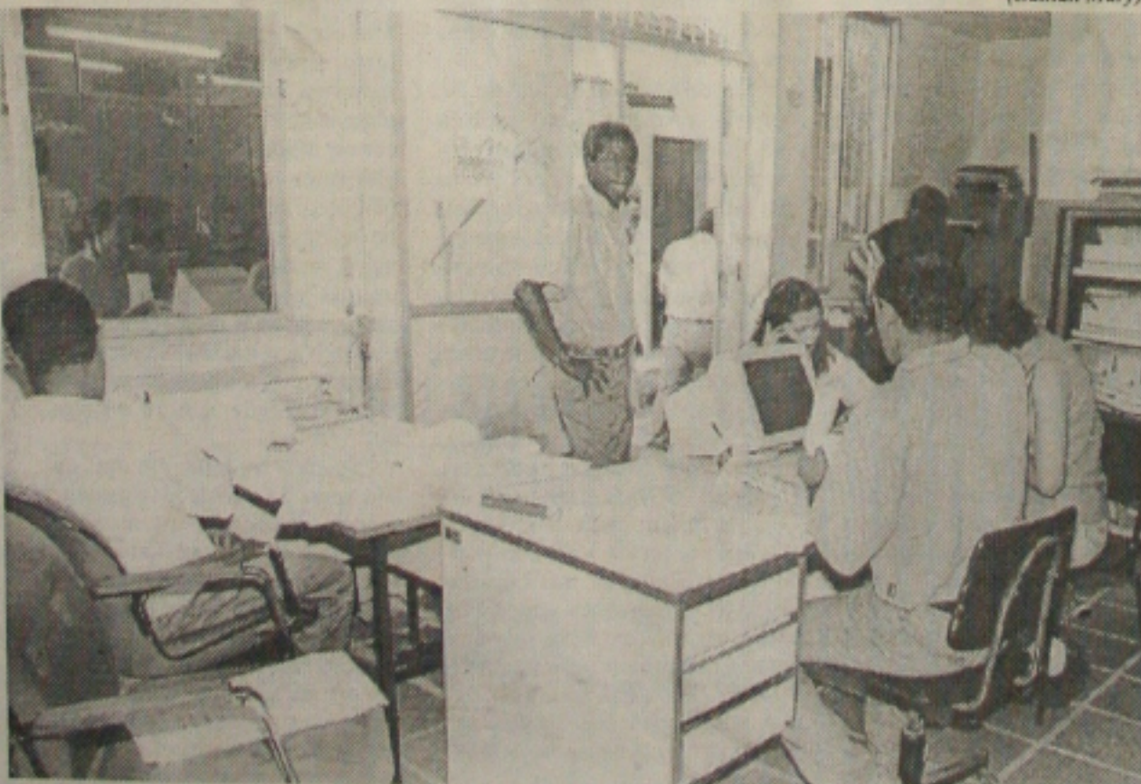
Na Junta Comercial, uma média de 12 novas empresas são abertas diariamente