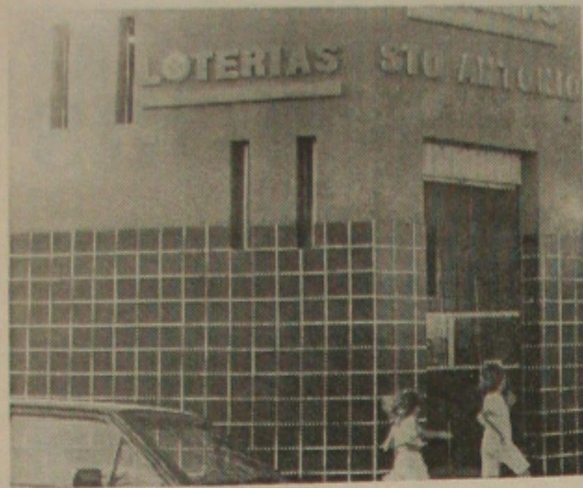
Lotéricas aumentam arrecadação do FGTS