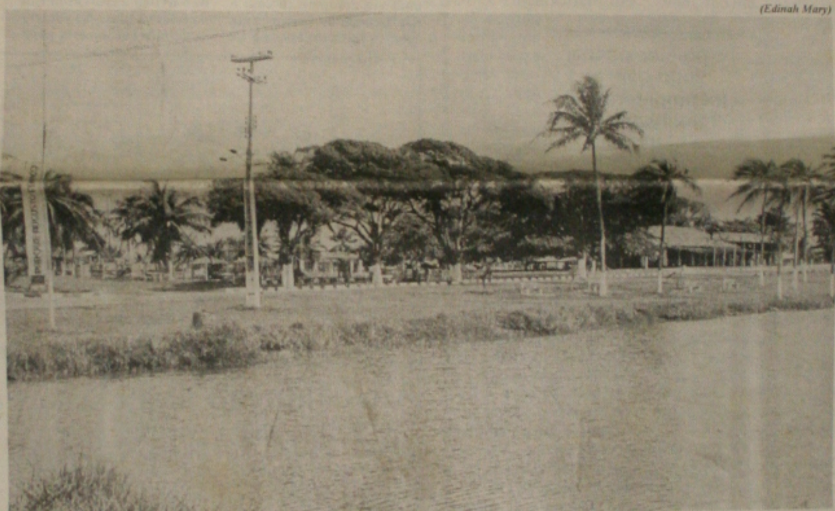
O Parque da Sementeira deve receber um grande número de pessoas no Dia da Criança, quinta-feira. (Página 5A)

caso seja condenado por peculato, o ex-prefeito pode sofrer uma pena de dois a 12 anos de reclusão. Na ação civil pública, se for condenado, ele perderá seus direitos políticos por oito anos e terá que restituir aos cofres públicos um total de R$ 212.083,50, pois além do principal, que é de mais de R$ 70 mil, e acrescido o pagamento de multa civil de duas vezes o valor do dano e a correção monetária. (Página 3A)