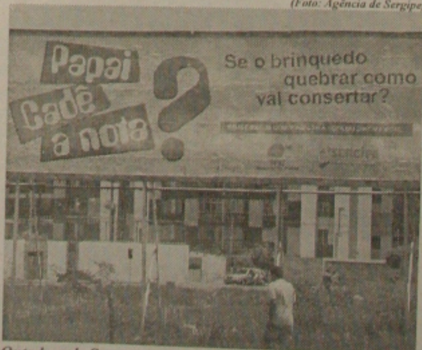
Outdoor da Secretaria da Fazenda alerta o consumidor para exigir a nota fiscal