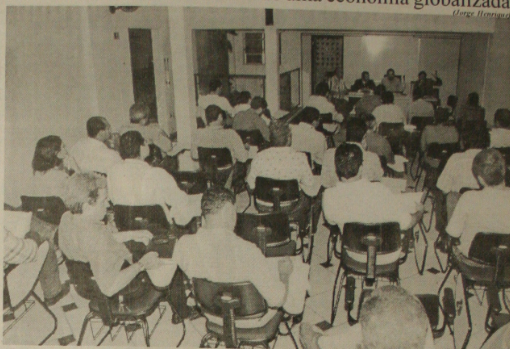
Sinduscon reúne seus associados para discutir com o departamento jurídico como será feita a restituição do PIS

A equipe do centro é formada por quatro oftalmologistas, enfermeira, técnicos de enfermagem, zeladora e secretárias que se revezam em dois turnos (manhã e tarde) de segunda a sexta-feira.