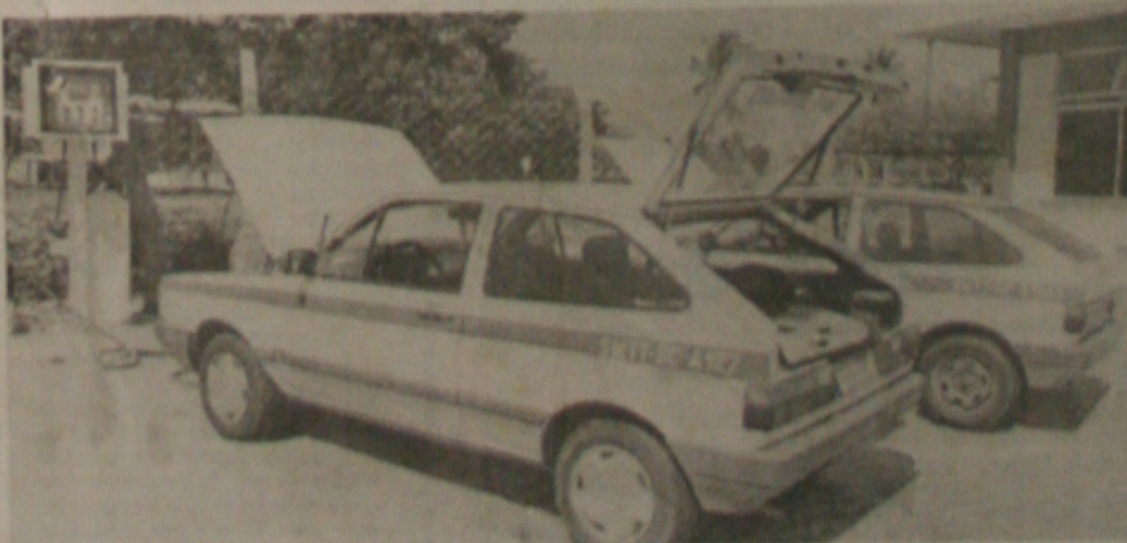
Motoristas particulares e táxis continuam enfrentando transtornos na hora de abastecer os veículos movidos a gás. (Página 2B)