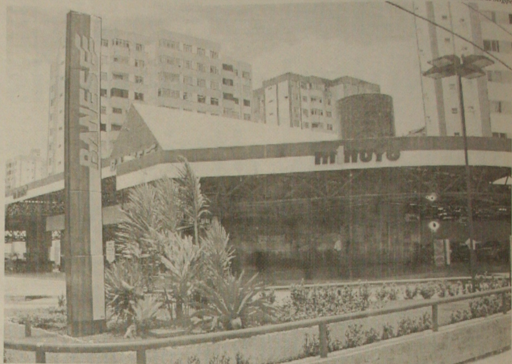
Com o horário de verão o funcionamento dos bancos sofreu alteração por causa de outros centros econômicos