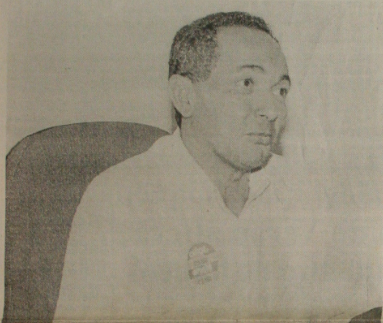
Mota defende que o hospital seja administrado por associação para receber ajuda da população

Mergulhado em dívidas trabalhistas que somam mais de R$ 120 mil o Hospital Nossa Senhora da Boa Hora, em Marum, corre o risco de ser leiloado para pagar indenização de três ex-funcionários, cujas ações encontram-se na Justiça do Trabalho.