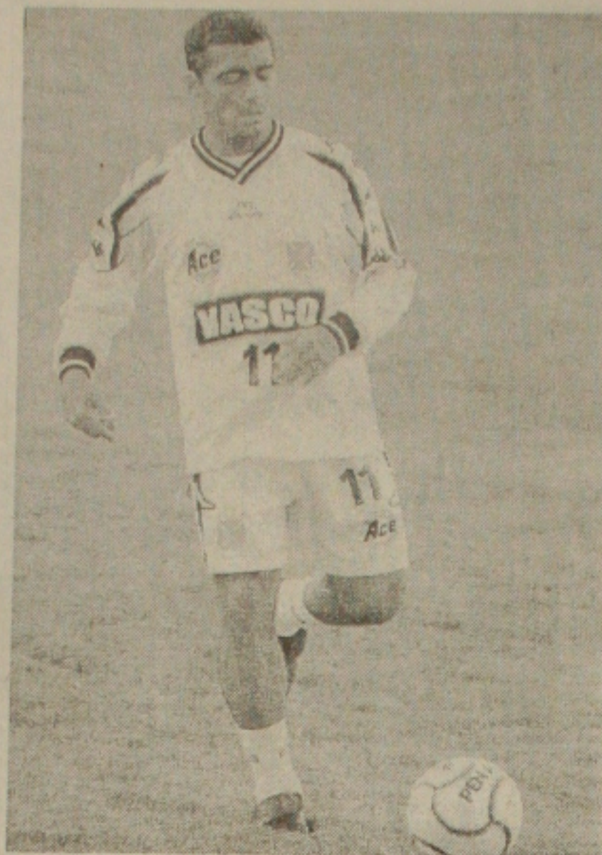
Romário acha que Oswaldo de Oliveira deve ser convocado