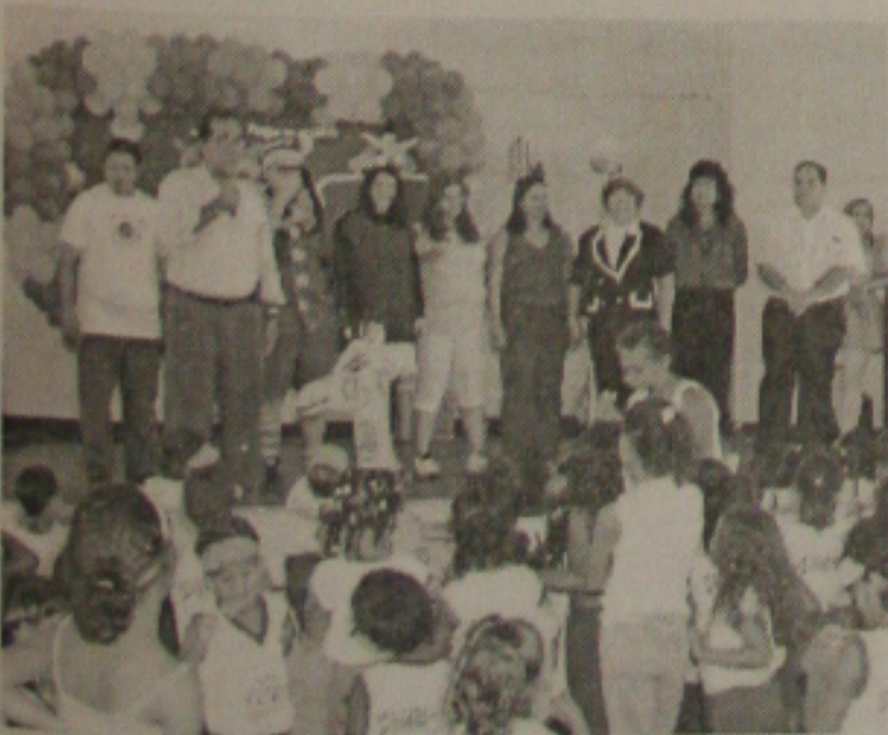
As crianças conheceram o posto de fiscalização estadual