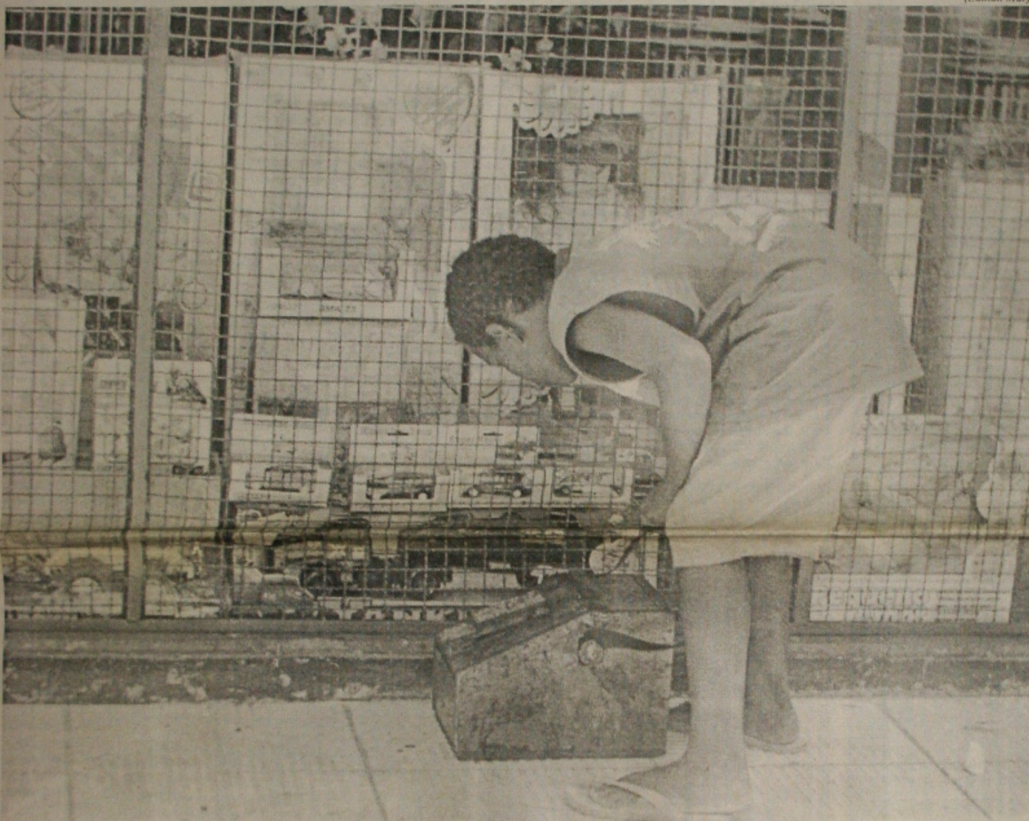
Ontem, enquanto a maioria das lojas de brinquedos do Centro festejavam o aumento nas vendas, o pequeno engraxate admirava o caminhãozinho exposto na vitrine