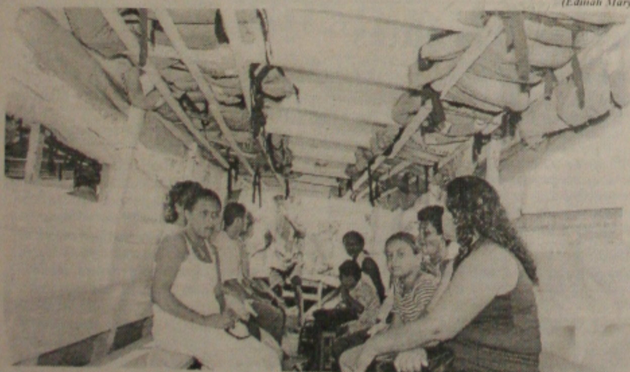
Para garantir a segurança dos passageiros, as to-to-tós foram equipadas com novos coletes salva-vidas

As lojas do Centro comercial de Aracaju e dos shoppings da cidade registraram movimento intenso ontem, por conta de pais que, apressadamente, buscavam de última hora comprar o presente para os filhos. Mas na hora de escolher o presente do Dia da Criança a maioria optou por brinquedos e outros artigos mais baratos. Hoje supermercados e shoppings funcionarão normalmente, apesar do feriado nacional consagrado à Nossa Senhora Aparecida, padroeira do Brasil. (Página 4B)