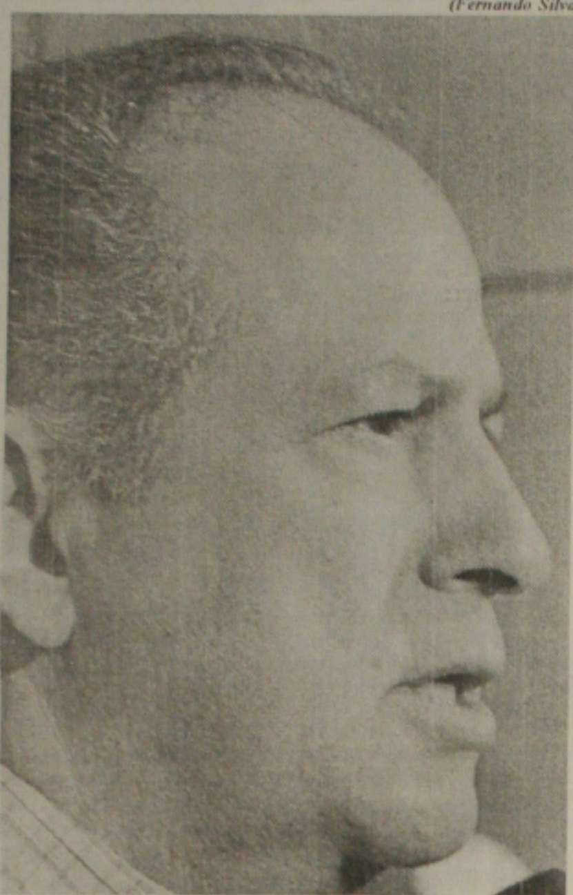
Governador quer ajudar Deda a administrar Aracaju

Todos os índices mostram que temos uma pequena rejeição em Aracaju. O maior exemplo é que nos três municípios que circundam a capital - São Cristóvão, Barra dos Coqueiros e Socorro - ganhamos com 40%. Deus sempre me ajuda e a prova disso é que a nossa coligação elegeu em todo de 55 prefeitos". Ele disse que na próxima segunda-