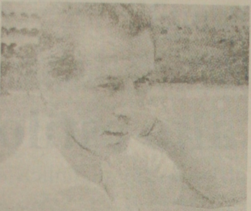
Leão é o novo treinador da seleção

Novo treinador assinou compromisso e já viajou a Recife onde dirige o Sport