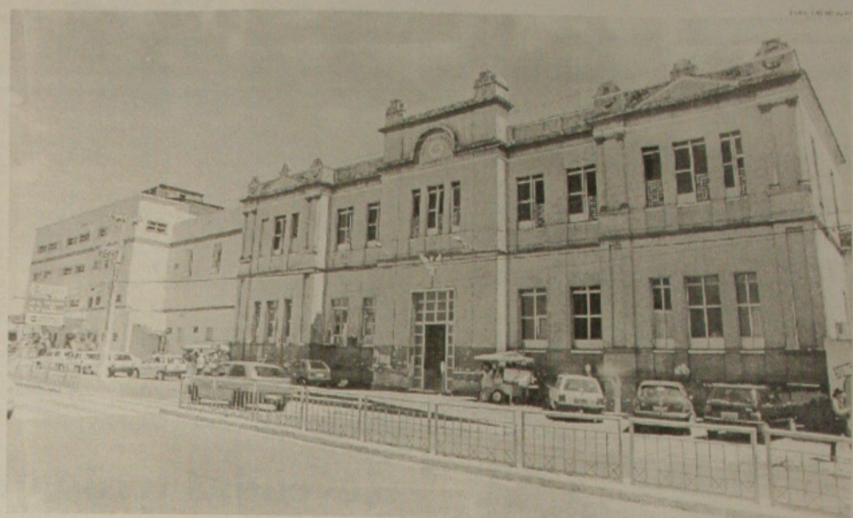
Hospital de Cirurgia, patrimônio dos sergipanos, passa por intervenção para sair de sua crise mais aguda

te, aquela unidade hospitalar chegou ao fundo do poço a ponto de, antes da Secretaria da Saúde ter assumido a sua administração, não existir uma simples e barata seringa. Conforme o economista Edgard Mota, a situação de receita e despesa do hospital é dramática. Para que se tenha uma idéia, somente a despesa com pessoal (são 1.206 funcionários), ultrapassa a receita. E o que fazer? No entender do presidente, o trabalho agora é a busca da prevenção dessa situação, através da mobilização e do apoio de todos os profissionais para que a