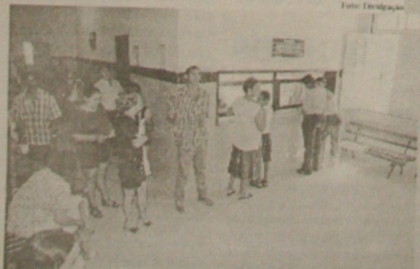
Apesar da grave crise em que se encontra, o Hospital de Cirurgia é muito procurado pela comunidade