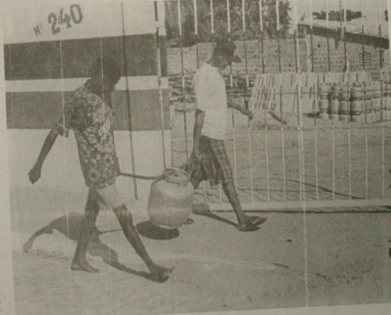
Fiscalização dos postos para proteger a população