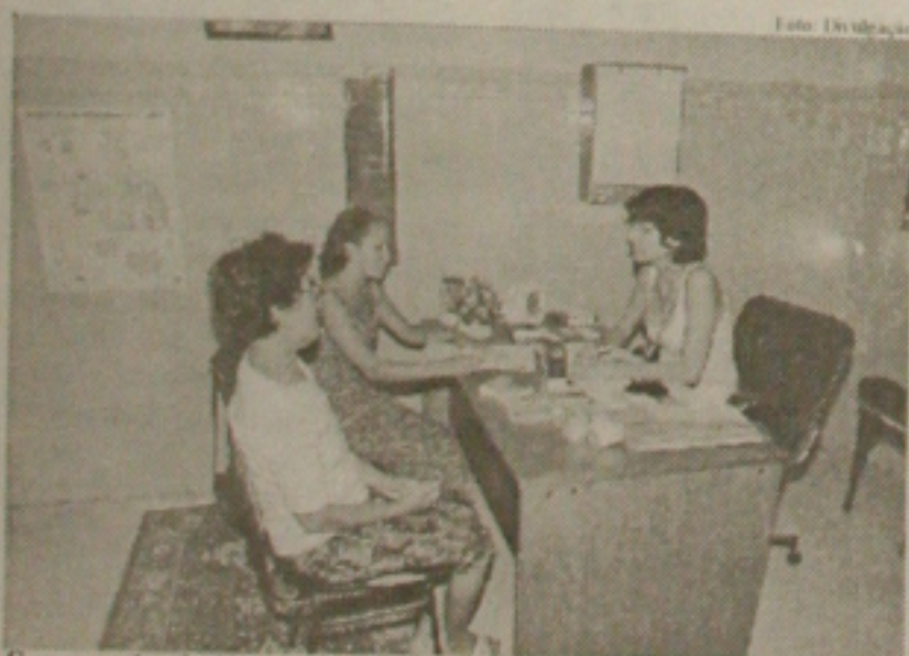
Secretaria de Estado da Saúde entrevistou no Cirurgia para garantir o atendimento médico aos sergipanos

mentos assumidos formalmente para, após a contratação do financiamento junto a CEF, negociar a regularização dessas pendências. É importante ressaltar que o Governo Albano Franco está empenhado em oferecer o apoio e a ajuda necessárias à viabilização do Hospital de Cirurgia", concluiu.