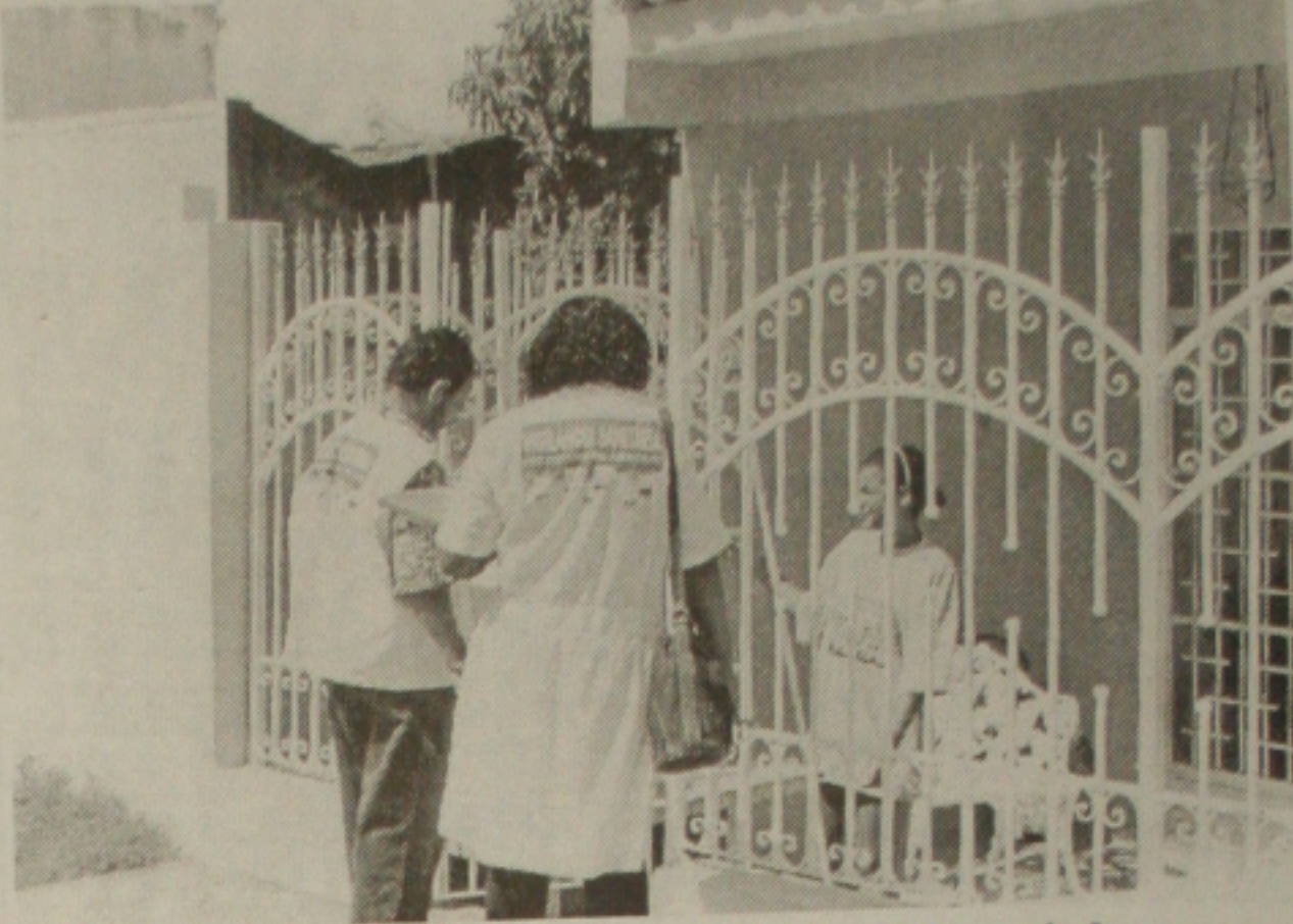
Agentes de Saúde continuam fazendo o trabalho educativo junto à população

Segundo ela, o fumacê também continua circulando pelas ruas das cidades, mas apenas nos municípios e bairros onde o índice de infestação predial é superior a 5%.