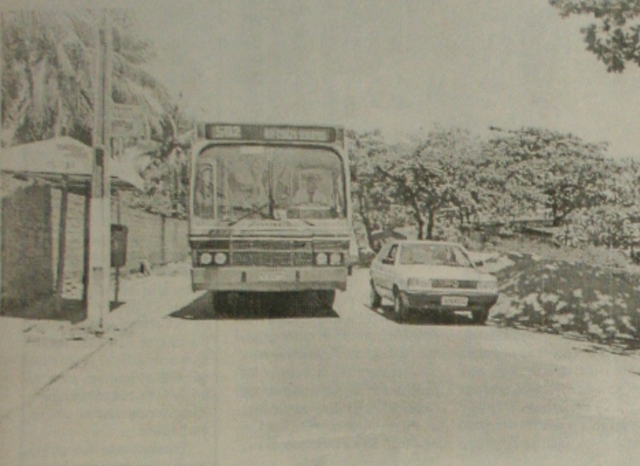
Ombus e carros disputam pista com o retorno das obras da Atalaia