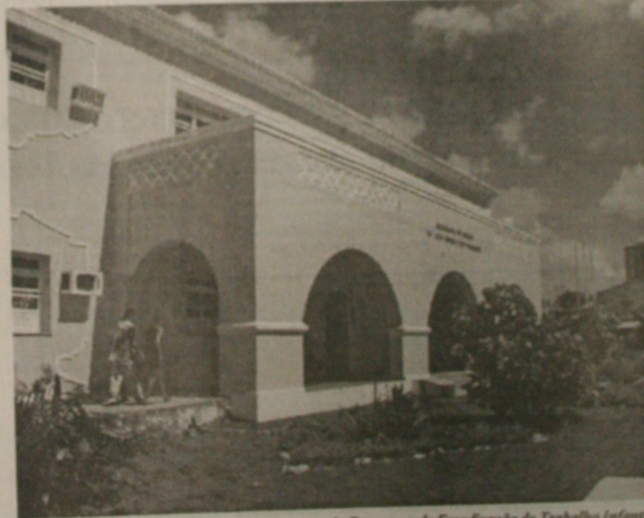
Ação Social começa a treinar a segunda turma do Programa de Erradicação do Trabalho Infantil

Os treinamentos estão sendo organizados no Albergue da Juventude, que fica localizado na Avenida Paulo Barreto de Menezes, número 982.