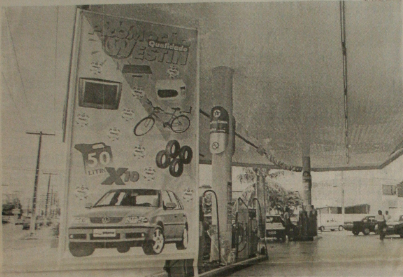
Empresários recorrem a sorteios como forma de manter o mesmo índice de vendas nesse período de crise