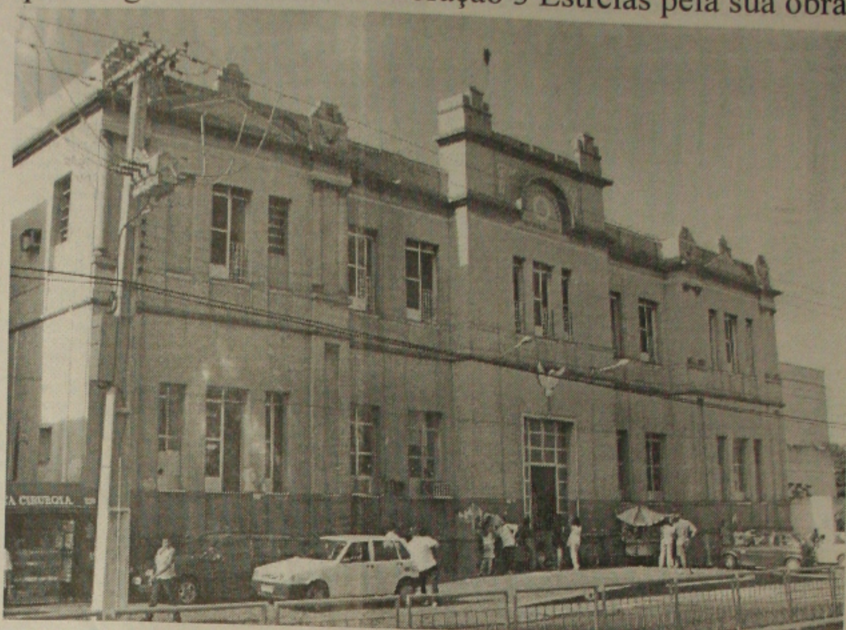
O Hospital Cirurgia aos poucos começa a sair da crise, com o pagamento em atraso dos funcionários

A Polícia Fazendária ainda desempenha um papel importante para Sergipe na medida em que possibilita a fiscalização tributária e evita a evasão de dinheiro, através da sonegação de impostos.