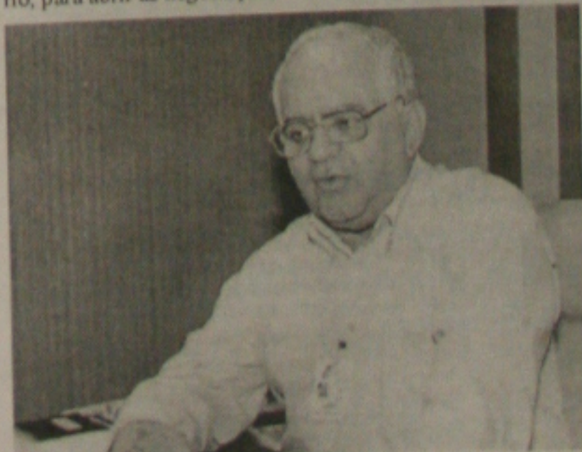
Araújo diz que as pessoas podem negociar débitos

Ele disse que o ânimo do trabalhador em saldar suas dívidas é grande. Tanto os bancos, financeiras e o comércio facilitam as negociações. Até porque após cinco anos as pessoas ficam livres automaticamente dos seus nomes no SPC. No momento, em Aracaju, a inadimplência chega a 9%, considerada alta pelo comércio, mas que já chegou a 16%.