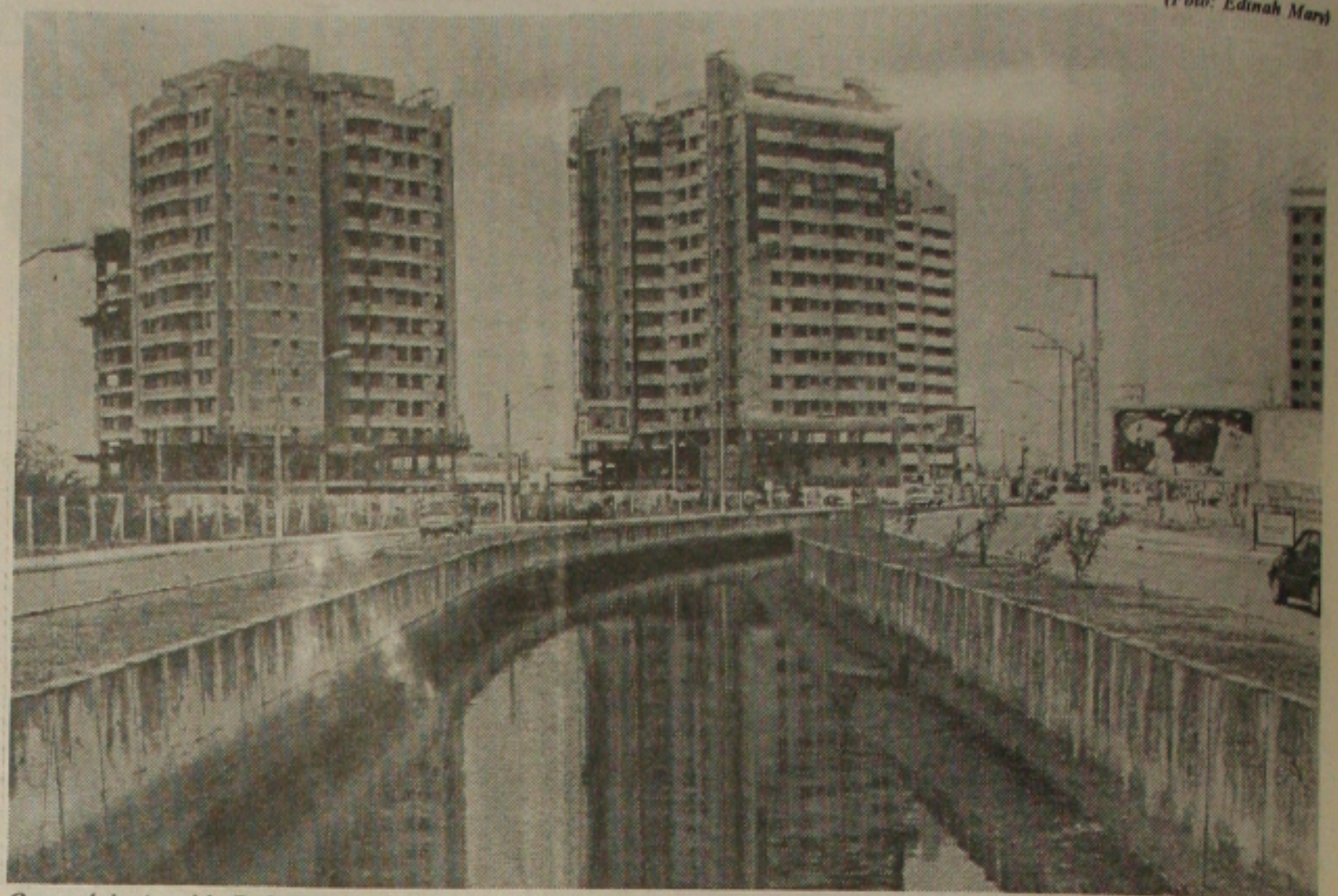
O canal da Avenida Pedro Valadares, no Jardins, tem sido motivo de reclamação por causa de acidentes