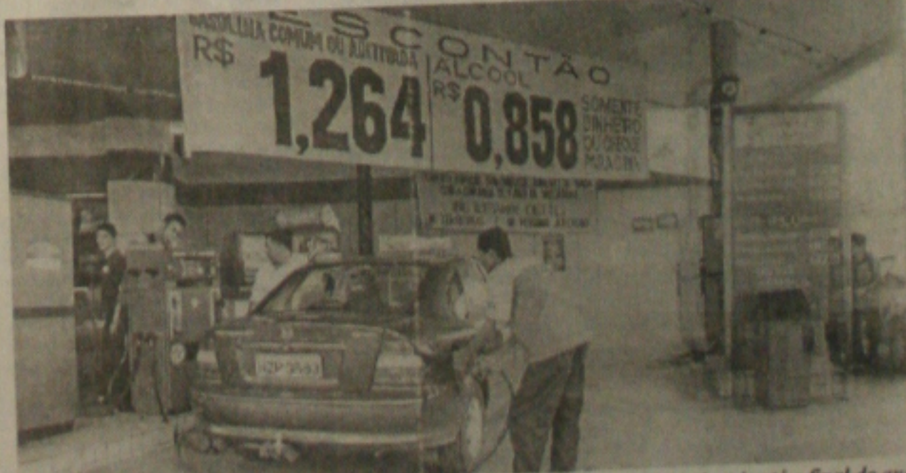
O governo descarta, mas um novo reajuste nos preços dos combustíveis pode sair até o final do ano