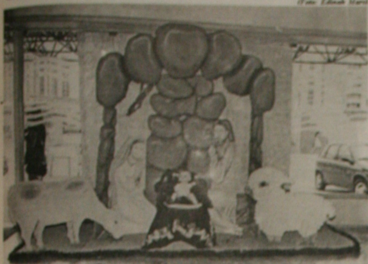
As lojas começam a preparar a decoração do Natal com vistas a atrair o cliente com o 13º salário

Comerciantes começam a decorar os estabelecimentos para despertar a atenção dos consumidores