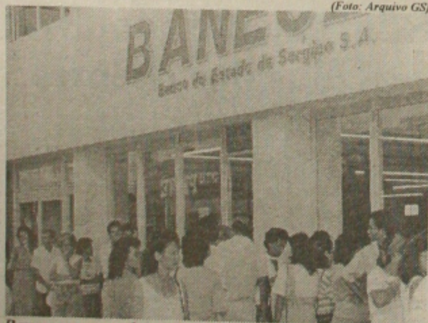
Banese procurando servir a comunidade