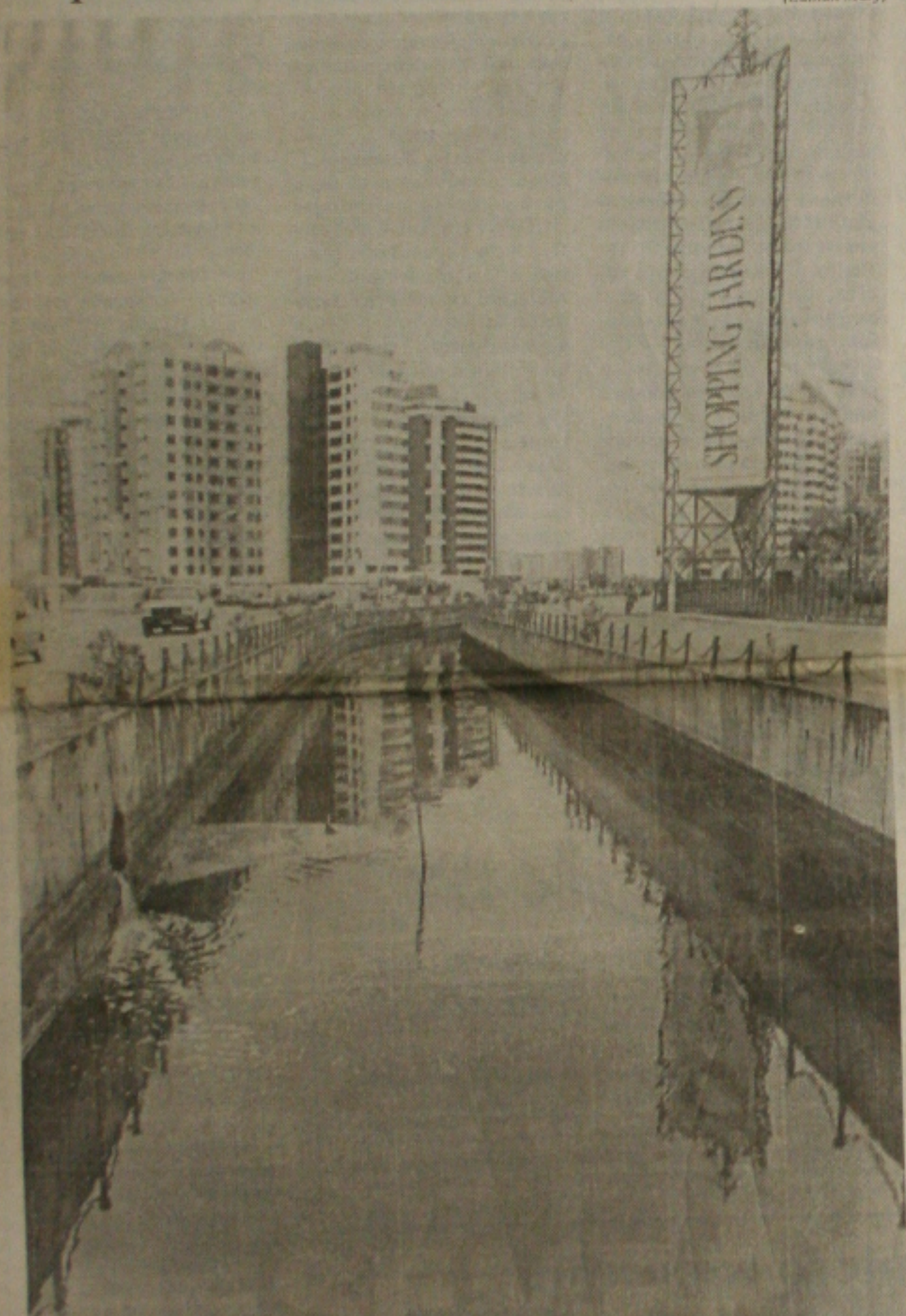
Muitos carros vêm caindo no canal e os motoristas reclamam da falta de muretas de proteção