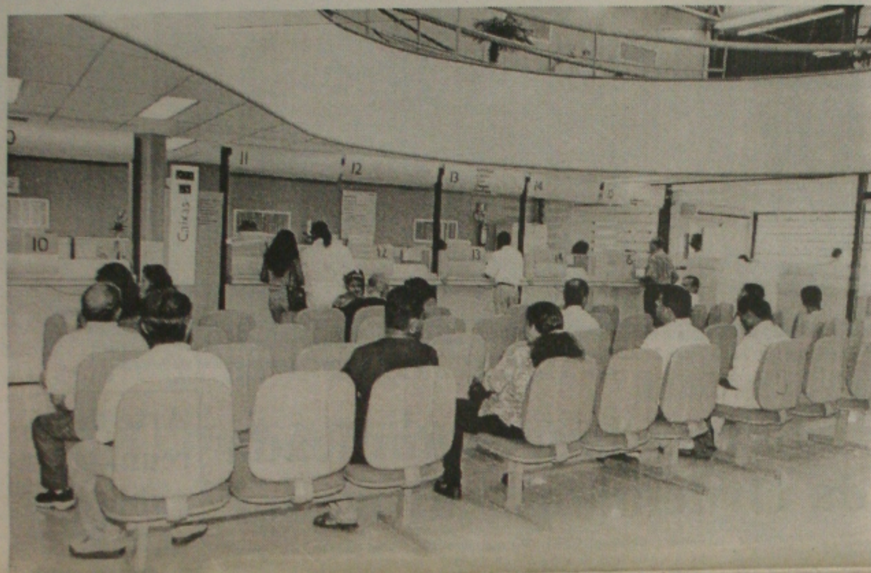
O Plano de Demissão Voluntária da Caixa Econômica Federal tem sido motivo de críticas de sindicalista