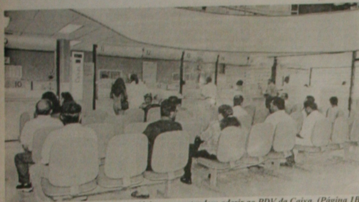
Acaba hoje o prazo para os economiários que pretendem aderir ao PDV da Caixa. (Página 1B)