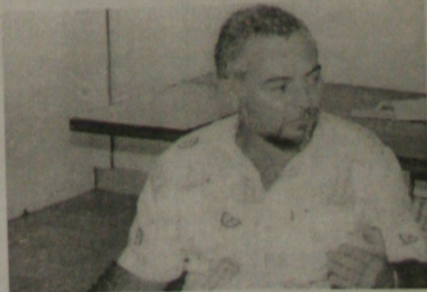
Lima diz que não seria viável um reajuste nesse momento