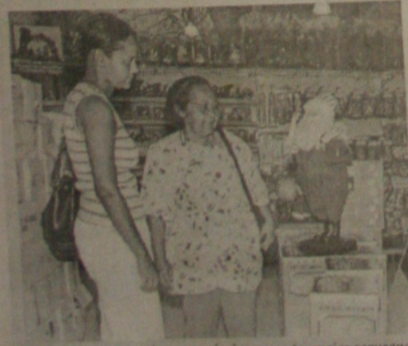
Com o SPC integrado, o comércio espera ter maior segurança

Os lojistas sergipanos apostam na implantação do SPC Brasil, que interligará todos os Sistemas de Proteção ao Crédito do País, para reduzir os índices de inadimplência no comércio. Para a Câmara de Dirigentes Lojistas (CDL) de Aracaju, somente com a integração de todos os bancos de dados dos SPCs os comerciantes terão informações mais seguras e detalhadas sobre o cliente, aumentando assim a garantia da concessão do crédito. (Página 4A)