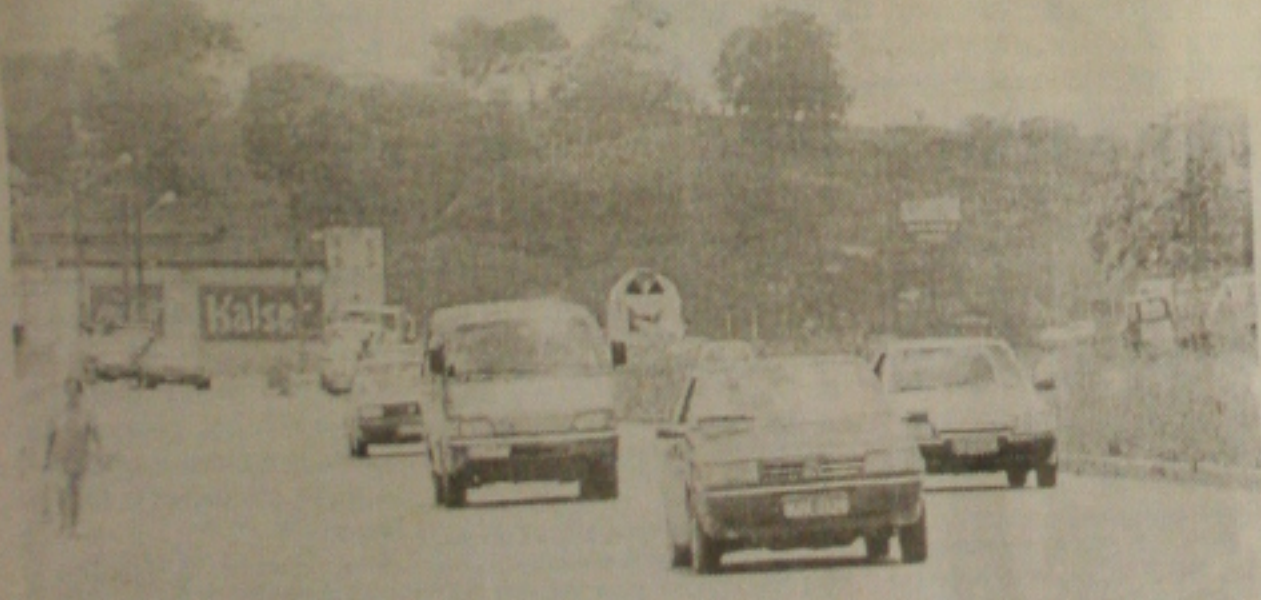
Na BR 235, que liga Aracaju ao Agreste, o fluxo de veículos começou a aumentar ontem à tarde