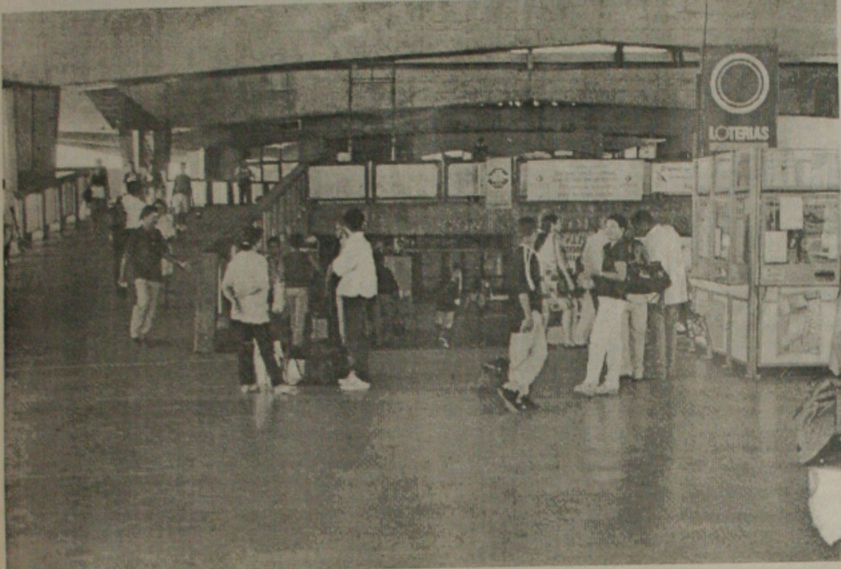
Às vésperas do feriado de Finados, o movimento no Terminal Rodoviário Rollemberg Leite era bem reduzido