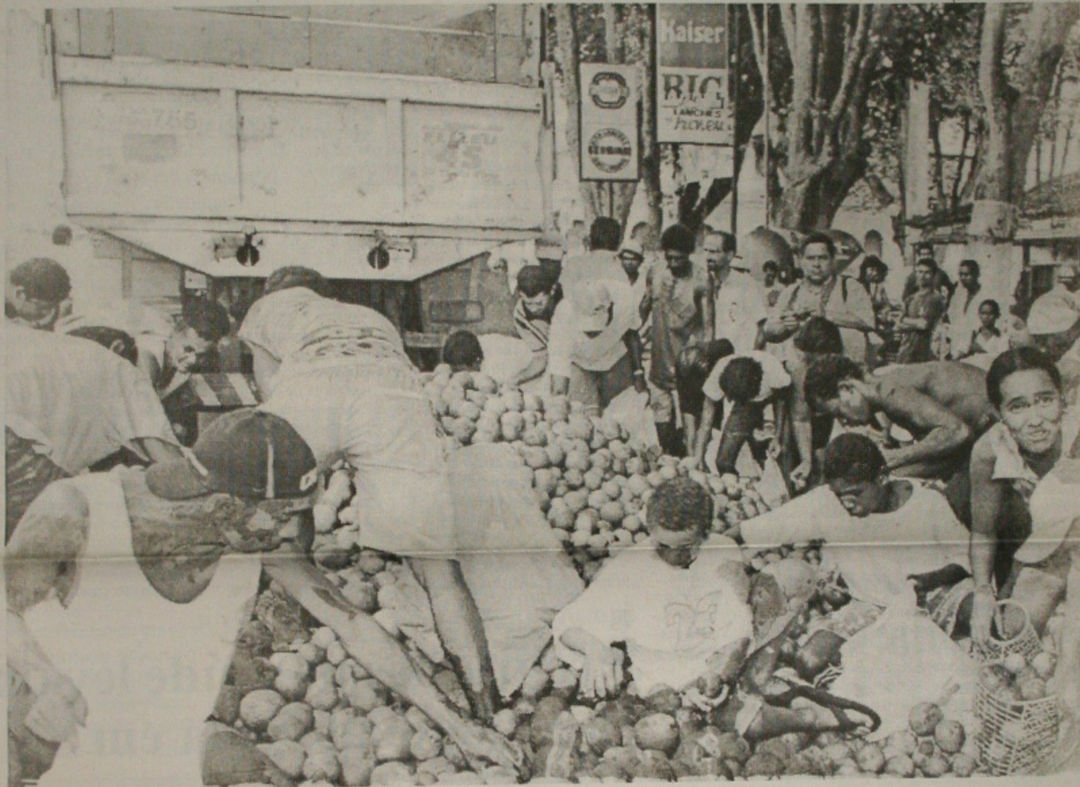
Citricultores da Região Centro-Sul distribuíram ontem várias toneladas de laranja com a comunidade estanciana

Fábricas - São três estabelecimentos comerciais que fecharam suas portas. Frutene, Frutos Tropicais e a Tropicifrutos. Há mais de três anos, que algumas delas não funcionam e a Frutos Tropicais tem duas semanas que encerraram suas atividades. Os setores geraram até dois mil empregos diretos na região. Ainda tem a fábrica Midosucos que ab-