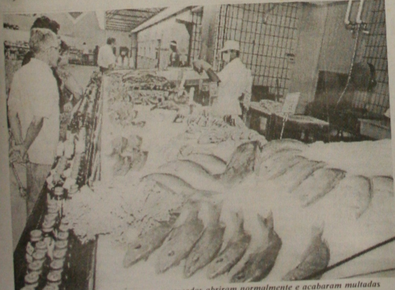
No feriado, as grandes redes de supermercados abrem normalmente e acabaram multadas

Trabalhadores rurais e citricultores do centro-sul do Estado realizaram ontem ato público em frente à agência do BNB, na Rua 24 de Outubro, em Estância, para chamar a atenção das autoridades sobre o agravamento da crise na citricultura do Estado, provocado pelo fechamento das indústrias de beneficiamento de suco da região. Ao final do protesto, produtores rurais distribuíram gratuitamente toneladas de laranja que estavam em dois caminhões. (Página 1B)