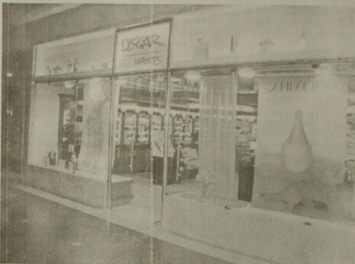
A nova loja da Lyscar Imports no Shopping Jardins, toda no cristal transparentíssimo, depois da big reforma.

A City Shoes abre suas portas na Galeria Monique, localizada na Rua Ananias Azevedo, Praia 13 de Julho, e promete receber suas clientes com novidades quentíssimas para o verão!