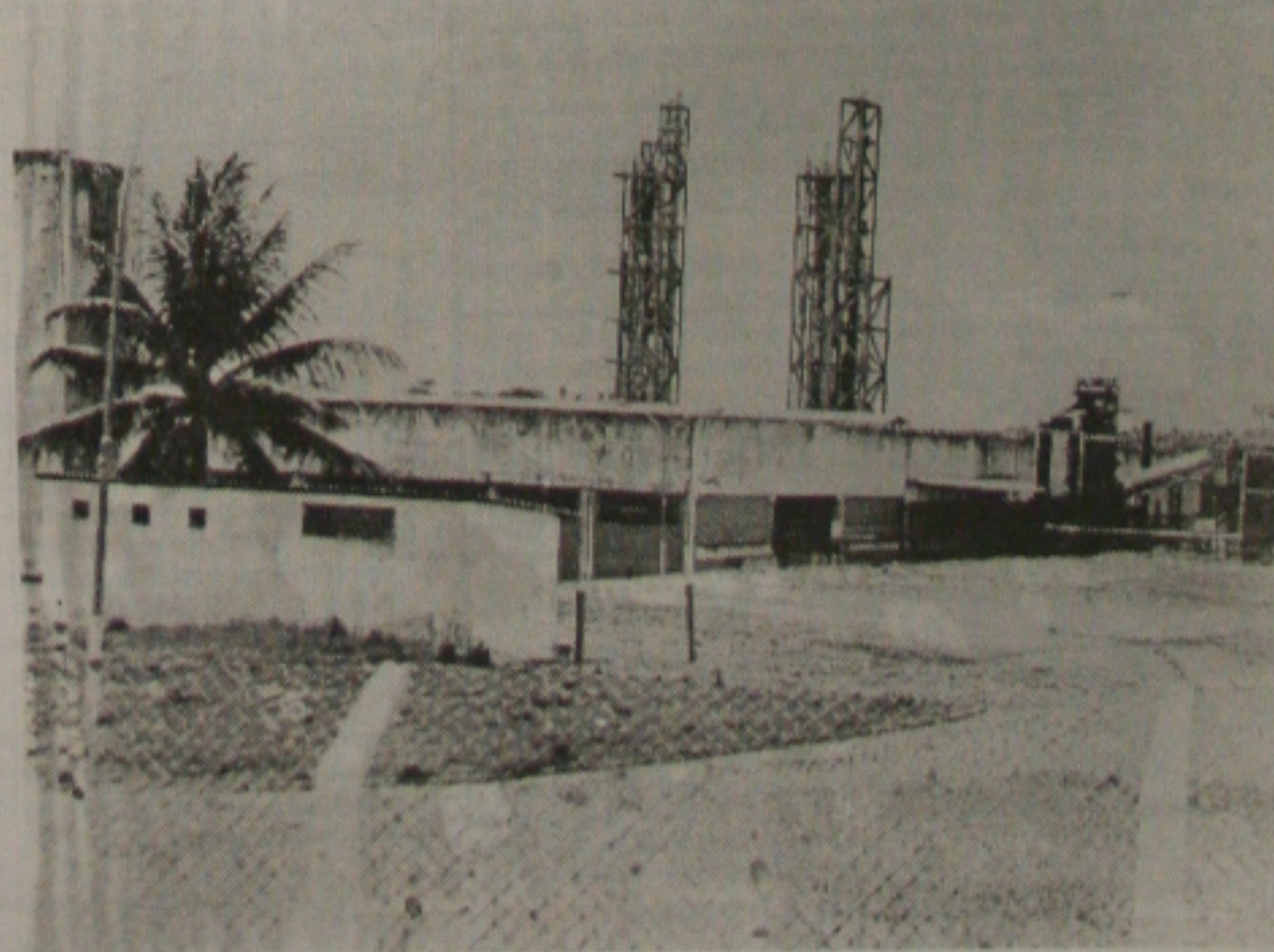
A Frutos Tropicais, uma das três indústrias que fecharam suas portas por conta da crise