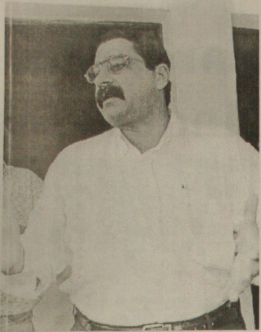
Góes diz que o Pró-Sertão participa de vários programas