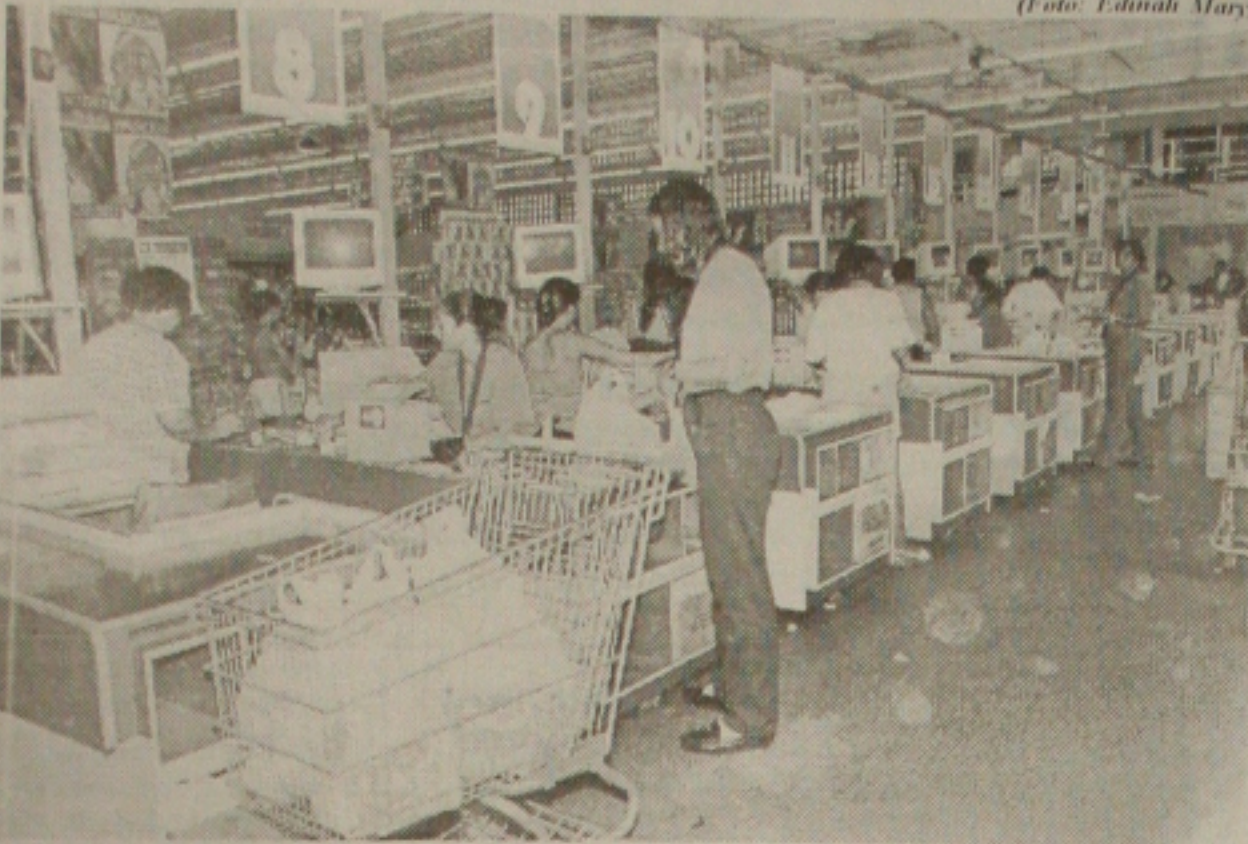
Apesar da proibição pela Delegacia do Trabalho, os supermercados funcionaram no feriado de anteontem

Carros são saqueados por integrantes do MST que estão acampados no município de Poço Redondo