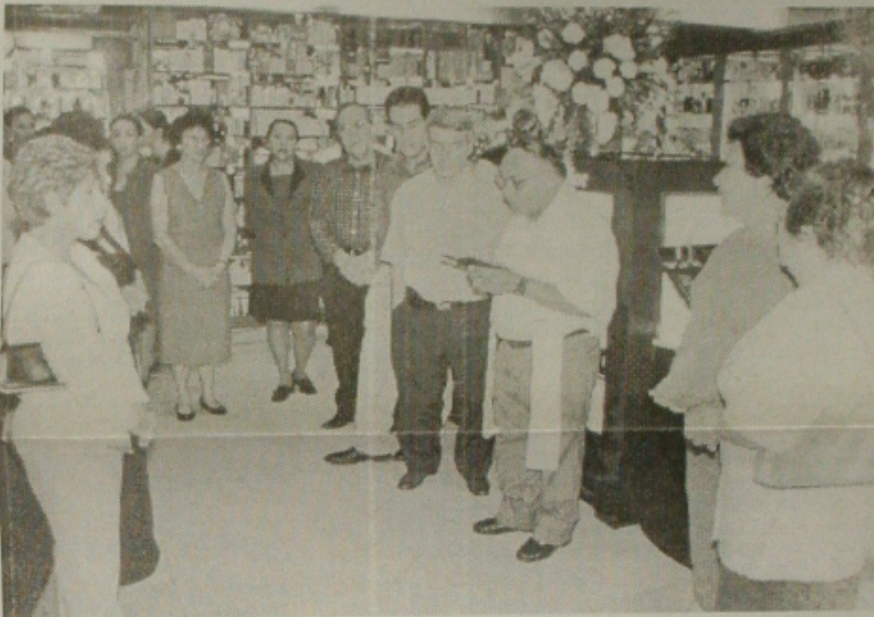
Bênção das instalações da Lyscar Imports, no dia da inauguração. (Foto: Lúcio Telles).