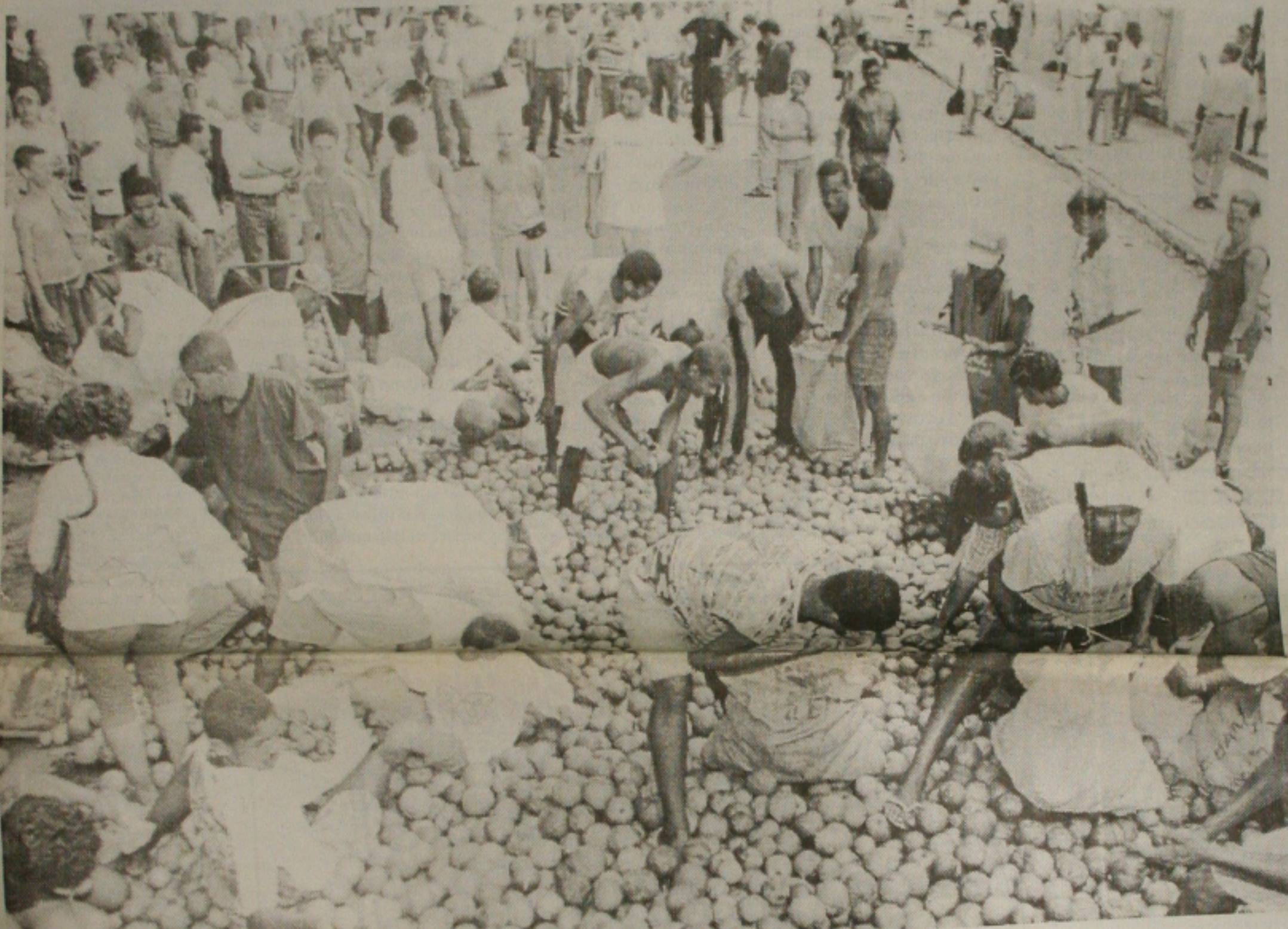
Ao final da manifestação, toneladas de laranja foram distribuídas com a população pelos citricultores (Edinah Mary)

Cerca de 500 trabalhadores rurais bloquearam ontem a rodovia estadual que dá acesso a Poço Redondo, um dos municípios mais castigados pela seca na região. Eles tentaram saquear carros de passeio e caminhões que trafegavam pela rodovia, mas o efetivo policial do município, embora pequeno, foi mobilizado para fazer com que os motoristas procurassem uma rota alternativa, a fim de evitar um conflito mais grave. Até a tarde de ontem, a direção regional do Movimento dos Sem-Terra (MST), que comandou a manifestação, não havia se pronunciado. A estiagem, o desemprego, a extinção das frentes de trabalho e da ajuda do Exército, que garantia o abastecimento de água no Sertão, agravaram o quadro de miséria na região, onde já não há mais alimentação para o consumo humano nem animal. (Página 4B)