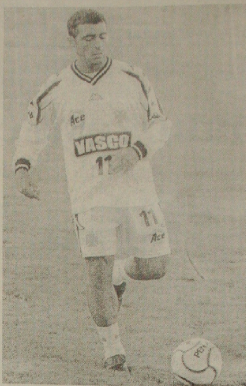
Romário certo de que recuperado volta a seleção

Romário ainda não se recuperou da contusão na coxa esquerda, que provocou o seu corte. A previsão dos médicos do clube carioca é que ele retorne ao time em 10 dias. "Pretendo dar um título ao Vasco e, depois, voltar a seleção", completou o atacante.