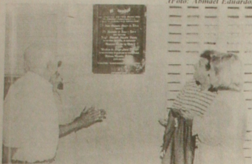
Gama entrega mais uma escola reformada