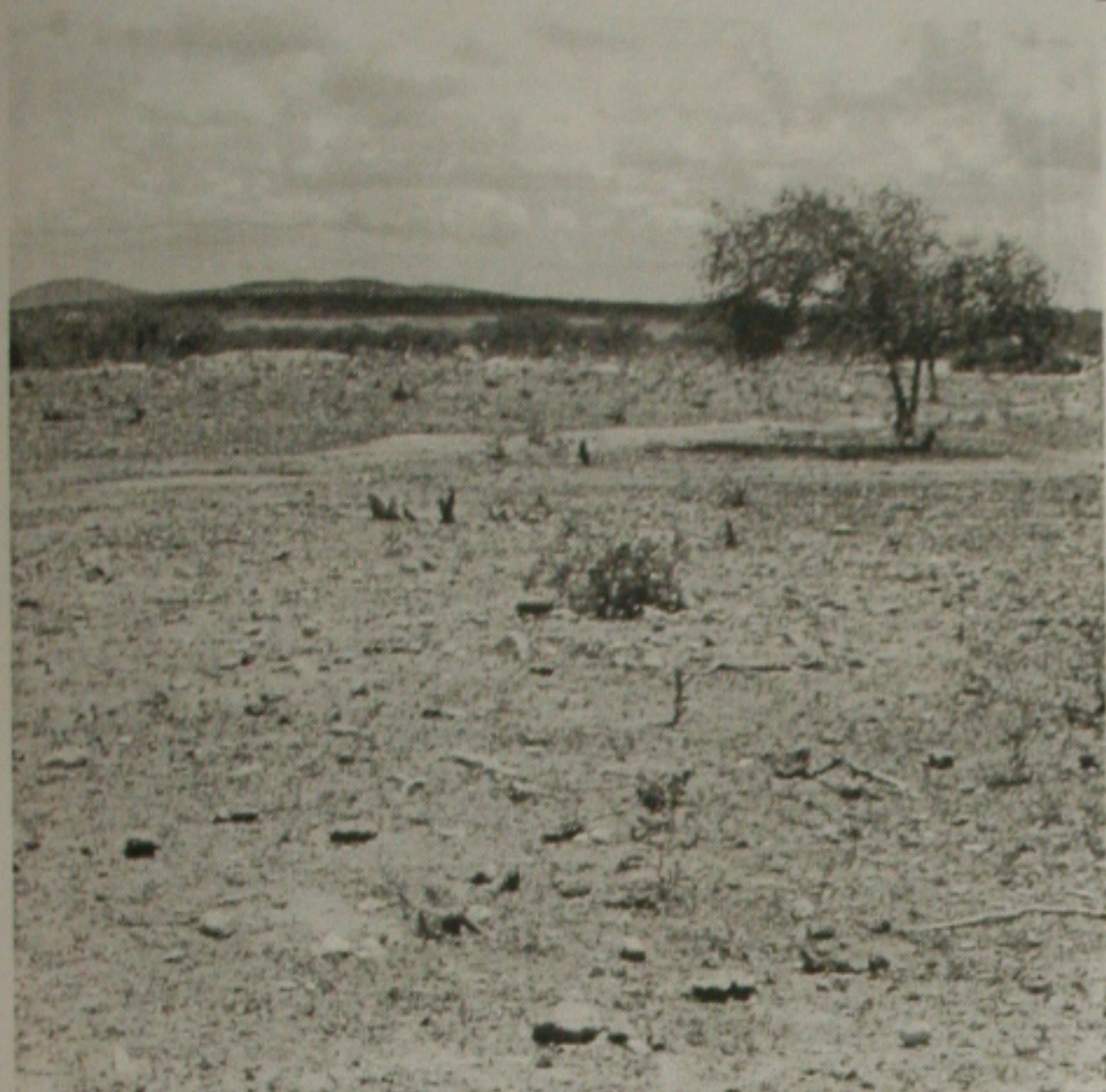
O Governo do Estado tem investido em ações se prevenindo contra os efeitos da seca em Sergipe

Pesquisa constata aumento de melhoria na população que vive nos povoados sergipanos