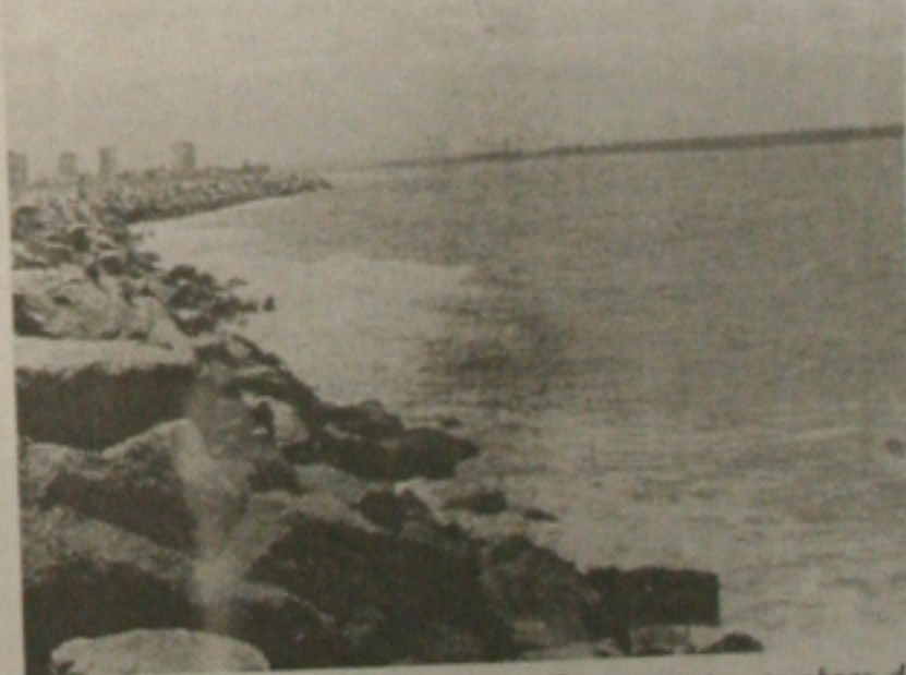
Até o final de dezembro também ficam prontas as obras do novo molhe da Coroa do Meio. (Página 3B)

As obras de restauração do lado sergipano da Linha Verde, que liga Aracaju a Salvador (BA), devem ser finalmente inauguradas no dia 20 de dezembro. O cronograma da obra acabou sofrendo vários atrasos, em virtude das chuvas que caíram este ano sobre o Estado. Ao todo são 39 quilômetros de pista ligando a BR 101 à parte baiana da Linha Verde. (Página 4B)