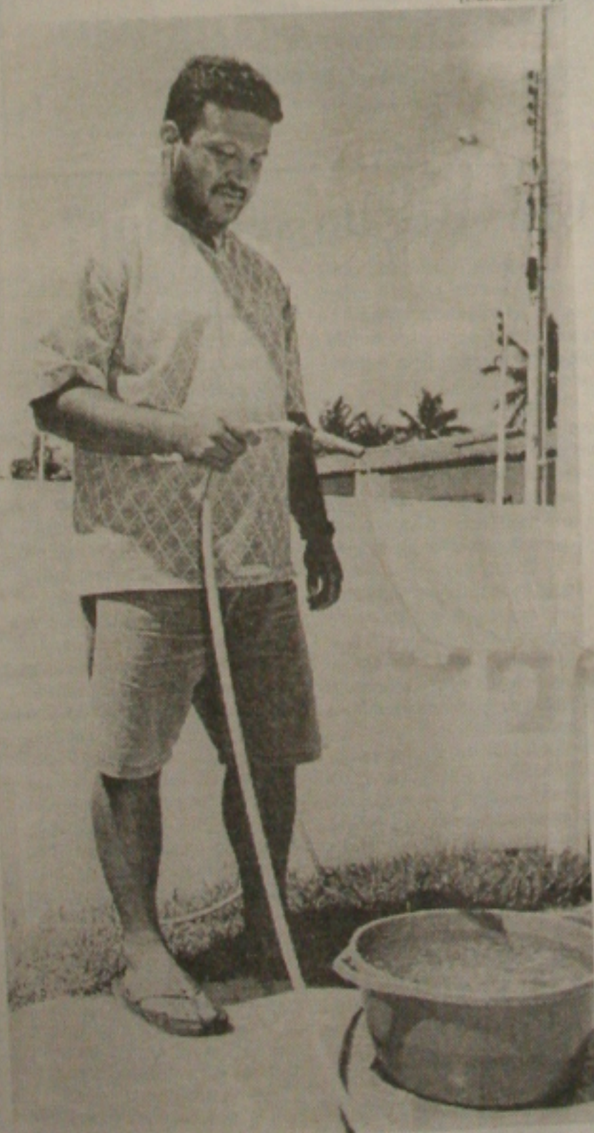
A falta de água virou uma rotina para os moradores do Residencial Vilas do Mar, no Bairro Aeroporto (Página 2B)

Até domingo (1º), a Secretaria Estadual de Saúde, através do Departamento de Doenças Sexualmente Transmissíveis (DST), deve distribuir cerca de 10 mil camisinhas entre a população. A distribuição faz parte da campanha anual contra a Aids, iniciada na terça-feira (28) e do Dia Mundial de Combate à doença, que transcorre amanhã (1º). Este ano a campanha tem como tema central "Não leve Aids para casa, use camisinha". Pela primeira vez em 15 anos, não há campanha em nível nacional devido ao corte de verbas determinado pelo Ministério do Planejamento. A redução dos recursos ameaça inclusive interromper a aquisição dos medicamentos que integram os coquetéis utilizados no tratamento dos soropositivos. (Página 1B)