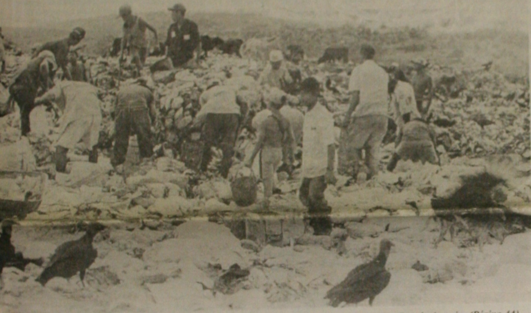
São Cristóvão continua rejeitando a possibilidade de ser o futuro depósito do lixo produzido na Grande Aracaju. (Página 4A)