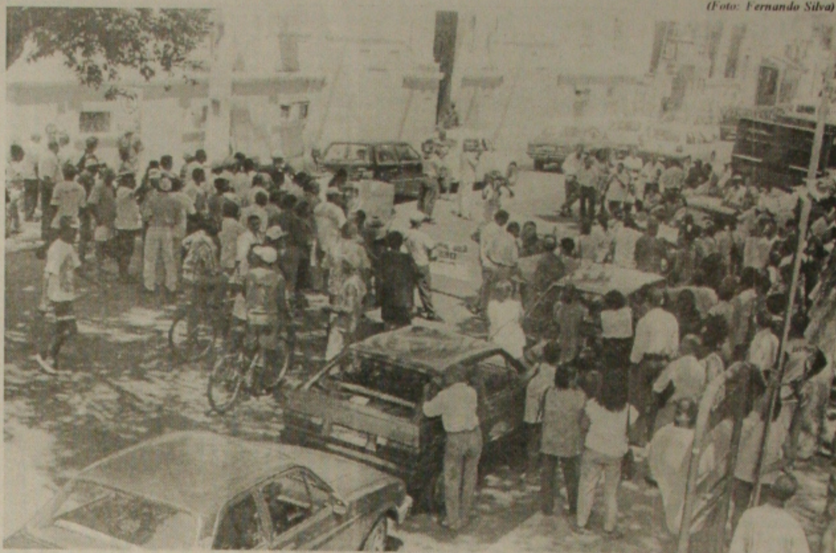
Os servidores do Governo começaram a ser recadastrados pela Secretaria de Estado da Administração

“O desgaste da estrada se deu em virtude do aumento no fluxo de carros”