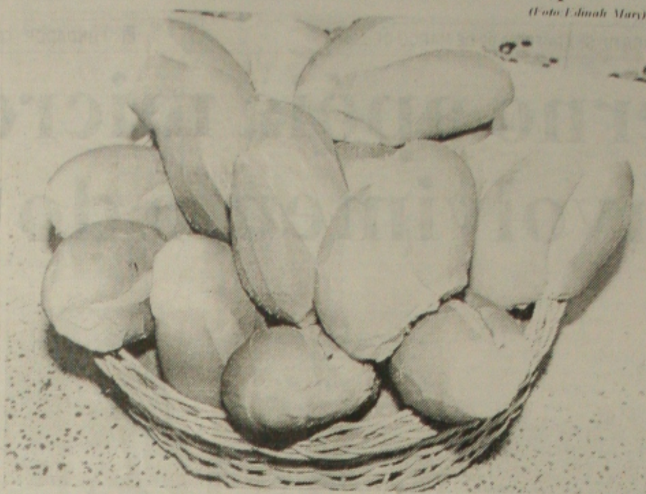
Consumidores aracajuano foram surpreendidos ontem com o reajuste no preço do pãozinho de 50g