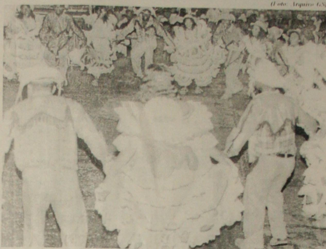
Os festejos juninos de Sergipe começam a ganhar dimensão nacional

Em reunião com o prefeito Marcelo Déda, representantes da empresa concordaram em fazer o aditivo ao contrato requerido pela secretária de Planejamento e estão esperando apenas que o prefeito estabeleça uma data para a sua assinatura. Na Secretaria de Planejamento, estão sendo feitos estudos para a contratação da consultoria de elaboração do projeto de restauração e a assinatura do convênio com a UFS.