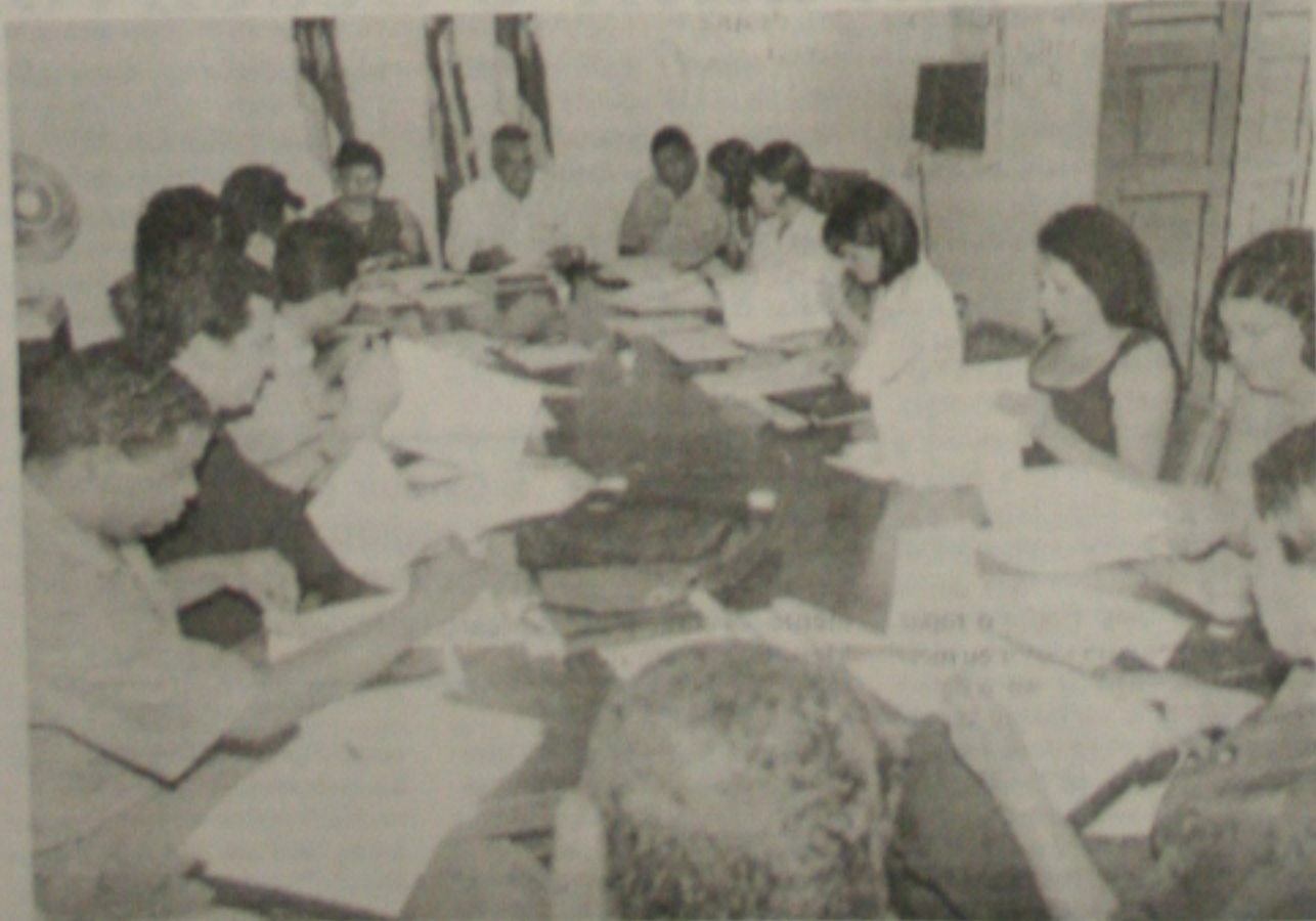
Secretários municipais e representantes de órgãos se reuniram ontem para discutir Orçamento