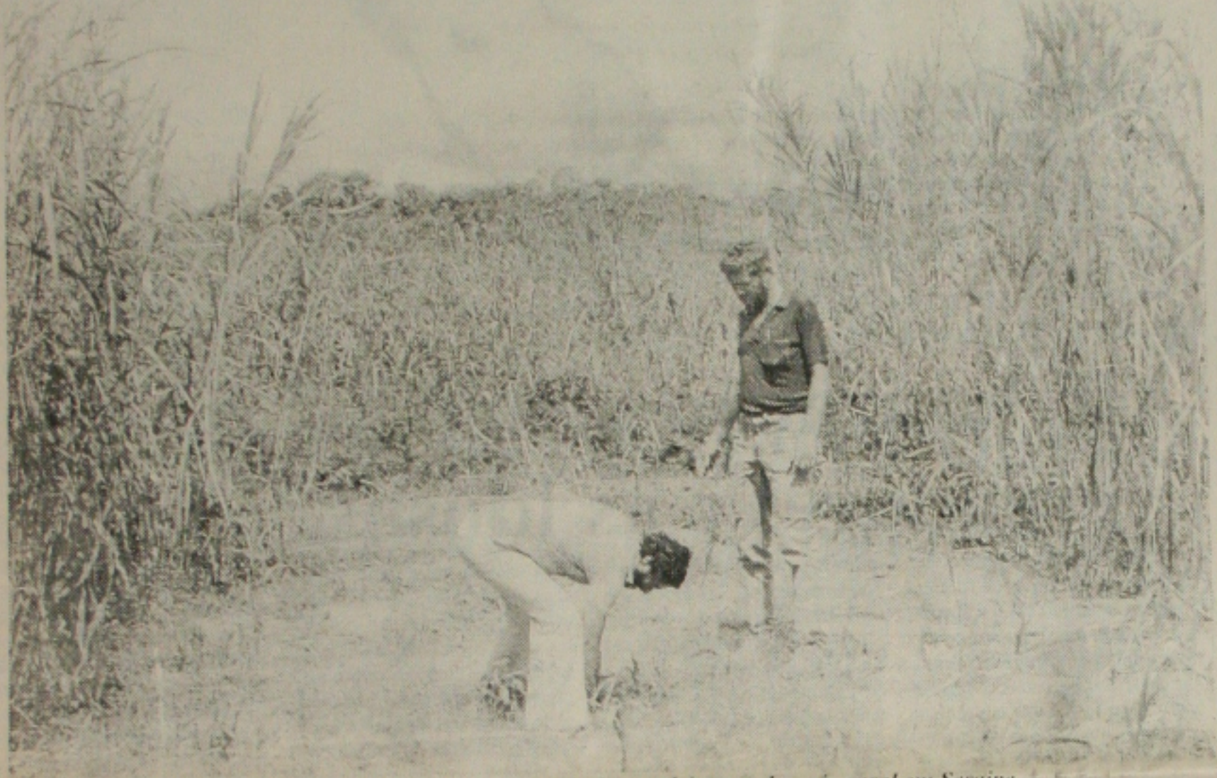
Governo do Estado apóia o microcrédito para o processo de desenvolvimento do meio rural em Sergipe