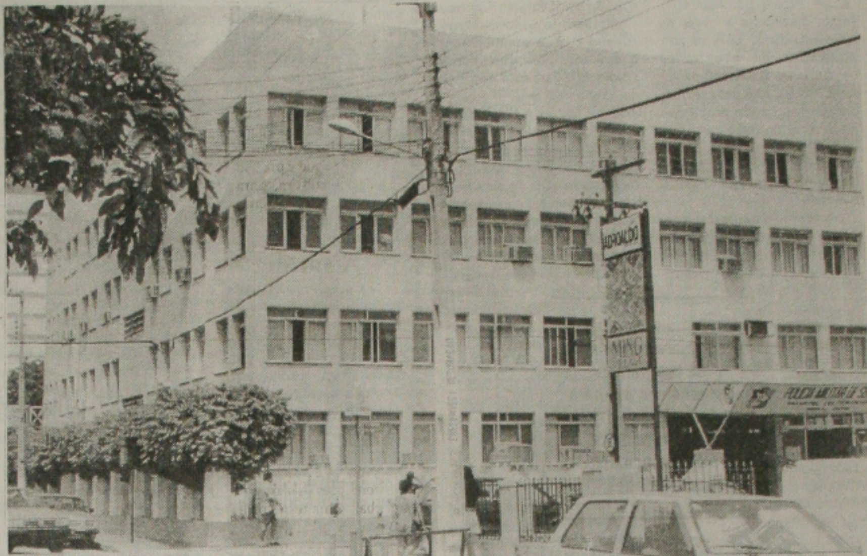
Os 3 PMs suspeitos de estarem envolvidos em assaltos, ficaram presos em uma sala do Quartel da PM, longe da imprensa

Prisão - Apesar do comando ter tentado de todas as formas evitar o escândalo, chegando ao ponto de as-