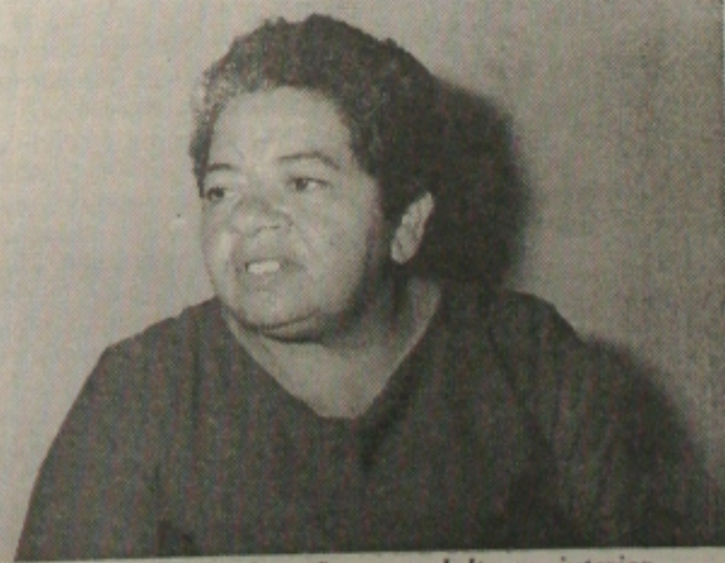
A secretária Ilena: educação para adultos no interior

O deputado estadual José Carlos Machado (PFL) defende uma apuração rigorosa das denúncias feitas pelo senador Antônio Carlos Magalhães (PFL-BA) contra membros do governo federal. Machado não acredita que seu correligionário tenha problemas em comprovar as denúncias. (Página 3-A)