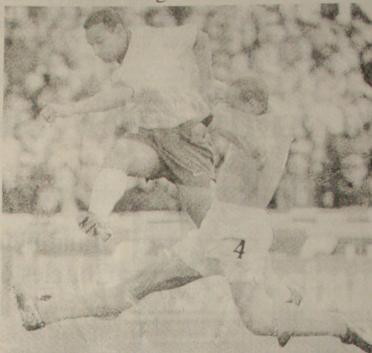
Emerson viajou ontem e vai jogar amanhã

Ronaldinho, que espera uma definição sobre seu futuro, garantiu estar bem fisicamente. Ele retorna à seleção depois do fiasco na Olimpíada de Sydney. "Venho treinando no campo do Bangui, devo me apresentar em julho ao Paris Saint-Germain e, no primeiro semestre, atuar por um clube brasileiro".