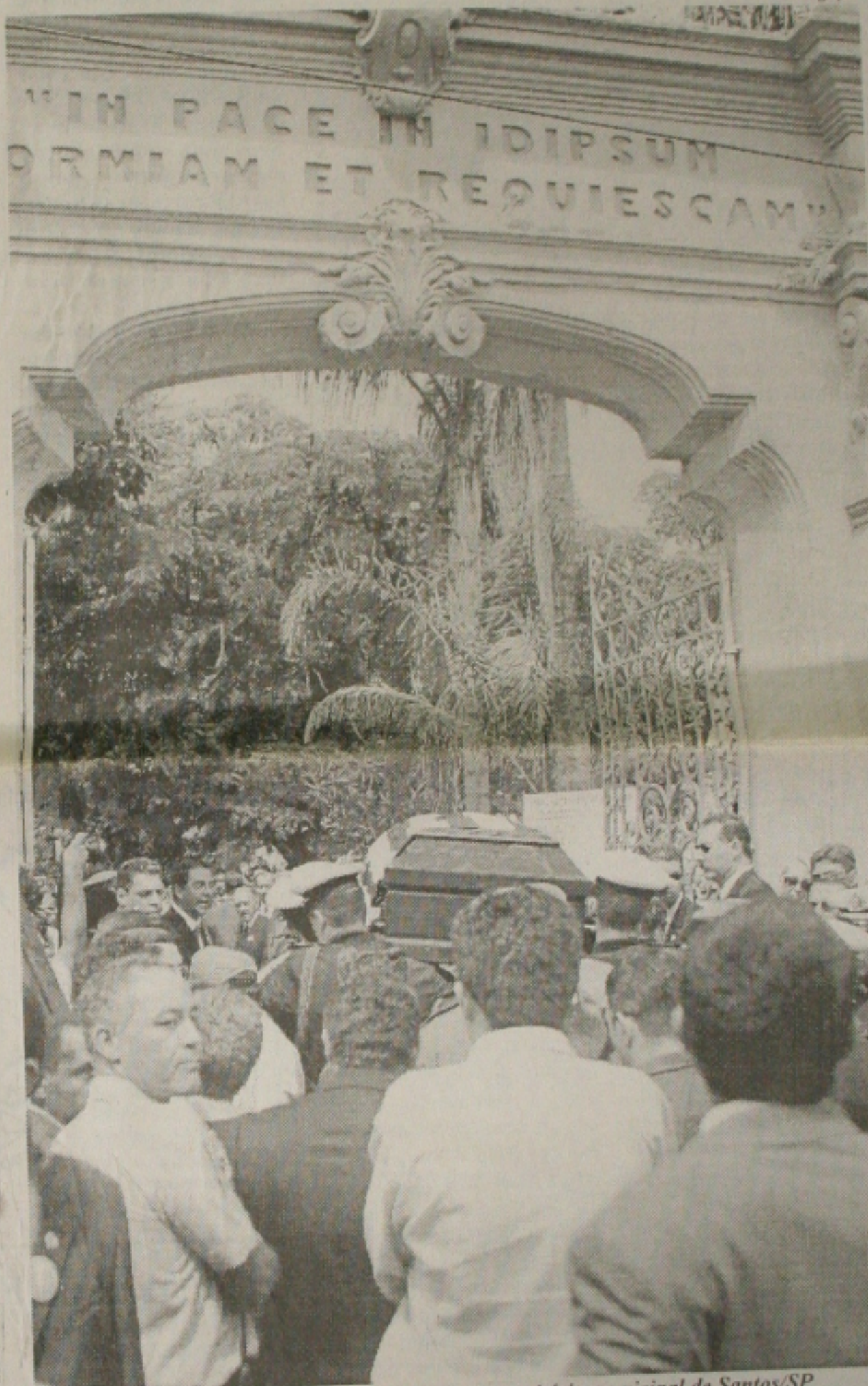
O caixão com o corpo de Mário Covas chega ao cemitério municipal de Santos/SP

dente homenageou o amigo durante dois minutos. "Pensei que não fosse aguentar", admitiu. A morte do governador paulista repercutiu em todo o mundo. A morte de Covas não apenas deixou o PSDB desorientado por perder um de seus maiores líderes como intensificou o debate sobre as eleições de 2002. (Página 8-A)