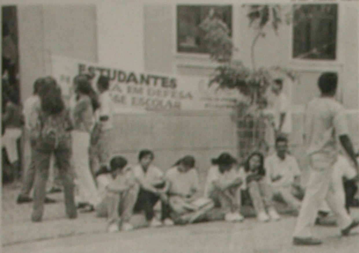
Estudantes vão à Câmara para pedir aos vereadores que o passe escolar volte para o município

Comissão defende que a venda dos bilhetes retorne para o controle da prefeitura