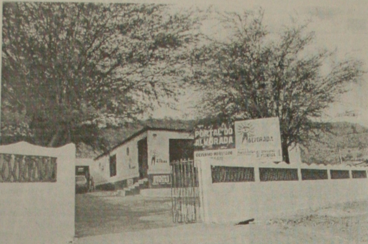
Portal do Alvorada chega a Porto da Folha para atender dezenas de famílias carentes

Sessenta mil pessoas estão desempregadas com desativação das usinas de beneficiamento