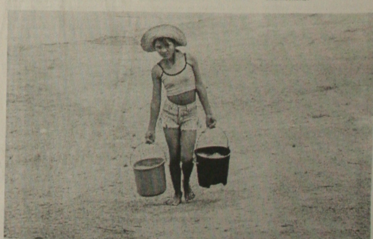
Atividade braçal começa cedo entre as meninas