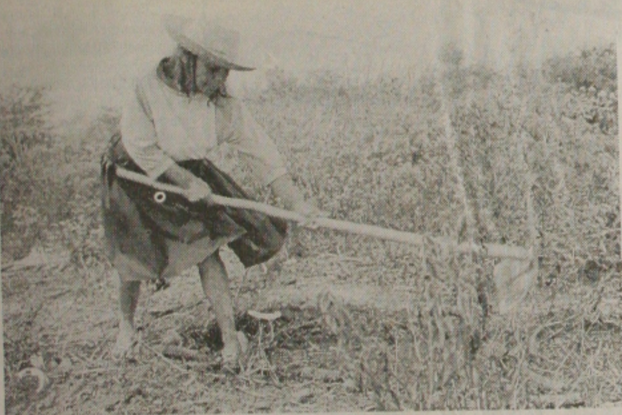
Josefina prepara a terra para o plantio: rotina há 40 anos. Ela também cuida da casa