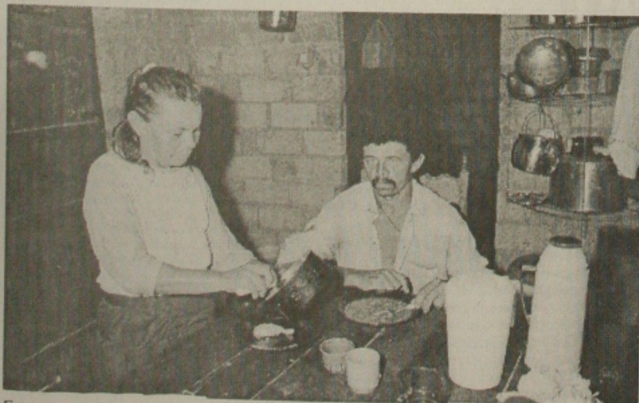
Em casa, servir ao marido é algo "natural" entre agricultoras