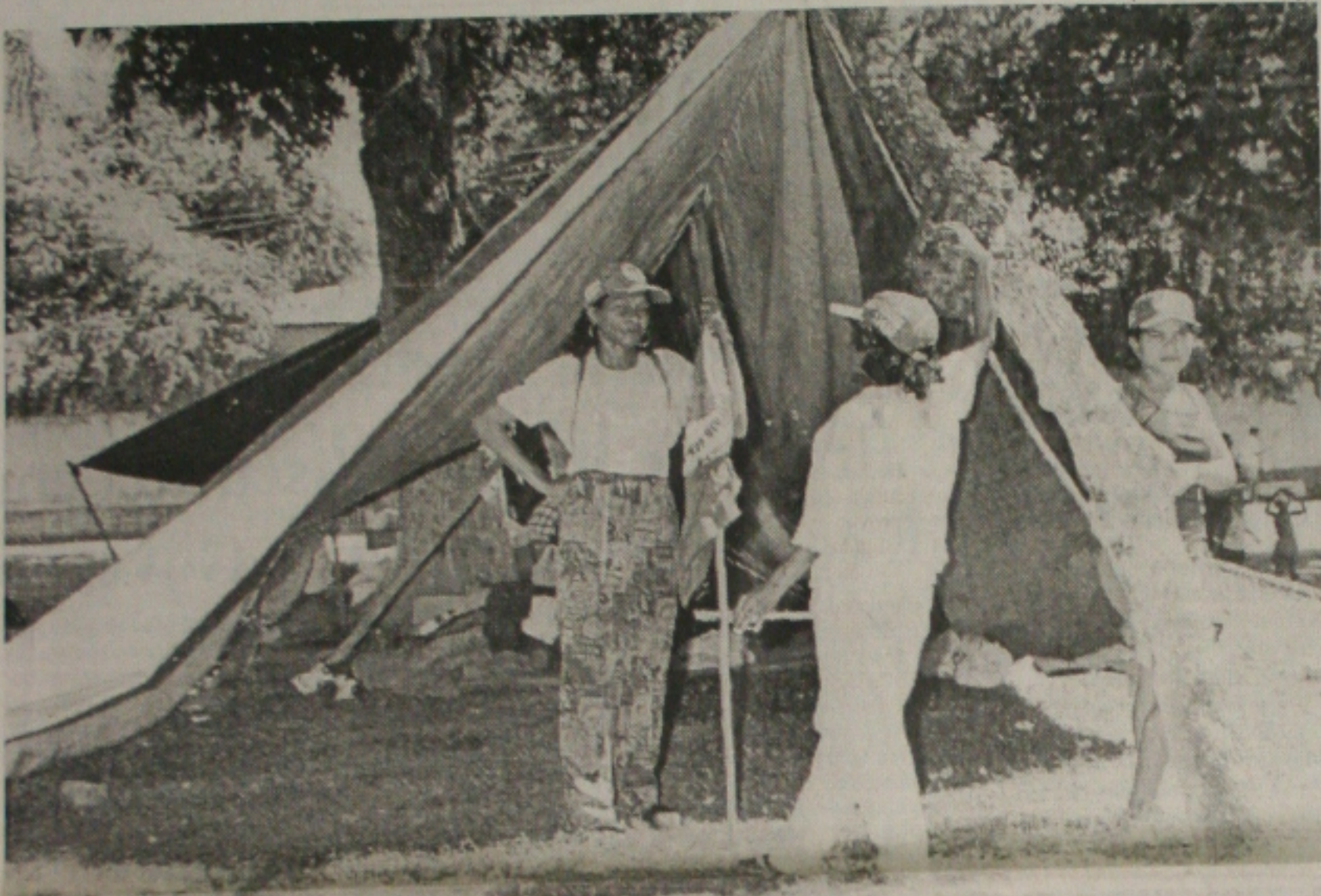
Trabalhadoras rurais acampam na sede do Inbra para reivindicar mais ações para quem lida com a terra