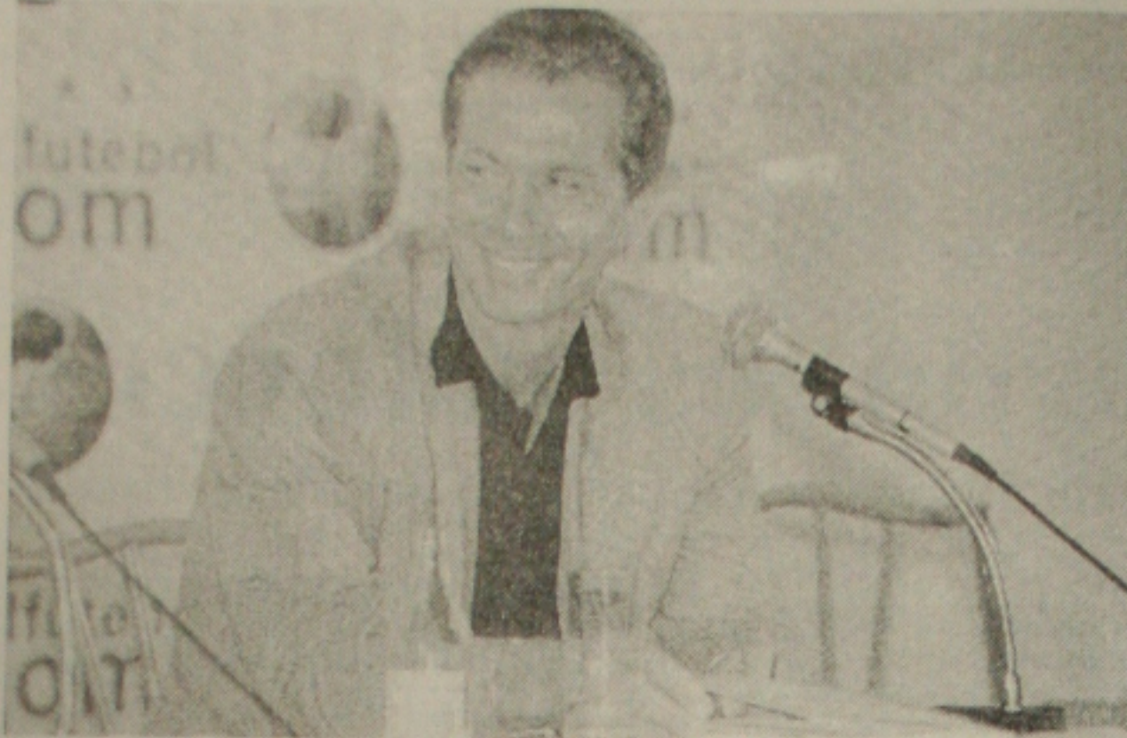
Leão fará mudanças para o jogo do dia 28 contra o Equador

Emerson Leão não gostou dos amistosos e promete time modificado nas eliminatórias