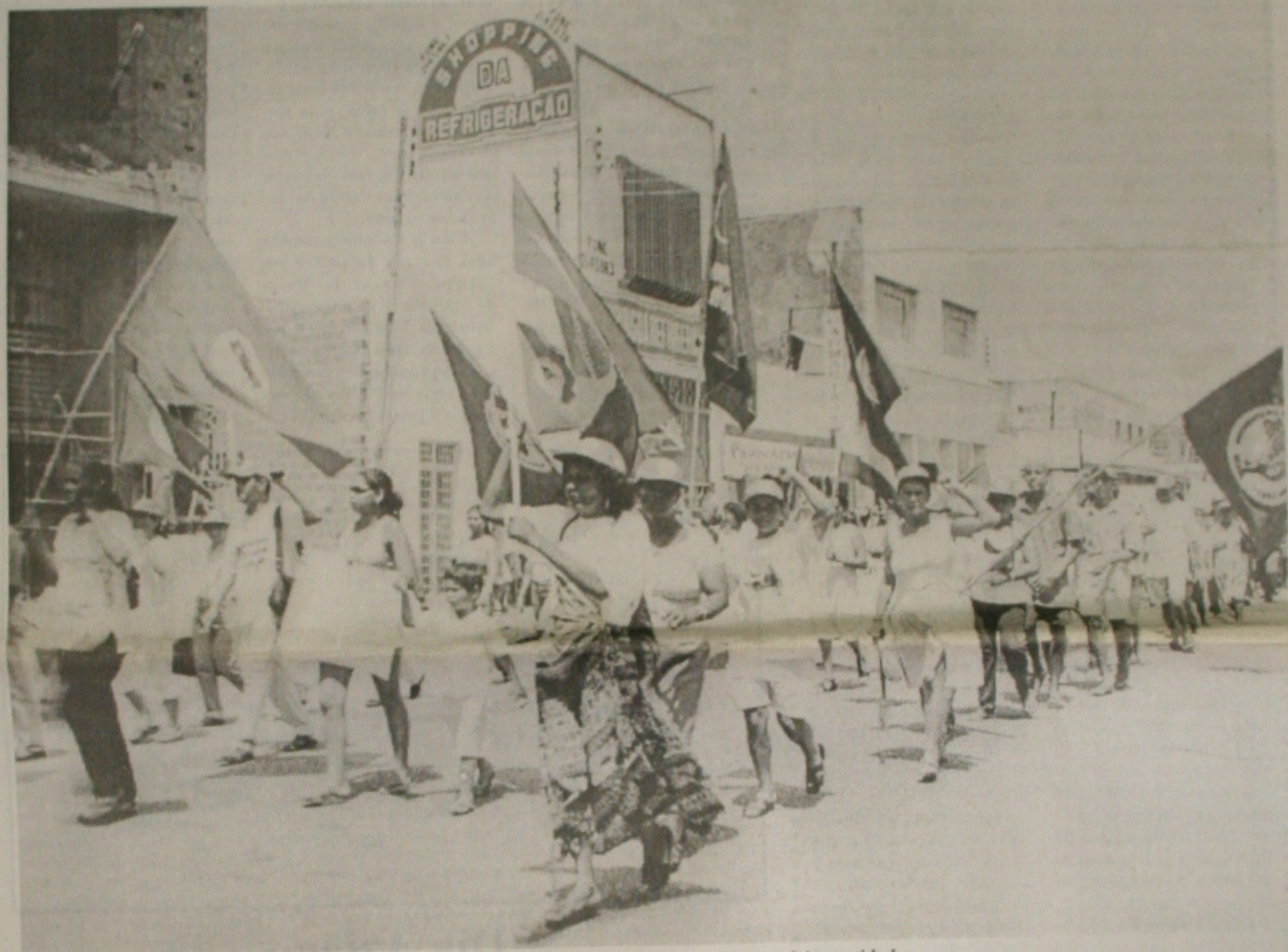
De bandeira em punho, trabalhadoras rurais ocuparam as ruas da capital, com o apoio de várias entidades