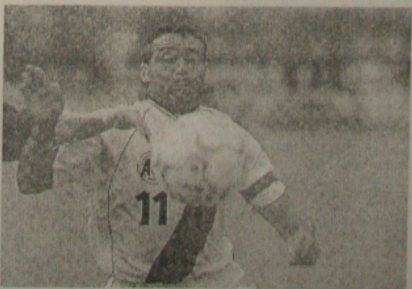
Romário não perdoa Luxemburgo

Adianta, porém, que continuará jogando do mesmo modo, sem correr, permanecendo sumido durante boa parte dos jogos, como na quarta-feira. Sua função em campo, segundo ele, é apenas uma. "Nunca entrei para jogar bem, mas para fazer gols."