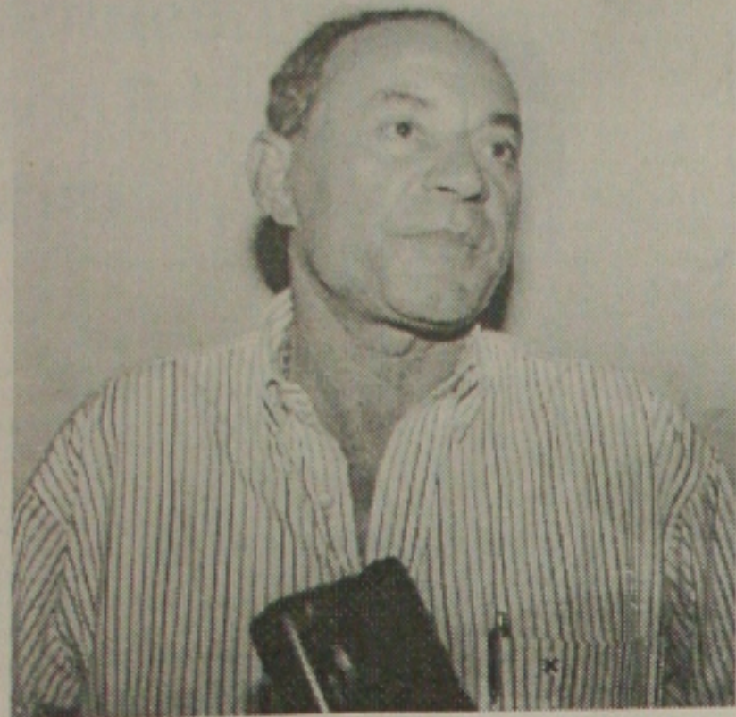
Galindo vai pagar R$ 670 mil para mão-de-obra e mais R$ 514 mil para comissionados

O Diário Oficial do Estado de Sergipe, de ontem, dia 8 de março, publicou um extrato de contrato da Prefeitura Municipal de Canindé do São Francisco com a empresa BKP Serviços de Assessoria Empresarial Ltda no valor estimado de R$ 15 431.856,00. Segundo o contrato, a empresa vai fornecer pessoal (mão-de-obra) para a realização de serviços em diversas categorias, nas Secretarias Municipais nos exercícios de 2001 e 2002. O contrato tem a vigência de 5 de fevereiro deste ano até dezembro de 2002.