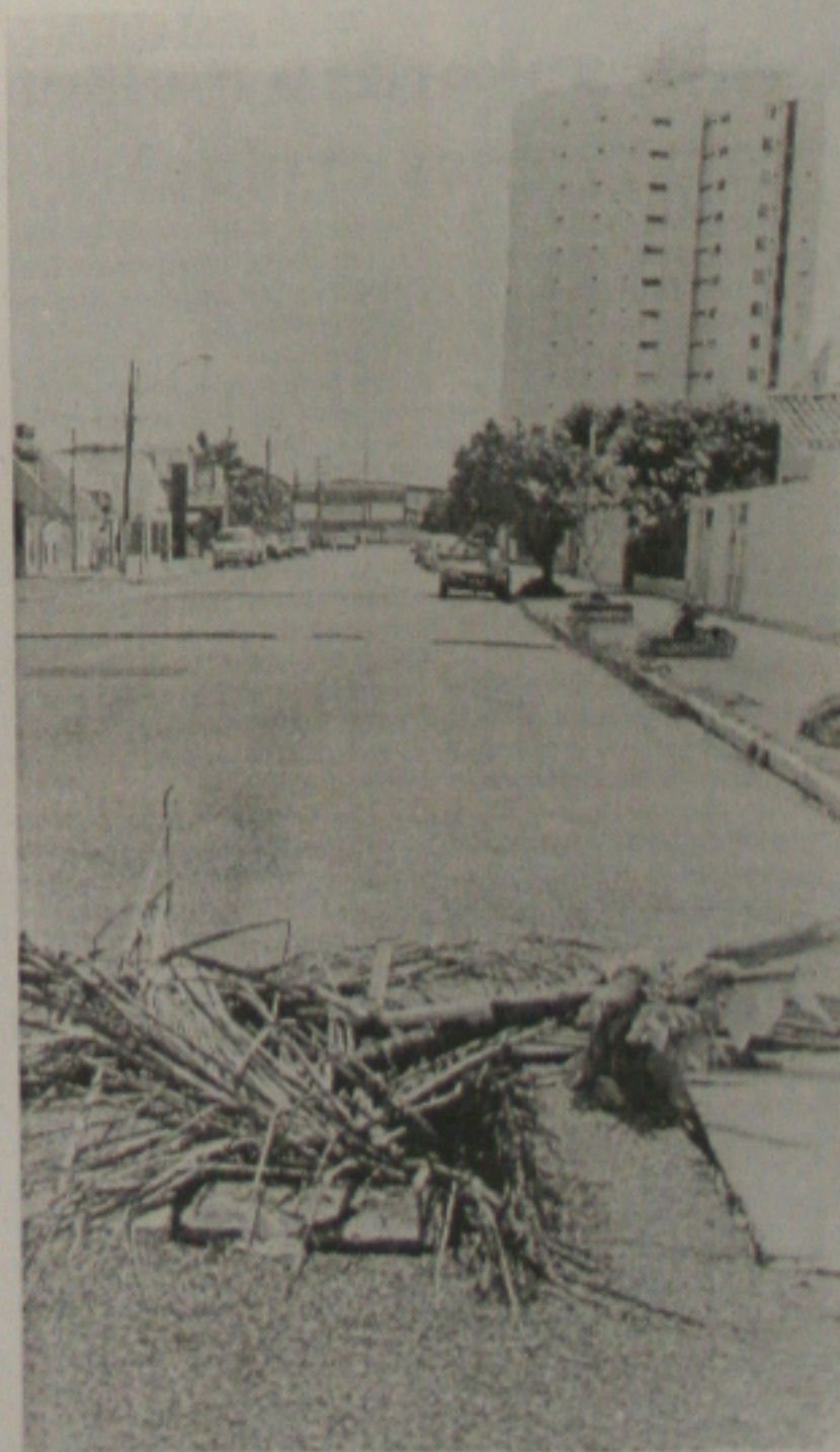
Na Rua Celso Oliva, o buraco tem atrapalhado o trânsito

A grande preocupação é evitar atropelamentos no caso de haver um desvio de estrada em situações envolvendo alta velocidade. Segundo informações de alguns habitantes os órgãos competentes já têm conhecimento sobre o fato. Agora, eles esperam uma providência para resolver o problema.