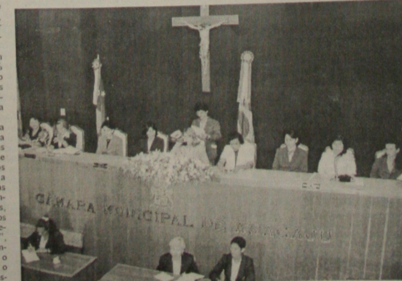
Vereadores de Aracaju homenagearam 30 mulheres de vários segmentos da sociedade