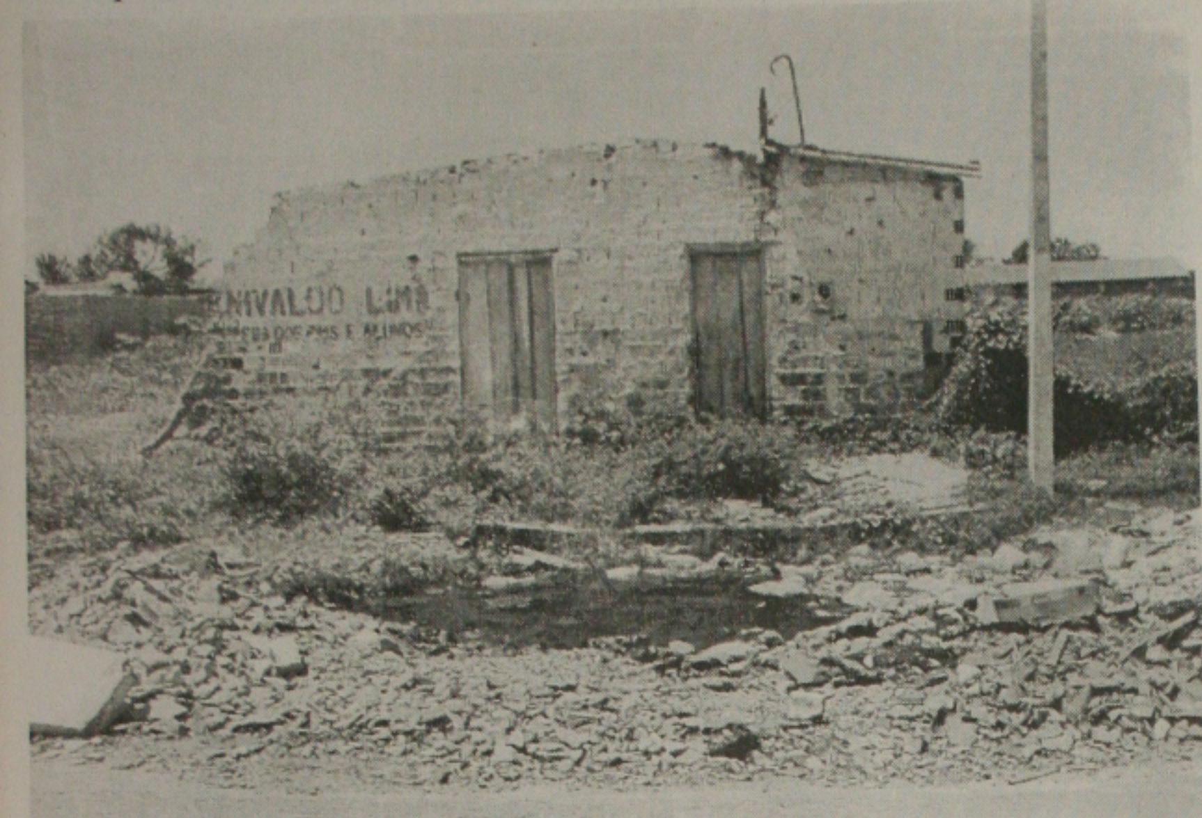
No Bairro Industrial, dejetos correm a céu aberto depois que um cano do Deso rompeu há vários meses