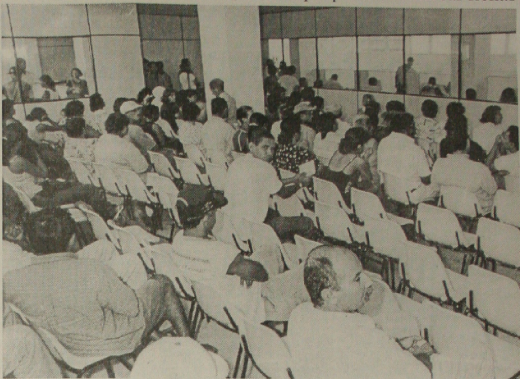
Quem precisa de marcar uma ficha no posto de saúde no Siqueira Campos tem que esperar por várias horas

As atividades alusivas a Semana da Água terão seu ponto alto no dia 22, Dia Mundial da Água, quando será realizada a Caminhada pela Água, evento que sairá do Calçadão da Praia 13 de Julho com destino ao Parque da Sementeira, envolvendo estudantes, professores, funcionários públicos, pessoas da comunidade e mais de 20 Instituições que hoje são parceiras no trabalho da cidadania pelas águas.