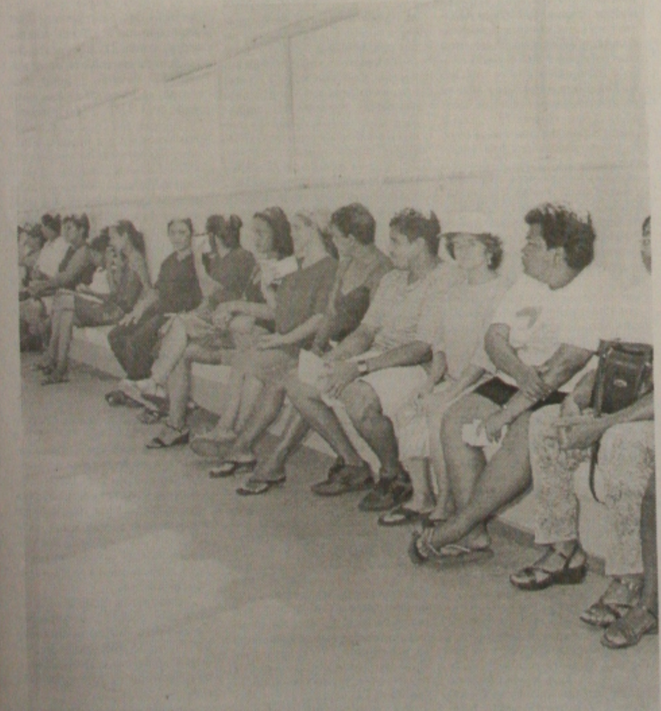
No posto, administrado pela Secretaria da Saúde, a população carente enfrenta uma via crucis na hora da marcação de consultas e exames

Uma passeata organizada pela Federação dos Trabalhadores na Agricultura do Estado de Sergipe (Fetase), com apoio de várias entidades, reuniu ontem cerca de duas mil mulheres em Aracaju. A manifestação fez parte da programação alusiva ao Dia Internacional da Mulher. Durante o ato público, os manifestantes aproveitaram para ratificar uma série de reivindicações e criticaram projetos governamentais, como o da transposição do Rio São Francisco. (Página 1B)