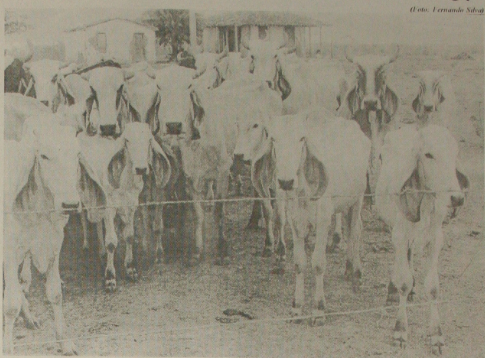
Para manter o Estado como zona livre da febre aftosa, a Emdagro realiza a partir de maio a campanha de vacinação

"A vacinação é obrigatória e precisamos da colaboração dos pecuaristas e das entidades rurais para mantermos Sergipe com o certificado de zona livre de febre aftosa", concluiu.