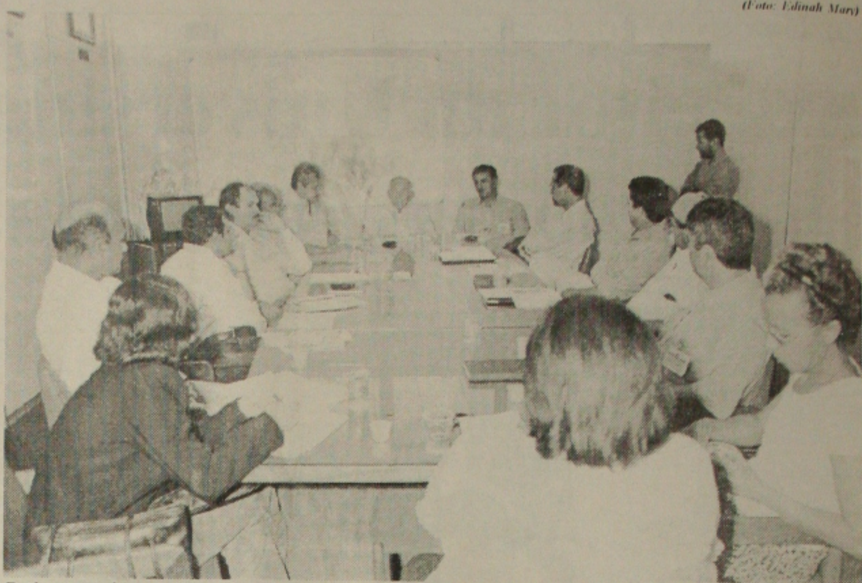
Emdagro coordena reunião com criadores de animais para discutir futuras participações em exposições

"A recuperação dos parques é coisa importante"