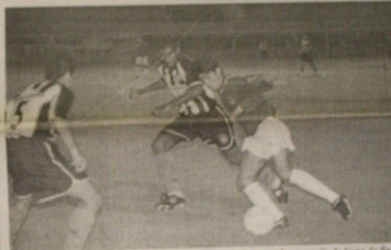
O Sergipe chegou a estar vencendo, mas no final acabou derrotado na estreia da Copa do Brasil.