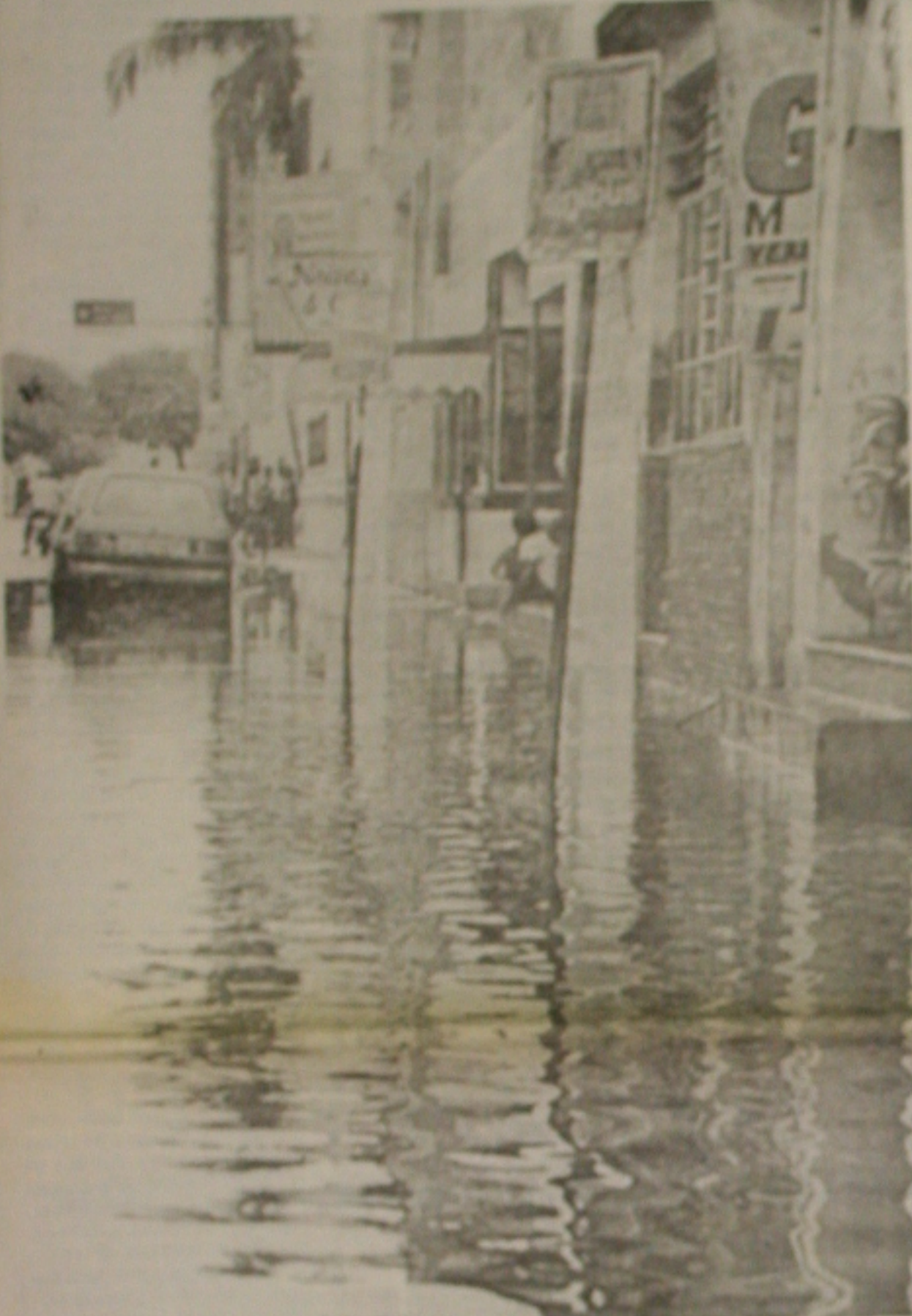
Ontem, as chuvas deixaram muitas ruas ilhadas, exemplo da Capela, no Centro da cidade.

TEMPO Previsão para o dia 16 de março: céu parcialmente nublado com chuvas de manhã e à tarde. Temperatura máxima de 24°C e mínima de 18°C. (Página 10A)