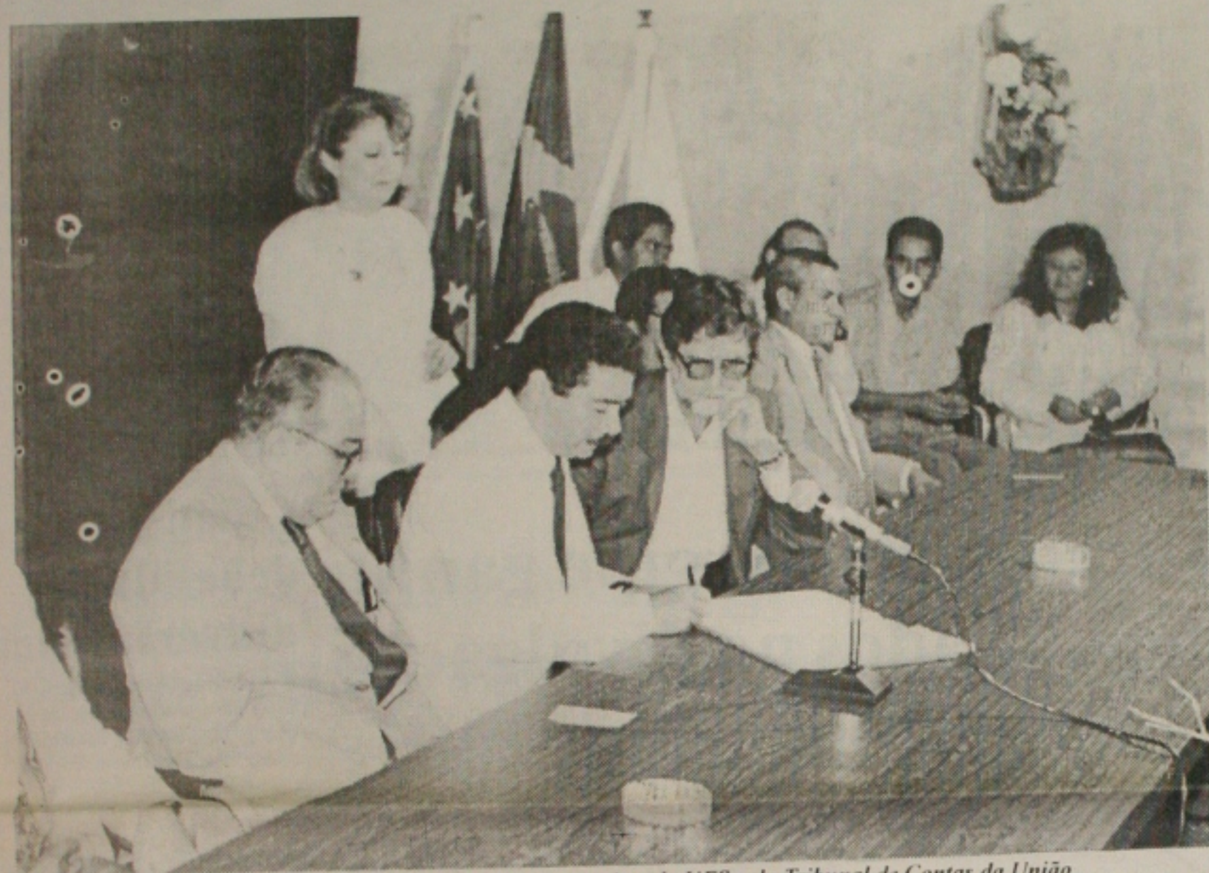
Luiz Herminio, no centro, teve suas contas rejeitadas como reitor da UFS pelo Tribunal de Contas da União