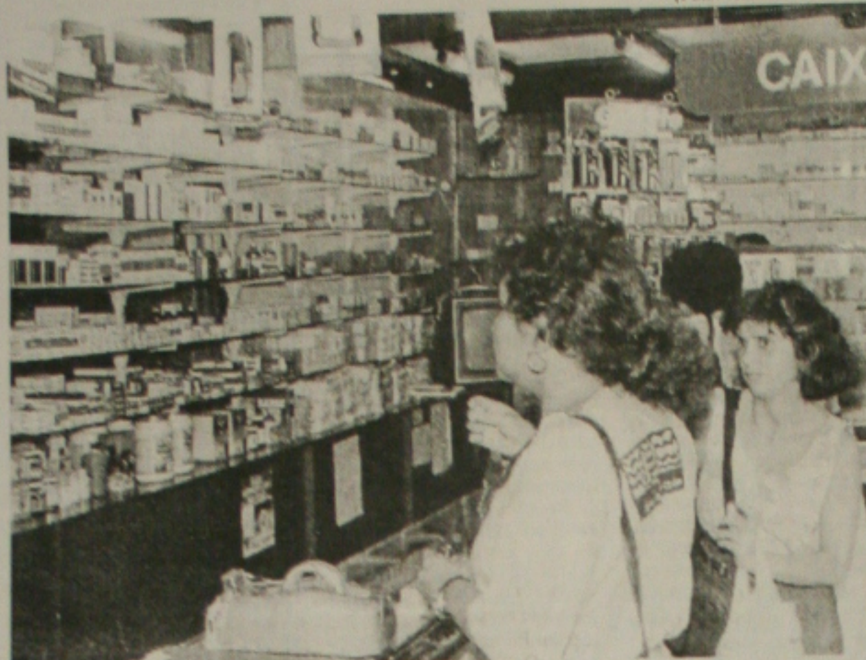
Preço do remédio ajudou no aumento do IPCA do mês de fevereiro

R io (AE) - A inflação de fevereiro medida pelo Índice Nacional de Preços ao Consumidor Amplo (IPCA) atingiu 0,46%, surpreendendo o mercado. Houve queda em relação a janeiro (0,57%), mas o índice divulgado ontem pelo Instituto Brasileiro de Geografia e Estatística (IBGE) ficou acima da taxa máxima de 0,35% esperada pelos analistas. Apesar da surpresa e de uma inflação acumulada de 1,03% nos dois primeiros meses do ano, ante 0,75% no mesmo período do ano passado, está mantida a aposta de que a meta estipulada para 2001 pelo governo (IPCA de 4%, com variação de dois pontos percentuais para cima ou para baixo) será alcançada.