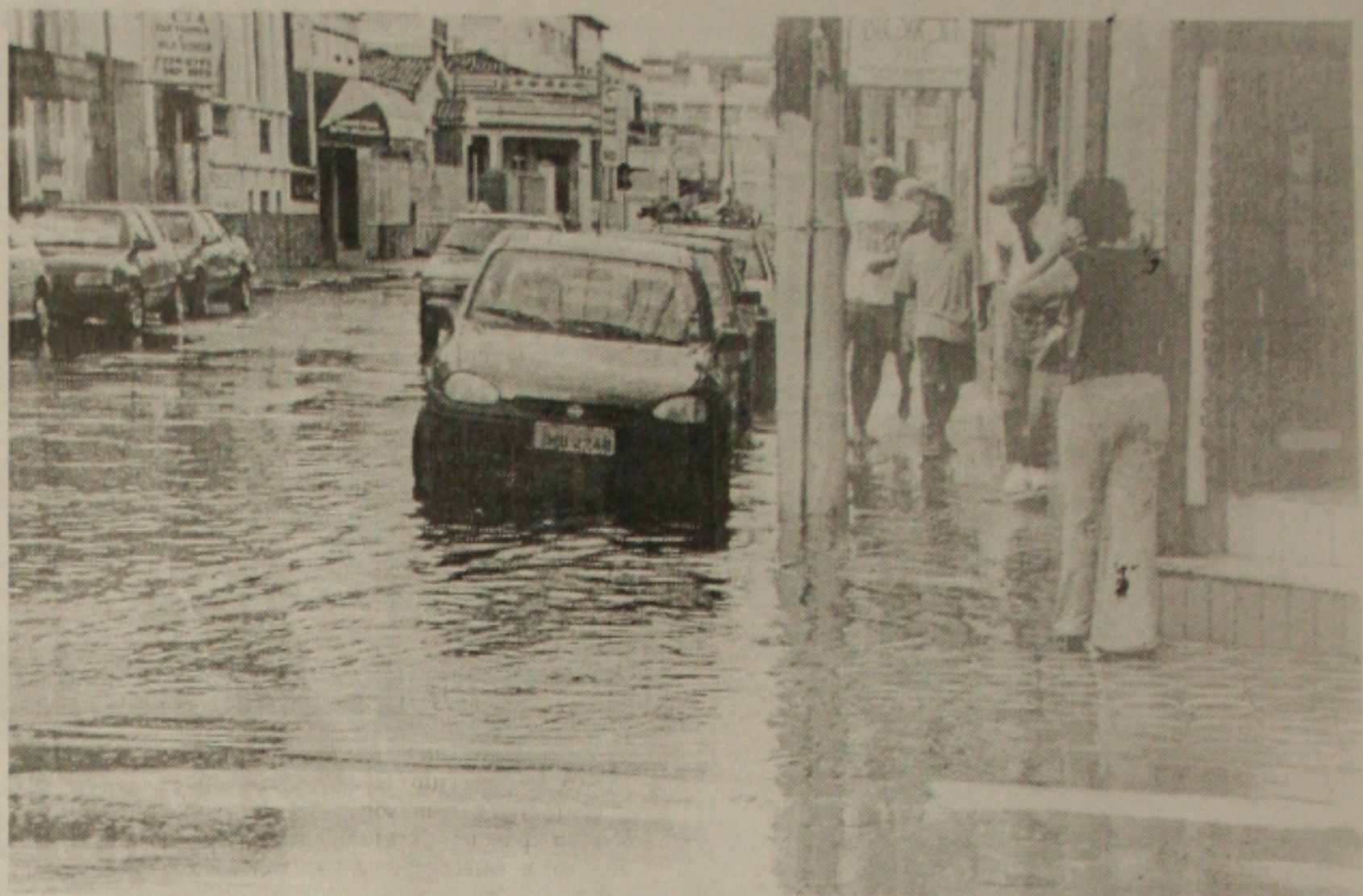
Aracaju voltou a ficar inundada em poucos minutos de chuvas na manhã de ontem prejudicando o trânsito

O Centro de Referência implantou o sistema de marcação de consultas e exames pela internet para facilitar a vida das mulheres que procuram os exames oferecidos pelo órgão. Mensalmente são oferecidas mais de 1.600 vagas, distribuídas em três centros em Aracaju, e ainda, outra vagas para 40 cidades do interior que também marcam esses exames pela rede de computadores.