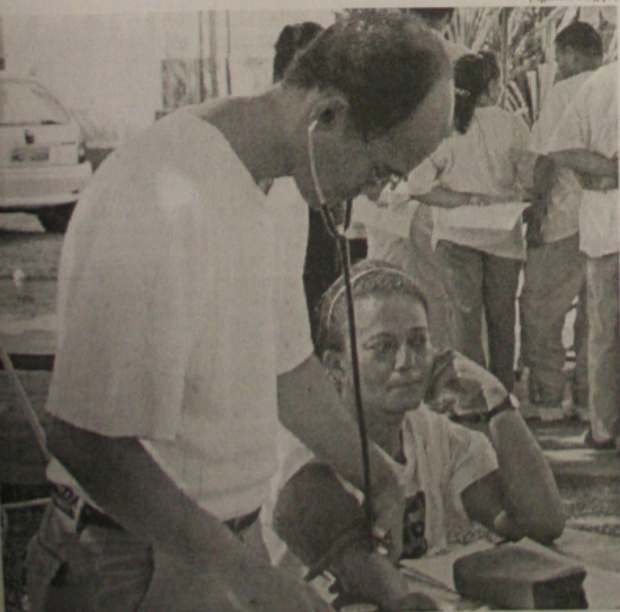
Ontem, dia nacional de combate à hipertensão, centenas de aracajuano puderam medir a pressão arterial, gratuitamente, na capital. (Página 3B)