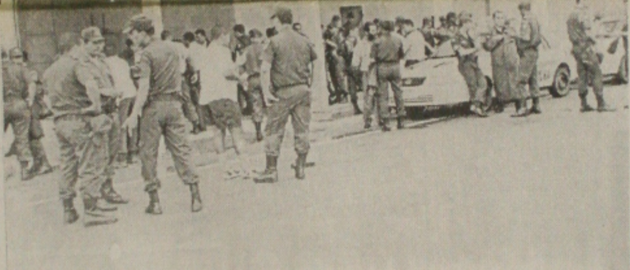
...no CEFAP, onde os militares se mantiveram aquartelados durante todo o dia