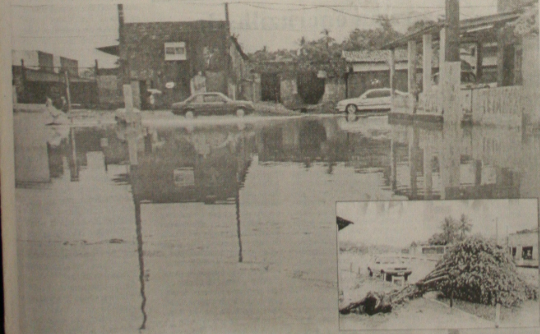
No periferia, muitas ruas ficaram alagadas por causa das chuvas, que também derrubaram uma árvore (detalhe) na Maracaju

fortes chuvas também provocaram muitos transtornos no trânsito, com muitos carros enguiçados. No presídio feminino, no Bairro América, zona oeste da cidade, o telhado cedeu, enquanto na Avenida Visconde de Maracaju, uma árvore caiu, atravessando a pista, em frente à casa 22. (Página 3B)