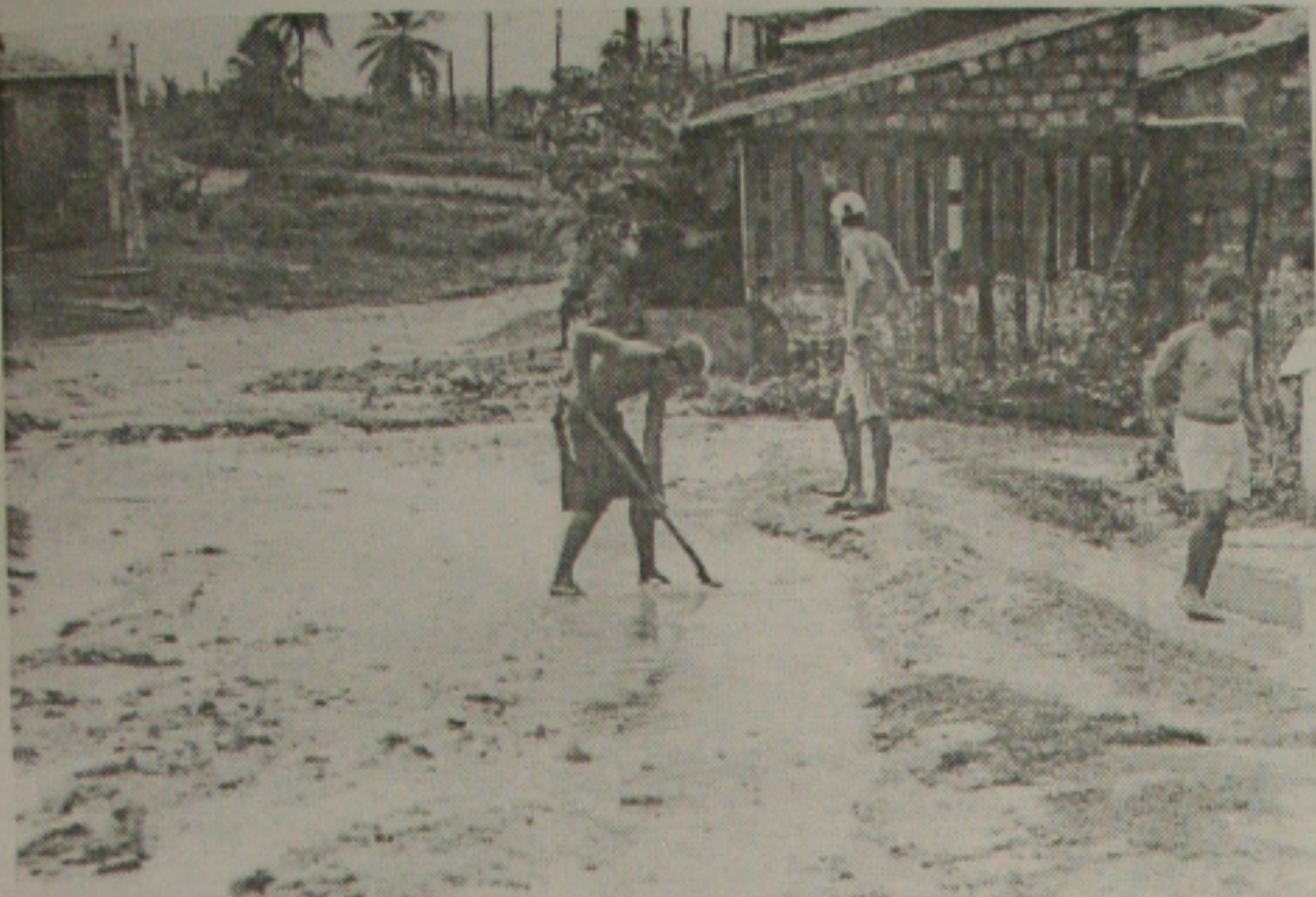
Na rua Olaria, os moradores fazem mutirão para desobstrução da artéria para não ser invadida por areia