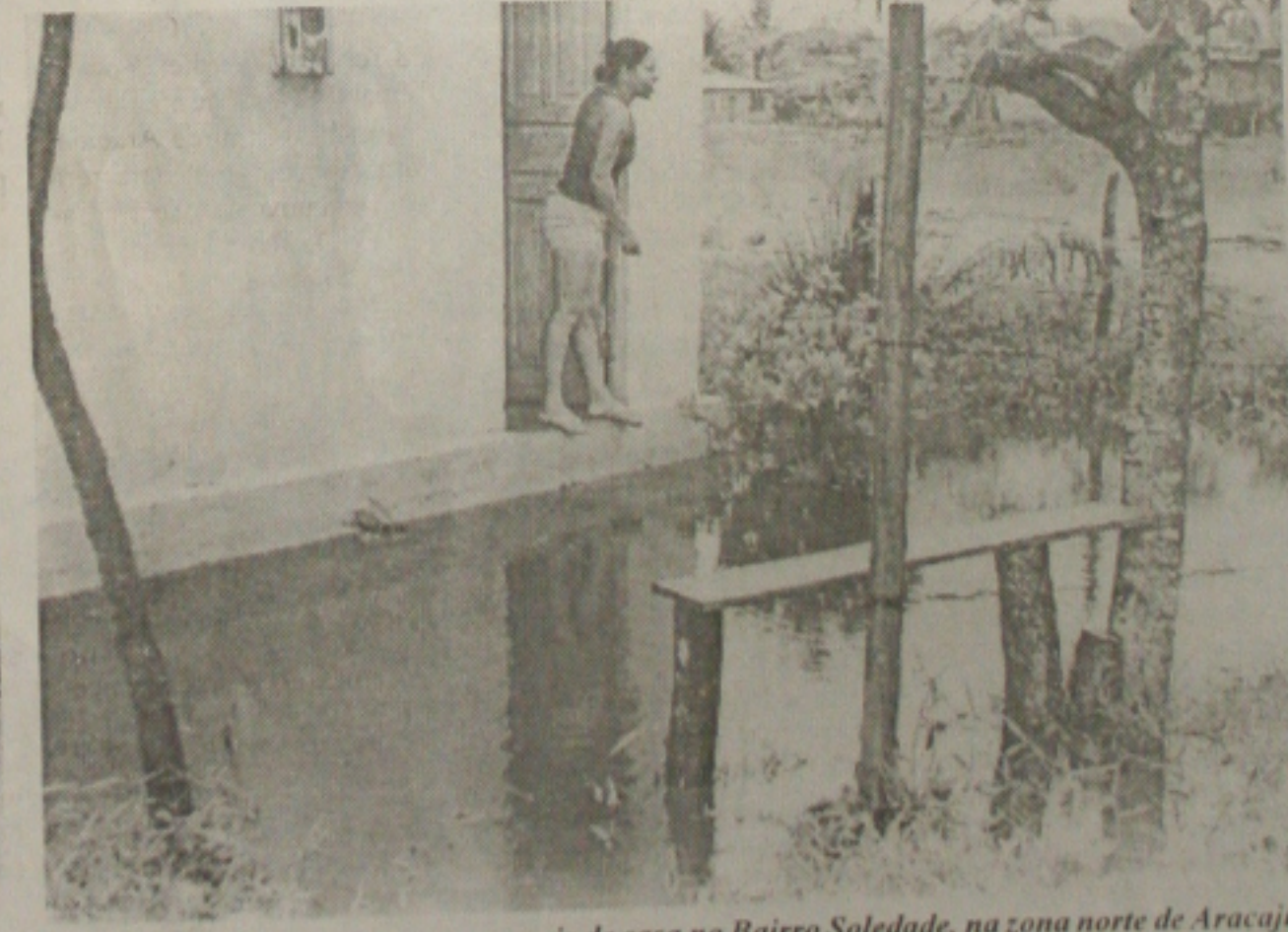
Ilhada, a moradora não teve como sair de casa no Bairro Soledade, na zona norte de Aracaju