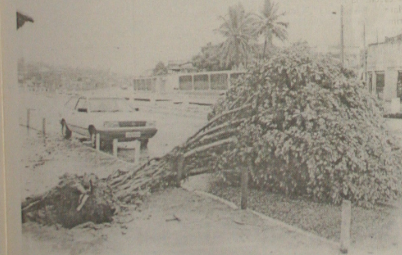
A árvore não suportou as fortes chuvas caindo na Avenida Maracaju, prejudicando o trânsito

"Se a gente não se unir, o trabalho não pode ser feito"