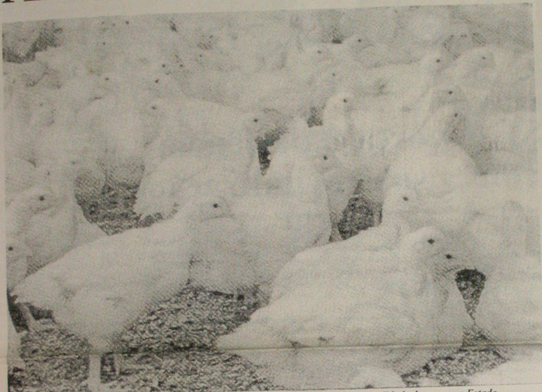
A Embrapa integrará o programa nacional de sanidade avícola o que garantirá a qualidade da carne no Estado