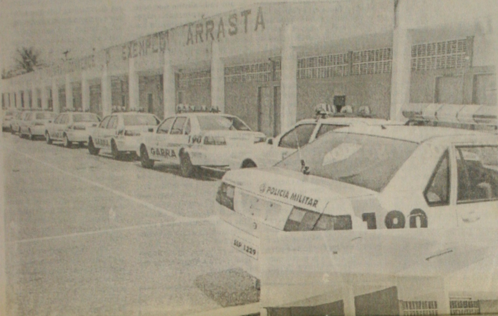
Todas as viaturas da PM, inclusive as da Garra, foram recolhidas...