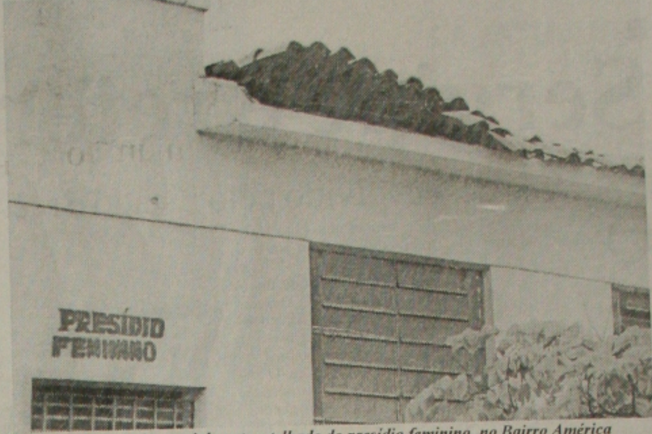
O temporal destruiu parcialmente o telhado do presídio feminino, no Bairro América