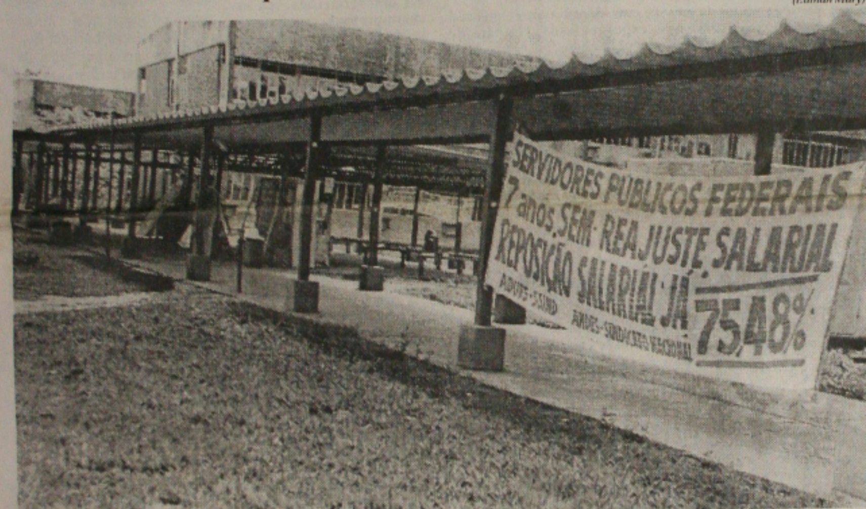
Uma faixa à entrada do campus, que ficou completamente vazia, anunciava a principal reivindicação dos servidores

Sem-terra bloqueiam rodovia para exigir distribuição de alimentos e água