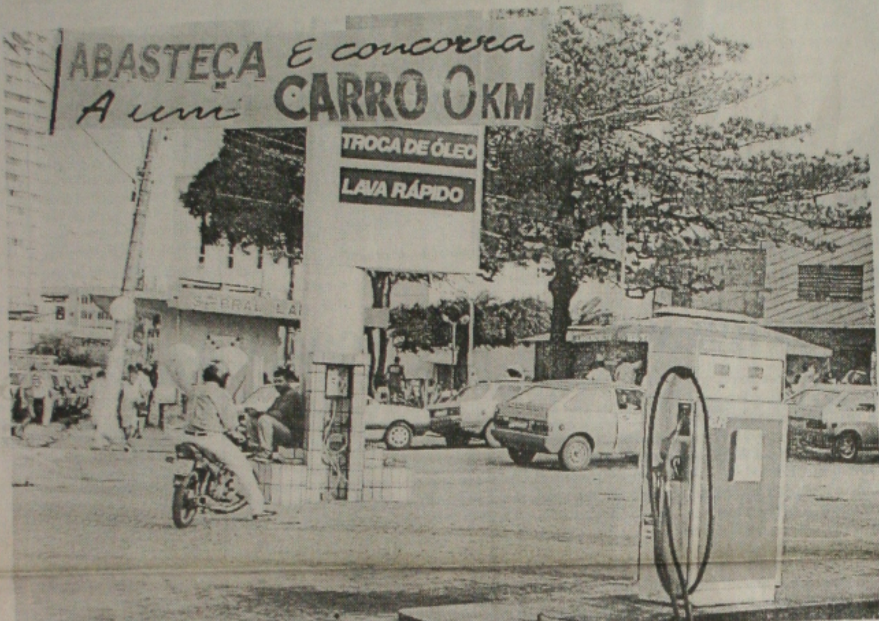
A venda de combustíveis a cartão de crédito levou os comerciantes a travarem luta com as administradoras