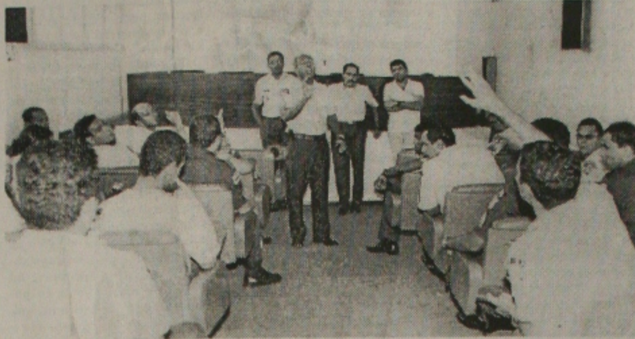
Na assembleia, militares decidiram aceitar todas as propostas apresentadas pelo governo estadual

devem ser aprovados na próxima semana pela Assembleia Legislativa, estabelecem reajuste de 12,86% nos vencimentos dos militares, criam o Plano de Carreira da PM e dos Bombeiros, além do Quadro Complementar da Polícia Militar, formado por 27 oficiais R2, onúdos do Exército. (Página 5A)