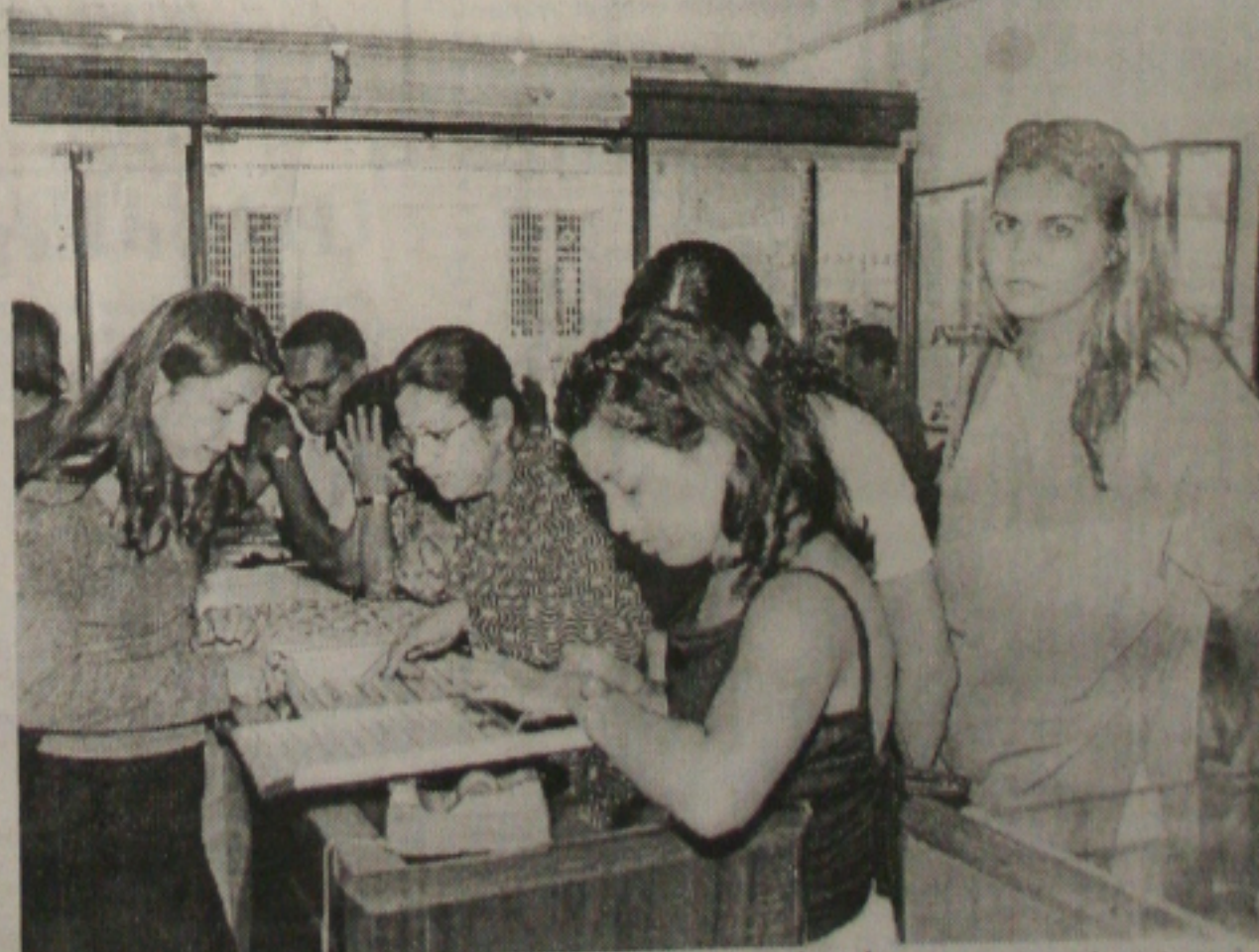
As joalherias estão entre as casas comerciais mais procuradas na hora de comprar o presente para as mães

criação da CPI, o comando da base aliada contabilizava o recuo de 24 dissidentes da Câmara, número mais que suficiente para derrubar a marca das 171 assinaturas exigidas para abrir o inquérito. (Página 8A)