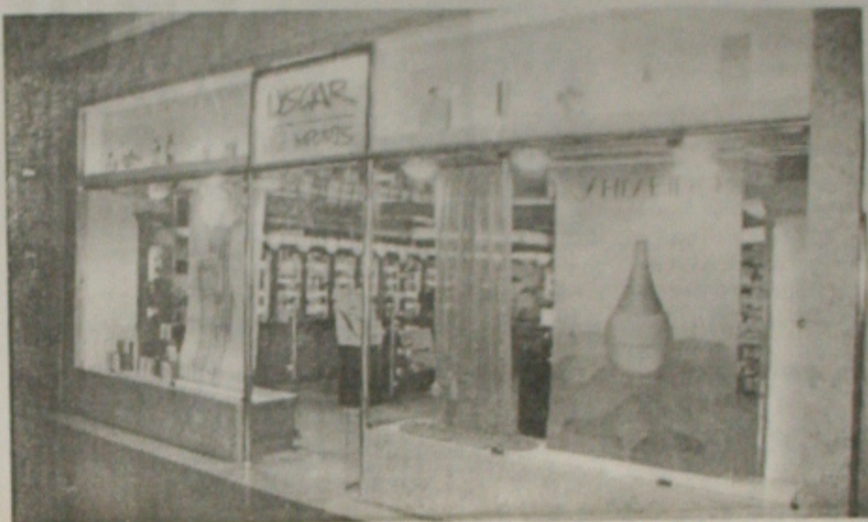
Lyscar Import's com excelente lojas no Shopping Jardins e Rua 24 Horas