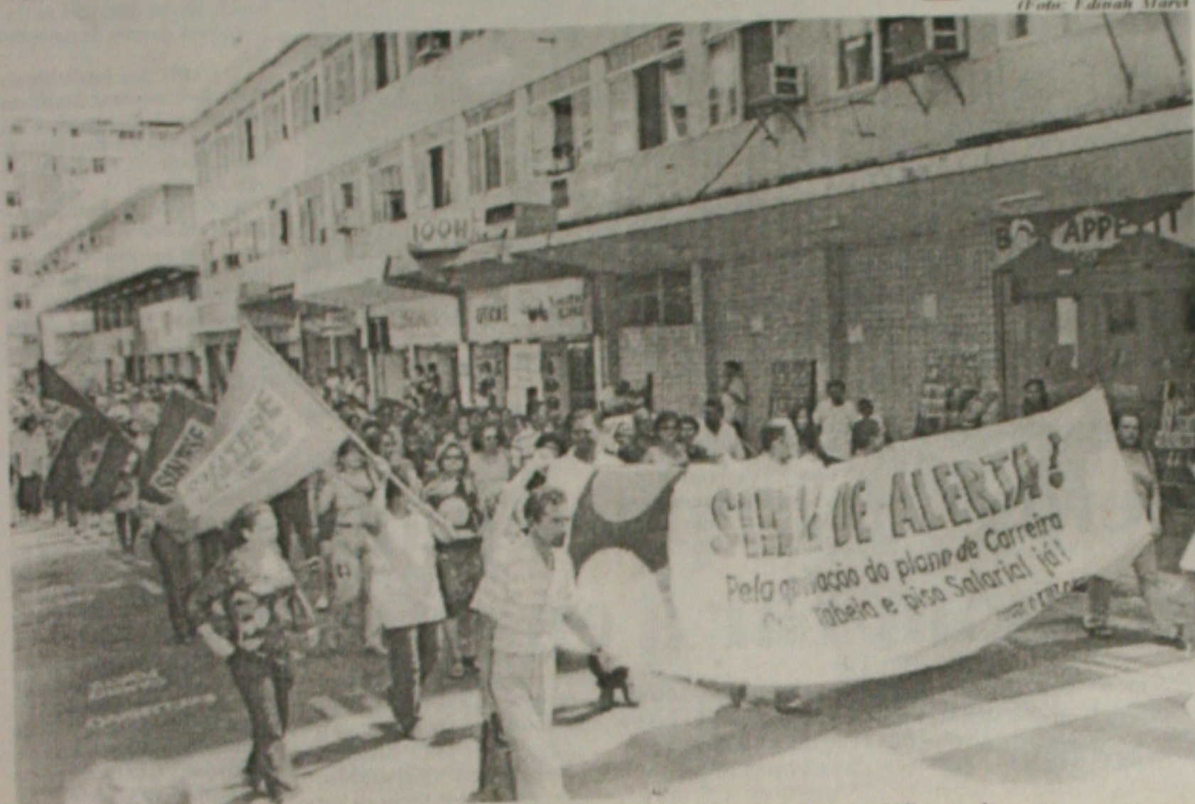
Professores fazem passeata reivindicando piso salarial depois de participar de uma assembleia-geral

Professores do ensino público estadual optam por uma greve-geral por tempo indeterminado a partir de segunda-feira, 21. Numa assembleia participativa, realizada ontem no Instituto Histórico e Geográfico de Sergipe, os profissionais da educação decidem cruzar os braços até que o Governo de Sergipe resolva o problema do Plano de Cargos e Salários da categoria, bem como revogar a retirada em folha da contribuição sindical.