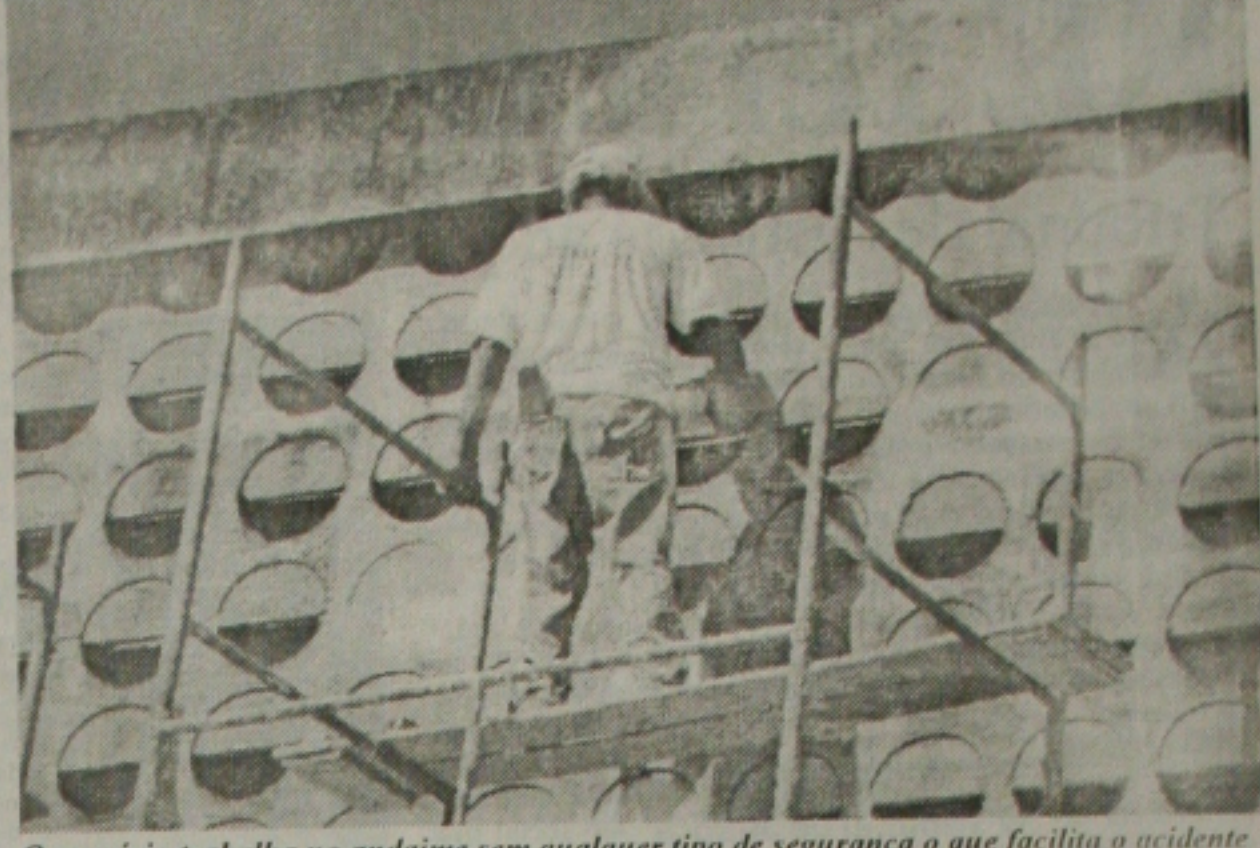
O operário trabalha no andaime sem qualquer tipo de segurança o que facilita o acidente