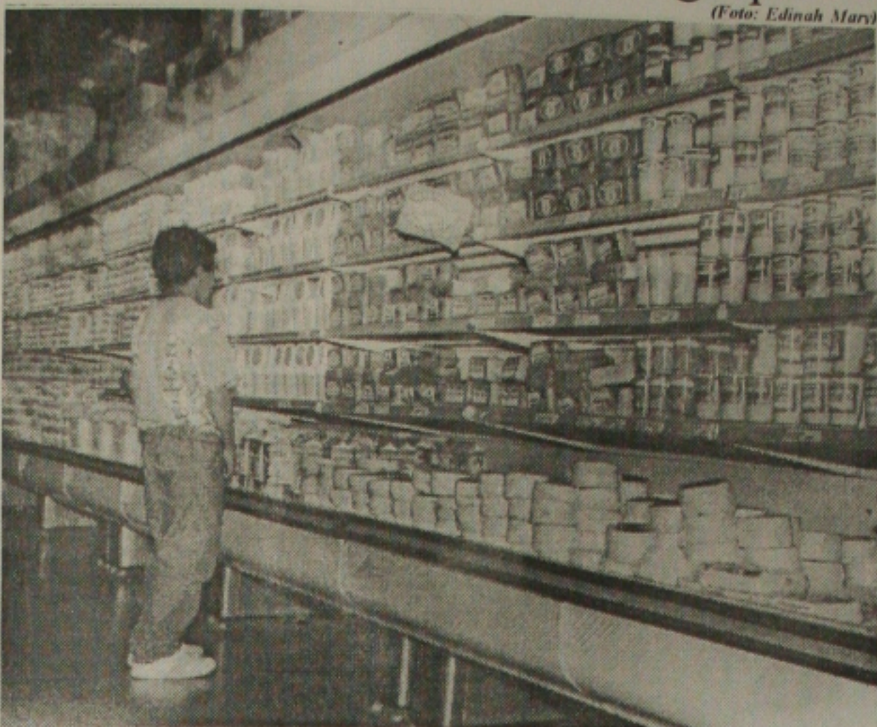
Supermercados começam a se preparar para o período de racionamento de energia a partir de junho

valho, será fundamental para esclarecer algumas dúvidas que a população tem, no que se refere ao racionamento de energia, que deverá começar a partir de 1º de junho em todo país.