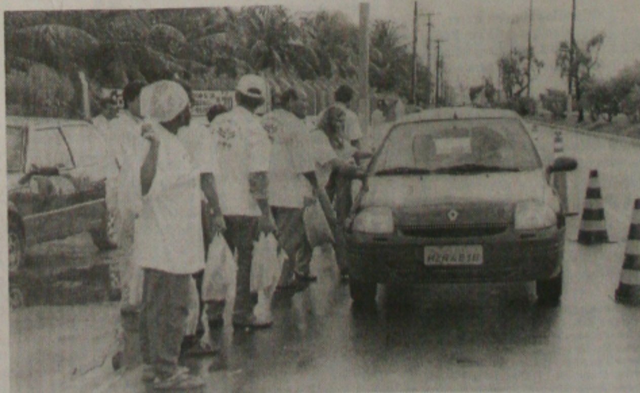
Funcionários da Embrapa Tabuleiros Costeiros, em Aracaju, realizaram ontem uma paralisação de advertência. Eles reivindicam reposição salarial de 20%, mais verbas para pesquisa e melhores condições de trabalho. Como forma de chamar a população, a categoria passou o dia de ontem distribuindo milho em frente à sede da empresa (foto), Avenida Beira Mar. (Página 2B)