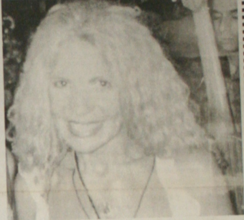
Elba Ramalho vem cantar em Areia Branca