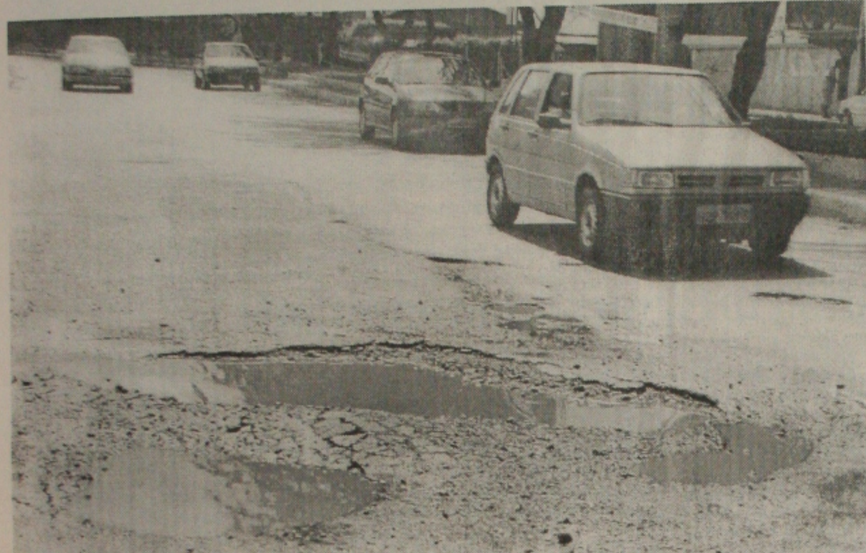
A Companhia de Saneamento, como sempre, resolve um problema, mas tem causado outros para população

Estabelecer metas de racionalização do consumo de água e aumentar a quantidade e qualidade dos recursos hídricos em Sergipe fazem parte do Plano Estadual de Recursos Hídricos elaborado pela Secretaria do Estado do Planejamento da Ciência e da Tecnologia (Seplantec) que o governo está pretendendo implantar até o final do ano.