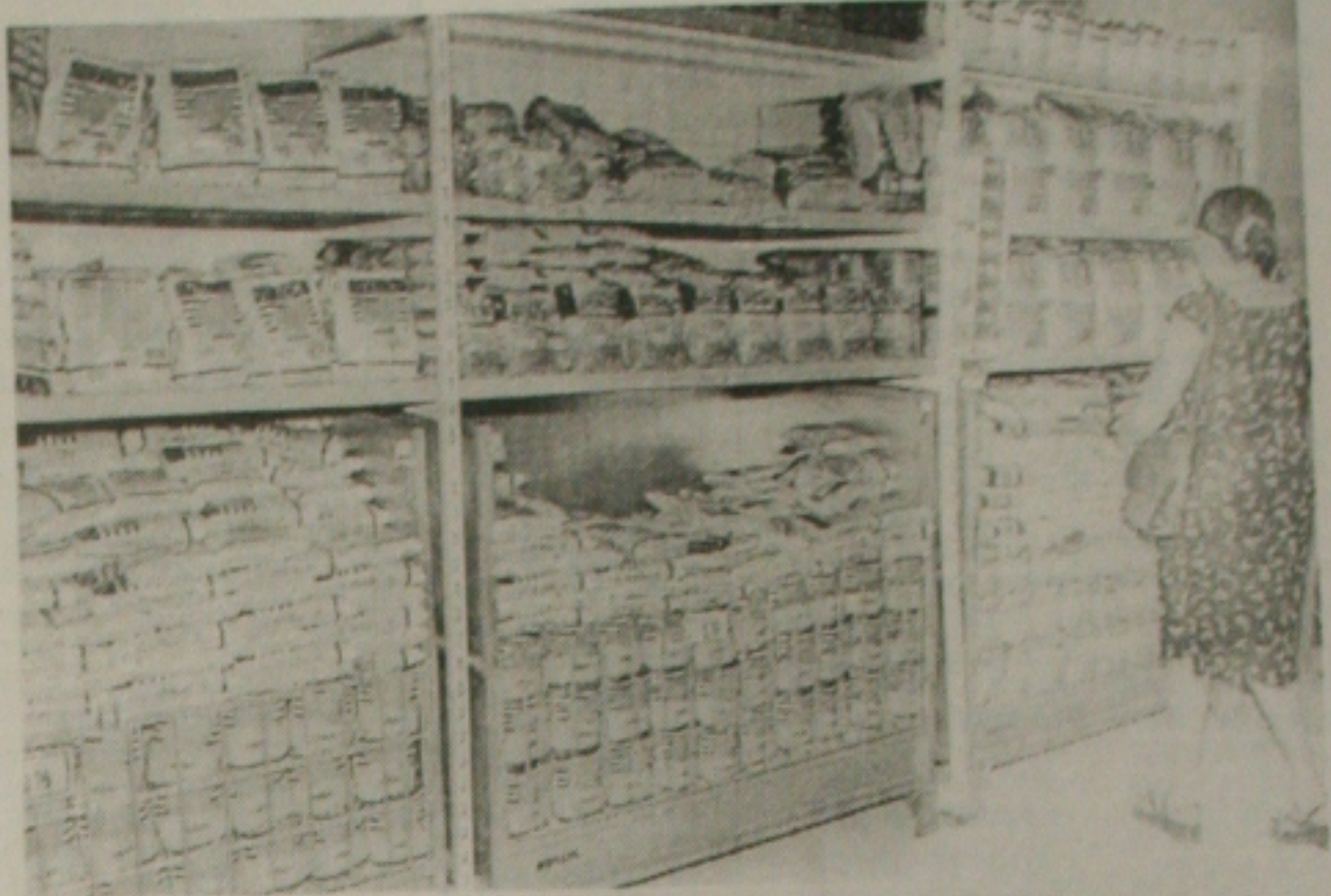
Supermercados têm sido alvo de saques nos municípios do alto sertão de Sergipe, sob o comando de quadrilhas

queriam apenas alimentos. "Nesse momento aparecem muitos aproveitadores", afirma o delegado. A partir de hoje será aberto inquérito policial para indiciar as pessoas que tomaram parte na invasão ao supermercado. Após a conclusão das investigações será solicitada a prisão preventiva de todos os elementos porque está comprovado a presença de marginais entre os saqueadores. "Quem não tem luz, não precisa de eletrodomésticos", indaga o delegado diante do que aconteceu na loja do G. Barbosa em Nossa Senhora da Glória. O delegado acredita que a rede de supermercados deve fechar a loja de Nossa Senhora da Glória depois do saque de segunda-feira. Segundo ele, existiam comentários na cidade de que o supermercado estaria fechando as portas em breve e, esse fato apressou a decisão da direção do grupo.