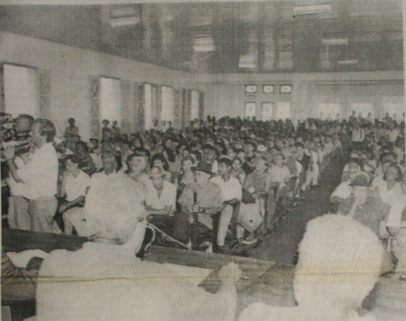
O prefeito Marcelo Dêda reuniu ontem servidores no Instituto Histórico e anunciou o acordo para pagar a dívida

Os cortes de energia nas residências que não cumprirem suas metas de redução de consumo de eletricidade ocorrerão depois de 48 horas da entrega da conta. A sanção será aplicada somente a partir de julho, e em ordem decrescente - os consumidores que mais descumprirem suas metas, em valores absolutos, serão os primeiros a serem punidos. As distribuidoras de energia também estão obrigadas a religar a luz nas residências antes de terminado o prazo