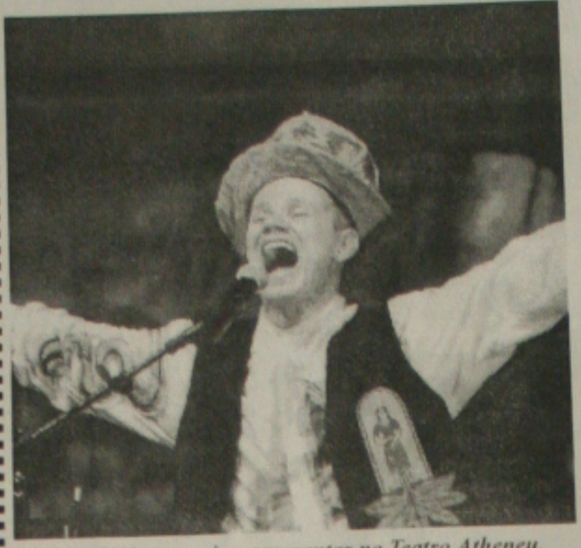
Antônio Nóbrega vai se apresentar no Teatro Atheneu.