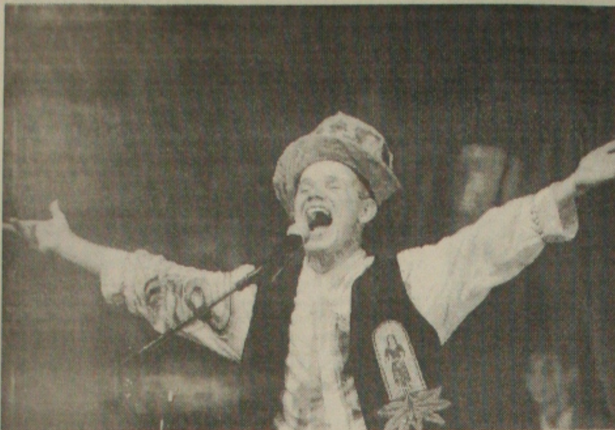
O cantor apresentará aos sergipanos uma cantoria-recital