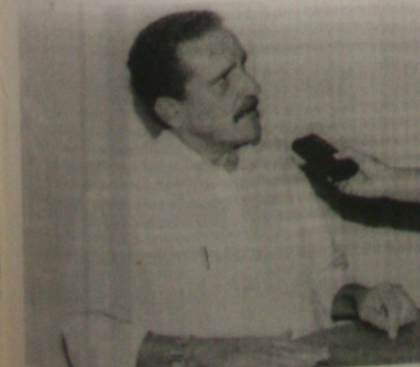
Machado diz que saques vão se repetir no sertão