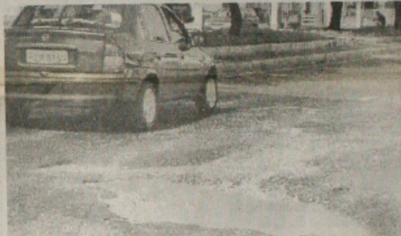
Apesar das queixas da PMA, muitos buracos decorrentes de obras do Deso continuam a atormentar os motoristas, como este na Avenida Hermes Fontes. (Página 1B)