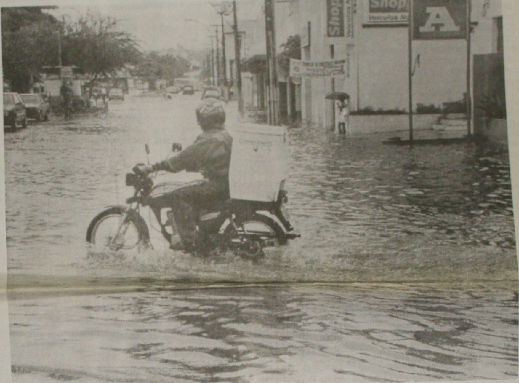
As últimas chuvas só provocaram inundações em Aracaju, mas a Defesa Civil montou um plano de emergência (Página 4-B)

divulgado estudo concluindo que a contribuição pode colocar em risco a saúde financeira dos países que a adotam. O PT ainda não definiu que alíquota utilizaria, mas diz que seria inferior aos 0,38% cobrados hoje e que proporciona uma arrecadação de R$ 18 bilhões/ano. A postura do PT favorável à manutenção da CPMF facilitará a prorrogação do tributo, como pretende o presidente Fernando Henrique Cardoso, mas não é suficiente para garantir a aprovação no congresso da emenda constitucional. (Página 8-A)