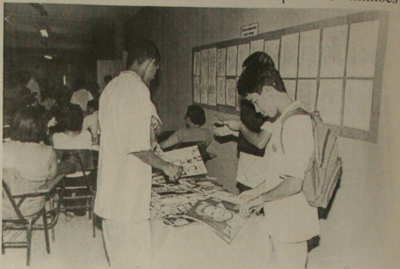
O ensino médio em nove municípios de Sergipe começa a ser fortalecido com o repasse de quase R$ 7 milhões

Nesta primeira quinzena de junho as comissões municipais entregam à comissão regional, composta de um representante de