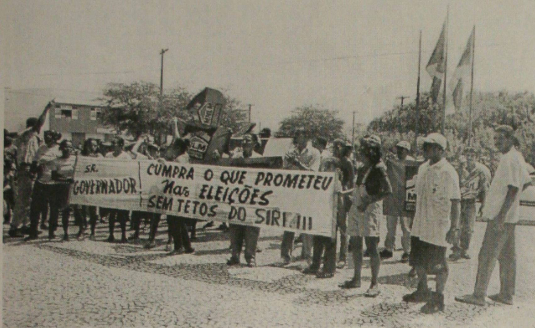
Sem-teto querem definição para o problema das ocupações de áreas em diversas localidades de Aracaju