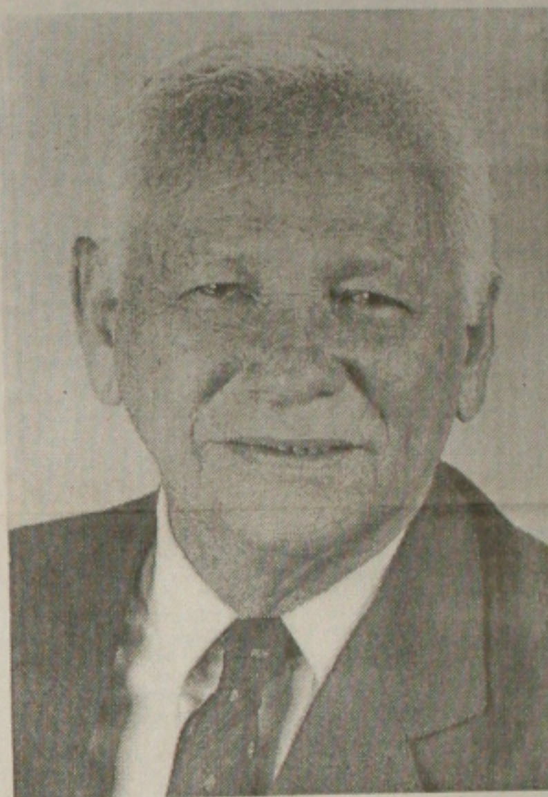
Seixas Dória, ex-governador de Sergipe, será homenageado

Não ia haver uma gravação, aqui em Aracaju, para o Programa Domingo Legal, do SBT? O que houve?