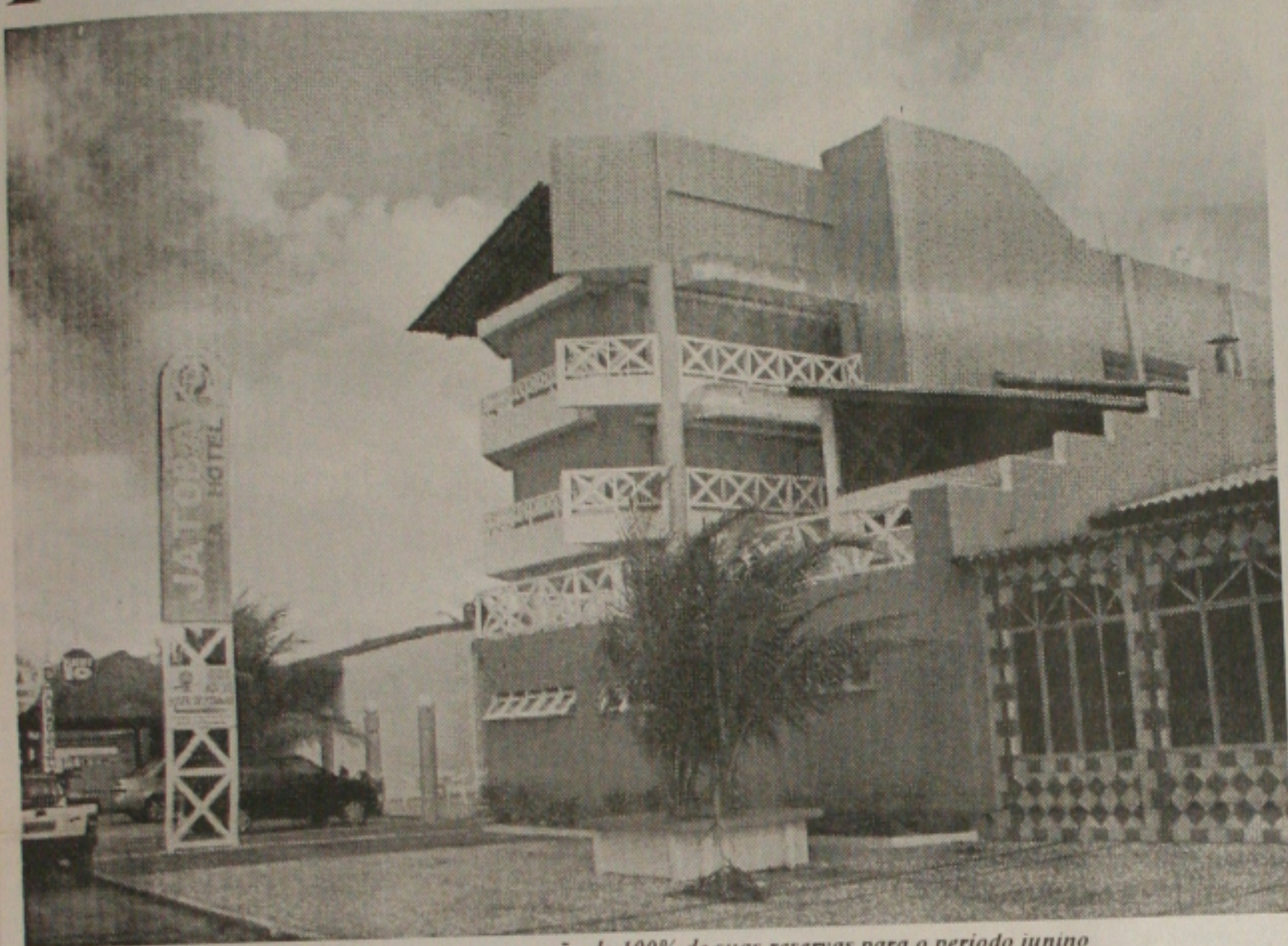
Os hotéis da orla de Atalaia já comemoram a ocupação de 100% de suas reservas para o período junino