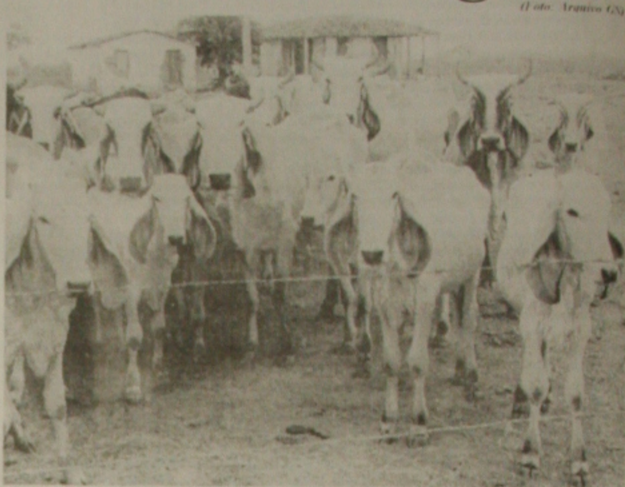
Livre da aftosa, o rebanho de Sergipe corre risco, se houver paralisação