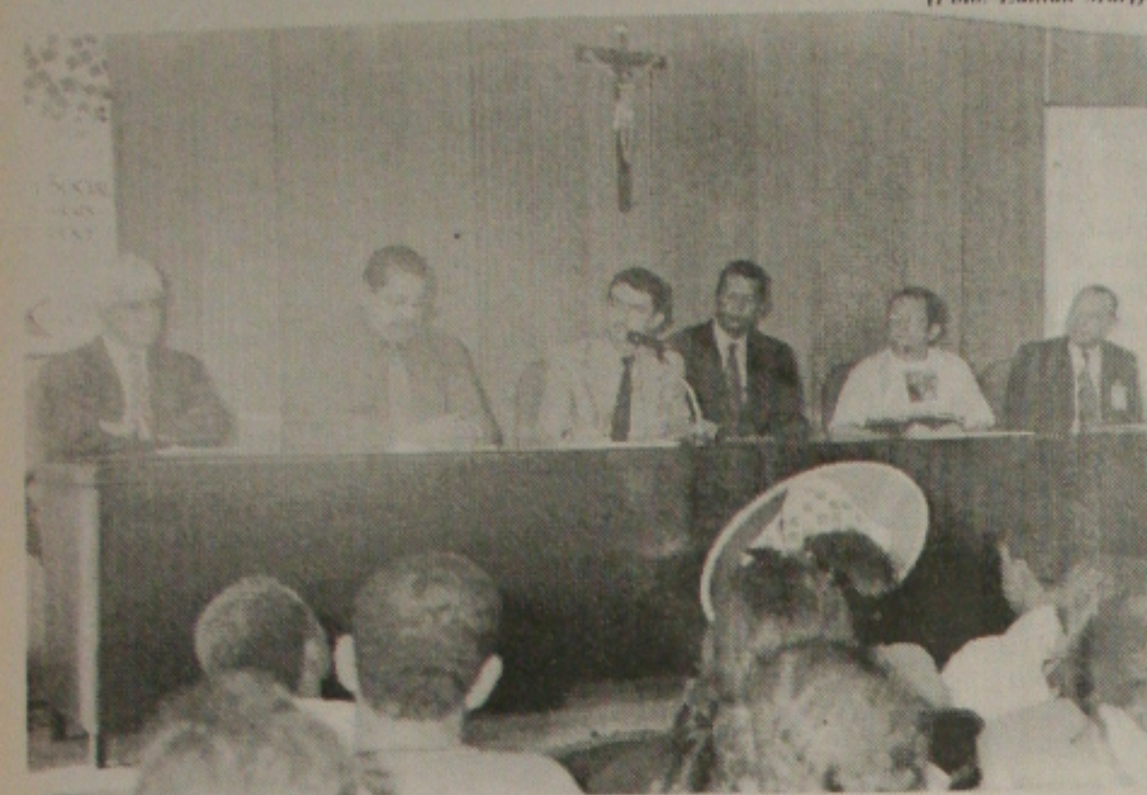
Técnicos da Previdência Social explica em reunião como será a forma de pagamento para o INSS