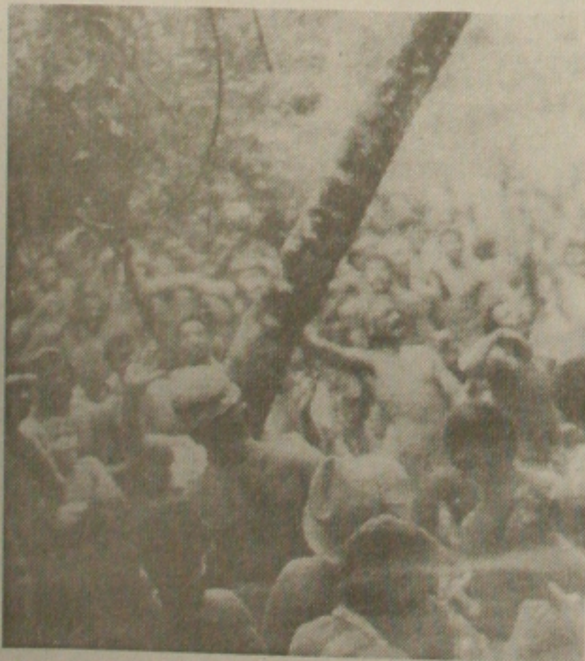
Programação da Festa do Mastro tem apoio do Governo

A programação começa com a tradicional colocação do Mastro, quando uma árvore de grande dimensão é retirada do mato pelos moradores da cidade para ser fincada na praça onde acontece os festejos. Em seguida virá a parte musical, que começa dia 29 de junho, sexta-feira, e se estende até o dia 1º de julho, domingo.