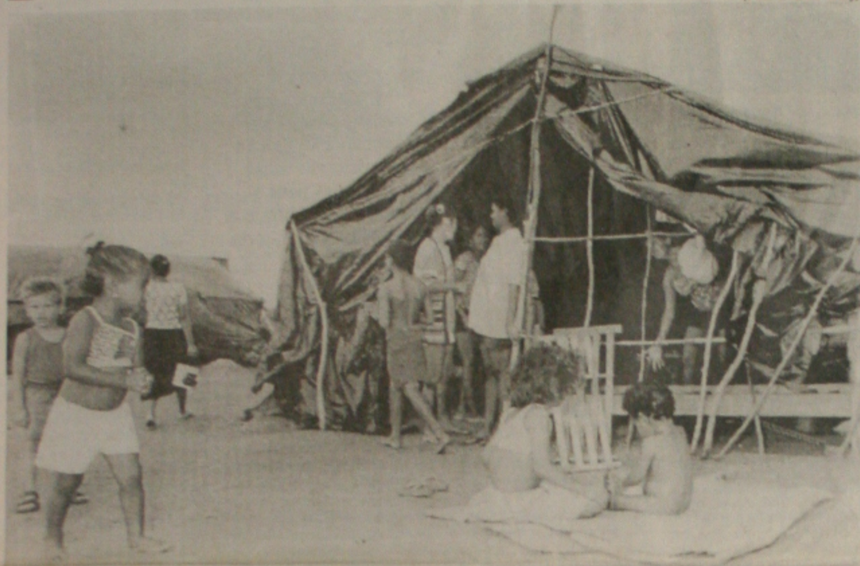
Famílias que ocuparam uma área na Euclides Figueiredo aguardam definição sobre a legalização