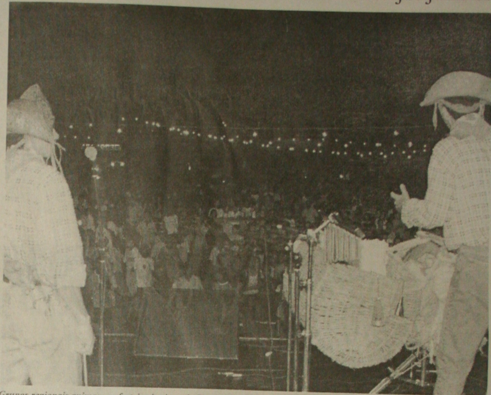
Grupos regionais animam os festejos juninos de São Cristóvão

"A quarta cidade mais antiga do Brasil é berço de todas as manifestações folclóricas"