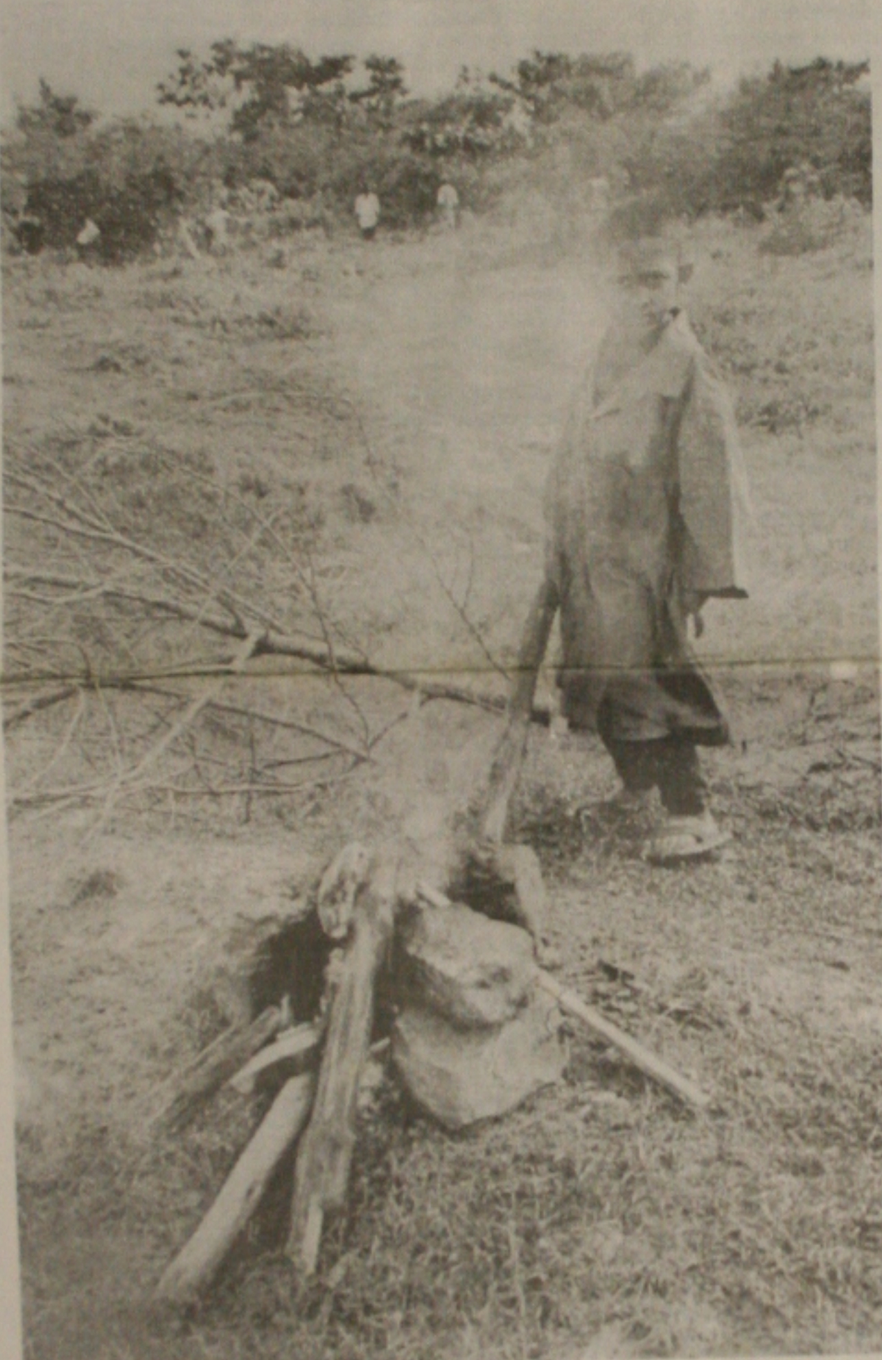
Na invasão, crianças vivem em precárias condições, junto aos pais, à espera de uma solução