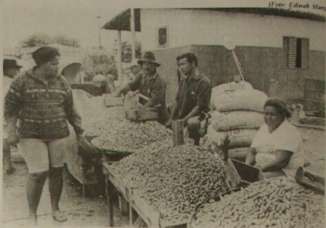
Produção de amendoim poderia ser maior, se houvesse irrigação