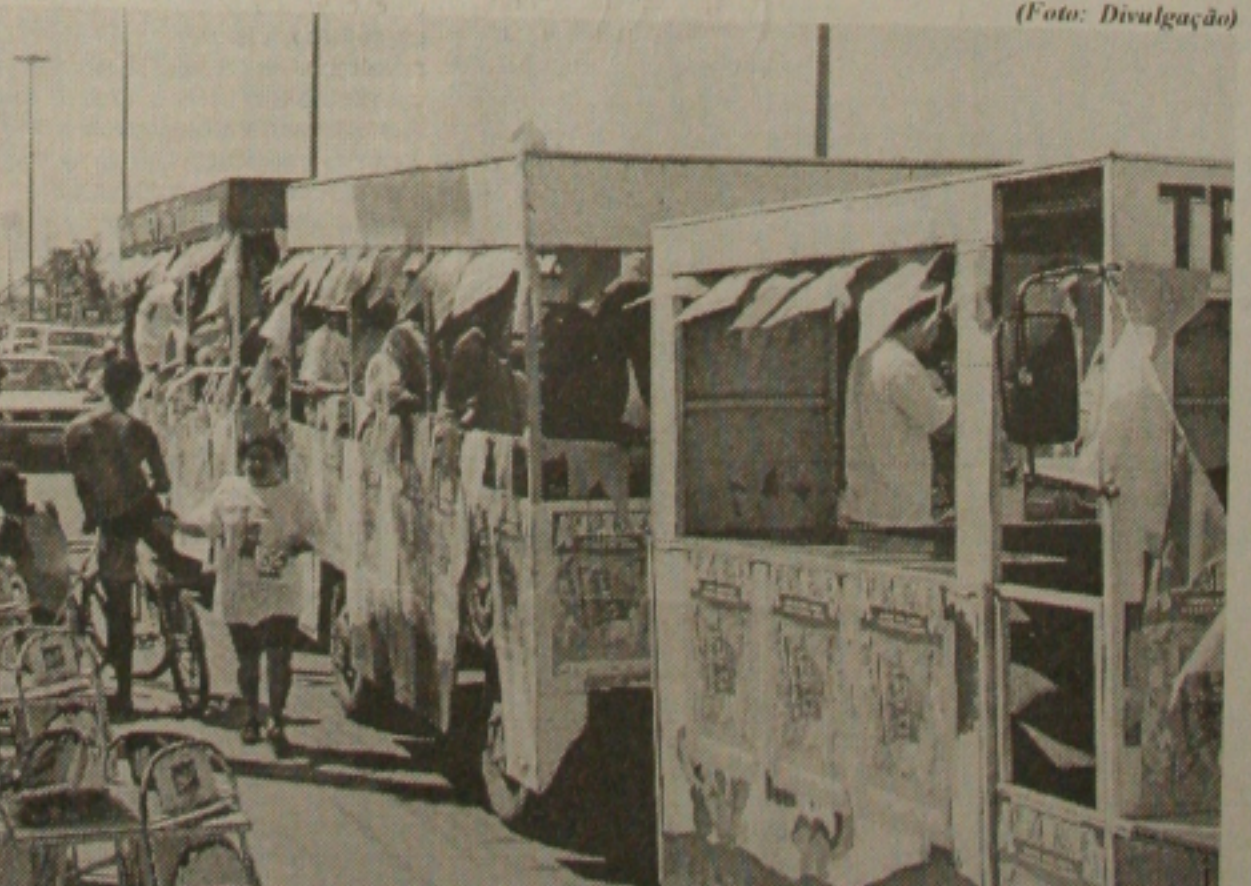
Festejos juninos têm sido um chamariz para turistas