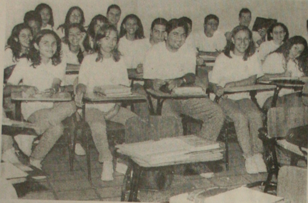
Os candidatos ao processo seletivo do vestibular têm prazo para fazer a inscrição da UFS