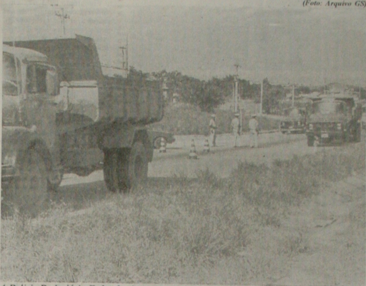
A Polícia Rodoviária Federal vai comemorar aniversário com campanha junto ao Hemose