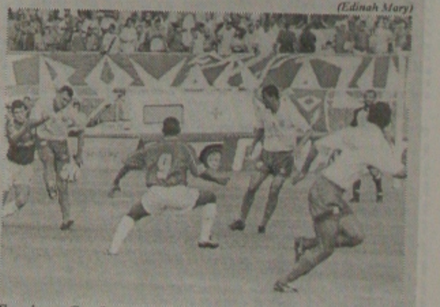
Sergipe e Confiança fizeram domingo um jogo de poucas emoções, empataram e adiaram a decisão do título

Ficou para o próximo domingo a decisão do Campeonato estadual de Futebol deste ano. Domingo (15), Sergipe e Confiança voltaram a empatar, adiando mais uma vez a definição da conquista do título. O time do Bairro Industrial no entanto terá a vantagem de jogar pelo empate. ram recordes: 14.521 pagantes para R$ 75.602,00. (Página 1C)