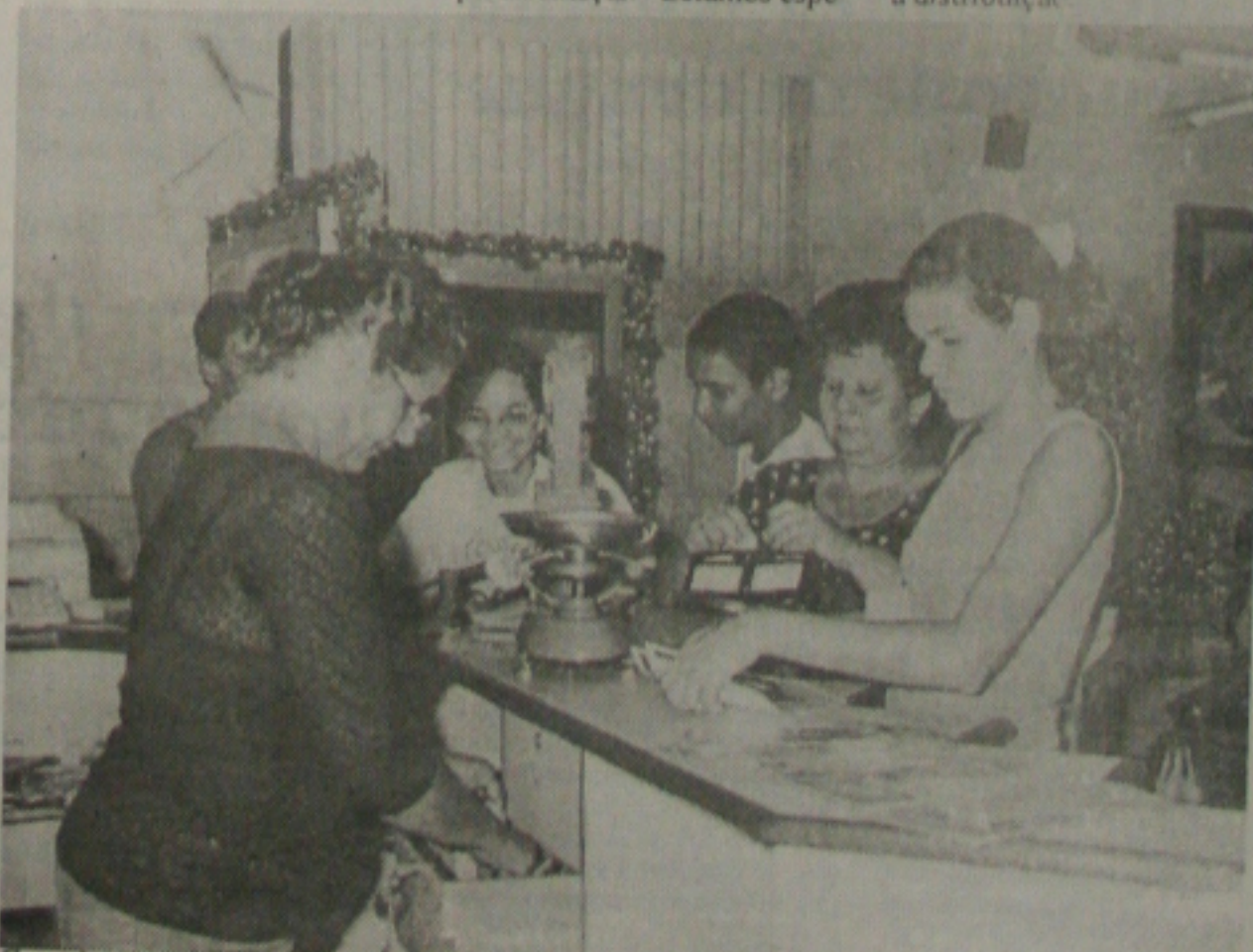
Correios recebem donativos para atender os flagelados da seca nos municípios do alto sertão

Pela determinação do órgão federal, o doador não desembolsará nada com o envio dos donativos, bastará escolher o município a ser beneficiado e a empresa, com o auxílio de entidades governamentais e organizações civis, fará a distribuição.