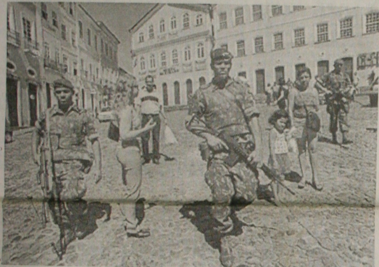
Soldados do Exército patrulham as ruas do Pelourinho, em Salvador, onde PM e governo ainda não chegaram a um acordo. (Página 8A)