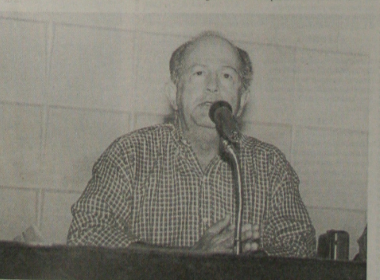
O governador Albano Franco realiza antigo sonho dos professores