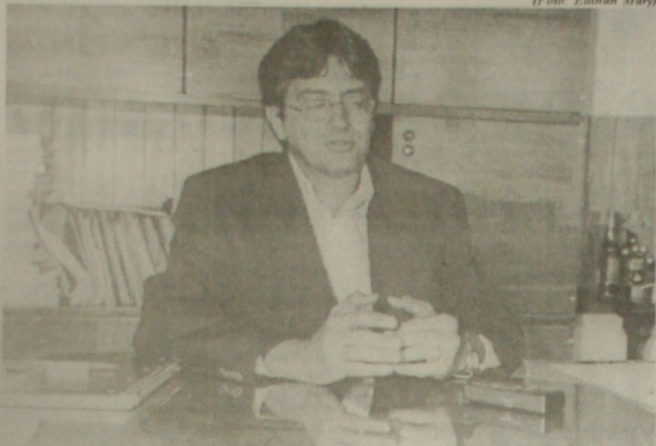
Modesto explica que as mudanças impostas pelo MEC não deverão prejudicar a UFS