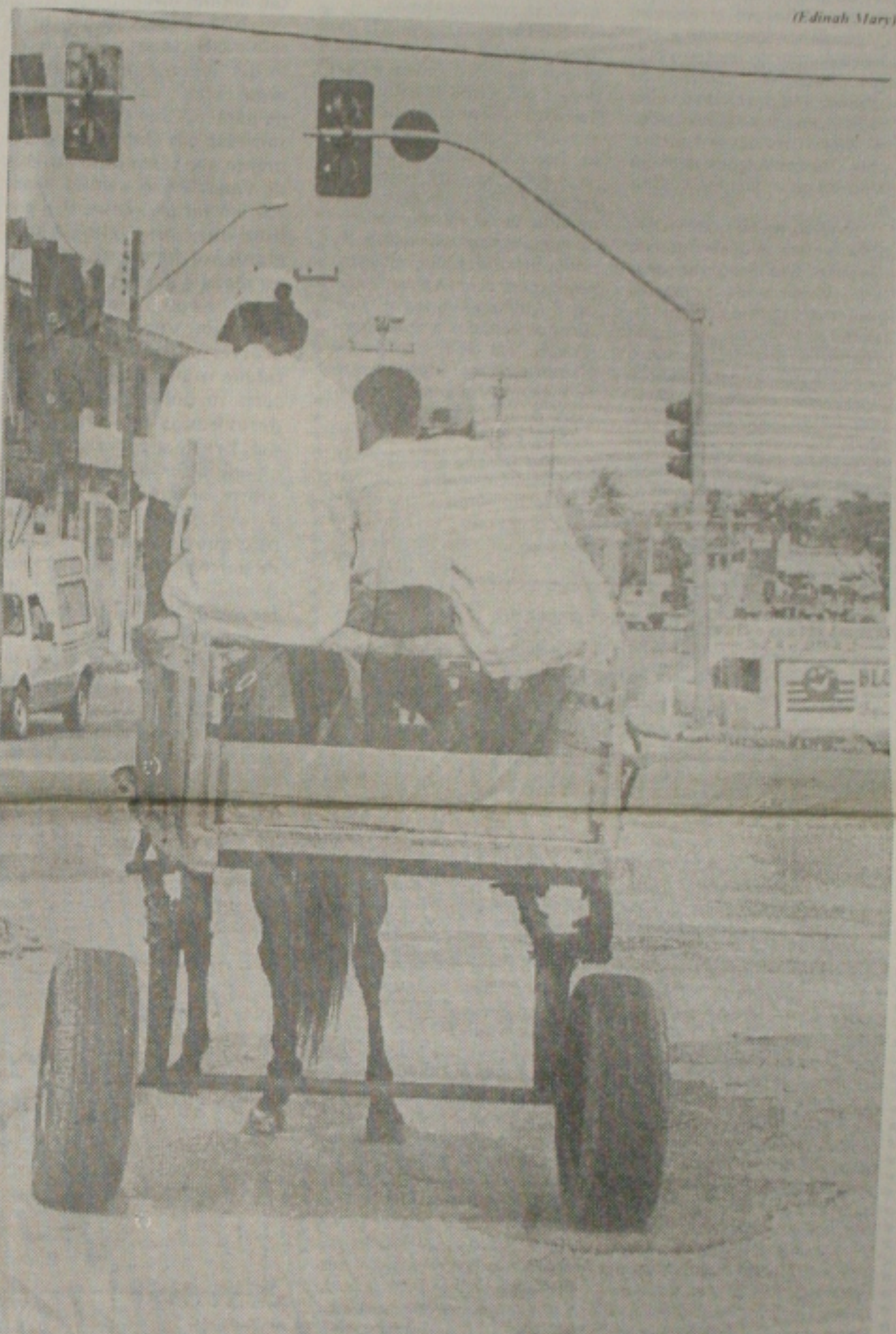
A SMTT só deve iniciar o cadastramento dos carroceiros que circulam na cidade no próximo ano, a fim de disciplinar o tráfego dos veículos de tração animal. (Página 1B)