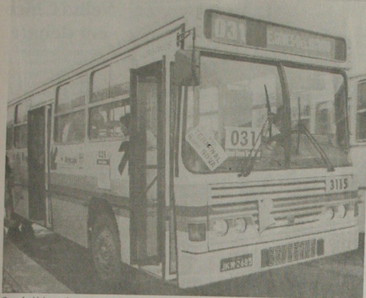
Os rodoviários podem cruzar os braços se a SMTT não instalar os tacógrafos nos ônibus urbanos

M otoristas e cobradores de ônibus coletivos da capital sergipana ameaçam parar suas atividades, caso a Superintendência Municipal de Transporte e Trânsito (SMTT) não coloque em prática os tacógrafos - um relógio que marca a chegada, saída e a velocidade do veículo. A decisão foi tomada ontem em assembleia-geral, realizada na sede do Sindicato dos Rodoviários do Estado de Sergipe. Os trabalhadores estão recebendo multas abusivas porque os fiscais da SMTT se guiam pelos seus relógios próprios e aplicam as infrações desnecessárias.