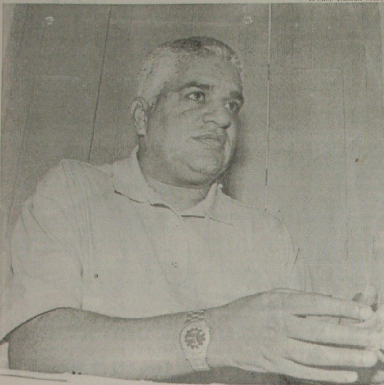
Silvio Santos diz que relação do PT com Gilmar foi traumática.