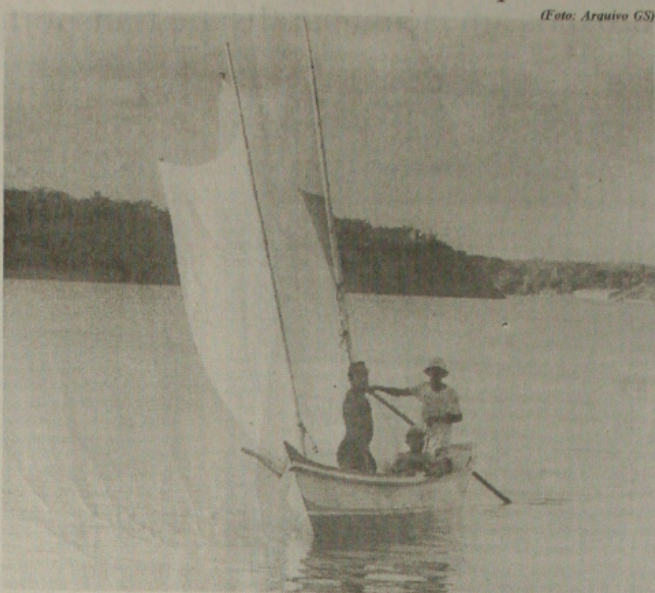
A problemática do Rio São Francisco estará em discussão amanhã durante fórum da OAB