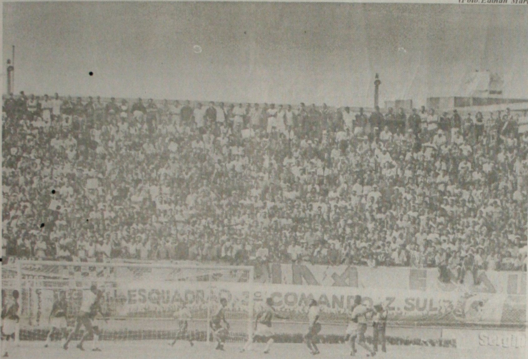
As torcidas fizeram a festa no clássico e fecharam o anel das arquibancadas do Batistão