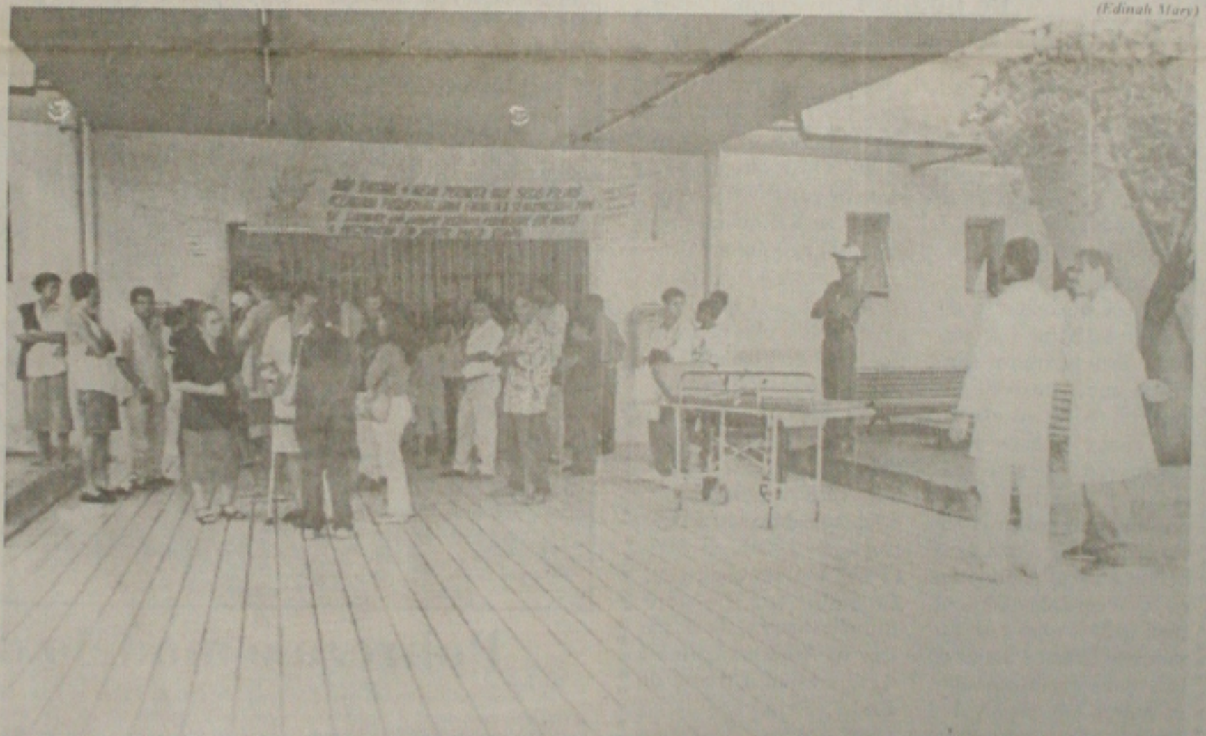
Diariamente, o Hospital João Alves, o maior da capital, recebe dezenas de pacientes de outros Estados, principalmente da Bahia

verão estar fardados. A assembleia deve confirmar o retorno ao trabalho. Até a tarde de hoje, os grevistas estavam divididos sobre o fim da paralisação. Os civis defendiam o retorno imediato ao trabalho, em respeito à sociedade, mas propunham a rejeição total da proposta do governo. (Página 7A)