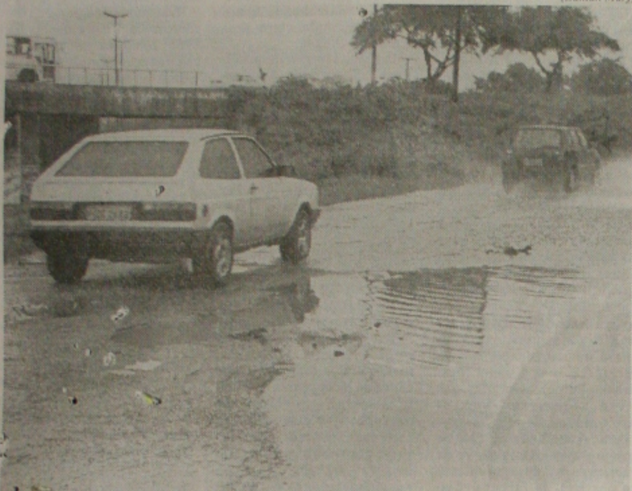
As chuvas que caíram nos últimos dias transformaram Aracaju numa verdadeira "tábua de pilulitos", com o surgimento de inúmeros buracos em diversas ruas. (Página 2B)

STJ concede habeas-corpus a juiz; donos da Incal também ganham direito à liberdade