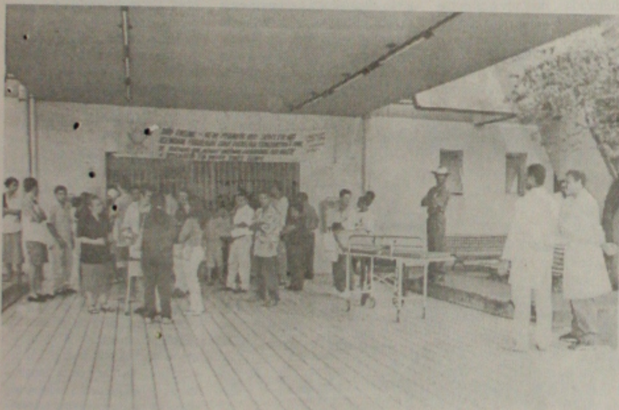
Diariamente o hospital João Alves recebe pacientes procedentes de outros Estados, que na maioria...