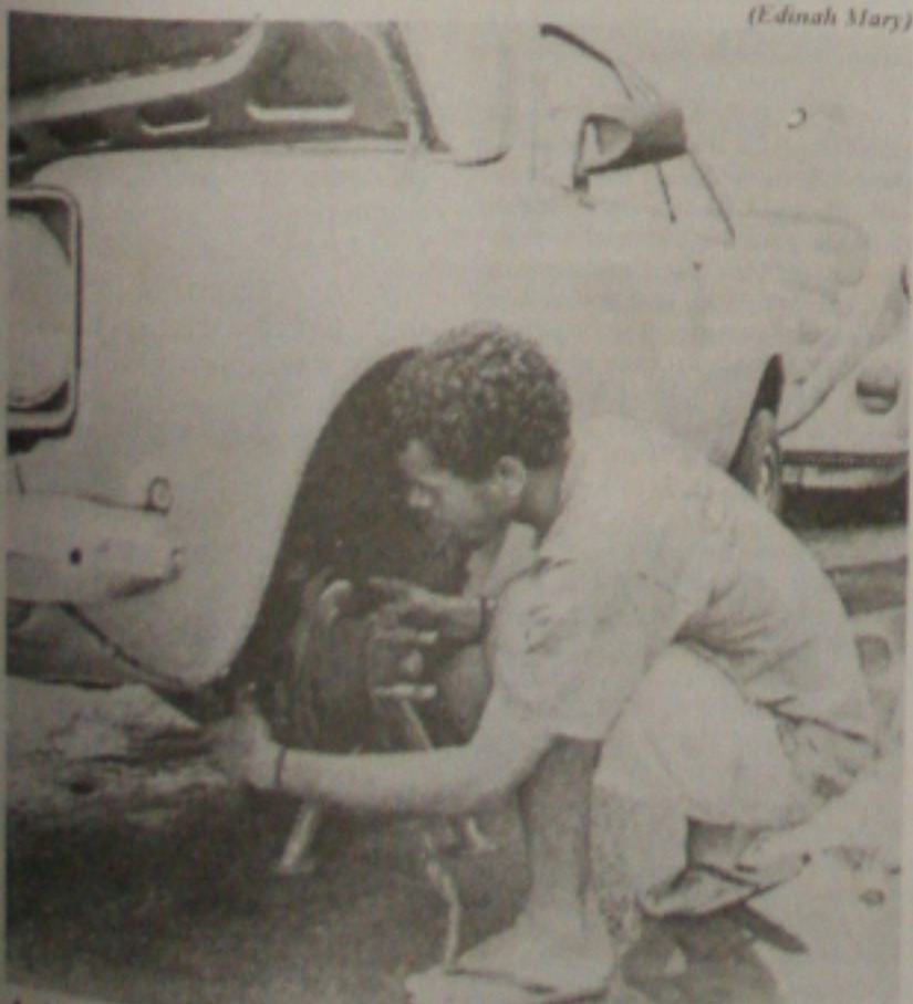
A situação precária da malha viária da cidade vem garantindo bons lucros a oficinas e mecânicos autônomos e prejuízos para os donos de veículos. (Página 2B)

O prefeito de Aracaju, Marcelo Déda (PT) admitiu ontem, em entrevista a uma emissora de TV, que nos próximos dias deve promover um remanejamento entre o secretariado municipal. "Mas ninguém sairá da equipe, apenas de posição", garantiu Déda. (Página 3A)