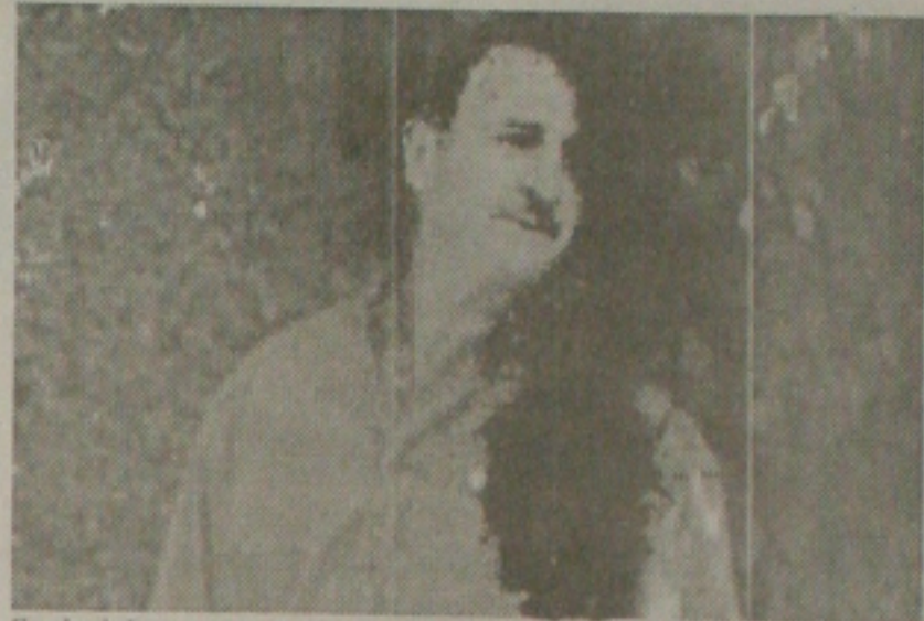
Scolari deve manter o mesmo esquema tático utilizado com o Peru