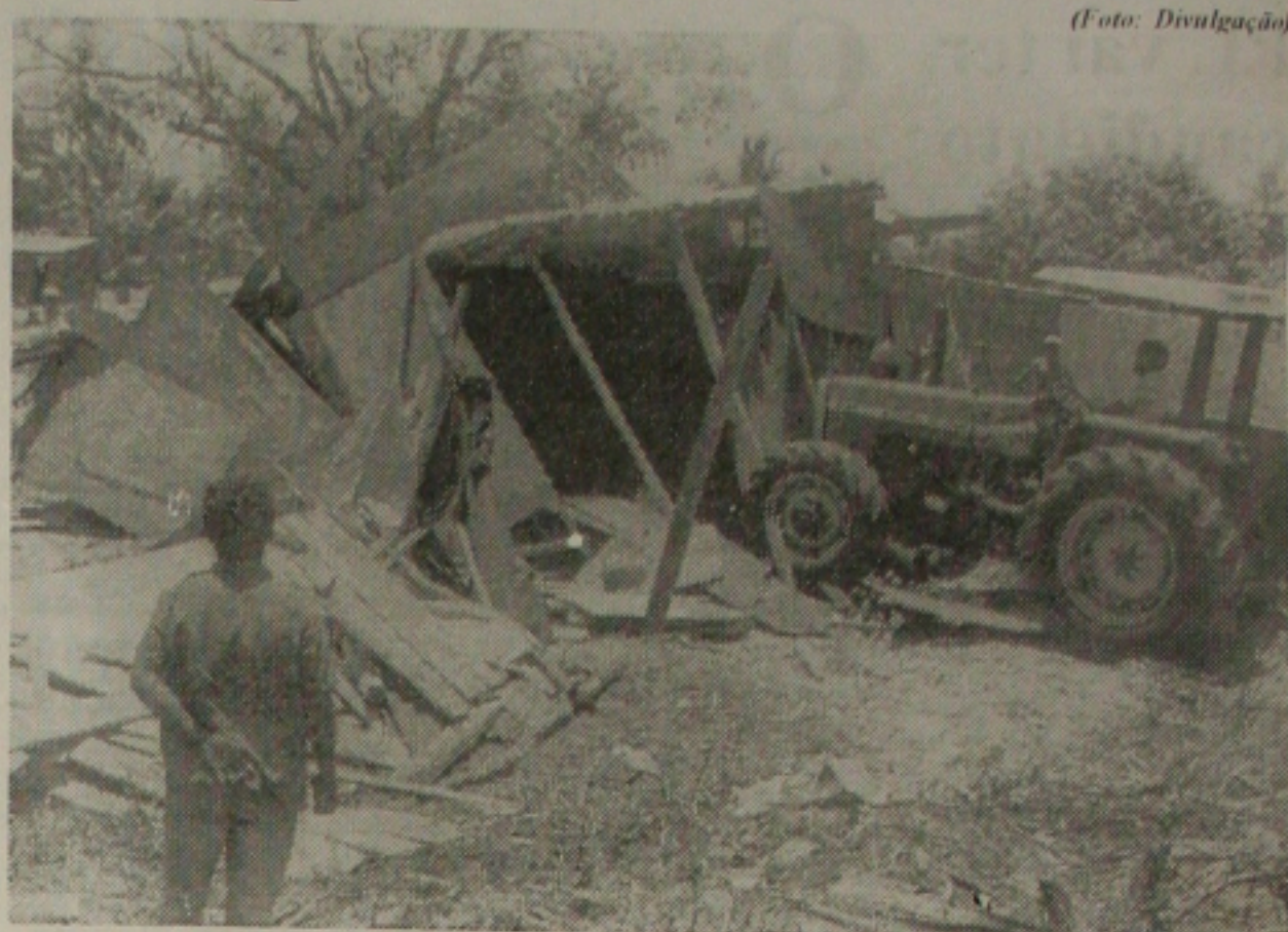
Lúcia assegura que famílias não terão mais tratores destruindo barracos. Isso é coisa de governo passado

Essas pessoas perderam os barracos, porque um cidadão chegou e encontrou sua esposa com outro e com raiva tocou fogo no barraco, fazendo