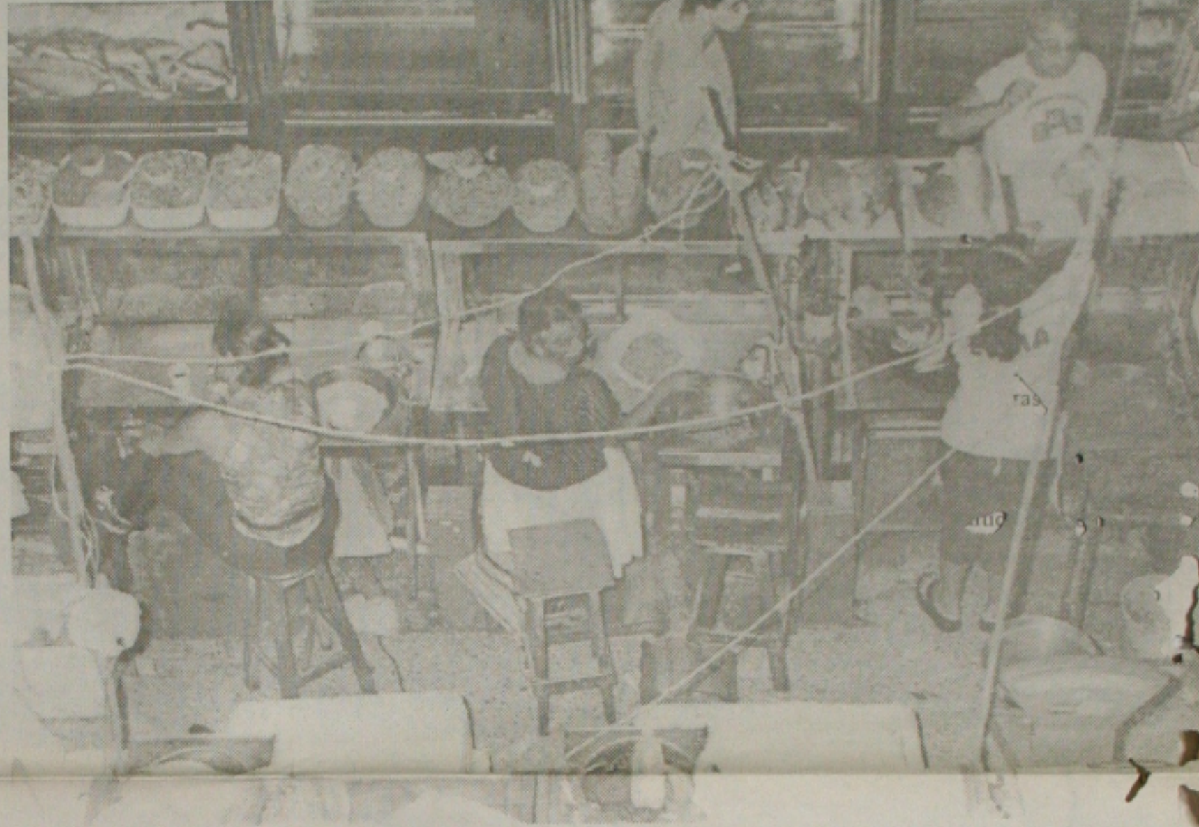
A qualidade do pescado vendido no mercado Albano Franco deixa a desejar por falta de câmara frigorífica