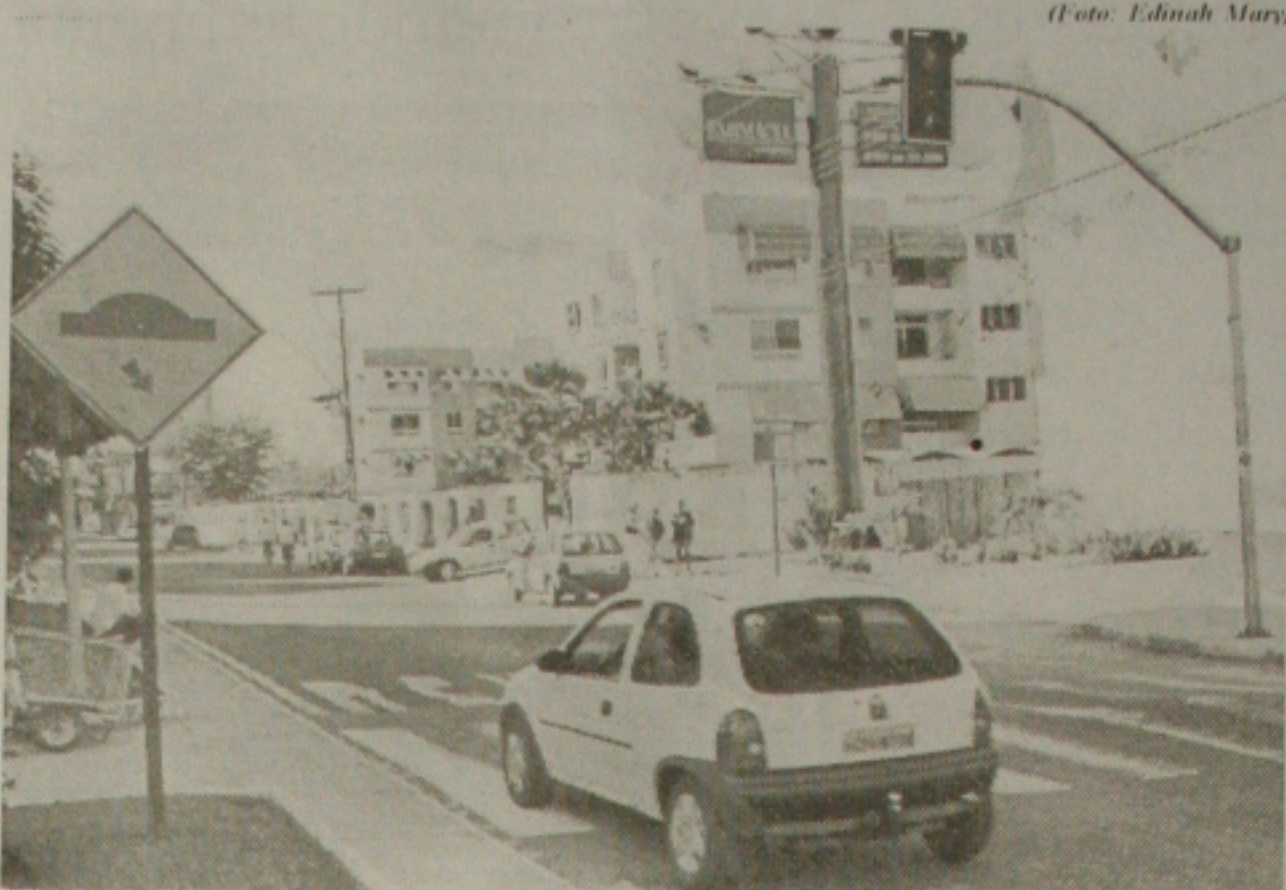
A SMTT começa a recuperar a sinalização e quebra-molas de algumas avenidas de Aracaju

O governador também atendeu o pedido de uma outra criança moradora do conjunto Padre Pedro, antiga Terra Dura, que sonhava em ter uma boneca grande e uma roupa nova para vestir. Após a entrega dos presentes, Albano Franco autorizou ao seu motorista para que fossem deixar as crianças e suas mães em suas residências.