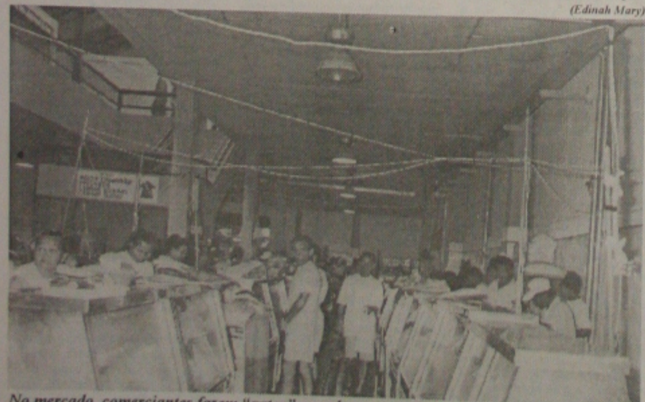
No mercado, comerciantes fazem "gatos" para levar energia às câmaras frigoríficas