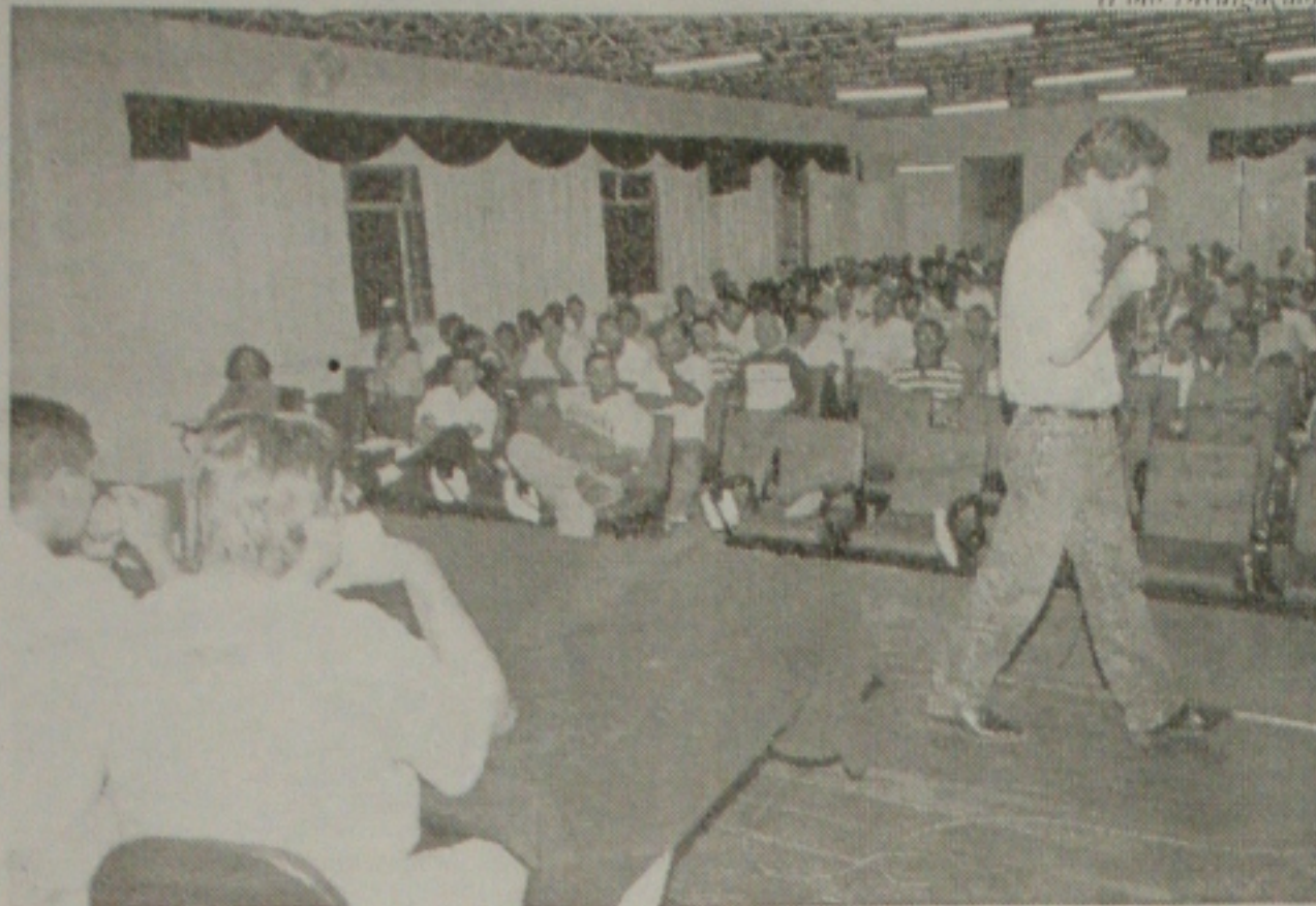
Em assembleia, os eletricitários discutem a terceirização de serviços pela Energipe.

Ela esteve reunida com técnicos das Secretarias de Ação Social do Estado e do município, quando observou o empenho e o esforço de todos em querer superar as situações e resolver os