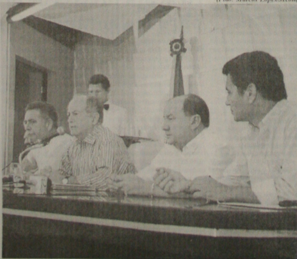
Governador disse que novas empresas são verdadeiras grifes.