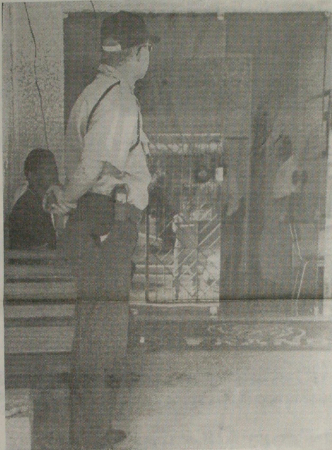
Empresas contratam seguranças particulares por causa da ineficiência da polícia do Estado