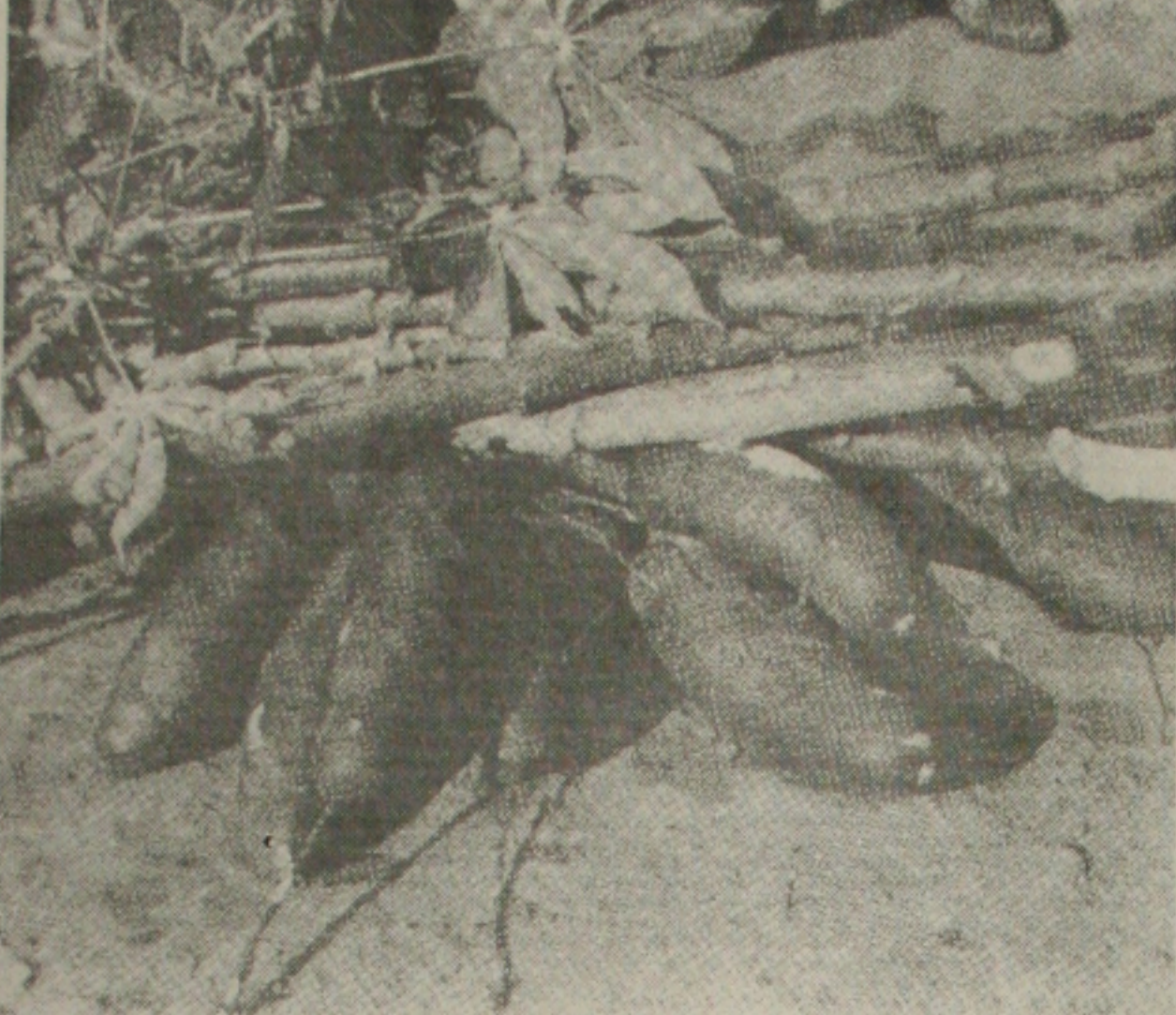
As novas variedades de mandioca ajudarão os pequenos agricultores com o fim do apodrecimento

Sebrae quer capacitar mais profissionais para atuar no setor de recursos humanos