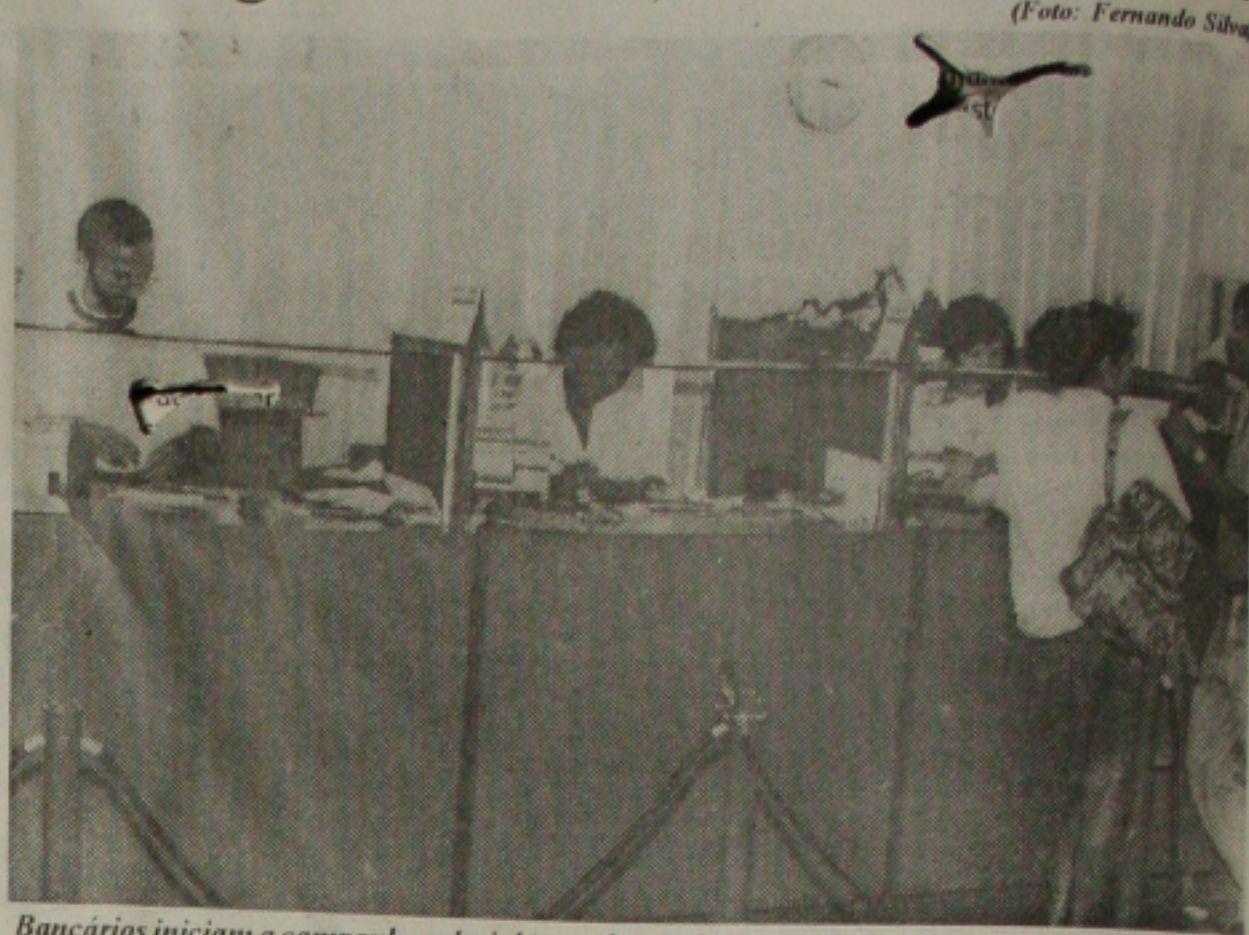
Bancários iniciam a campanha salarial em todo o País, apesar da demissão de 3,5 mil empregados

A previsão é que as propostas possam ser entregues à executiva nacional dos bancários até o dia 17 deste mês, quando serão encaminhadas à Federação Nacional dos Bancos (Fenabran) para serem analisadas. "A nossa grande luta a cada ano é permanecer com os direitos e avançar no processo de conquista de novos benefícios junto à classe patronal. Com o acordo deste ano não será diferente", diz o sindicalista.