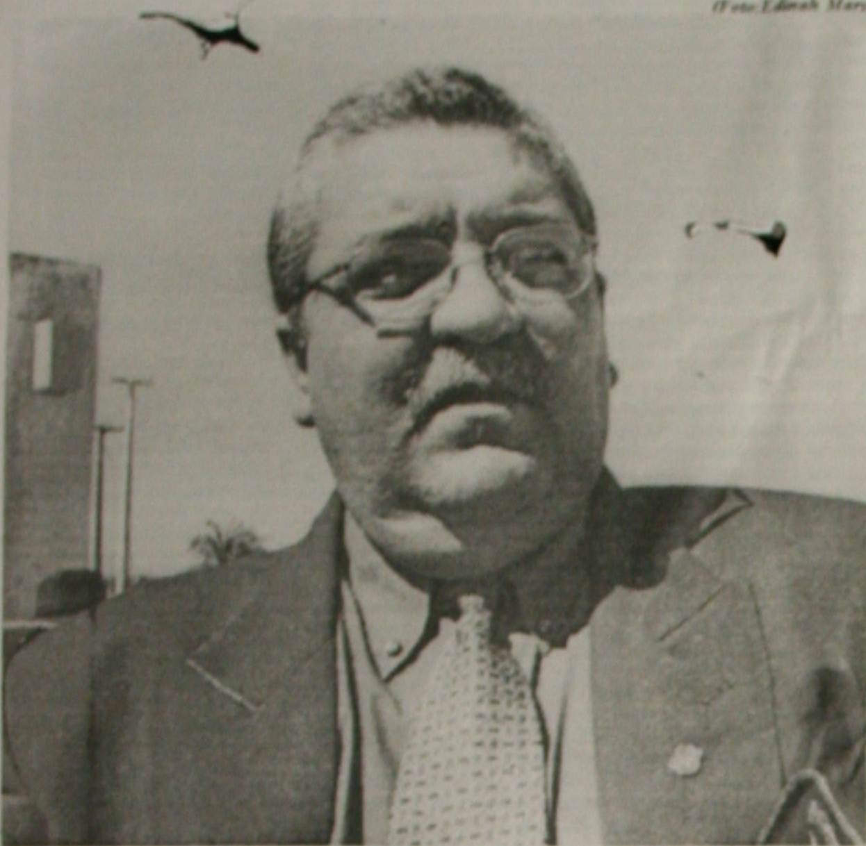
Marques acredita que o líder da quadrilha fardada seja pessoa importante