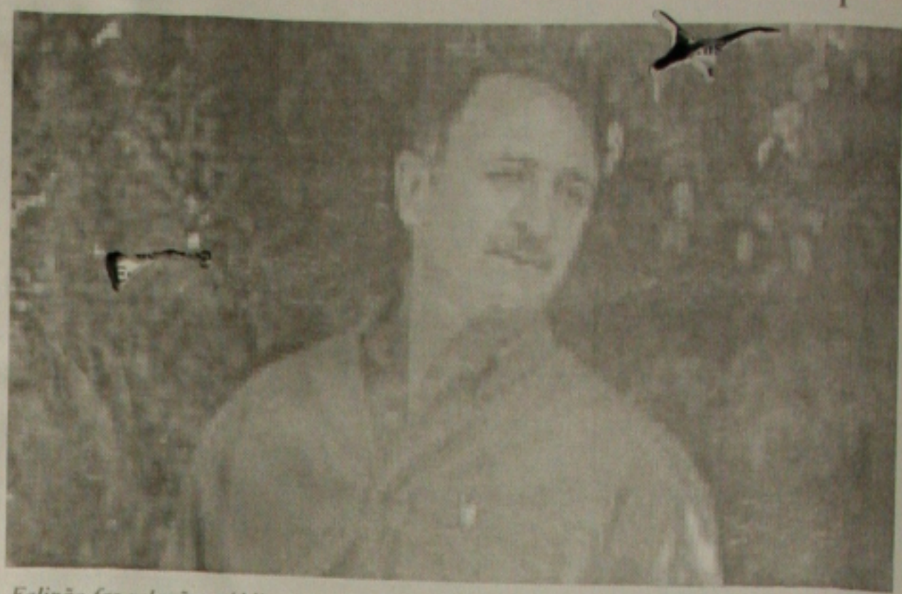
Felipão faz relações públicas para ter o apoio da torcida gaúcha

Felipão continua no Rio Grande do Sul, aproveitando para descansar e fazer relações públicas. Depois do apelo que fez para a torcida, em especial a gremista, lotar o Estádio Olímpico no dia 15, o técnico brasileiro visitou o Beira Rio na quarta-feira, durante o jogo de estreia entre Inter e Juventude pelo Campeonato Brasileiro. Passou pelos vestiários dos dois times e assistiu à partida das tribunas de honra, buscando cativar a torcida rival de seu antigo clube.