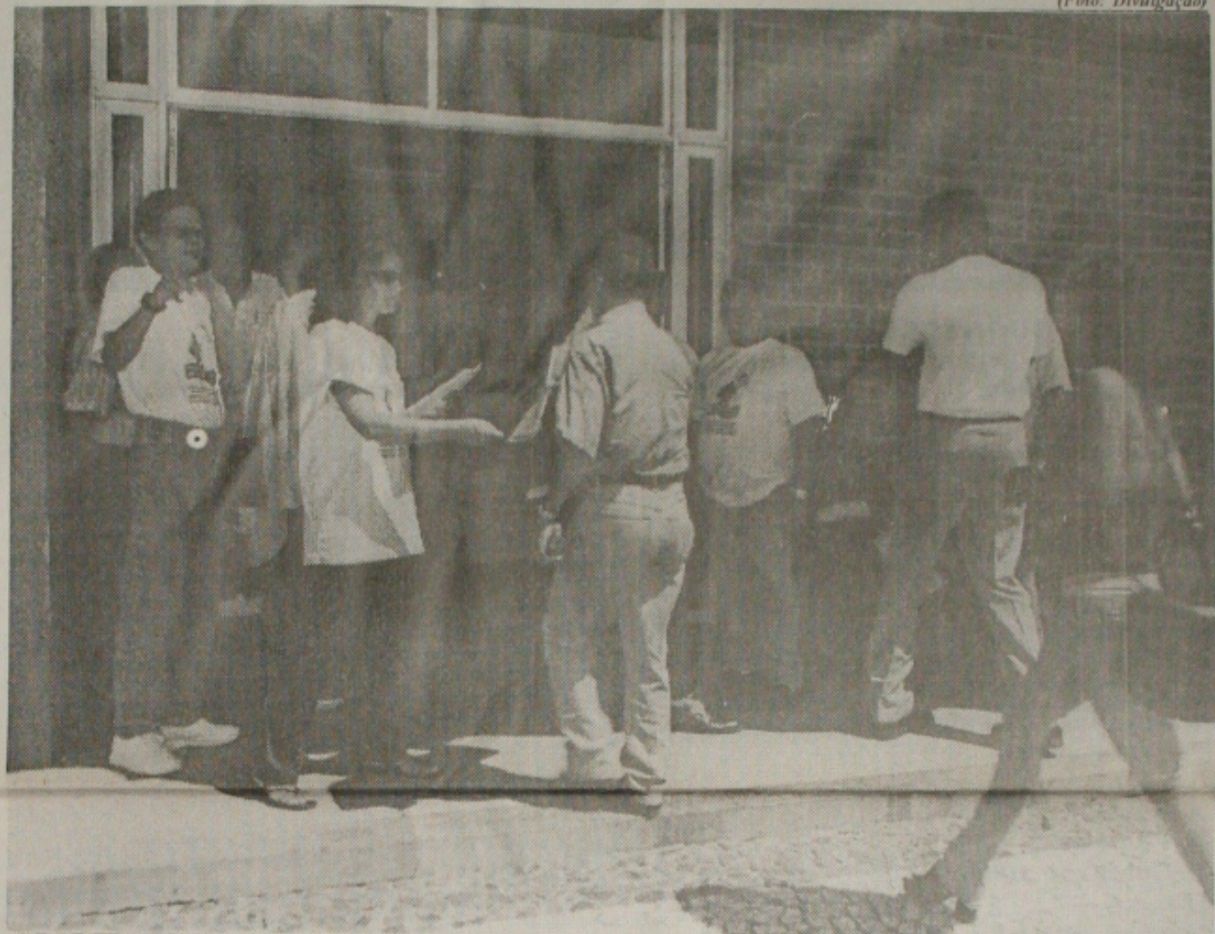
A Receita Federal começa a investigar empresas e pessoas físicas por sonegação fiscal em Sergipe

O diretor argumentou que a Petrobrás Brasileira S/A, - Petrobras e a Petros, deram um prazo muito curto para os funcionários pensarem e decidir sobre o assunto. Além de ser praticamente uma imposição, porque esse projeto já foi aprovado pelo departamento de estatais e já está na Secretaria de Previdência Complementar. "Isso passará a valer tanto para o pessoal da ativa, como para os aposentados, e entidades de classe como a Aspene. Eles alegam que o plano CD ou migratório, como eles chamam já existe nos Estados Unidos e Europa, só que lá são países desenvolvidos, onde os políticos e as leis são sérias. Aqui vivemos eternamente de emendas, sem contar que tudo que Fernando Henrique fez até hoje foi contra o trabalhador brasileiro. Estamos todos muito preocupados com isso, inclusive as pessoas competentes que analisaram esse plano até agora, só viram desvantagens. Por isso, o Sindicato dos Petroleiros e a Anap estão trazendo pessoas de várias partes do Brasil, para que possam nos orientar", concluiu.