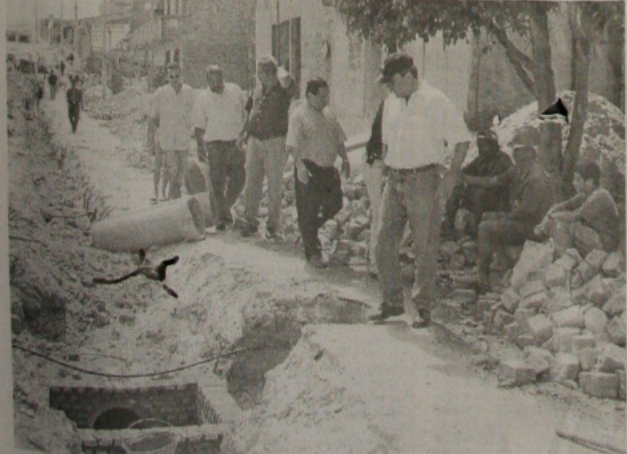
O prefeito Marcelo Déda observa obra de drenagem que a PMA executa na cidade

Somente no primeiro dia de funcionamento do Centro de Atendimento ao Cidadão - Ceac, no Shopping Riomar, foram atendidas 499 pessoas. A expectativa é de que nos próximos dias esse número passe para 2 mil pessoas. O Ceac funciona das 10h30 às 22 horas, e estão disponíveis o atendimento de unidades administrativas dos governos federal, estadual e municipal, e também do Poder Judiciário. Além das instalações modernas, o Ceac coloca à disposição dos interessados um sistema de telemarketing, com o número 0887037979, onde as pessoas poderão obter informações sobre todos os serviços disponíveis, ou pela Internet, no endereço, www.ceac.se.gov.br