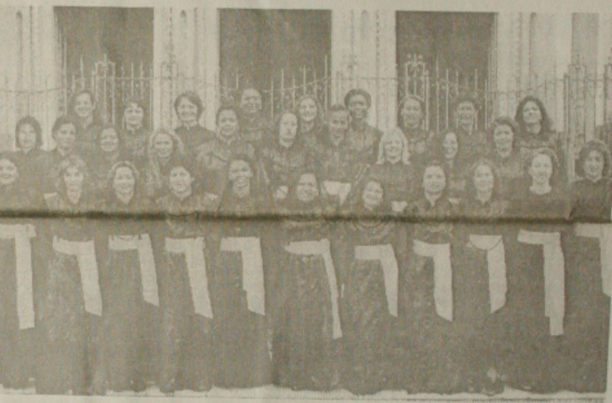
A partir de hoje, ex-alunos têm novo papel na engrenagem social

Explica que as pessoas que vivem sempre gripadas, podem estar com uma manifestação de alergia respiratória e tem que se cuidar, para evitar os malefícios das consequências alérgicas. Insiste a médica de que cuidar bem do ambiente que se vive, sobretudo, limpeza total, é essencial. (Cláudio Messias)