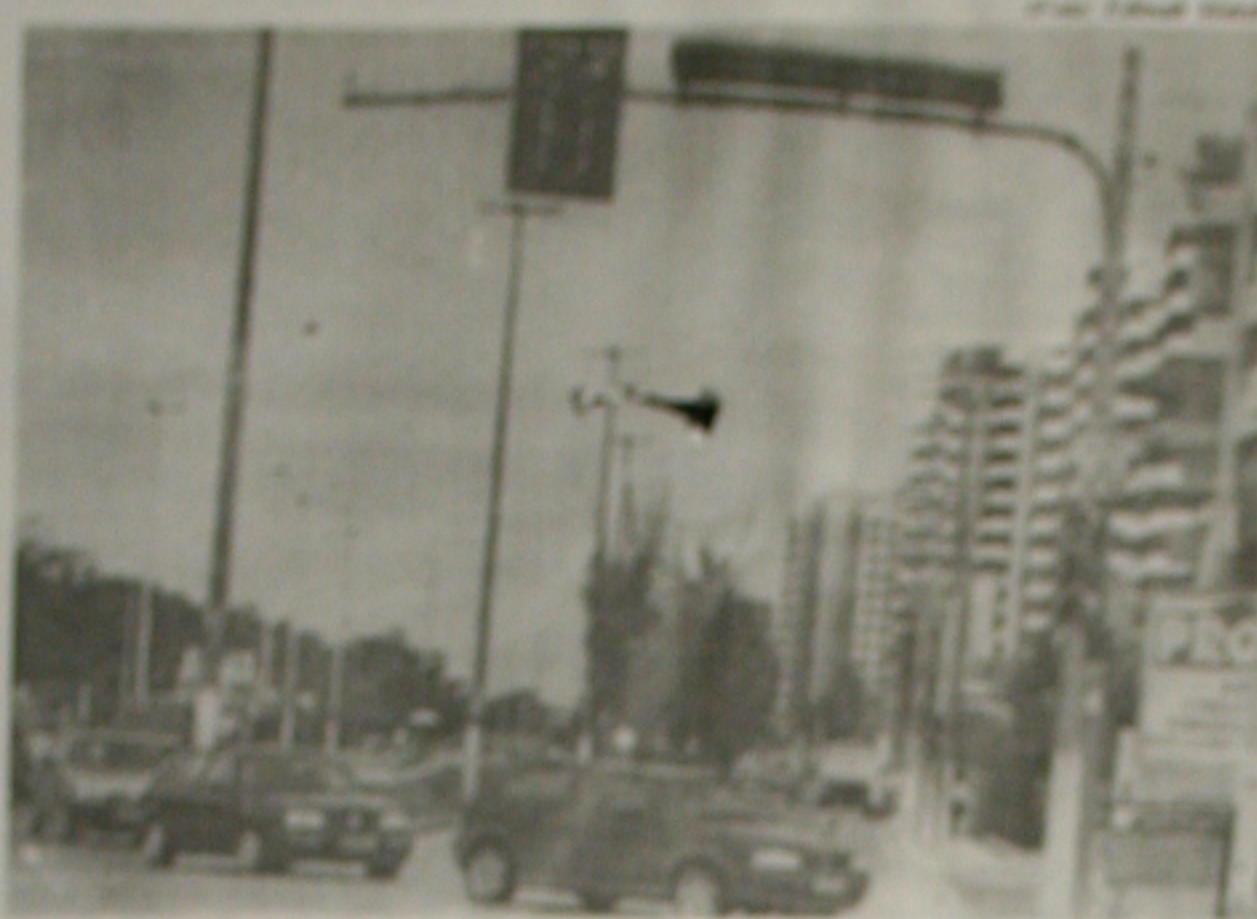
A iluminação pública de Sergipe é contra a que a população paga pela taxa de iluminação pública