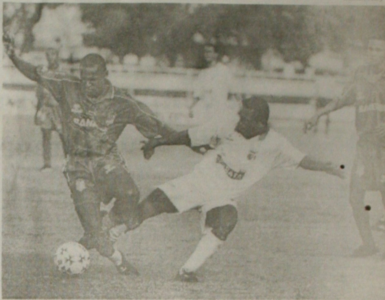
O Sergipe escala três zagueiros para enfrentar o ASA