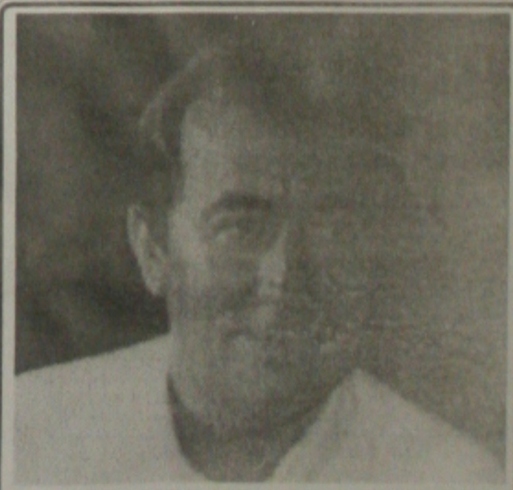
O Secretário de Estado da Educação, Nilson Barreto Socorro, é o mais novo bacharel em direito. Cola grau no próximo dia 11 de agosto. Congratulations!

O Presidente da ABAV Nacional Goiás Guimarães, aposta fortemente numa participação gigante de todos os Estados no XXIX Congresso Brasileiro de Agências de Viagens, que acontecerá no período de 12 a 16 de setembro, em Brasília. O evento, que terá como tema "Turismo Brasileiro, Um Gigante em Movimento" já conta com inscrições abertas na ABAV/Sergipe. Contatos: 214-2564.