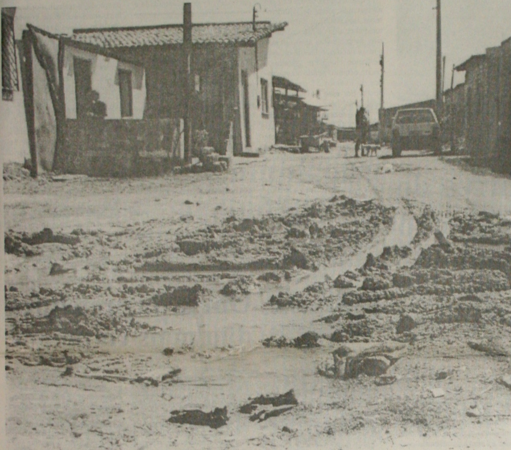
Trafegar pelo loteamento Anchieta no período chuvoso é preciso muita coragem por causa do lamaçal

A população do Loteamento Anchieta, localizado no Bairro Bugio, está enfrentando sérios problemas com a falta de saneamento básico no local. A situação mais grave vem ocorrendo com um grupo de moradores que residem na Rua Beira Rio. Entre a aglomeração de casas e barracos instalados na área se formou uma imensa lagoa de água de esgoto provocando doenças na comunidade.