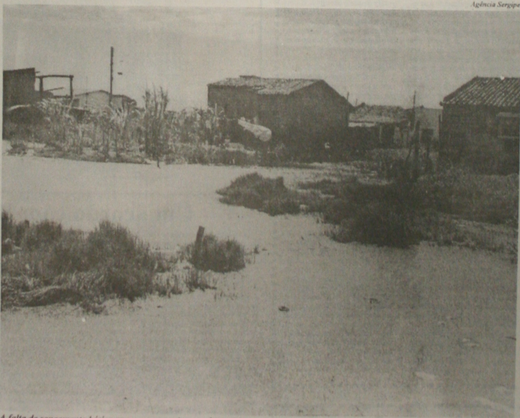
A falta de saneamento básico provocou o surgimento de uma lagoa no loteamento Anchieta, causando doenças. (Página 1-B)