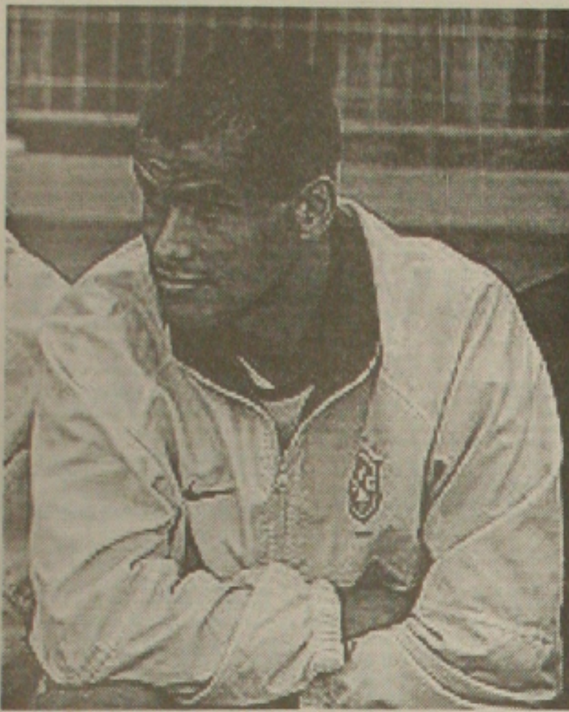
Rivaldo inicia recuperação do seu joelho hoje

Treinador da seleção brasileira espera apoio para compromissos das eliminatórias