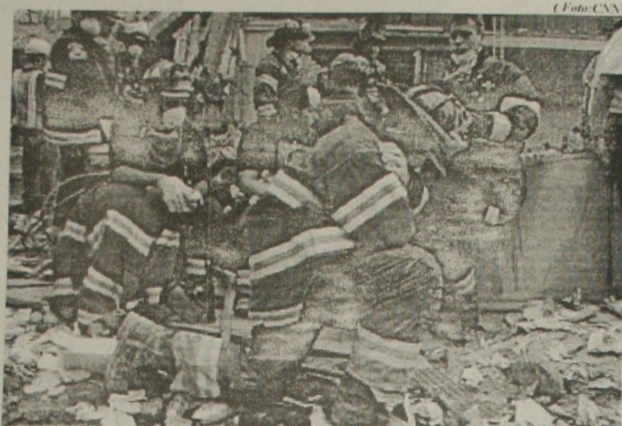
Bombeiros choram quando conseguem resgatar os cinco companheiros...

A Continental Airlines, outra companhia que opera Brasil-EUA, confirmou que os voos do País com destino ao território norte-americano continuam suspensos. A prioridade da companhia é transportar os passageiros que tiveram seus voos deslocados para outras localidades em razão dos ataques terroristas que abalaram os Estados Unidos na última terça-feira.