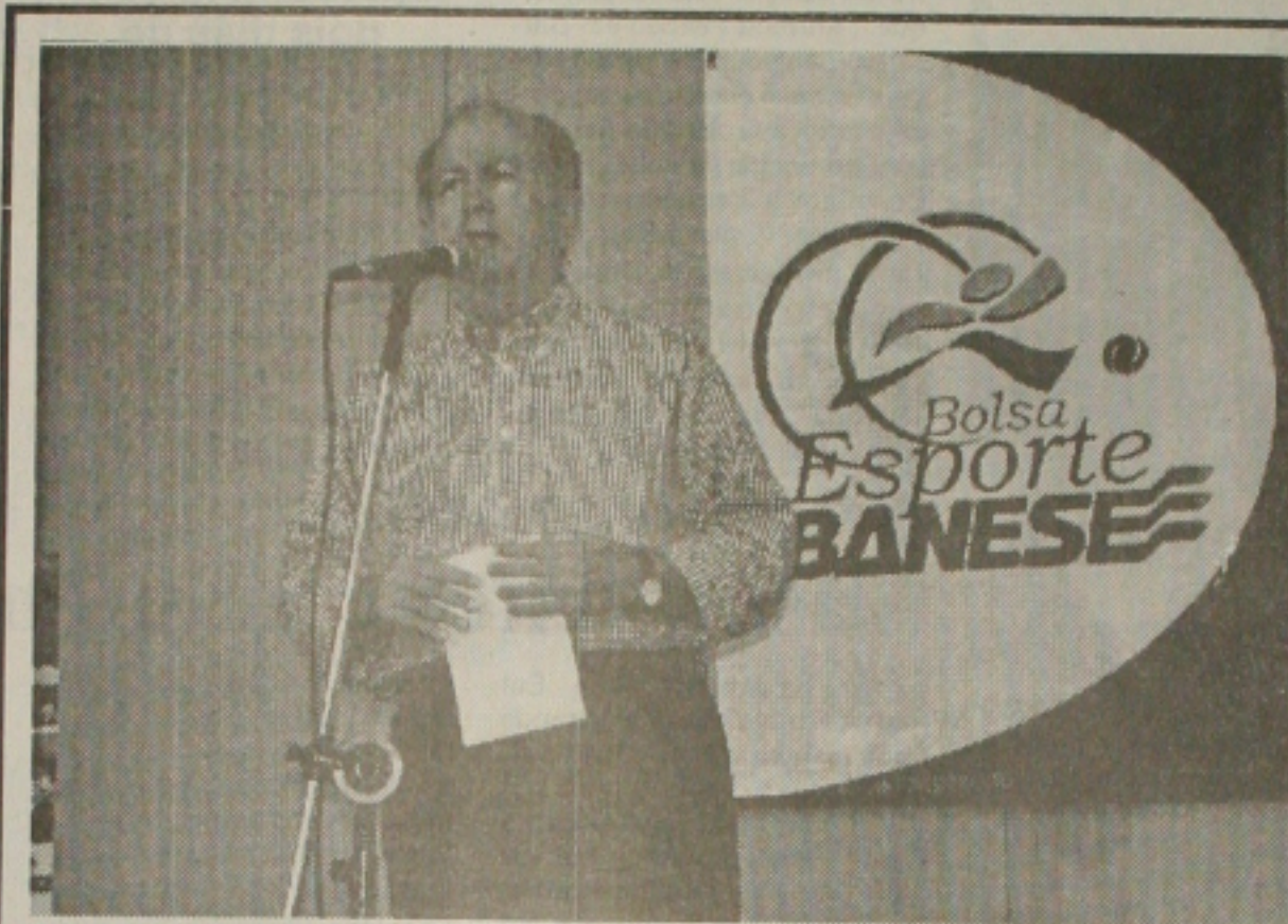
O governador Albano Franco vai presidir esta noite no CIC, a solenidade de assinatura de convênio entre o Banese e Sergipe e Confiança.

Paralelas às disputas da capital serão realizados os jogos no interior, a fase de classificação, aproveitando-se os finais de semana. No dia 14 de setembro, serão realizados os jogos na cidade de Lagarto. Dia 17 em Estância e no dia 21 nas cidades de Itabaiana, Gararu, Dolores, Gloria, Socorro, São Cristóvão e Laranjeiras. As equipes classificadas nos jogos do interior, em cada modalidade esportiva participarão da fase final dos jogos na capital.