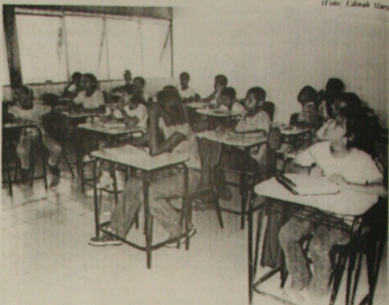
Redução do número de alunos em sala garante ensino de boa qualidade

Diz que foram construídas mais três salas de aula, a fim de o complexo do Sesi, que tinha 14 salas, melhorasse o conforto para os alunos. Cuidamos da iluminação do