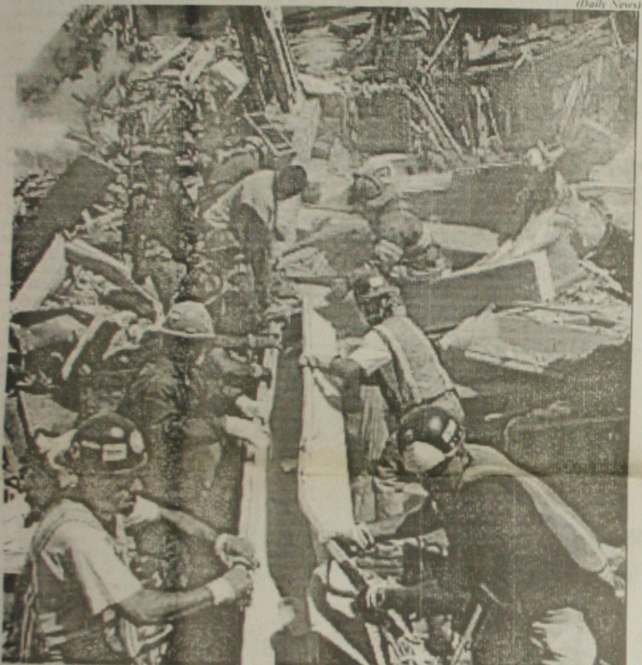
Equipes de resgates continuavam ontem intensamente os trabalhos de buscas a sobreviventes em meio aos escombros do WTC

Governo concede 10% de reajuste a funcionalismo e eleva contribuição