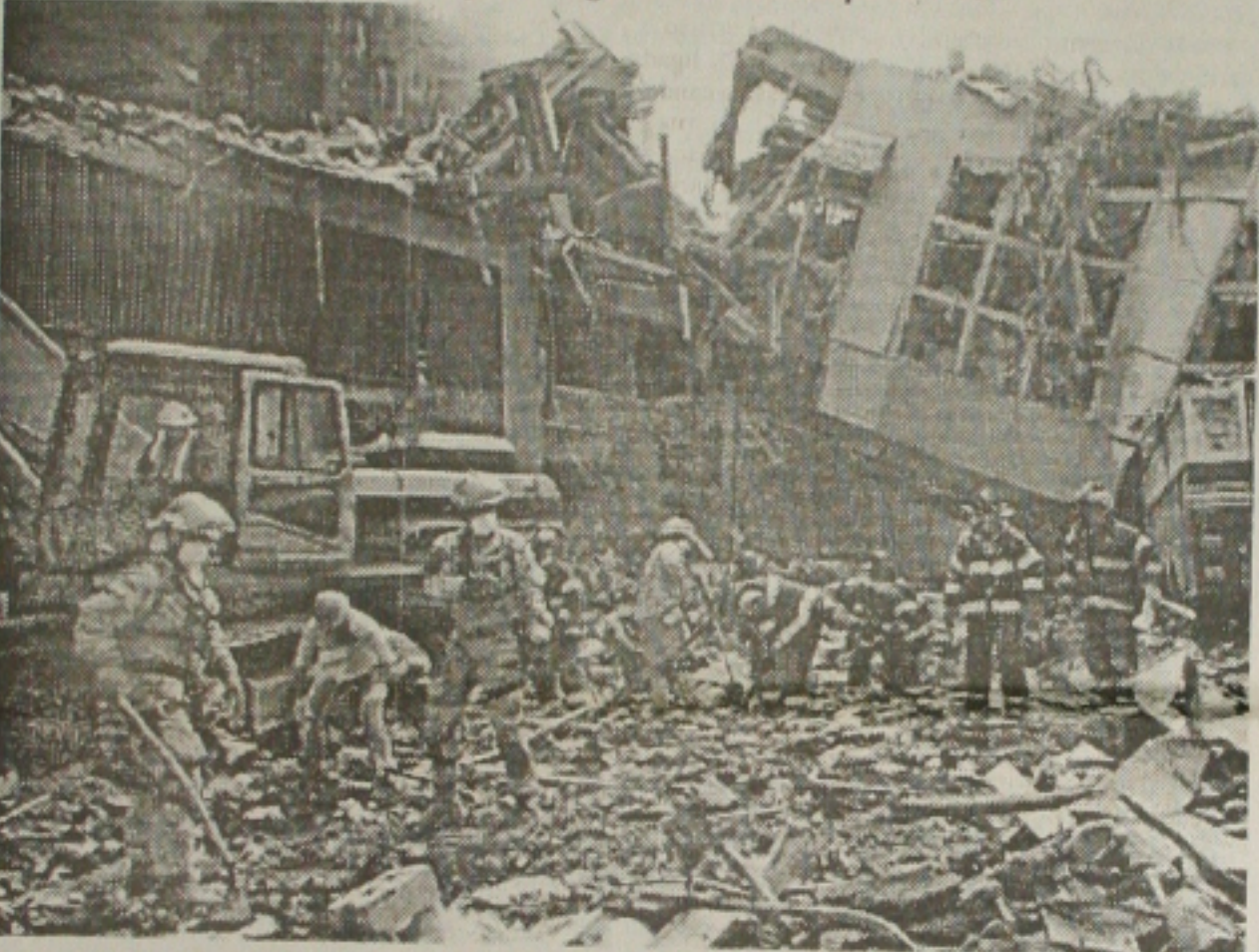
... depois retornam ao trabalho para tentar encontrar outros sobreviventes