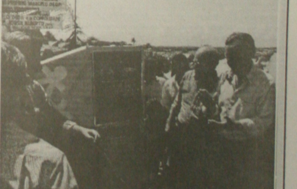
Pela manhã, o ministro acompanhou o governador e demais autoridades na Coroa do Meio...

Orçada em R$ 12 milhões, a ponte sobre o Rio do Sal, que ligará Aracaju ao município de Socorro, finalmente vai sair do papel. O contrato para a liberação dos recursos destinados à construção da ponte foi assinado na tarde de ontem, no Palácio de Despachos, pelo governador Albano Franco, o ministro do Desenvolvimento Regional, Ovidio de Angelis. Prestigiaram a so-