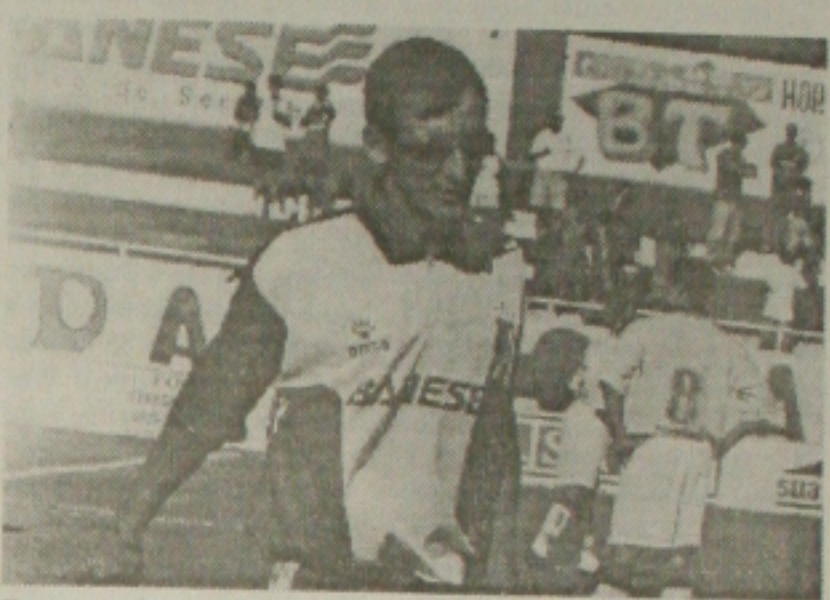
Cruz prepara o time a partir de hoje para o jogo com o América

O governo encaminhou ontem à Assembleia Legislativa projetos de lei concedendo reajuste salarial de 10% para os servidores cujos vencimentos não tiveram aumento desde abril de 1995. Pelo projeto, ficam de fora categorias como os policiais militares, civis, professores e procuradores. Em outro projeto, o governo eleva de 8% para 10% as alíquotas de contribuição ao Instituto de Previdência do Estado de Sergipe (IPES) recolhidas pelo empregador e pelo funcionalismo. Além dessa taxa, ainda são descontados do salário do servidor 4% para o Ipes-Saúde e 3% para o Funaserp (Fundo de Aposentadoria dos Servidores Públicos). Com isso, o total de descontos será de 17%. "Não é o aumento que o governo gostaria de dar. Mas foi a saída encontrada para refrescar o bolso dos servidores e viabilizar o Ipes", justificou o líder do governo na Assembleia, deputado Ulices Andrade. (Página 3A)