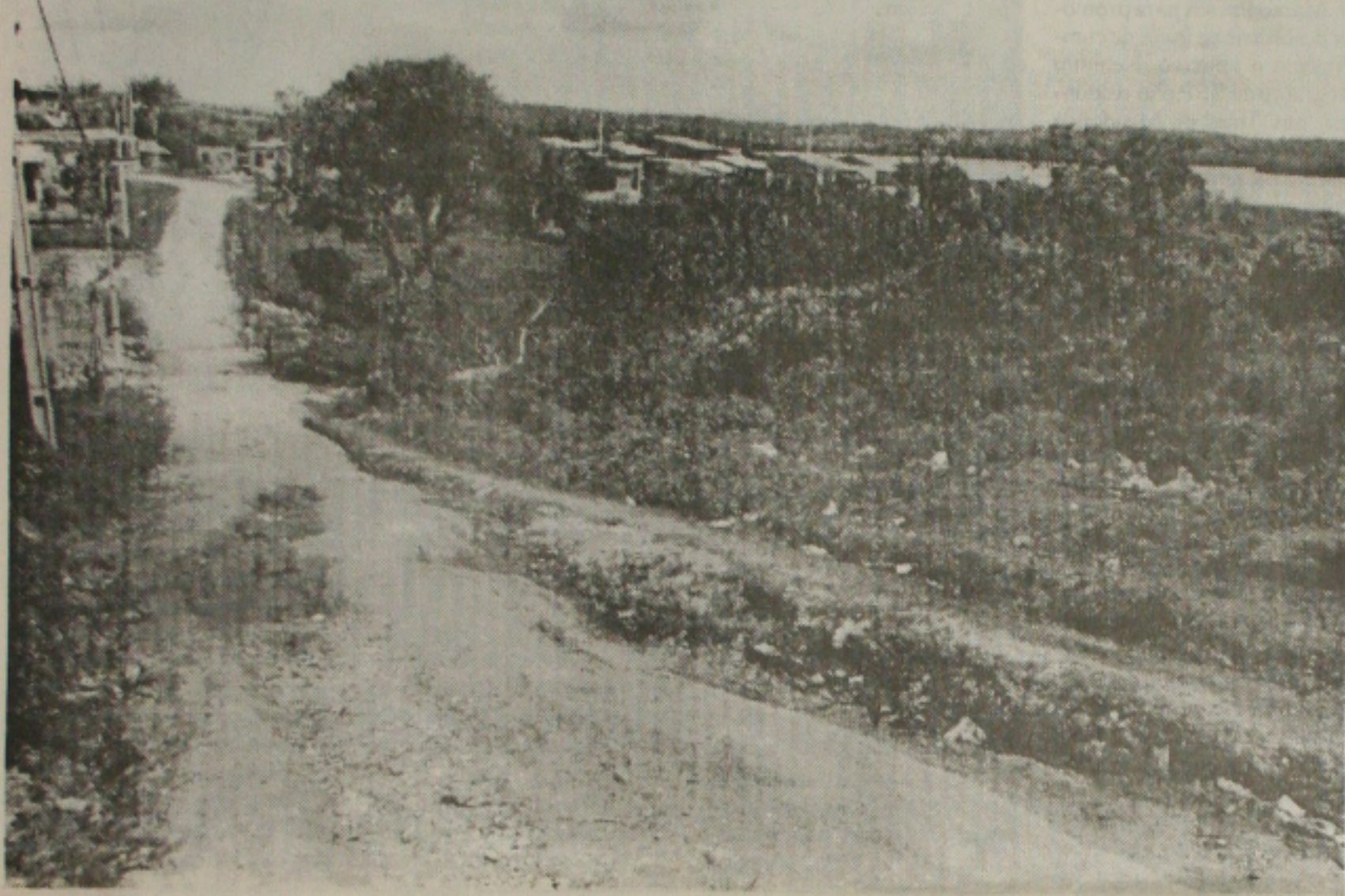
Terreno baldio no loteamento representa uma grande ameaça para os moradores do Senhor do Bomfim