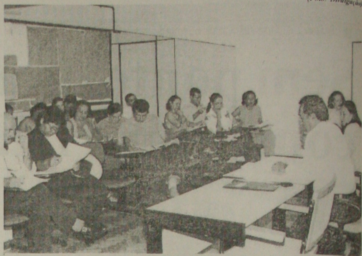
Seed começa a discutir as diretrizes para a implantação do plano de carreira do magistério de Sergipe

O Comitê e a Comissão foram constituídos em consonância com o disposto no art. 49 da Lei Complementar nº 61, de 16 de julho de 2001 - Plano de Carreira e Remuneração do Magistério Público do Estado de Sergipe.