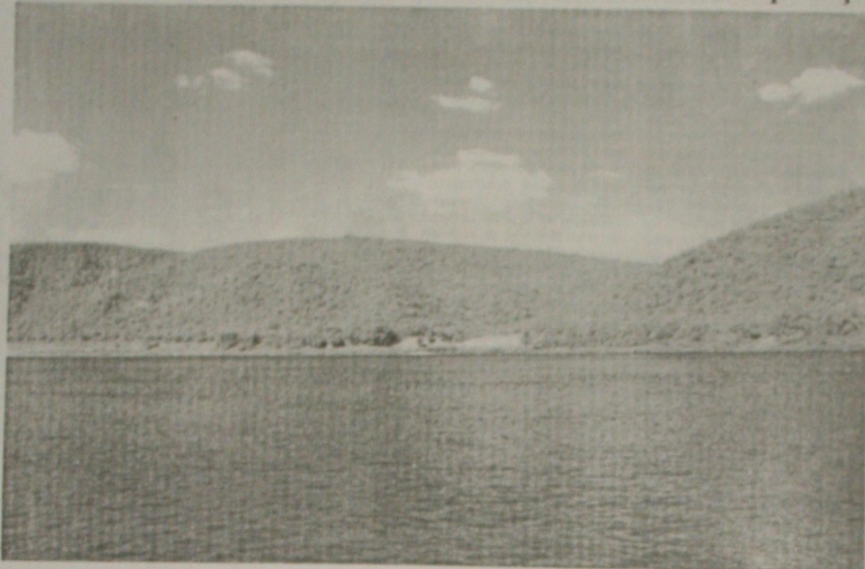
Os 500 anos do Rio São Francisco serão comemorados a partir de amanhã pela prefeitura de Canindé

Sobre o que foi programado pela Secretaria de Educação, Cultura, Esporte e Lazer, o Interventor ressaltou que, na quinta-feira, dia 4, às 5 horas, haverá alvorada festiva e às 10 horas, abertura de exposições.