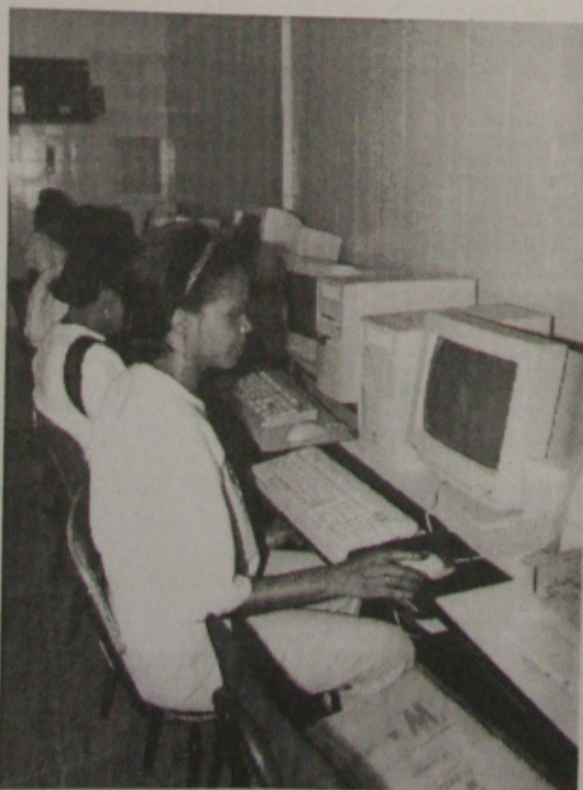
Jovens de baixa renda concluem o curso de informática