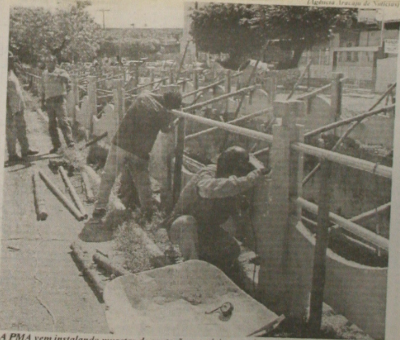
A PMA vem instalando muretas de proteção em vários canais que cortam avenidas da cidade, a fim de prevenir acidentes. (Página 2B)

A maioria dos taxistas que operam nas linhas para Socorro e São Cristóvão mostrava-se ontem revoltada com a decisão da SMTT de impedi-los de transportar passageiros da capital para seus respectivos municípios. Por causa da decisão, um taxista chamado Vampiro teria atado fogo na própria casa desesperado com a situação. (Página 1B)