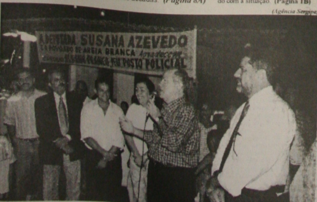
O governador Albano Franco inaugurou segunda-feira à noite o posto policial do povoado Areia Branca. (Página 5A)