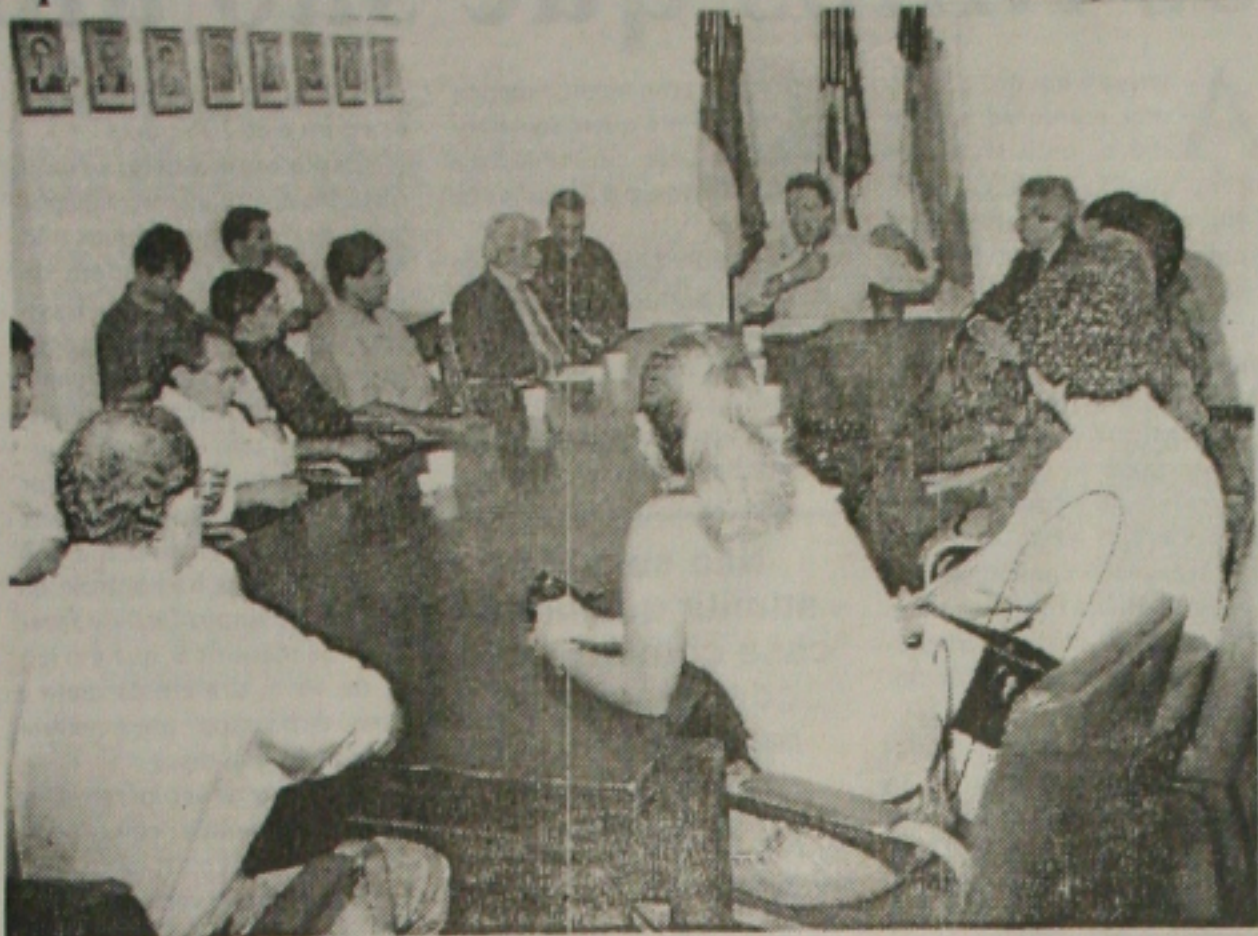
Deda afirma que Mineiro será um elo importante com a Câmara

Para o peemedebista, a iniciativa da Assembleia Legislativa, atendendo a solicitação do deputado estadual Gilmar Carvalho (PDT), foi um passo importante para discussões futuras, possibilitando a apresentação de emendas nos próximos orçamentos. Julio espera que as discussões sejam feitas com mais antecedência no próximo ano, para que os prefeitos possam apresentar emendas que venham trazer benefícios para a população. "São atitudes dessa natureza que pode propiciar benefícios para a população".