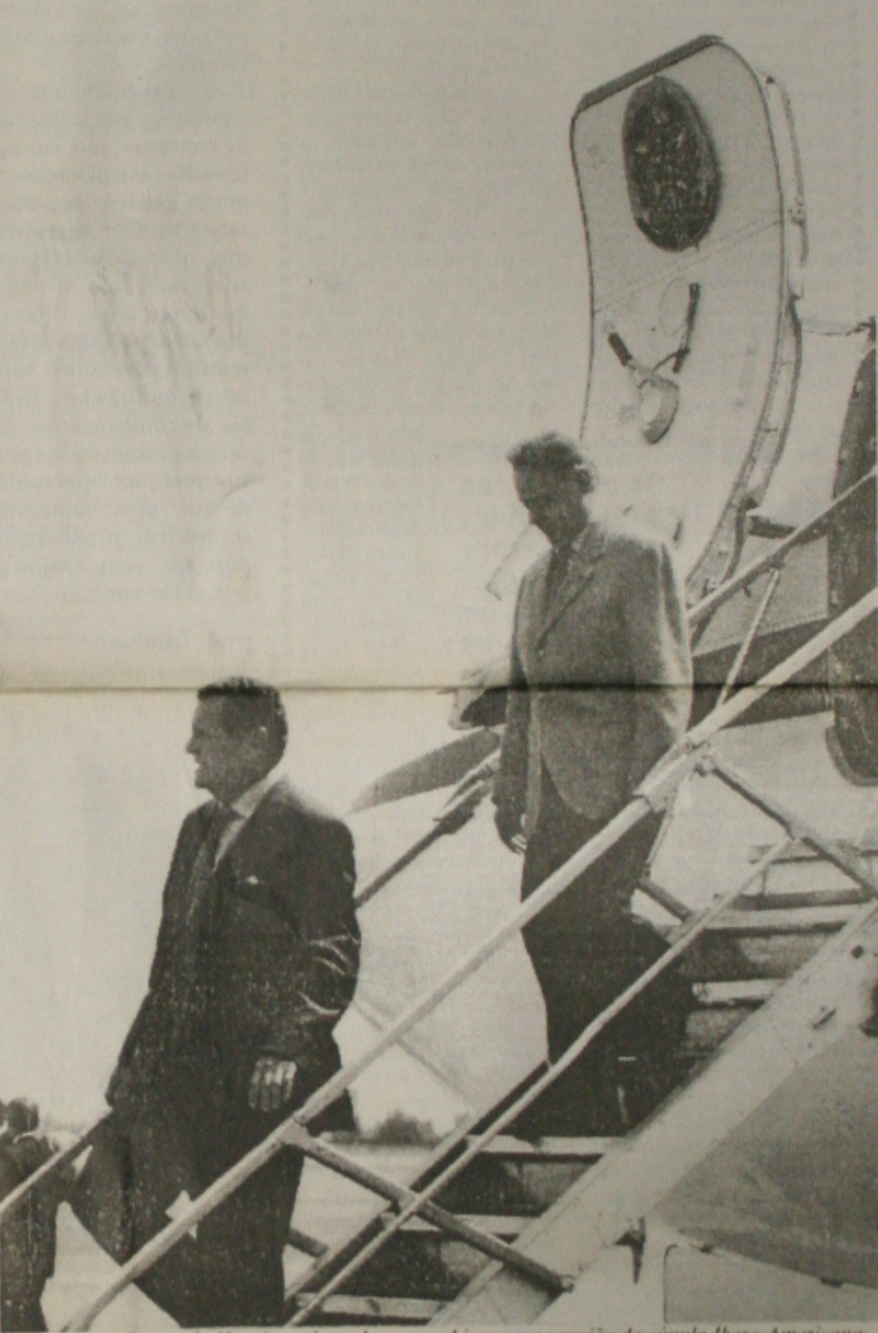
O presidente Fernando Henrique desembarca em Lima para reunião da cúpula Ibero-Americana

Os servidores do INSS em Sergipe aprovaram ontem o fim da paralisação que durou 104 dias. Em função do feriado do apagão, os postos no Estado só serão reabertos na terça-feira, às 7 horas. O expediente só acaba às 19 horas. (Página 4-B)