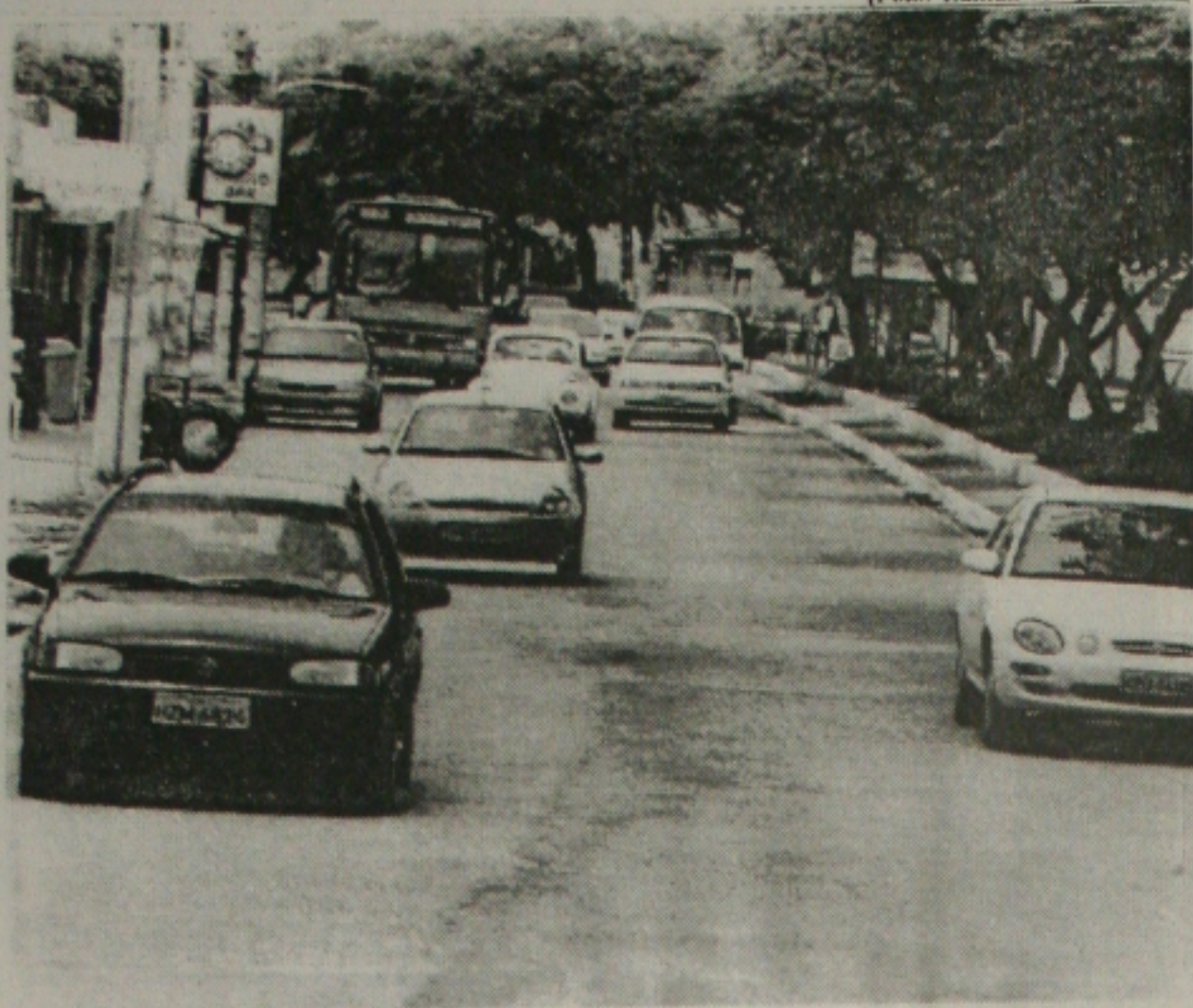
O trânsito de Aracaju passará por melhorias com realização de obras de recuperação de vias públicas