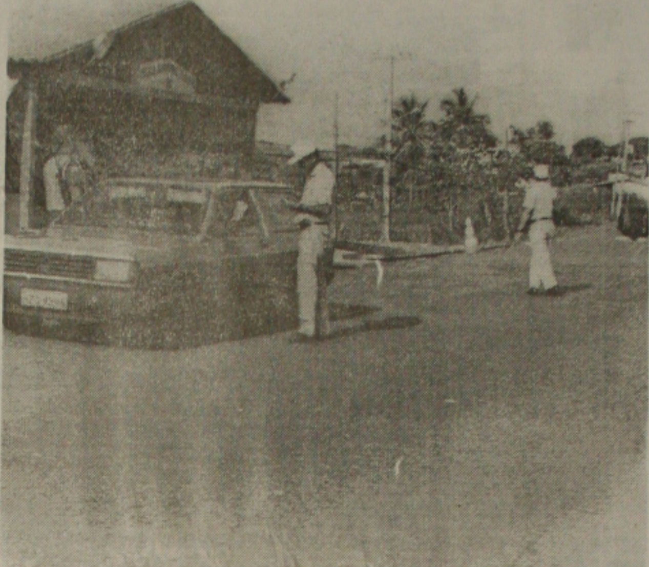
A Polícia Rodoviária Federal reforça o policiamento nas estradas durante o feriado do apagão

"Os trabalhadores decidiram retomar as atividades para evitar um desgaste junto a opinião pública"