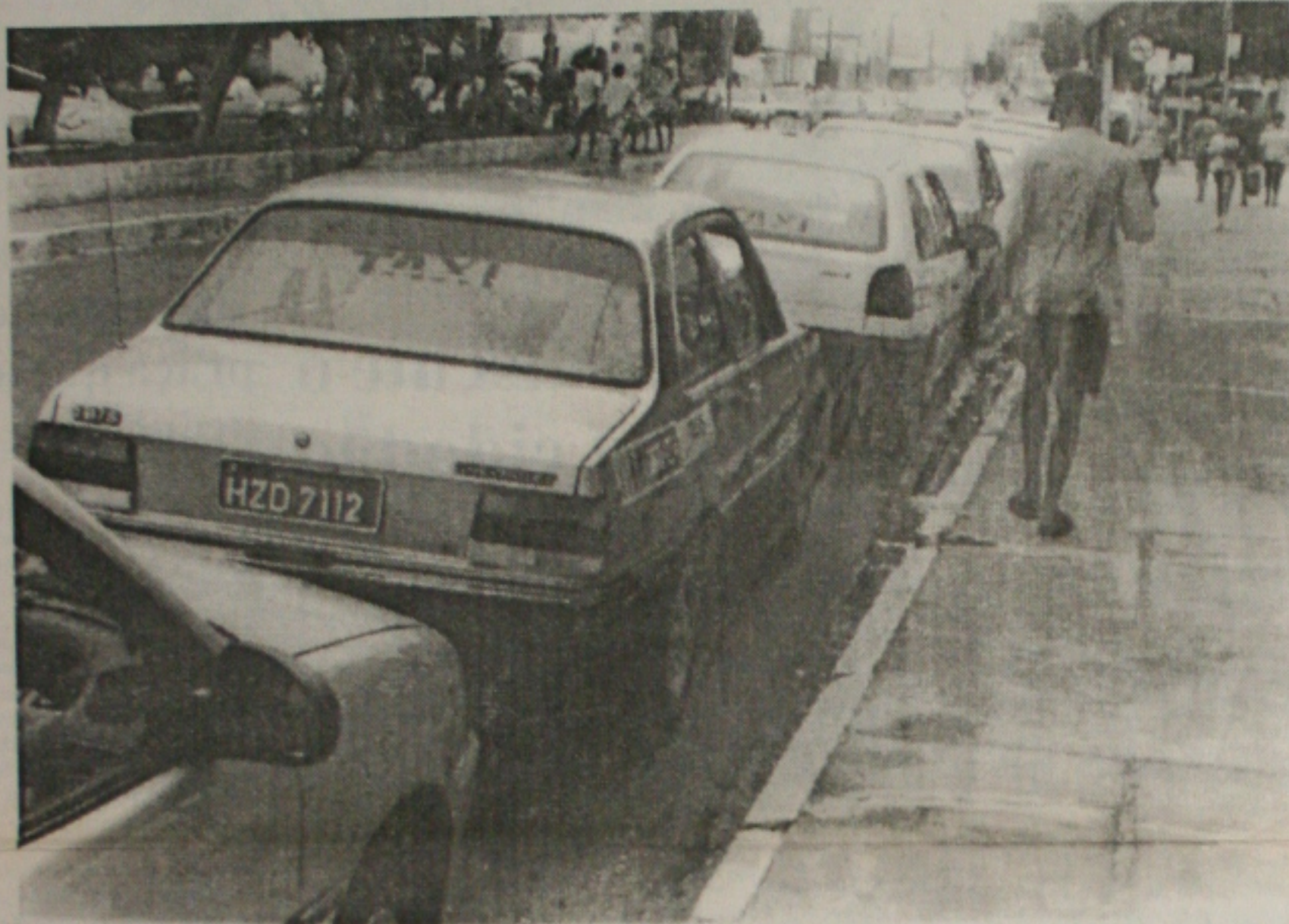
A SMTT autoriza o uso da bandeira dois para os táxis de Aracaju a partir de primeiro de dezembro