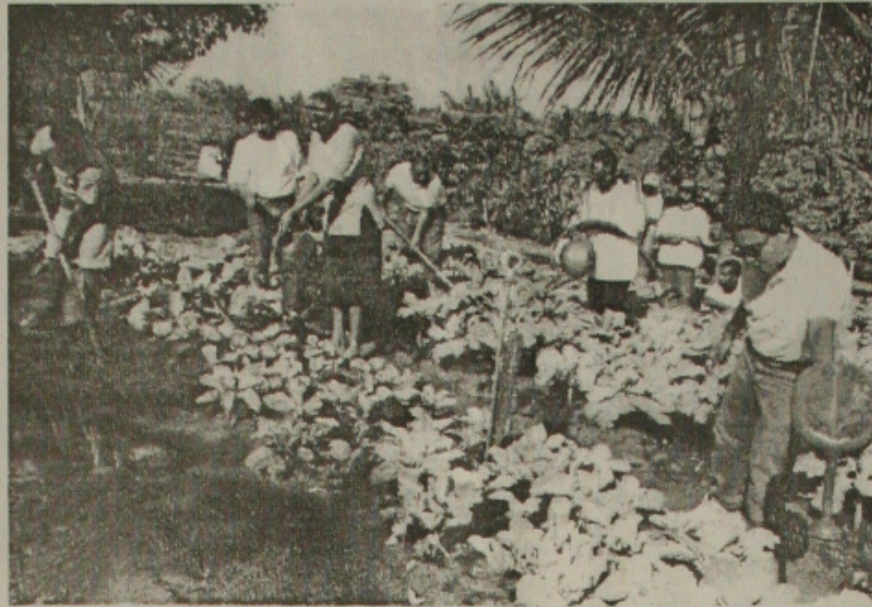
Grupo em aula prática de horticultura

O curso terá a duração de cinco meses, totalizando 600 horas/aula e está voltado para jovens entre os 16 e 25 anos. A fundação disponibilizou um