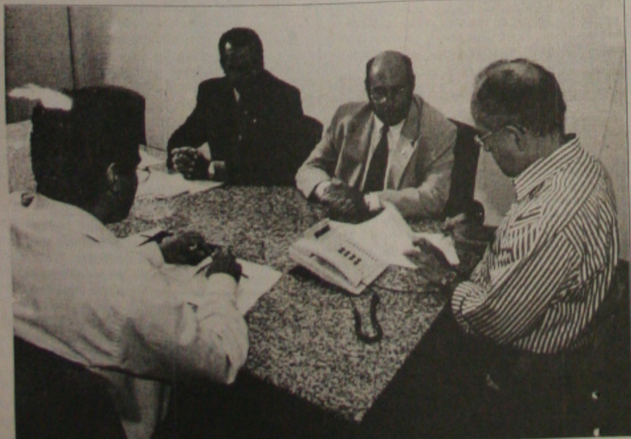
O governador assina contrato com a Petrobrás para garantir a preservação do meio ambiente