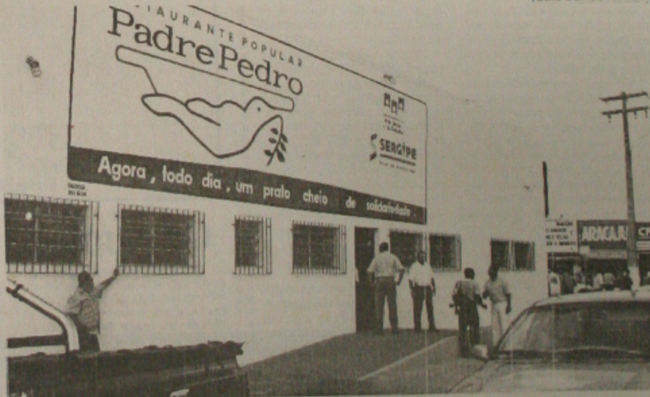
O Padre Pedro foi instalado no cruzamento das Avenidas João Ribeiro e Coelho e Campos