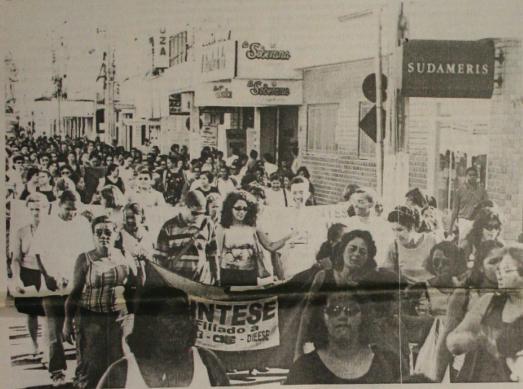
Depois da assembleia realizada no Instituto Histórico, os professores saíram em passeata pelas ruas centrais da cidade