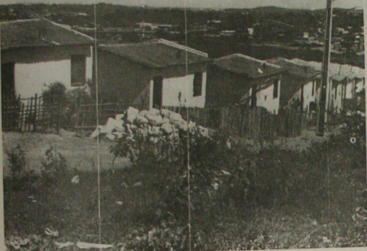
Prefeitura de Socorro realiza mutirão no conjunto Jardim para resgatar a cidadania dos moradores

Quando a população cobra uma postura do poder público e aponta falhas na segurança, ela espera uma resposta positiva, para que possa andar com tranquilidade nas ruas. O que nós podemos observar é que no caso de assaltos a ônibus não parece ser uma coisa isolada e sim uma quadrilha que se especializou nesse tipo de crime, certa de que não haverá repressão. Os trabalhadores estão assustados e muitos não querem mais fazer algumas rotas, porque temem os assaltos. Não se pode viver em pânico e o Estado tem que ser ágil, combatendo os bandidos, completou.