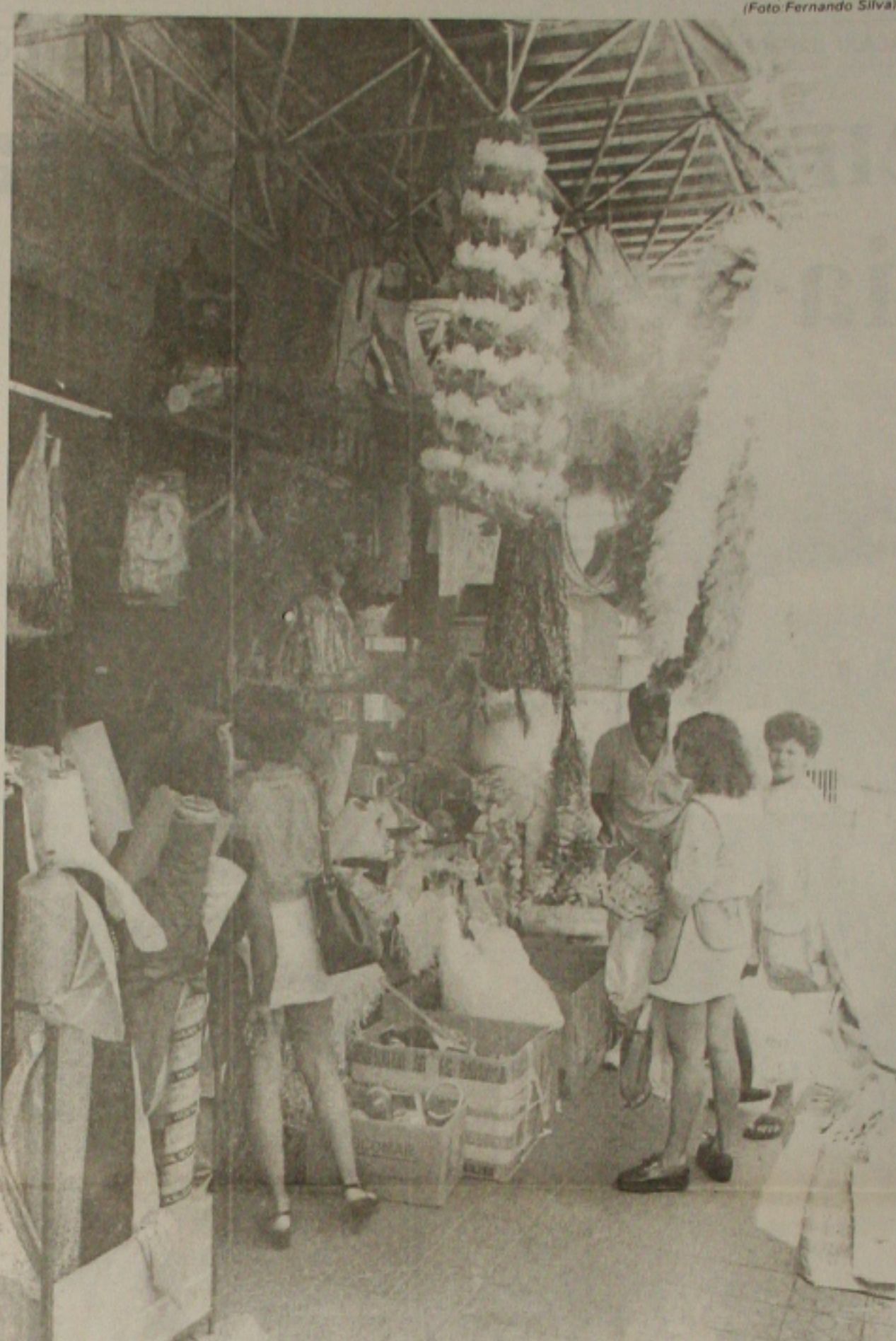
Os comerciantes comemoram a excelente venda de produtos carnavalescos em Aracaju