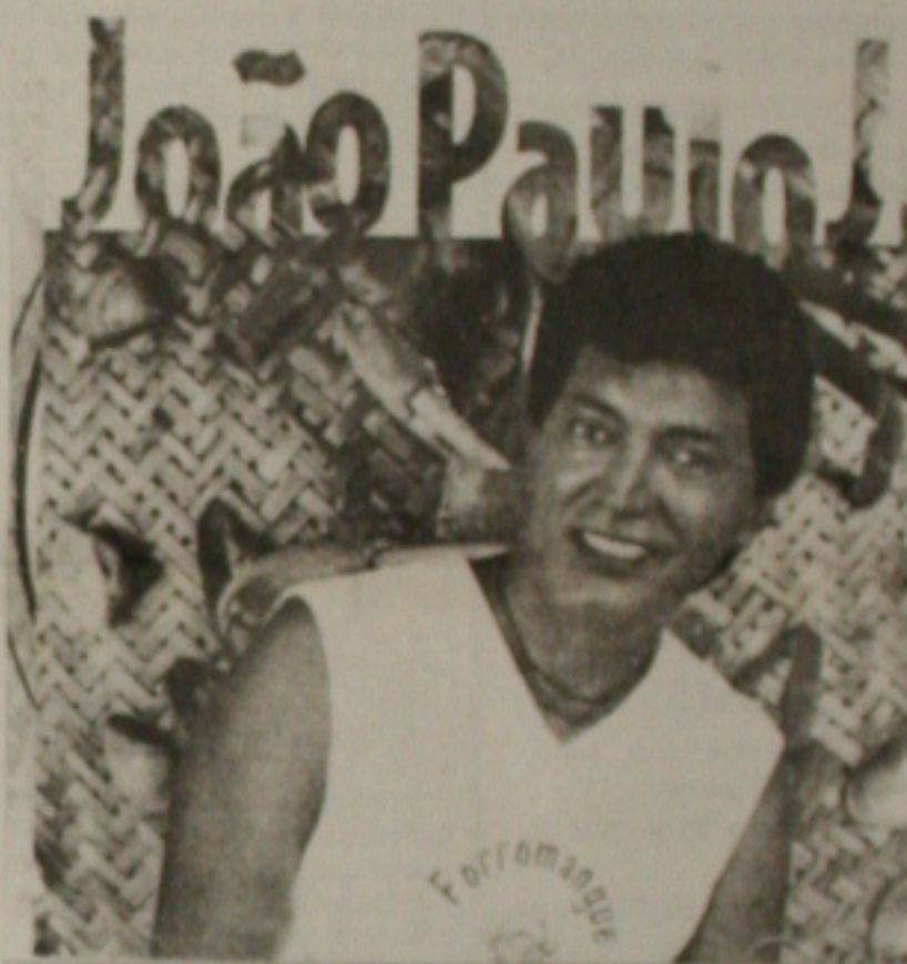
Como compositor tem vasto repertório gravado por cantores de renome

Rural, quando aborda temas da natureza denunciando a morte dos mangues e dos seres vivos que lá habitam e urbana, quando deparamos com a modernidade rítmica e instrumental, na mistura swingada da pancada do pandeiro;