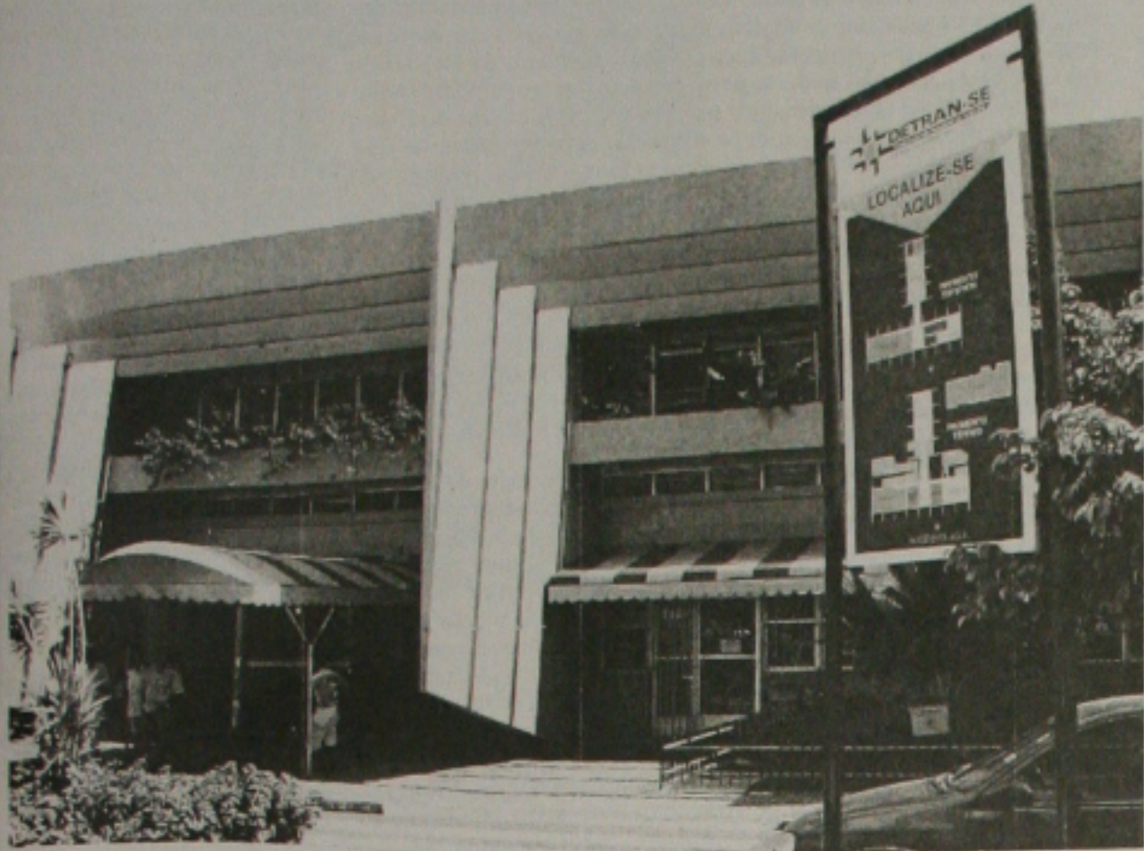
Plano de Metas para este ano irá melhorar os serviços oferecidos.