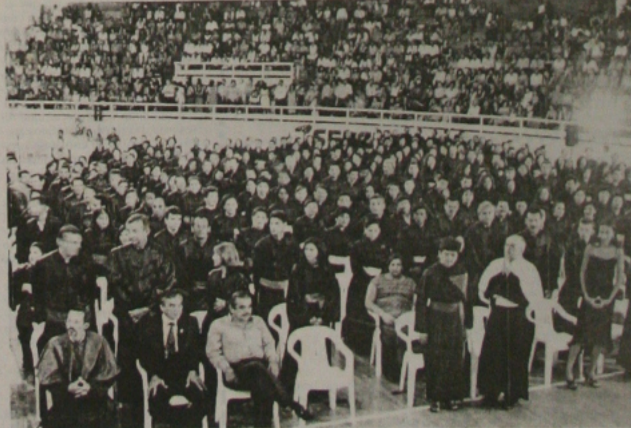
A cerimônia de formatura dos 443 professores que participaram do PQD foi em Aracaju (Página 6A)