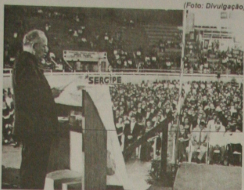
O governador Albano Franco discursando durante a solenidade