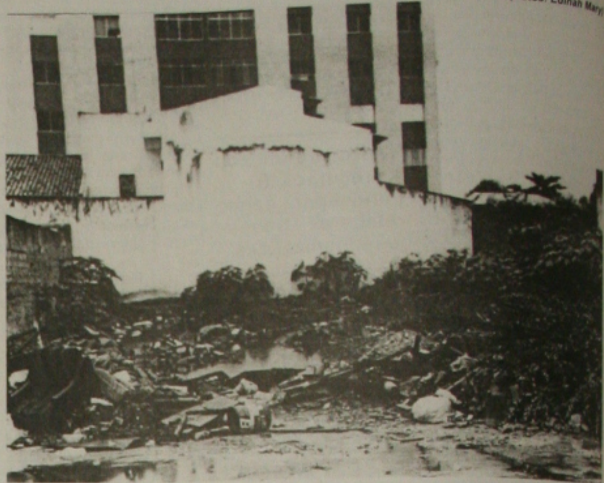
Terrenos baldios se transformam em "criadouro" de mosquitos e outros transmissores de doenças

No Siqueira Campos, por exemplo, se identificou muitos