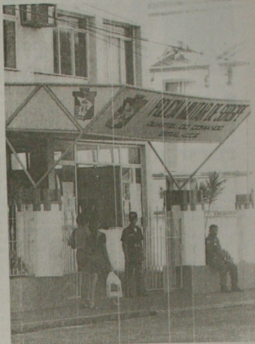
Decisão da Justiça em afastar os 309 PMs do CFS, cria descontentamento