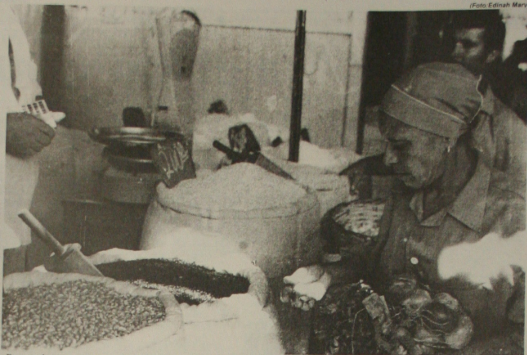
De acordo com a pesquisa do DIEESE o preço do feijão ajudou na elevação do valor da cesta básica em Aracaju

A maioria dos produtos pressionou a elevação do valor da cesta básica alimentar nas dezesseis capitais. Os ali-