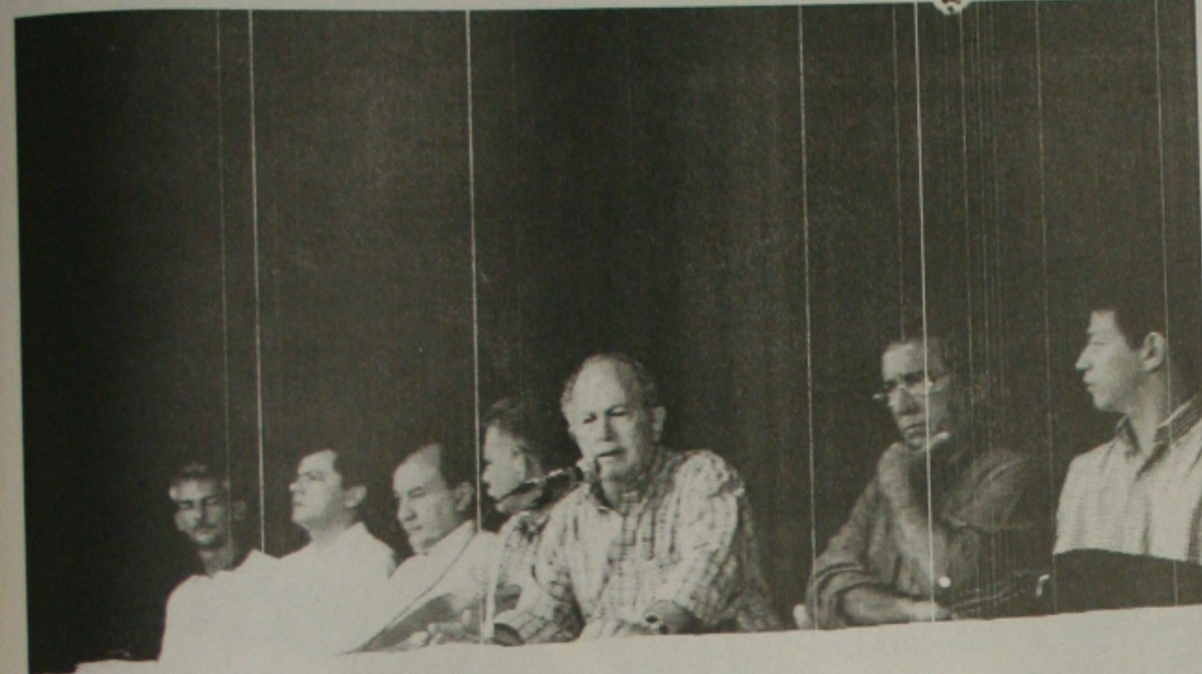
A SEED coordena a realização da solenidade da aula inaugural do ano letivo de 2002 no Colégio Atheneu