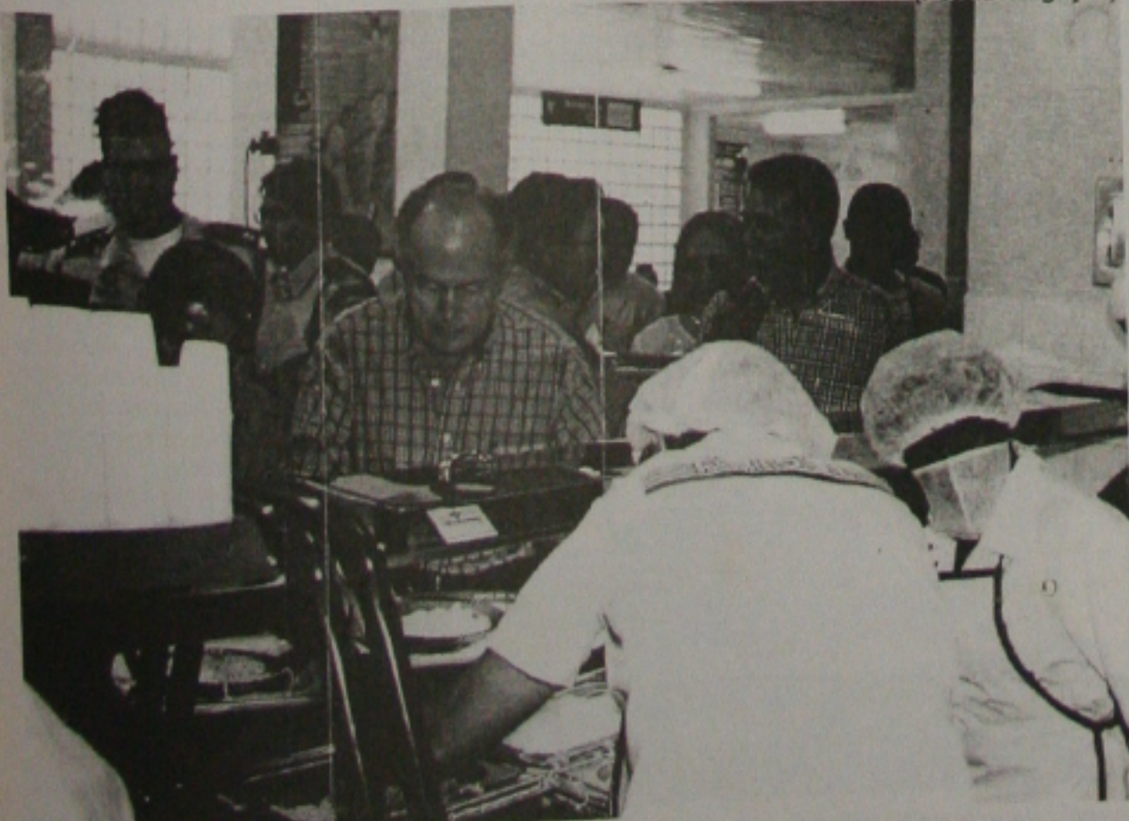
Albano; esta é a mão social do governo