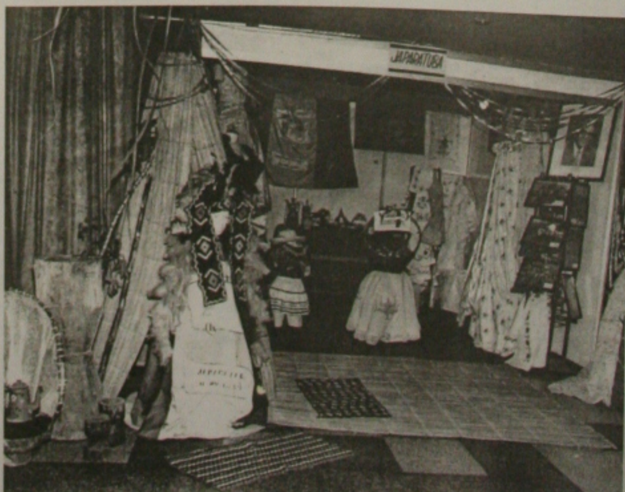
Bordados de Japarutuba são exemplos da arte de Sergipe

Não tem dúvidas o superintendente do Sebrae de que é essencial que todos participem desse processo de desenvolvimento de Sergipe, porque cada um fazendo sua parte, o lucro será de todos. (CM)