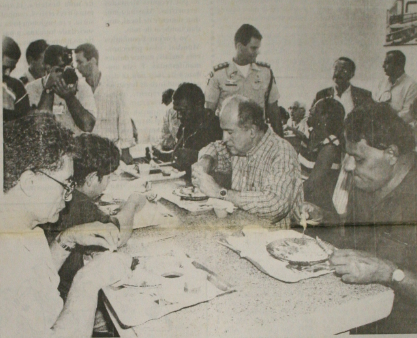
O governador Albano Franco almoçou no meio do povo durante a inauguração do restaurante popular Padre Pedro