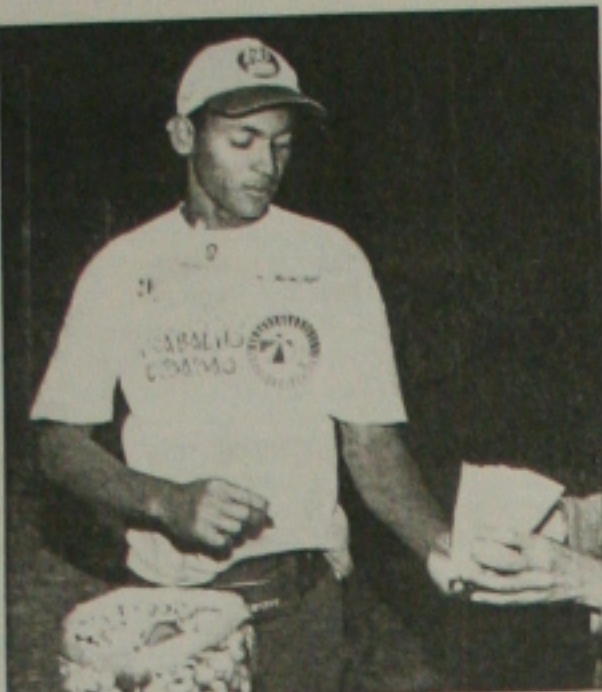
Ambulantes participam de cursos envolvendo relações interpessoais e turismo