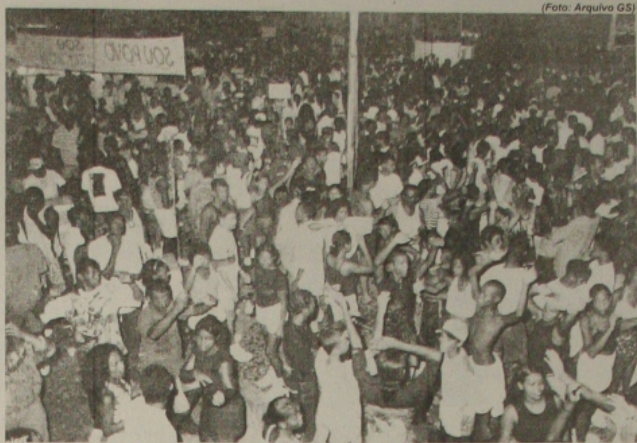
A partir de sexta-feira os aracajuanos ganharão espaço para brincar o Carnaval até a terça-feira