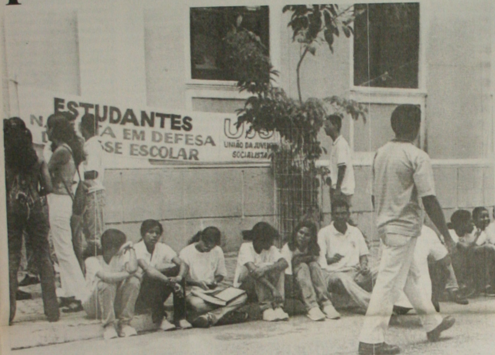
A União de Estudantes Secundaristas defende a utilização do passe escolar também aos domingos para o pré-vestibular