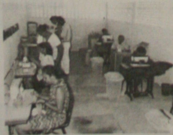
Cinquenta e seis mulheres foram profissionalizadas na Unidade de Produção de Confeções no bairro Coroa do Meio