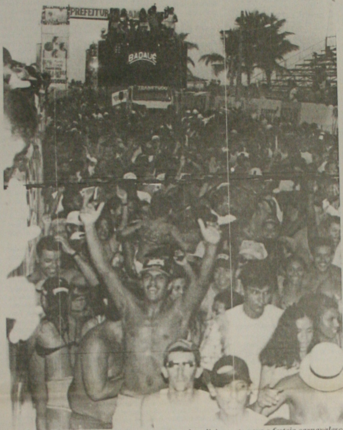
Secretaria da Segurança Pública apronta plano de policiamento para o festejo carnavalesco