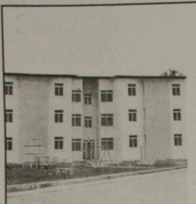
Os imóveis proporcionaram melhor qualidade de vida ao cidadão