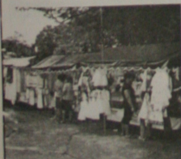
A revitalização das feiras de arte e artesanato gerou renda para 200 artesãos

É a Prefeitura tornando Aracaju "Uma Cidade para todos".