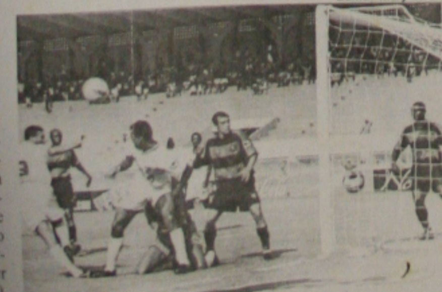
Highlander (9) é a esperança de gol do Confiança

Se vencer hoje o Juazeiro por dois gols de diferença, o Confiança assegura automaticamente a sua passagem para a próxima fase da Copa do Brasil. O jogo será em Juazeiro/BA, a partir das 20h30. Se houver jogo de volta será no dia 20, em Aracaju. (Página 1-C)