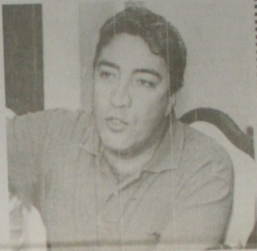
O prefeito Marcelo Dêda entusiasmado com o carnaval de Aracaju.

Estão sendo realizadas reformas no prédio do Senac, para melhor atender seus clientes em salas de aula, centro de estética, salão de beleza e lanchonete.