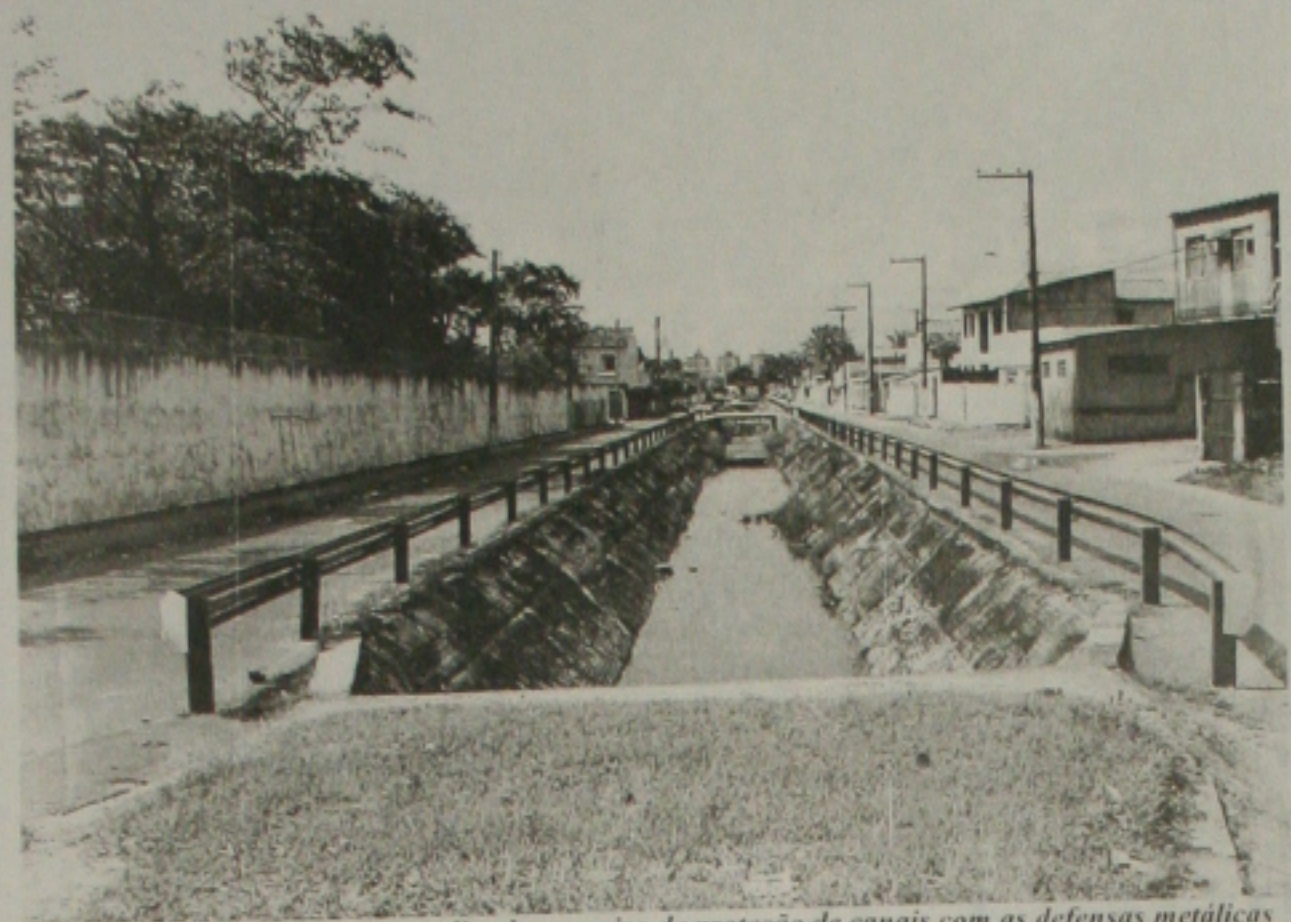
A prefeitura de Aracaju está ampliando o serviço de proteção de canais com as defensas metálicas

Para Nascimento, "o Carnaval deste ano tende a ser um dos melhores já realizados, pois a Administração está mais bem estruturada em relação ao ano passado. E o prefeito Marcelo Déda está se empenhando para que o Carnaval de Aracaju seja resgatado em suas tradições e o prestígio que teve".