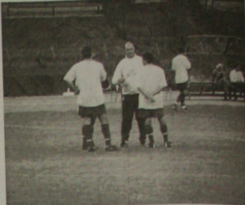
Scolari orienta os jogadores antes do treino da seleção

árabe está classificada para o Mundial e mostrou qualidade para tanto", elogiou. "Além disso, conquistou a Copa do Golfo, dias atrás, porque tem bons jogadores."