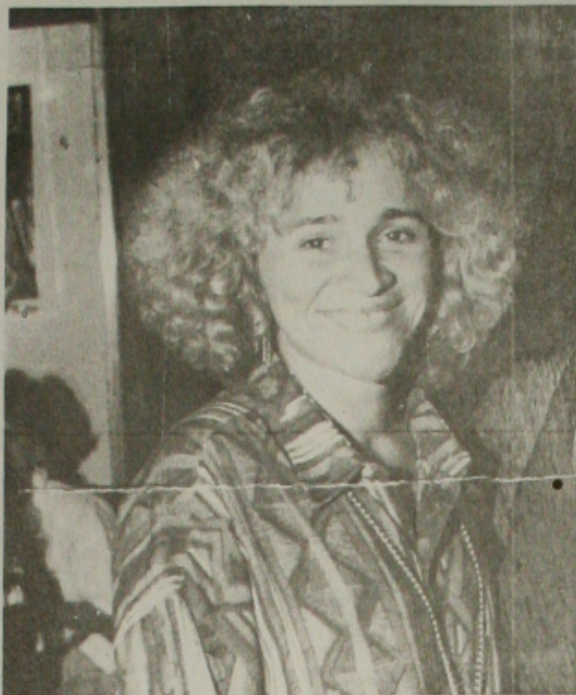
Amorosa vai mostrar o São João de Sergipe

Toda a decoração do camarote será com motivações juninas.