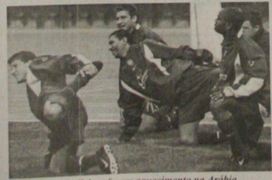
Jogadores brasileiros fazem aquecimento na Arábia

O Brasil entra em campo esta tarde contra a Arábia Saudita, em Riad, com o mesmo time que iniciou a partida contra a Bolívia, na semana passada. O sono pode transformar-se em grande obstáculo para a Seleção Brasileira. O grupo saiu de São Paulo na noite de domingo e só na madrugada tem desembarcou na capital árabe. O jogo será transmitido pela TV a partir das 15h30. (Página 2-C)