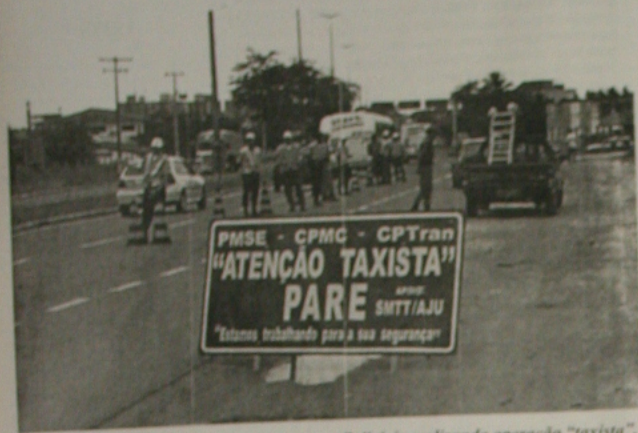
Policiais realizando operação "taxista".