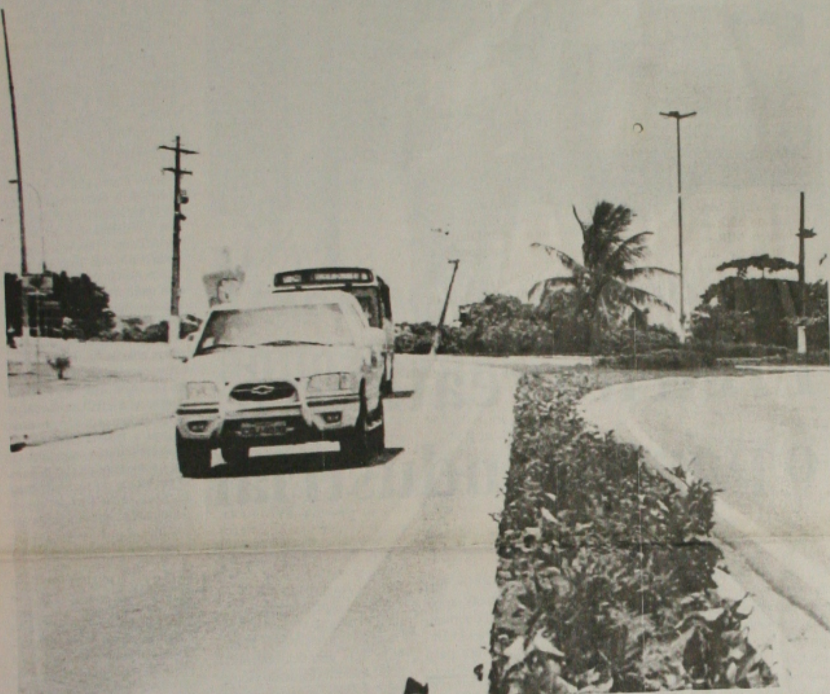
A SMTT discute a abertura de um retorno para facilitar o acesso da Coroa do Meio ao Shopping Jardins