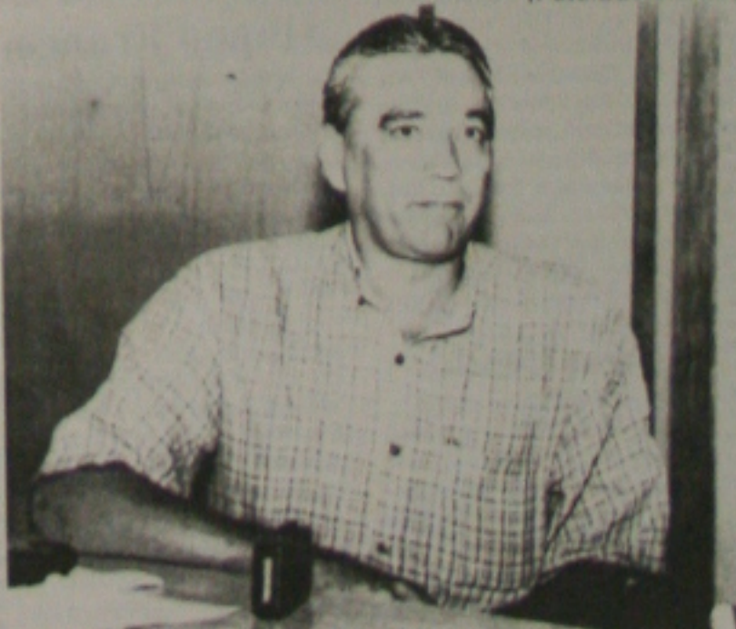
Jerônimo espera decisão do governador