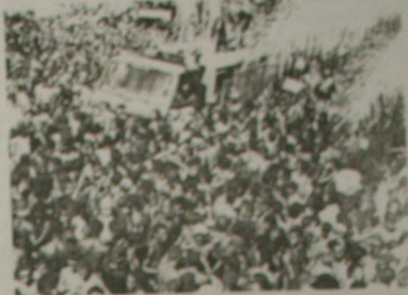
O Corpo de Bombeiros vai estar presente na festa mimosca de Pirambu