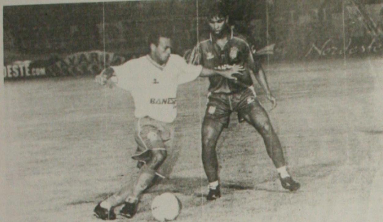
Depois do empate em Juazeiro, o Confiança tenta esta tarde vencer o CSA, para afastar a crise