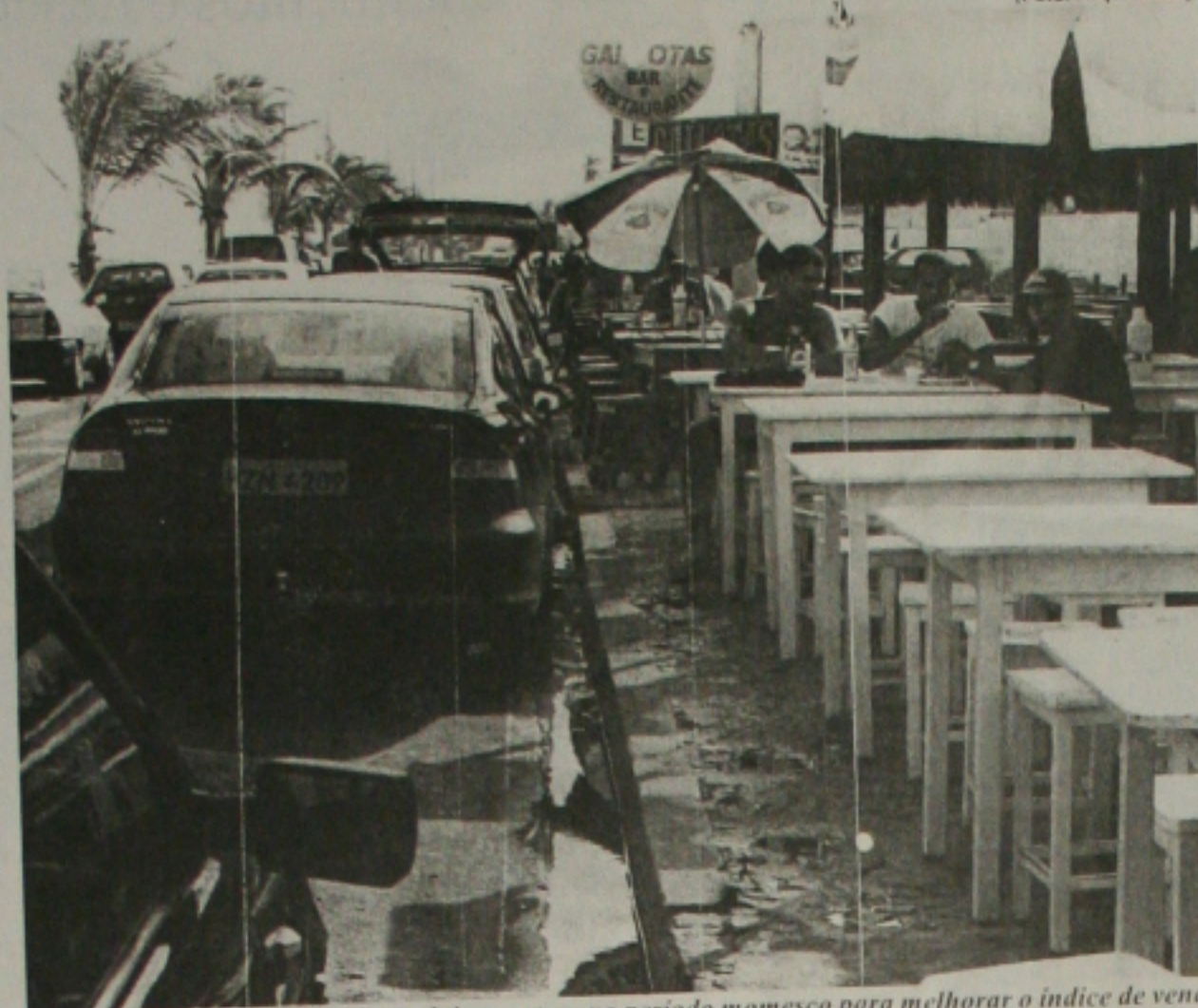
Os donos de bares na praia de Atalaia apostam no período momesco para melhorar o índice de vendas

Se ele não for recuperado, em pouco, tempo não haverá navegabilidade, projetos agrícolas pelo processo de irrigação e o turismo de Sergipe será drasticamente afetado. Sem o rio, muito do que foi investido em duplicação de adutoras e na infra-estrutura para o turismo será dinheiro jogado fora, porque água é vida e não há substituto para ela, alerta Augusto Bezerra.