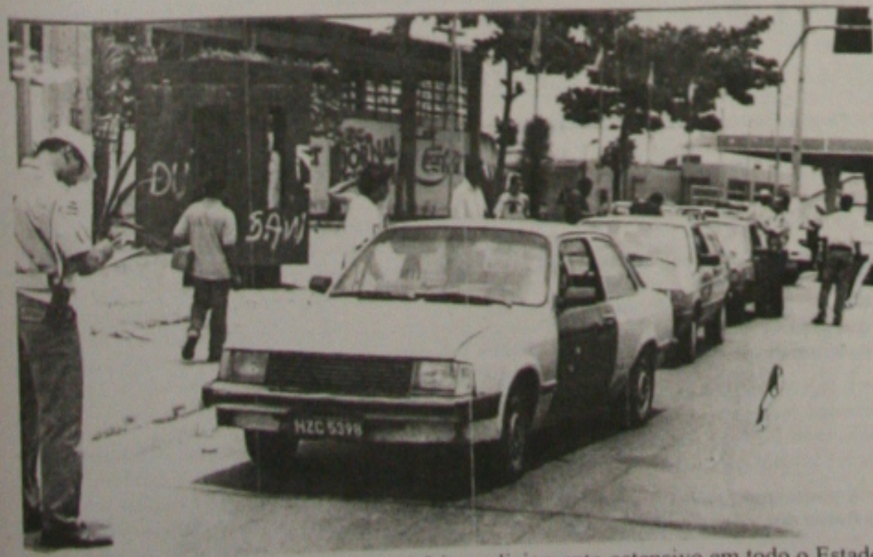
Será feito policiamento ostensivo em todo o Estado

No final da festa, procure sair com calma, evitando pânico ou correria. Retorne por ruas locais iluminadas.