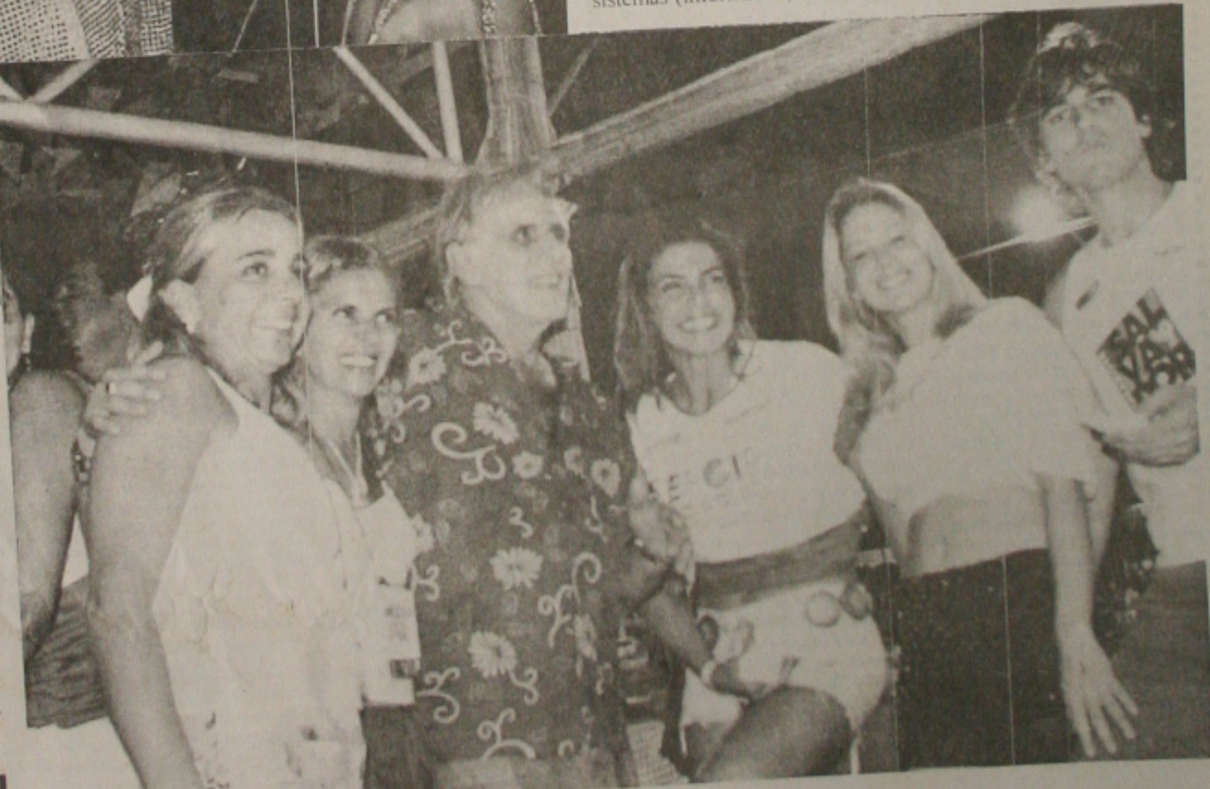
Em Salvador, artistas visitam o camarote de Sergipe

serem distribuídos nos setores de gestão de pessoal, marketing e financeiro. O salário inicial para os bancários é de R$ 529,97. As provas serão elaboradas pela Cespe, da Universidade de Brasília. (Página 5-A)