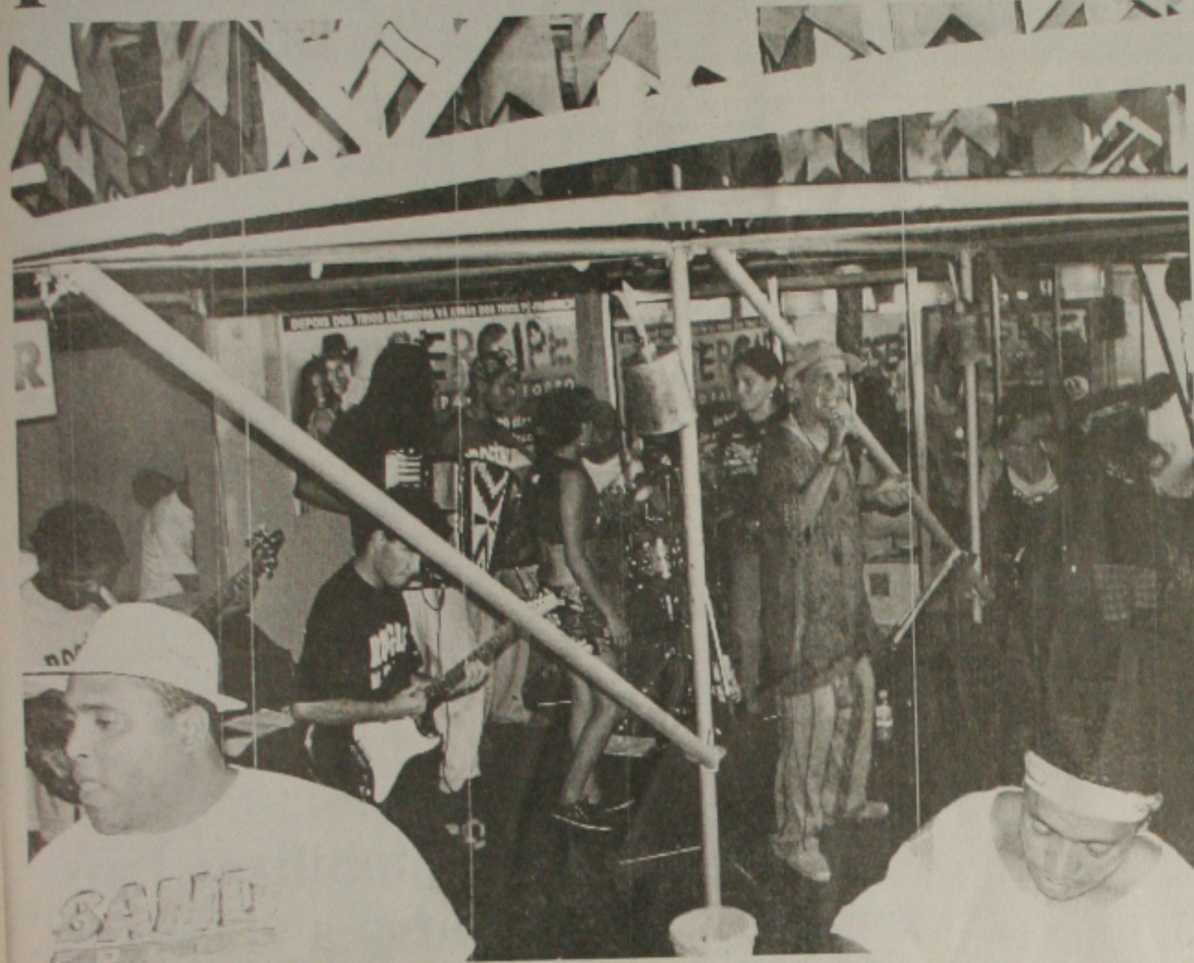
Muita animação e forró no camarote de Sergipe no Carnaval da Bahia

Como aconteceu no ano passado, a Secretaria de Cultura e Turismo (Sectur) e a Empresa Sergipana de Turismo (Emsetur), montaram o camarote de Sergipe no Carnaval da Bahia, tido como um dos mais importantes do país e que reúne mais de um milhão de pessoas por noite, entre nativos e turistas.