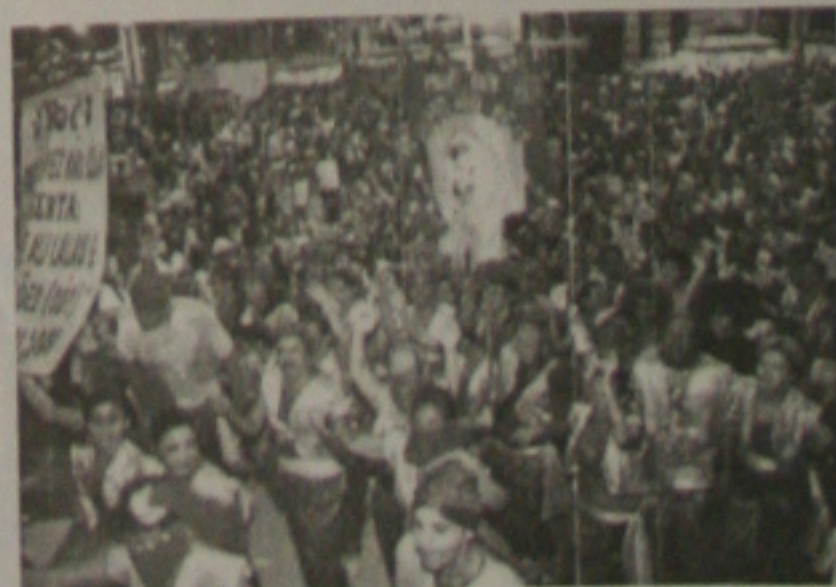
Desfile de bloco carnavalesco nas ruas de Recife

Triunfo - Poucos municípios têm o privilégio de reunir tantos atrativos como Triunfo - a começar pelo seu clima (a cidade está a 1.004 metros de altitude). Tudo em Triunfo parece ter sido talhado com primor: o casario singelo, as antigas construções, os seculares e tradicionais conventos, o açude, adornado pela presença do Cine Teatro Guarany (1919). É ainda interessante conhecer os engenhos de afeimms, mel e rapadura e a casa de farinha. A cidade também oferece o turismo ecológico, com mirantes e cachoeiras.