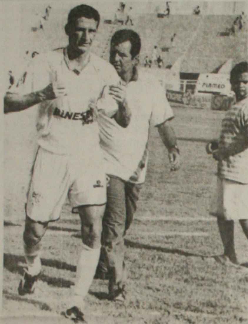
Edil Highlander lutou pela vitória, mas teve que se contentar com mais uma derrota

Os membros do Conselho Deliberativo devem apresentar também, alguns procedimentos que devem ser adotados pela diretoria executiva, a partir dessa reunião, sempre obedecendo dispositivos estatutários. Então é só esperar pela reunião do dia 14 e avaliar os resultados, que ela poderá trazer para o futuro da equipe proletária.