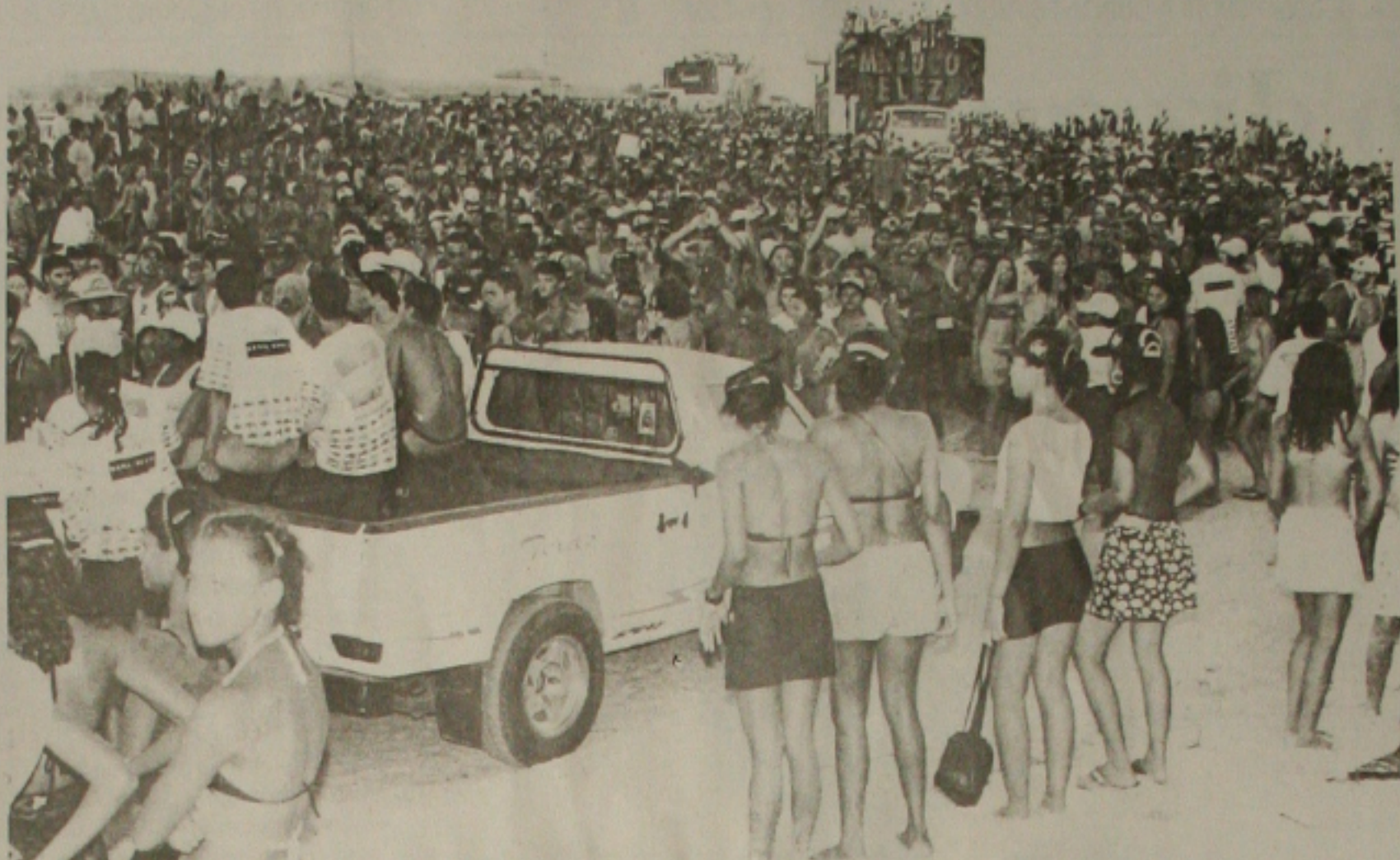
As praias no interior são procuradas pelos foliões durante esse período de momo

Clubes de tradições de longas datas hoje estão sem a maior animação do ano, o Carnaval. O Clube do Banese que animou a folia por muitos anos hoje está desativado. Vasco Esporte Clube, que tantas datas foi a atração do Carnaval em Aracaju abandonou a folia. A Associação Atlética de Sergipe, campeã de folia, deixou de promover o Carnaval. Segundo informações da diretoria, ano passado, o clube promoveu as festas e deu total prejuízo para os cofres da diretoria. A direção reclama que os associados não deram a maior importância para o clube e no final da folia, os