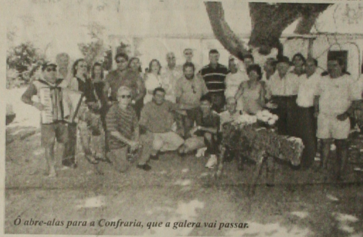
Ô abre-alas para a Confraria, que a galera vai passar.