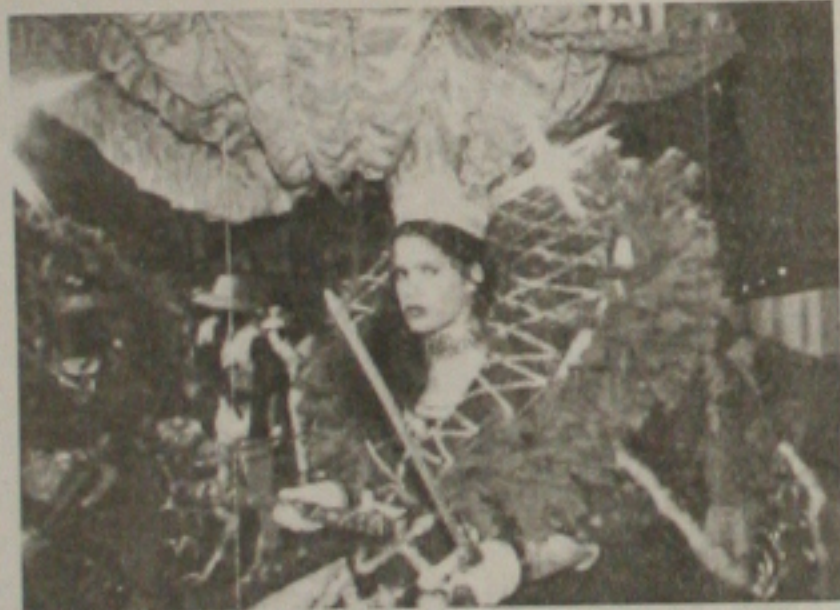
Rainha do Maracatu, no carnaval pernambucano

O Governo do Estado vem desenvolvendo uma política de promoção do Carnaval voltada a difundir cada vez mais a riqueza desta grandiosa festa popular tanto na capital quanto no interior. A ideia é levar o turista para conhecer a diversidade do Carnaval e o potencial turístico de todos os municípios do Estado. Ainda como uma estratégia de divulgação, este ano a MCI, de Antônio Lavareda que cuida do marketing do Governo lançou nacionalmente um CD com o ritmo de Pernambuco cantado em sistemas como frevo, mangue e forró. Artistas locais consagrados como Alceu Valença, Leni-