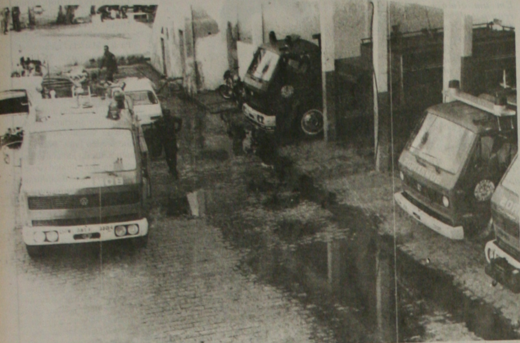
O Corpo de Bombeiros está presente nas festas momecas no interior e na capital

A Polícia Militar já está com o esquema de policiamento em condições de atuar no Carnaval de todo Estado. Cidades como Aracaju, Neópolis, Pirambu, Barra dos Coqueiros e Estância, amplamente prestigiadas por sergipanos e turistas de todo o país, serão os alvos do policiamento ostensivo, que irá mobilizar um efetivo superior a 1000 homens.