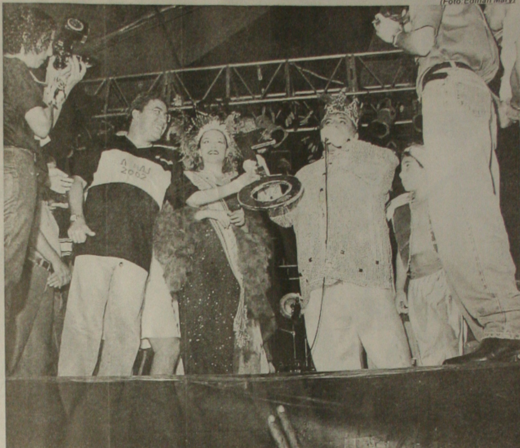
Déda entrega chave da cidade ao rei momo que comandará alegria até a terça-feira

Para 2003, a Mar & Terra prevê uma produção própria de 400 a 600 toneladas de pintado/ano; para 2004 a previsão é atingir de 660 a 880 toneladas. O frigorífico, por sua vez, estará capacitado para processar 7 toneladas de peixe/dia e terá elevado grau de eficiência, gerando índices muito baixos de resíduos. "O projeto do frigorífico seguirá as mais rigorosas normas internacionais em relação ao meio ambiente e à higiene sanitária, permitindo que os produtos lá processados possam ser exportados", finaliza Ralph D. Wehler.