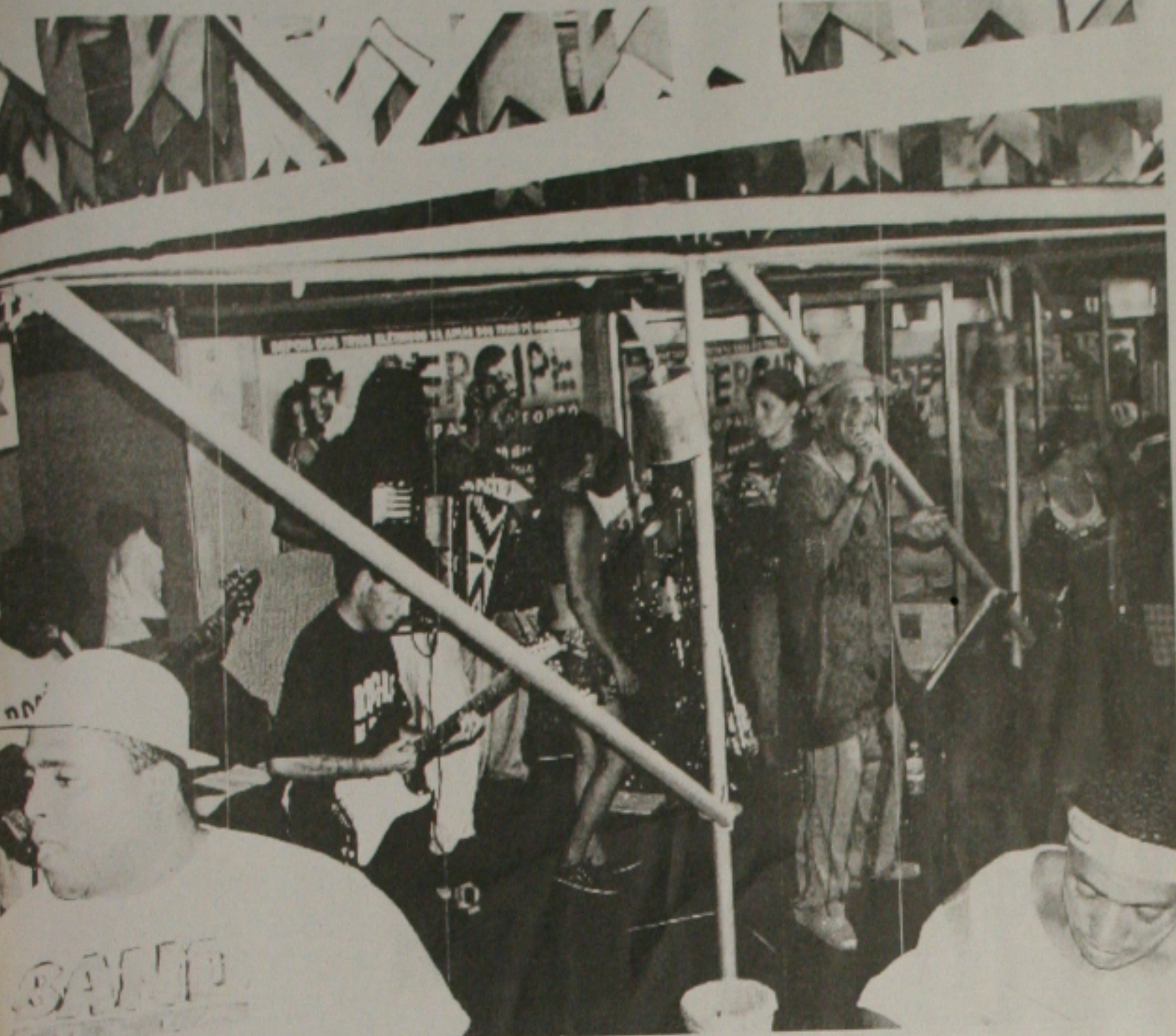
O camarote sobre os festejos juninos instalado no corredor da folia em Salvador é um grande sucesso