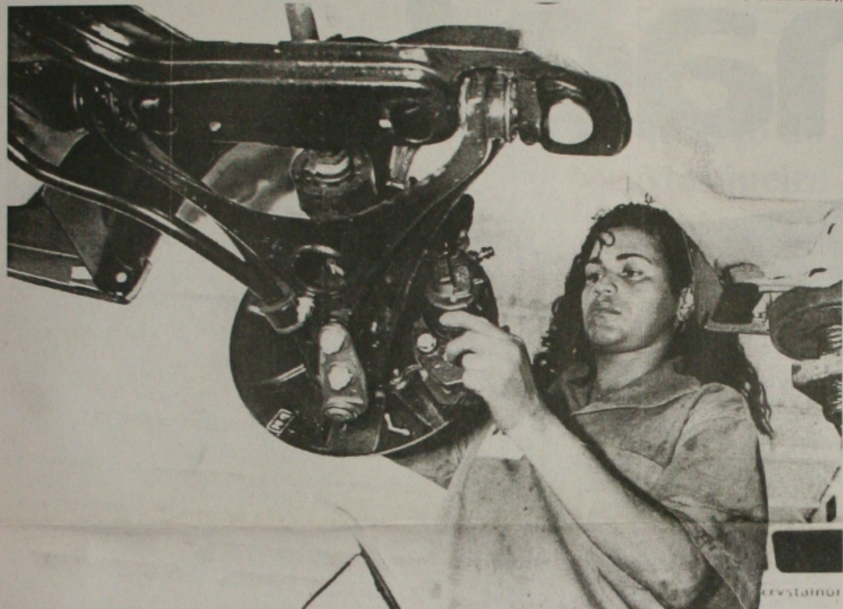
As concessionárias começam a realizar o recall nos carros para eliminar o defeito apresentado nos freios