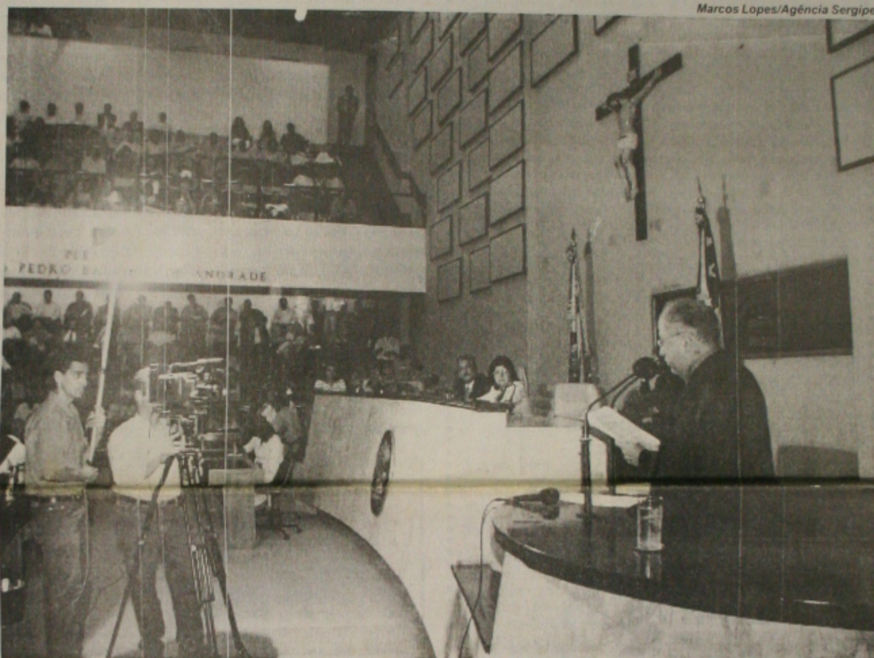
O governador Albano Franco foi à Assembleia Legislativa fazer um balanço dos sete anos de sua administração

que foi anunciado pela direção da Petrobras e que entraria em vigor ontem. O presidente da Petrobras, Francisco Gros, entende que se o governo quiser controlar o preço da gasolina sem prejudicar a empresa, poderia recriar sistemas utilizados no passado, como a conta-petróleo. "Em tese, isso poderia ocorrer. Mas não me parece que, um mês e meio após a extinção da conta-petróleo, seja conveniente recriá-la", afirmou. (Página 7-A)