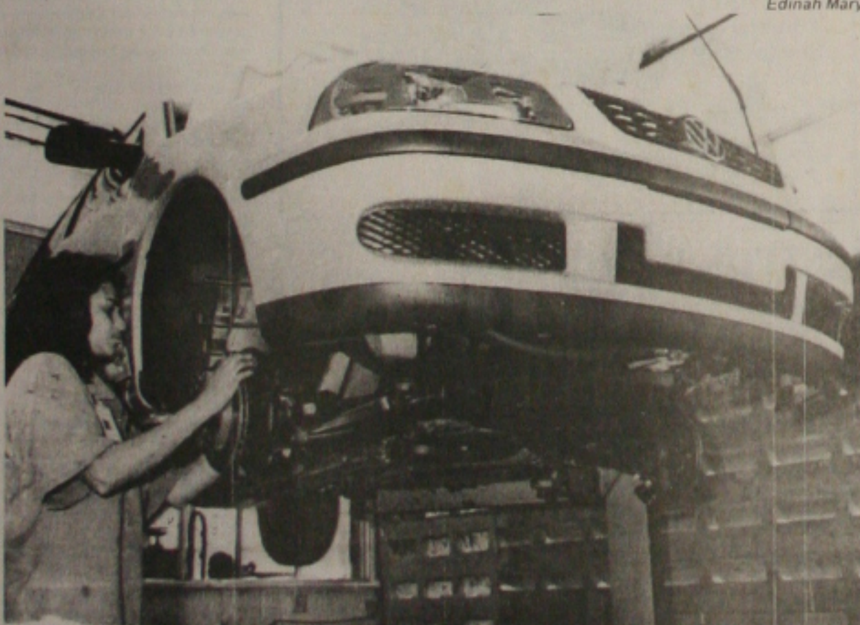
Oficina concessionária da Volks faz a verificação dos freios de um Gol fabricado este ano

que nesse período o PIB cresceu 27% e que investiu R$ 1,13 bilhão em obras. "Foi o maior volume de investimentos dos últimos anos", frisou o governador. (Página 4-A)