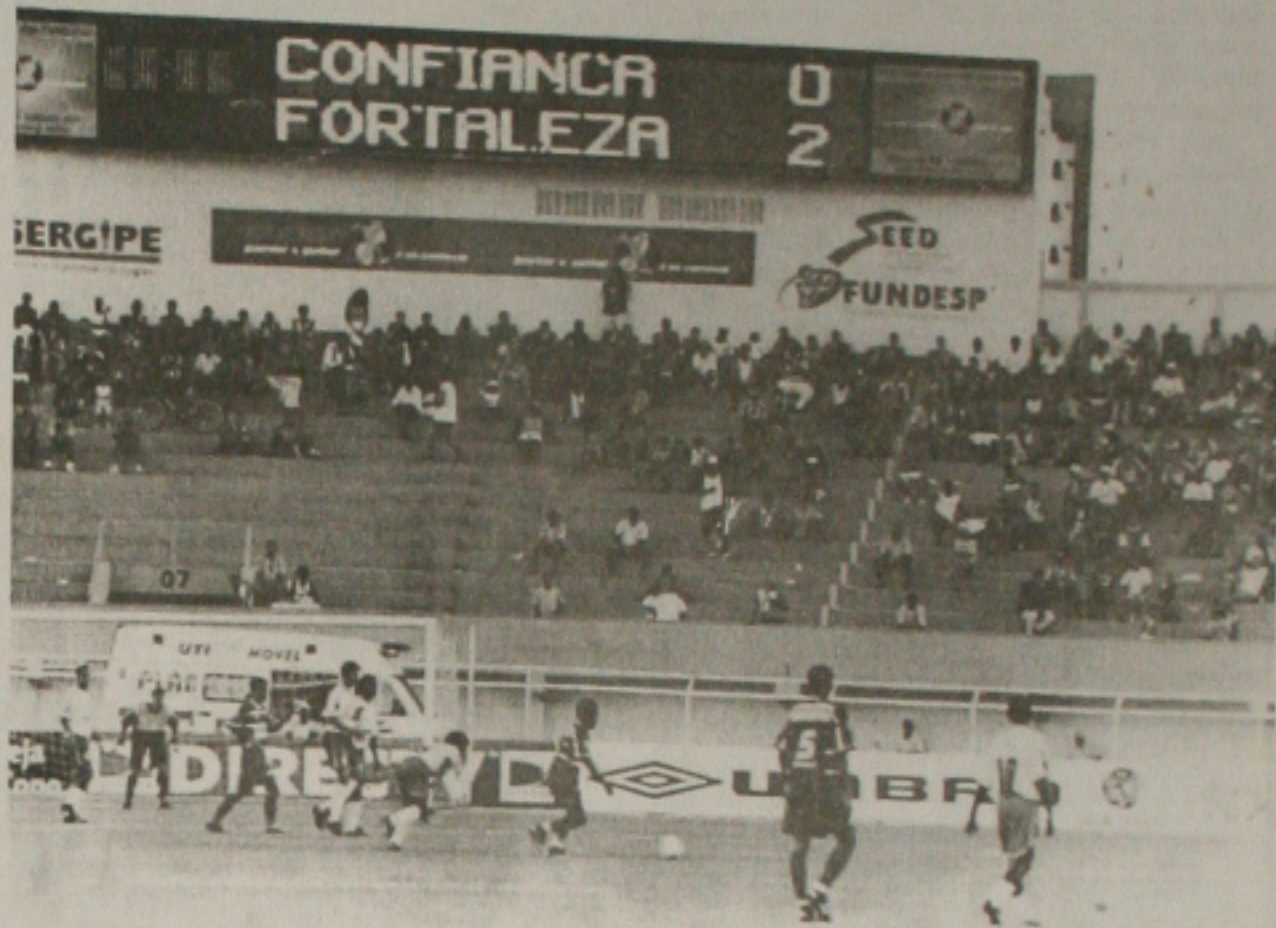
O placar eletrônico do Batistão retrata mais um fracasso do Confiança no Campeonato do Nordeste