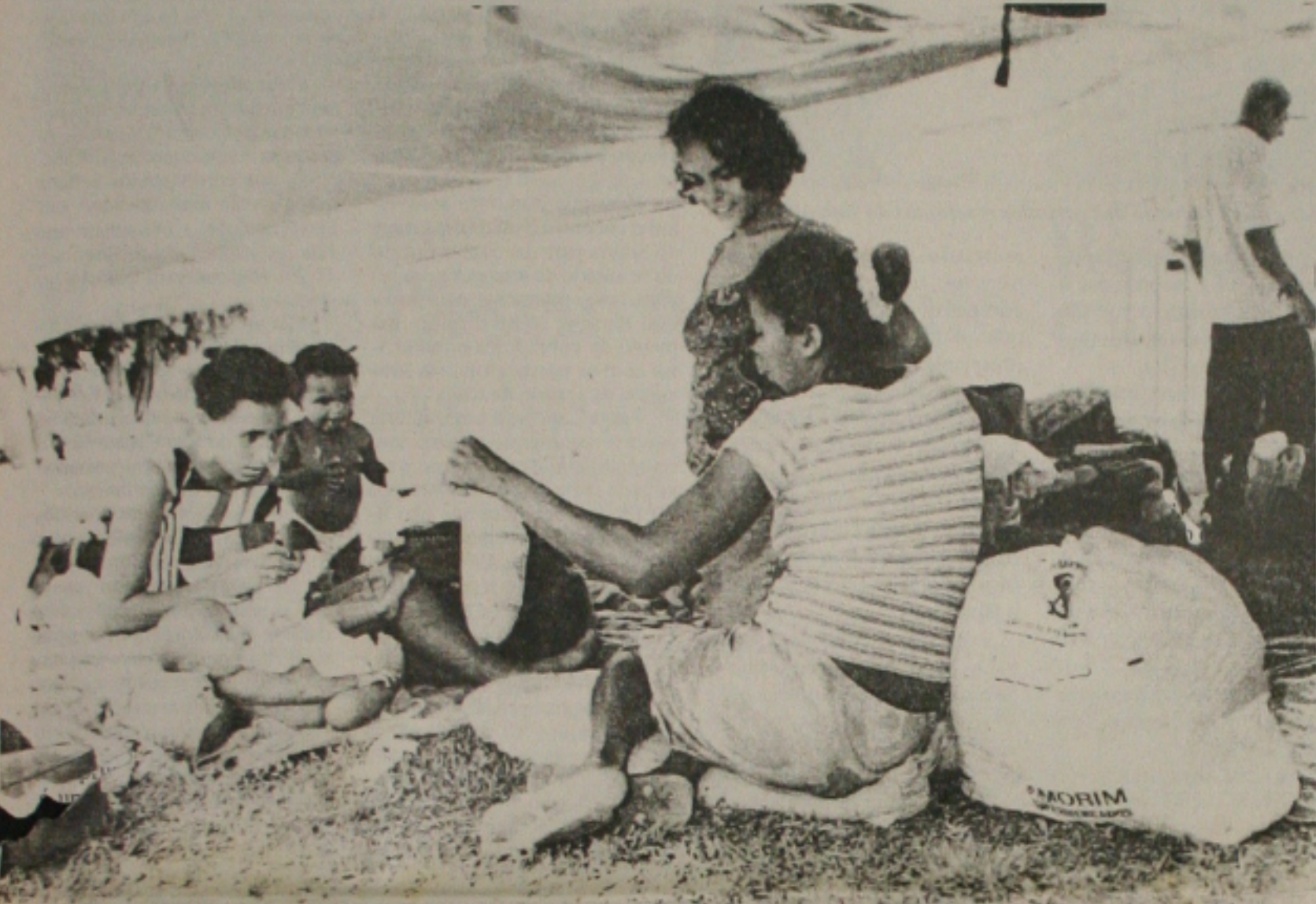
As mulheres estão acampadas até hoje no Bairro América quando participam de manifestação no centro

Desde a última quarta-feira que trabalhadores rurais estão acampados na Praça Tancredo de Almeida Neves, no Bairro América, próximo a Igreja dos Capuchinhos, se preparando para uma grande caminhada que acontece hoje a partir das 9 horas, saindo do local e culminando na Praça Fausto Cardoso, quando acontece o ato público, com a participação de outros movimentos populares. O ato