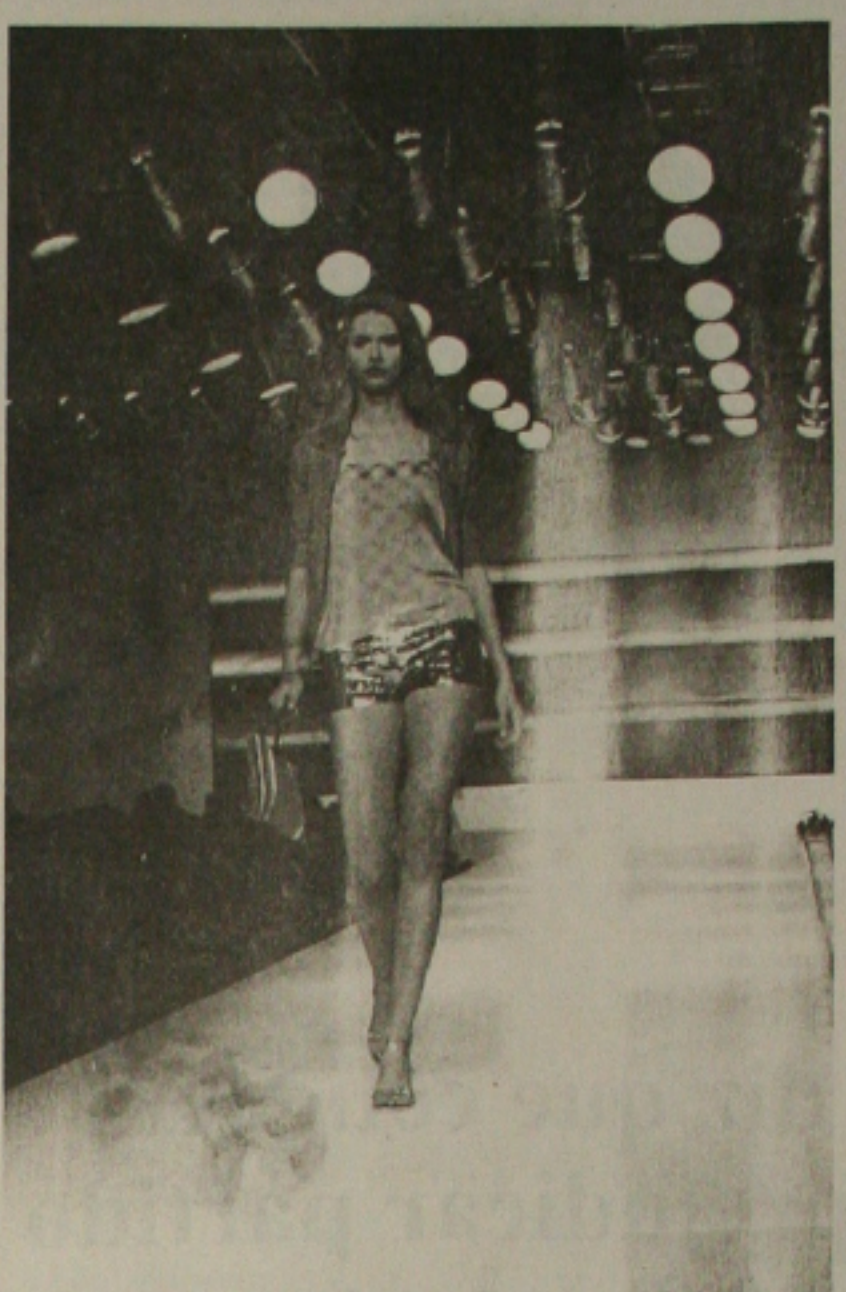
De objeto de cobiça a chefe de família, a mulher cumpre seu papel social