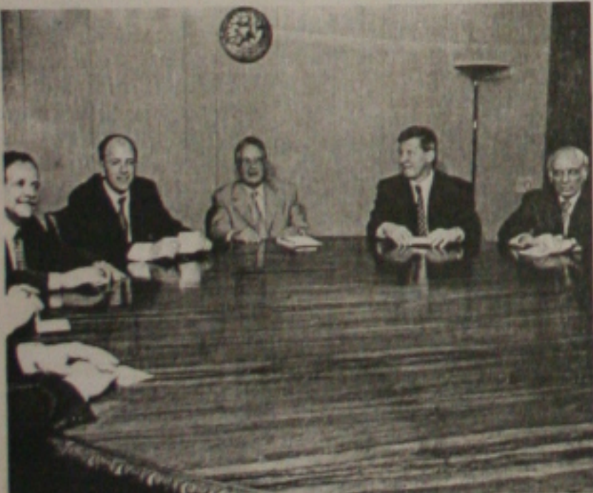
FHC comandou reunião de líderes no Congresso, sem o PFL