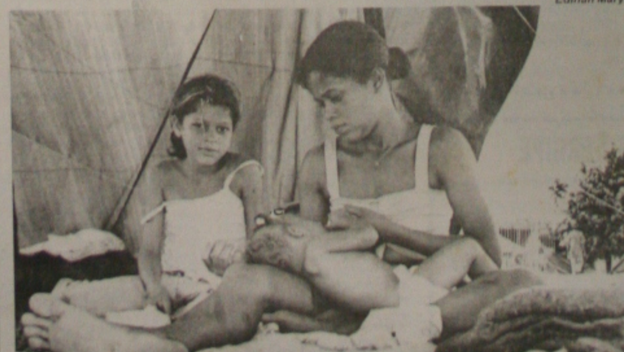
Trabalhadoras rurais ligadas ao MST estão acampadas na praça Tancredo Neves, em comemoração ao Dia Internacional da Mulher. (Página 1-B)