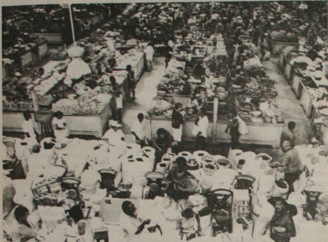
O setor de carne do mercado continuará sem energia por causa do impasse da Energipe e feirantes