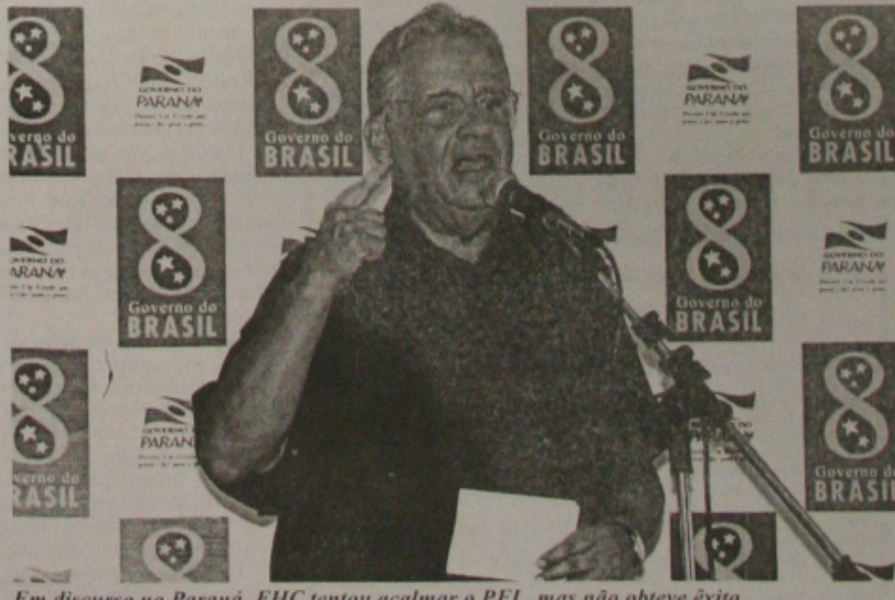
Em discurso no Paraná, FHC tentou acalmar o PFL, mas não obteve êxito