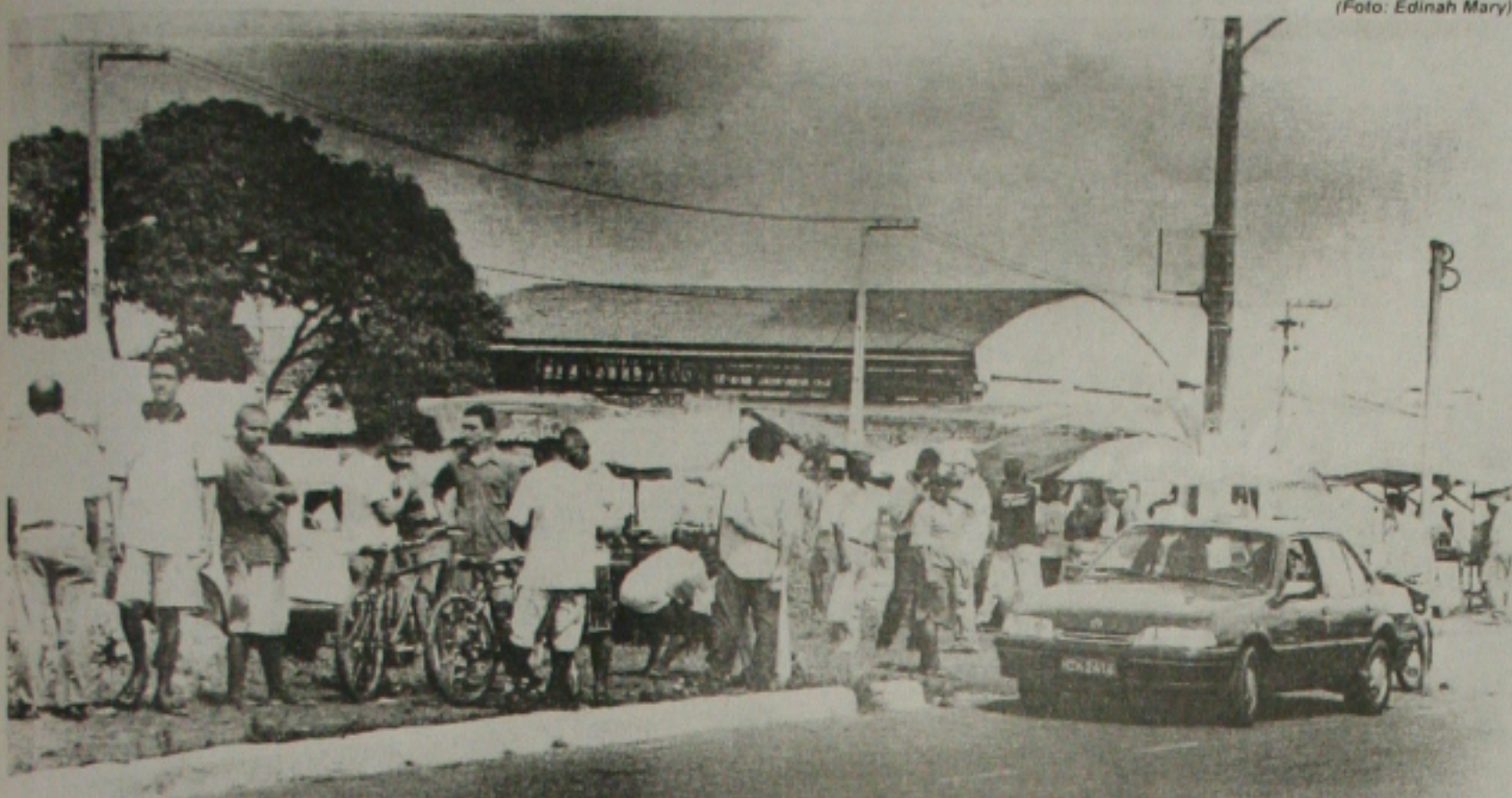
Pressionado pelo Ministério Público, os ambulantes mudaram o local da feira das trocas