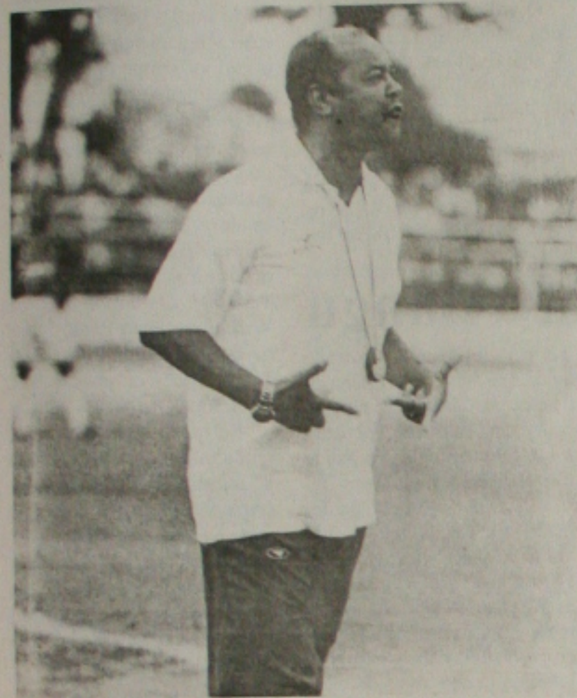
Sapatão sabe que vai ter dificuldade, mas acredita em uma vitória

Sapatão já tem time pronto para enfrentar o Bahia, na despedida do Campeonato do Nordeste