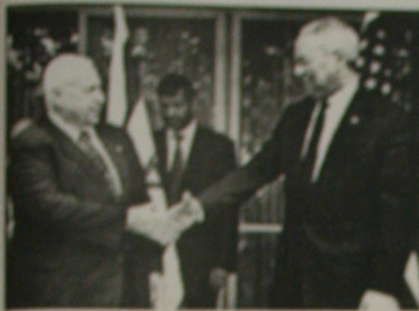
Encontro de Sharon e Powell, sem chance de acordo

Derrubada de Hugo Chávez provoca um clima de intranquilidade na América Latina