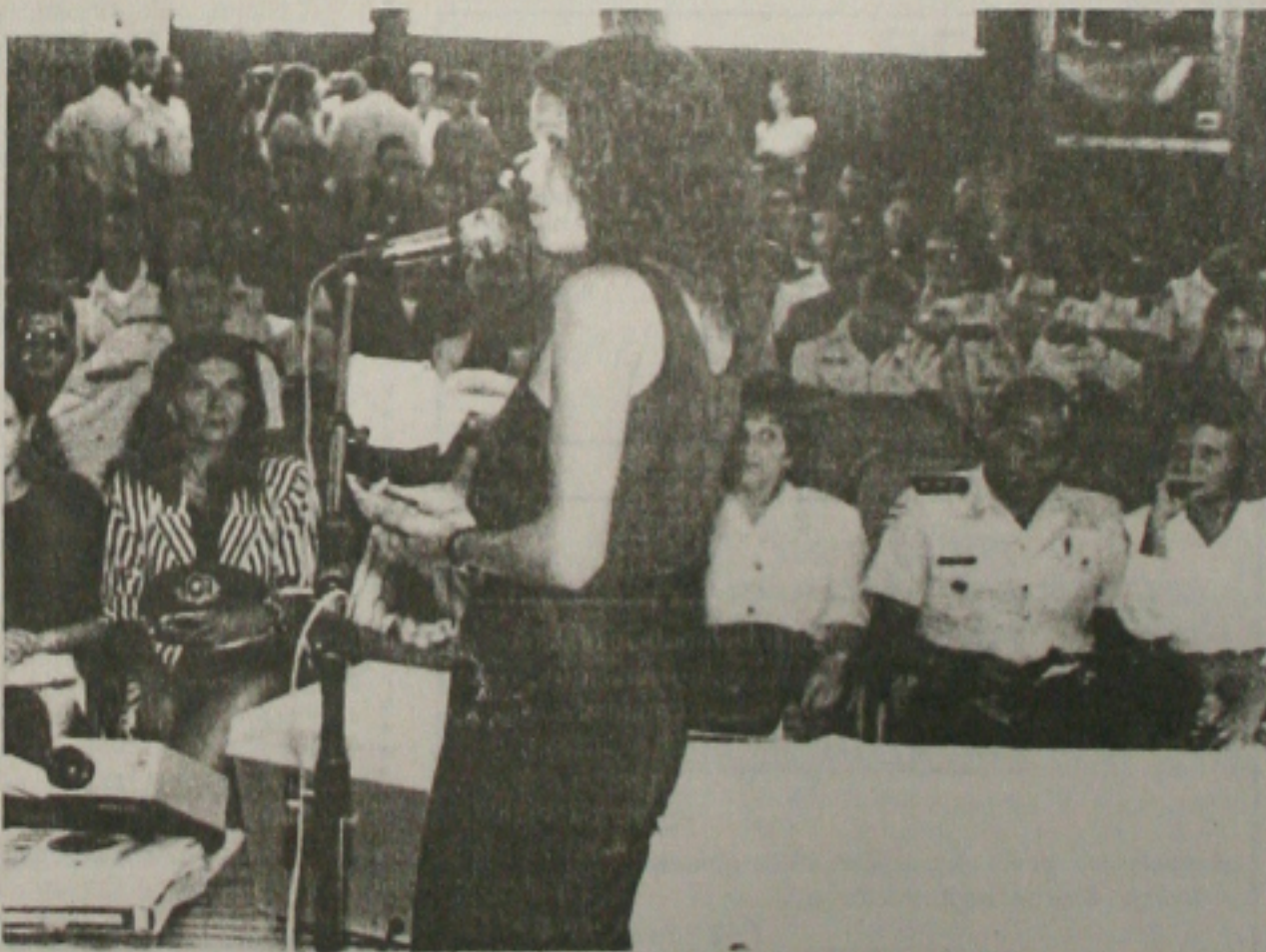
Polícia Militar e SEAD buscam a qualificação do policial militar com realização de curso