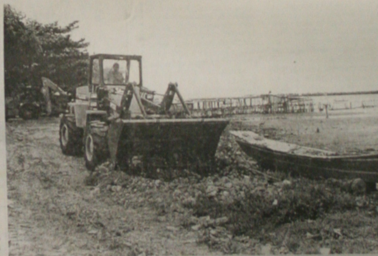
Logo após a assinatura da ordem de serviço, homens e máquinas iniciaram as obras na orlinha

Um ponto de ônibus na avenida Tancredo Neves, próximo ao Hospital João Alves Filho, ameaça desaparecer, depois que parte do acostamento da pista cedeu, por causa das últimas chuvas, provocando o aparecimento de uma grande cratera. A rampa que dava acesso aos pedestres, ao lado da cobertura do ponto de parada de ônibus, também desabou, aumentando o risco para os usuários do sistema de transporte. (Página 2B)