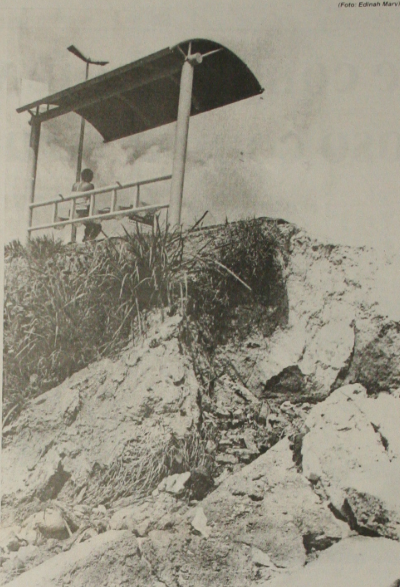
Uma cratera pode causar a queda do ponto de ônibus na Avenida Tancredo Neves