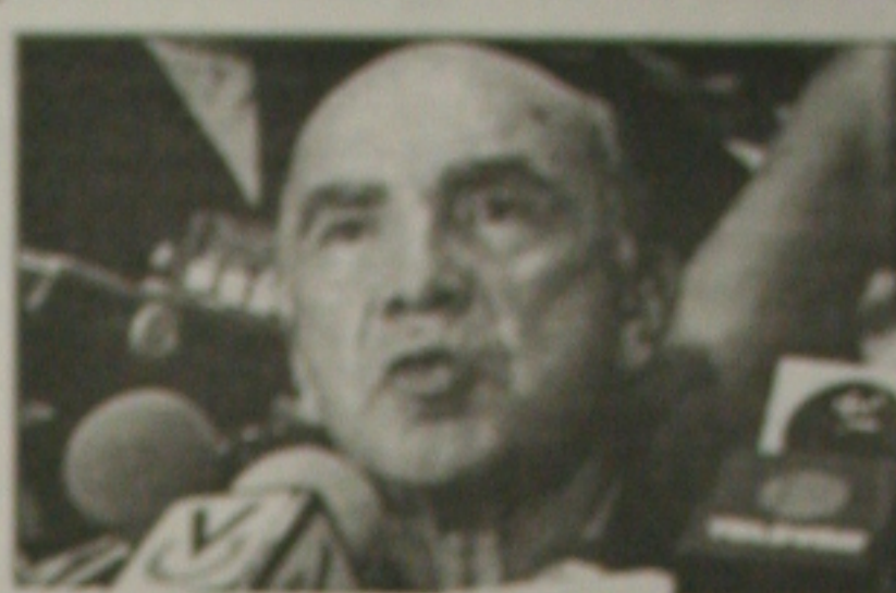
Carmona, o novo presidente, promete marcar eleições

O líder empresarial também determinou a suspensão