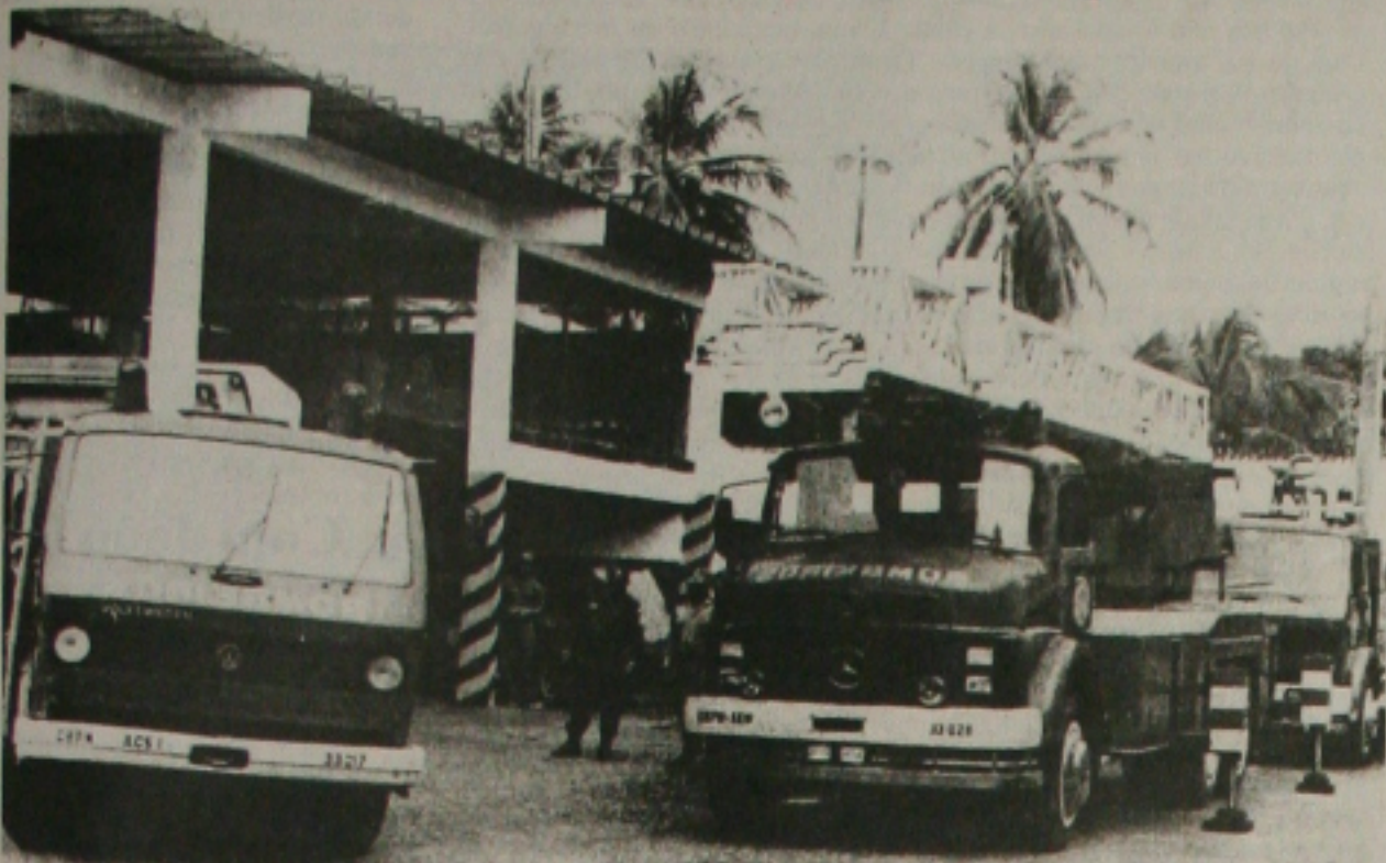
O Corpo de Bombeiros está em alerta máximo sobre a venda de fogos de artifício

Dono da HR Informática já está no presídio de Maceió por determinação da justiça alagoana