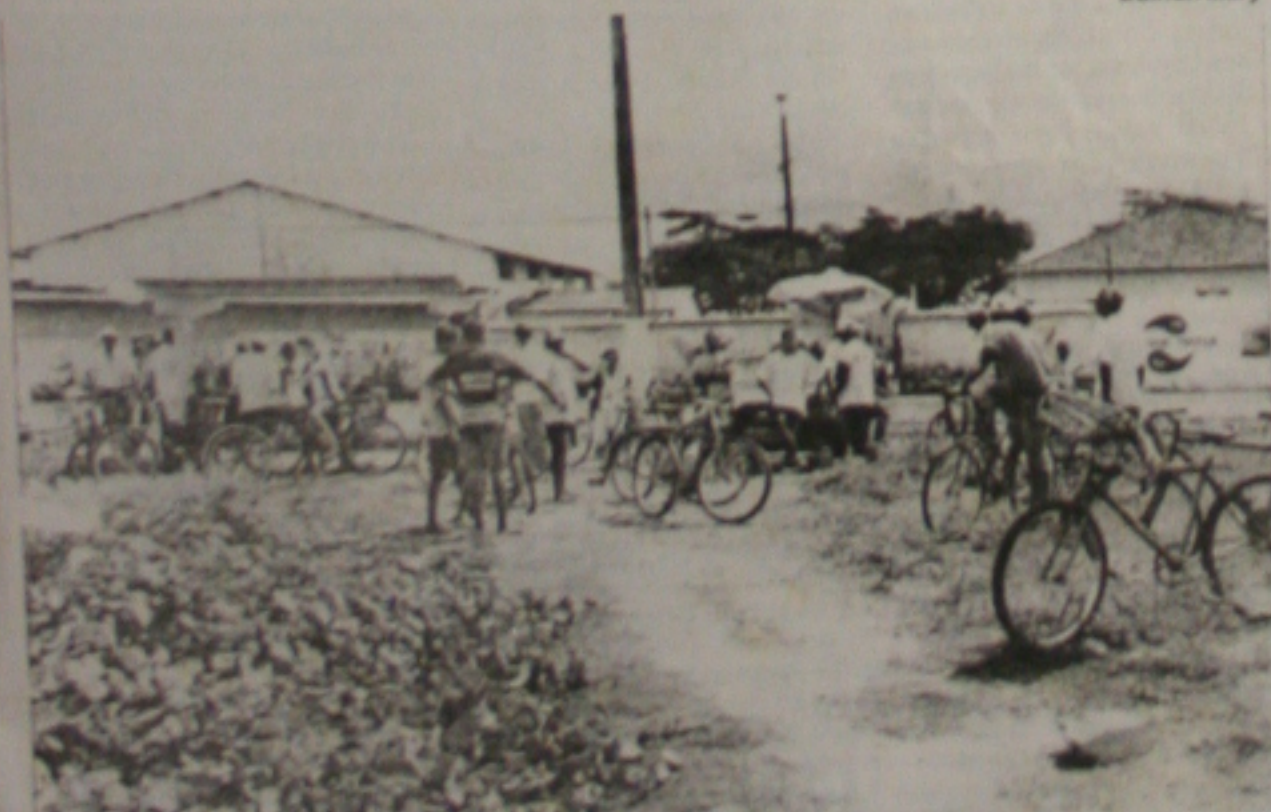
Ontem, a 'Feira das Trocas' já havia sido transferida para a avenida Maranhão