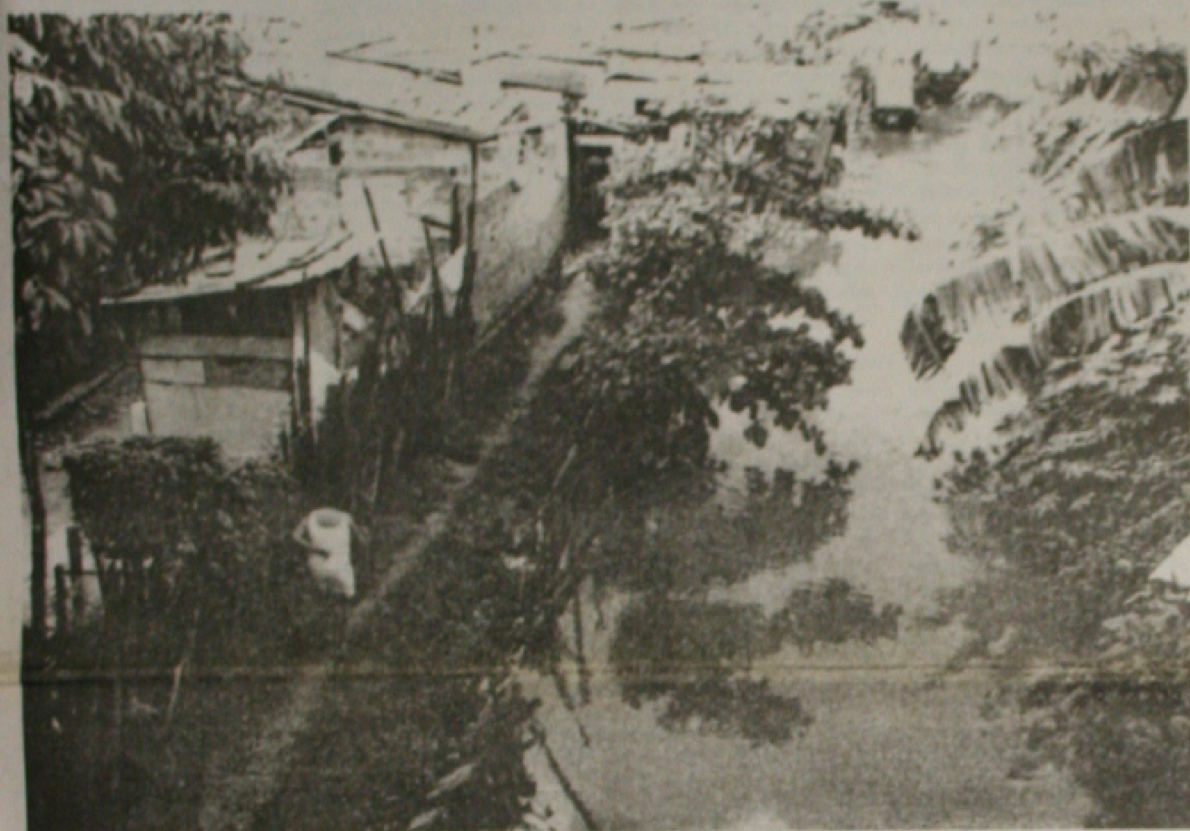
No Almirante Tamandaré, o canal transbordou e algumas casas são consideradas impróprias para moradia, pelo risco que oferecem aos moradores

IML faz necropsia em feto; obstetra está foragido e pode ter registro cassado