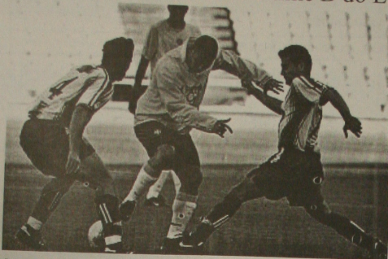
Ronaldo tenta fugir da marcação dos jogadores do time B do Espanyol, durante o jogo-treino

A vitória por 5 a 0 sobre o time B do Espanyol mostrou poucas virtudes da equipe