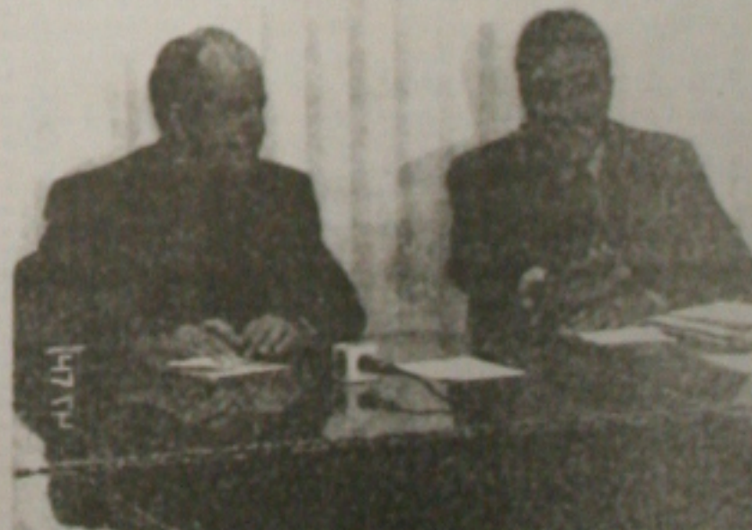
Albano e Déda acertaram ontem os detalhes da agenda de ações entre governo e PMA

O governador Albano Franco e o prefeito Marcelo Déda se reuniram ontem, no Palácio de Despachos, quando começaram a definir uma agenda mínima para a execução de obras e serviços na capital, em regime de parceria entre as administrações estadual e municipal. Do encontro também participaram os prefeitos Armando Batalha, de São Cristóvão, e José Franco, de Socorro, com os quais ficou acertada a consolidação do sistema integrado de transporte coletivo entre Aracaju e os dois municípios. (Página 3A)