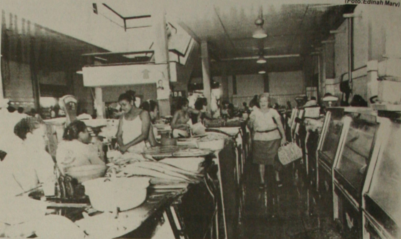
Na lista de inadimplência do SPC, os feirantes do Albano Franco protestam para não pagar dívidas com a prefeitura

O presidente da Associação disse que vai solicitar do Governo do Estado, novos balcões e ainda que sejam instalados medidores individuais para cada feirante. Ele lembrou que o Ministério Público Estadual está com uma ação na Justiça para que a Energipe coloque medidores individuais para cada trabalhador do mercado.