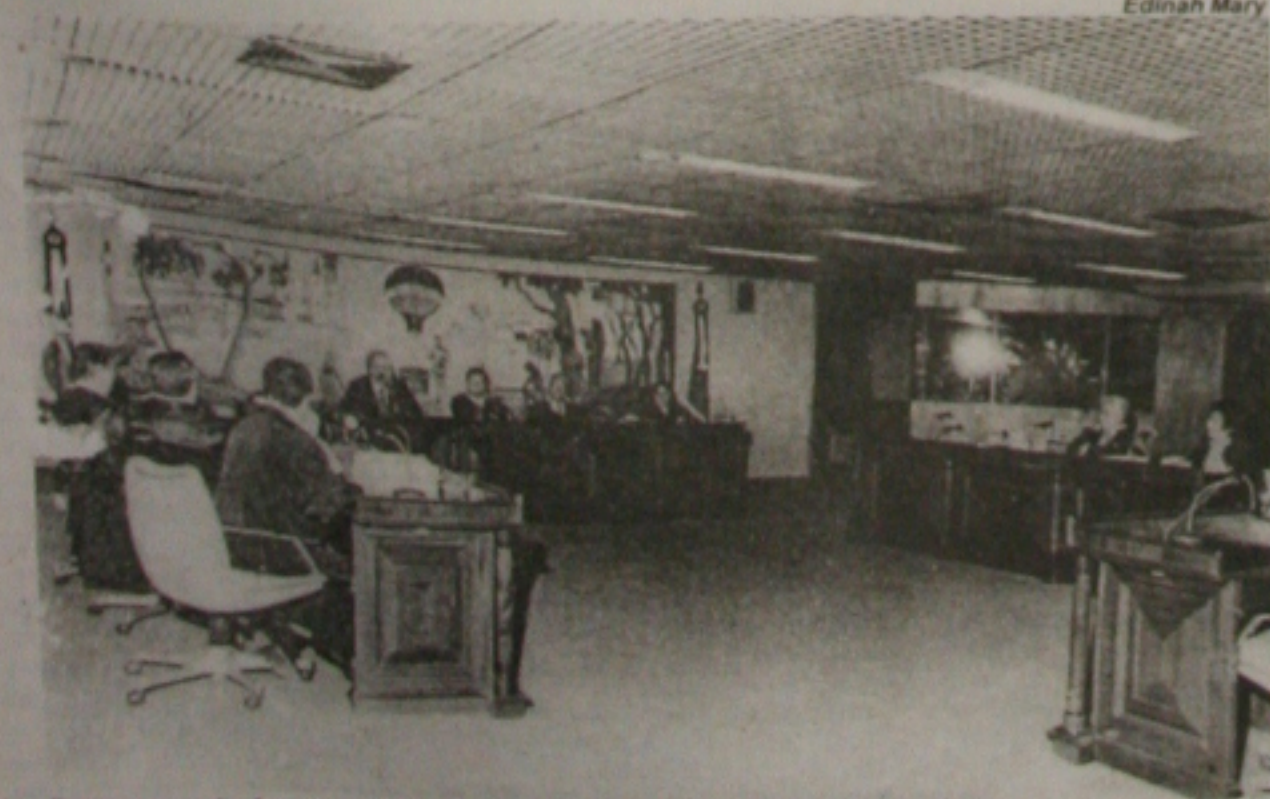
Durante a sessão de ontem, o pleno do Tribunal aprovou a punição das prefeituras e Câmaras municipais