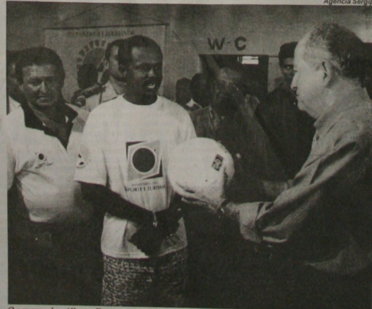
O governador Albano Franco examina bola que já foi produzida no presídio de Areia Branca

Foi inaugurada ontem, no presídio de Areia Branca, uma fábrica de bolas que vai gerar empregos para 40 presos. Serão produzidas 100 bolas/dia. A expectativa é que nos próximos dias a unidade seja duplicada. (Página 2-B)