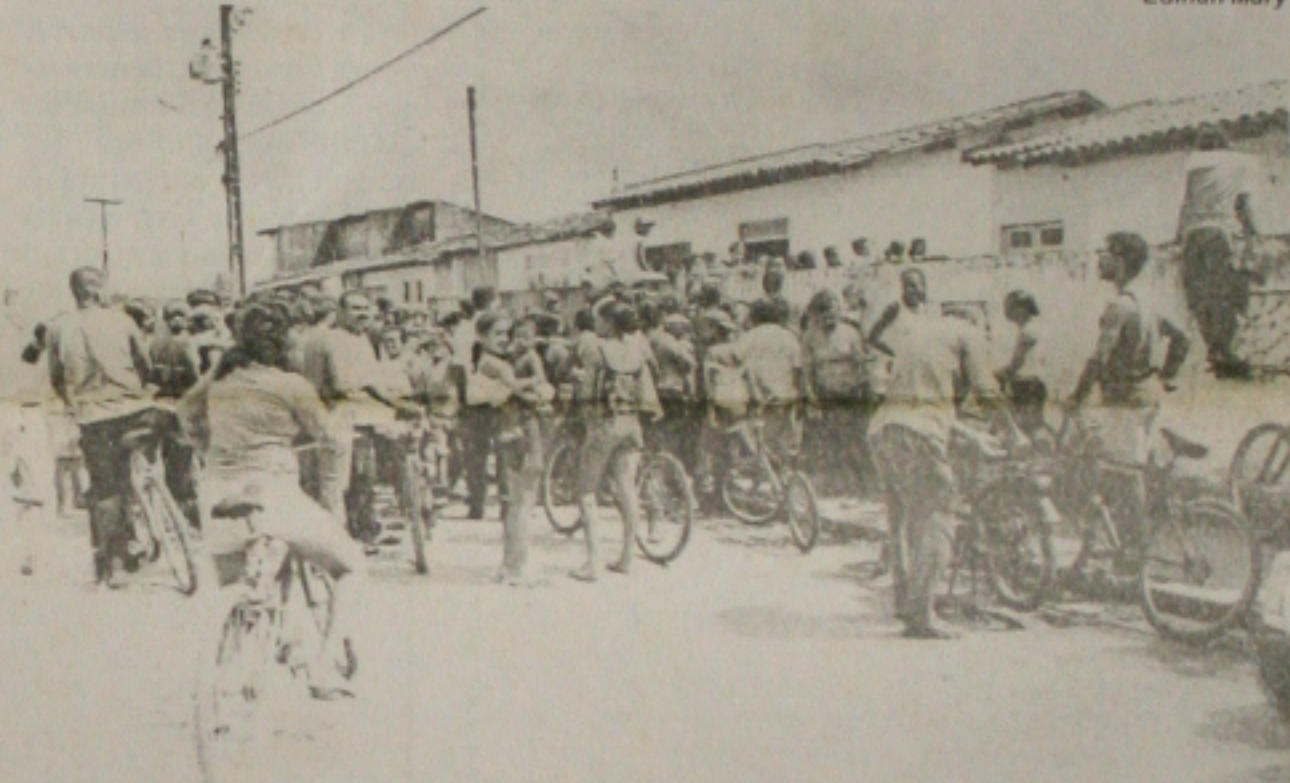
Atraídos pela notícia da suposta aparição, dezenas de moradores se concentraram em frente a casa...