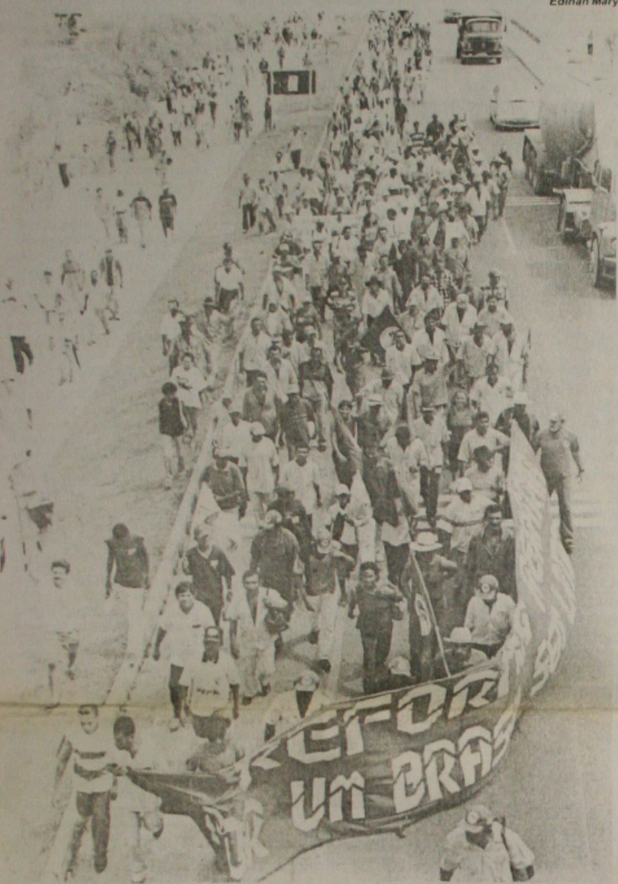
Uma passeata para cobrar maior agilidade no processo de reforma agrária reuniu cerca de 6 mil trabalhadores rurais em Sergipe. (Página 3B)