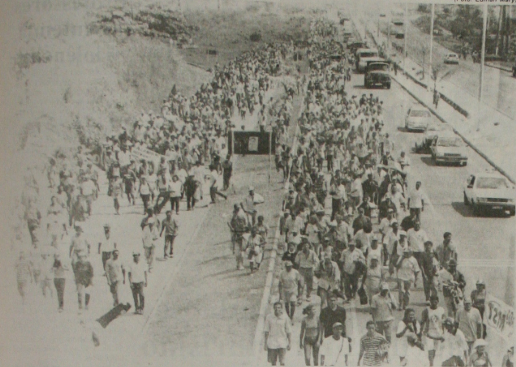
Cerca de seis mil trabalhadores sem-terra participaram ontem da passeata em defesa da reforma agrária

No Dia Nacional dos Trabalhadores Rurais, comemorado ontem em todo o País, mais de seis mil trabalhadores sem-terra, segundo os organizadores, se reuniram ontem pela manhã no trevo da saída de Aracaju, na BR 101, depois em passeata rumaram para a Praça General Valadão, onde fizeram um ato público. Antes, eles almoçaram na garagem da Empresa Senhor do Bomfim, passaram pelo Instituto Nacional de Colonização e Reforma Agrária (Incra), entregaram uma pauta de reivindicação e protocolaram uma audiência com o Governo do Estado.