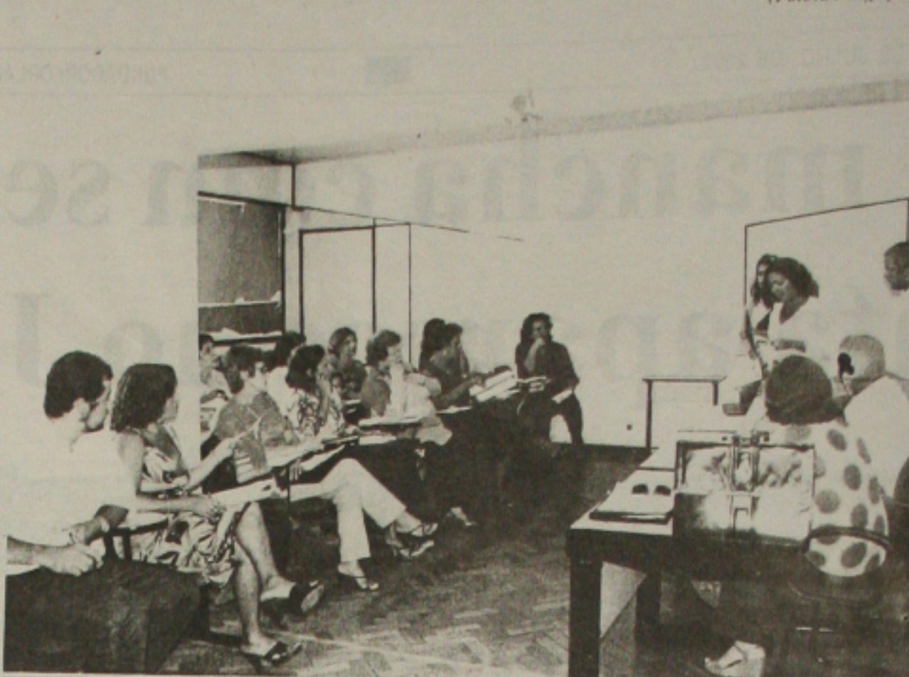
Professores discutem a realização de olimpíada sobre saúde e questão do meio ambiente