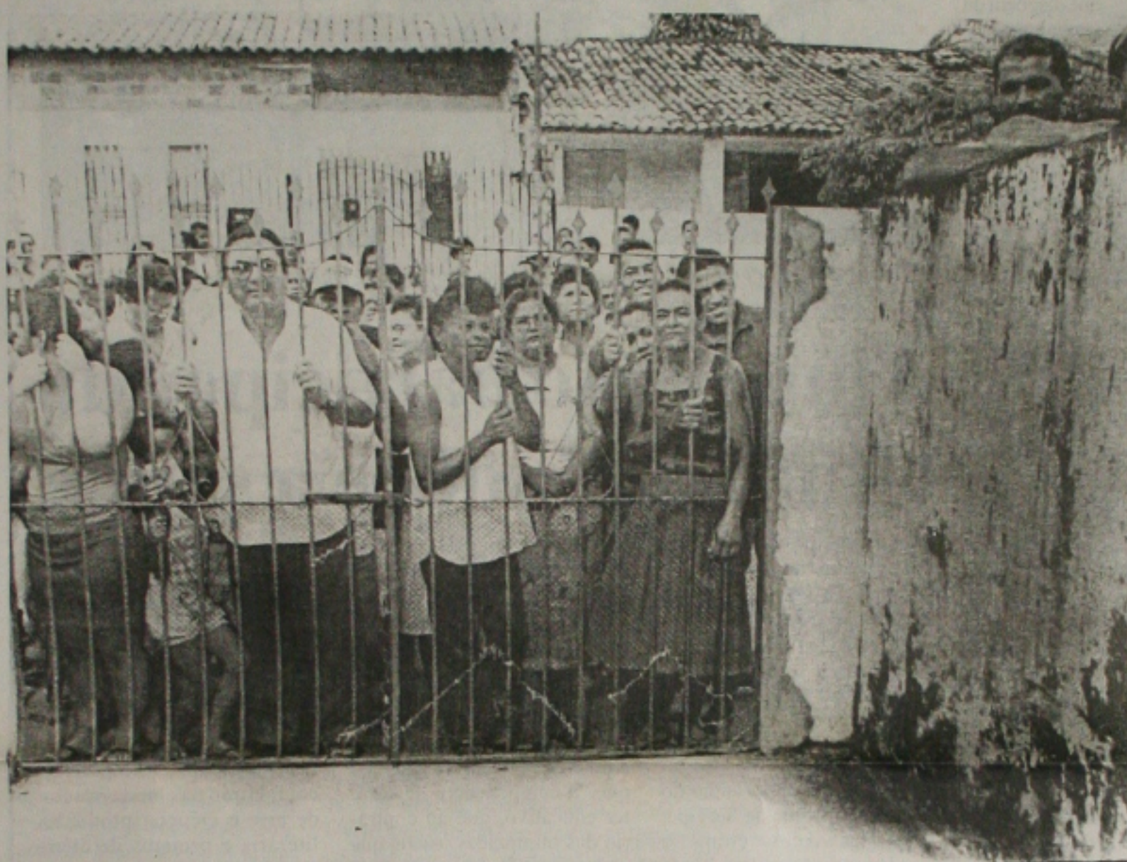
Aparição de outra imagem de santa (no destaque) levou muita gente a uma residência no conjunto João Alves, em Socorro