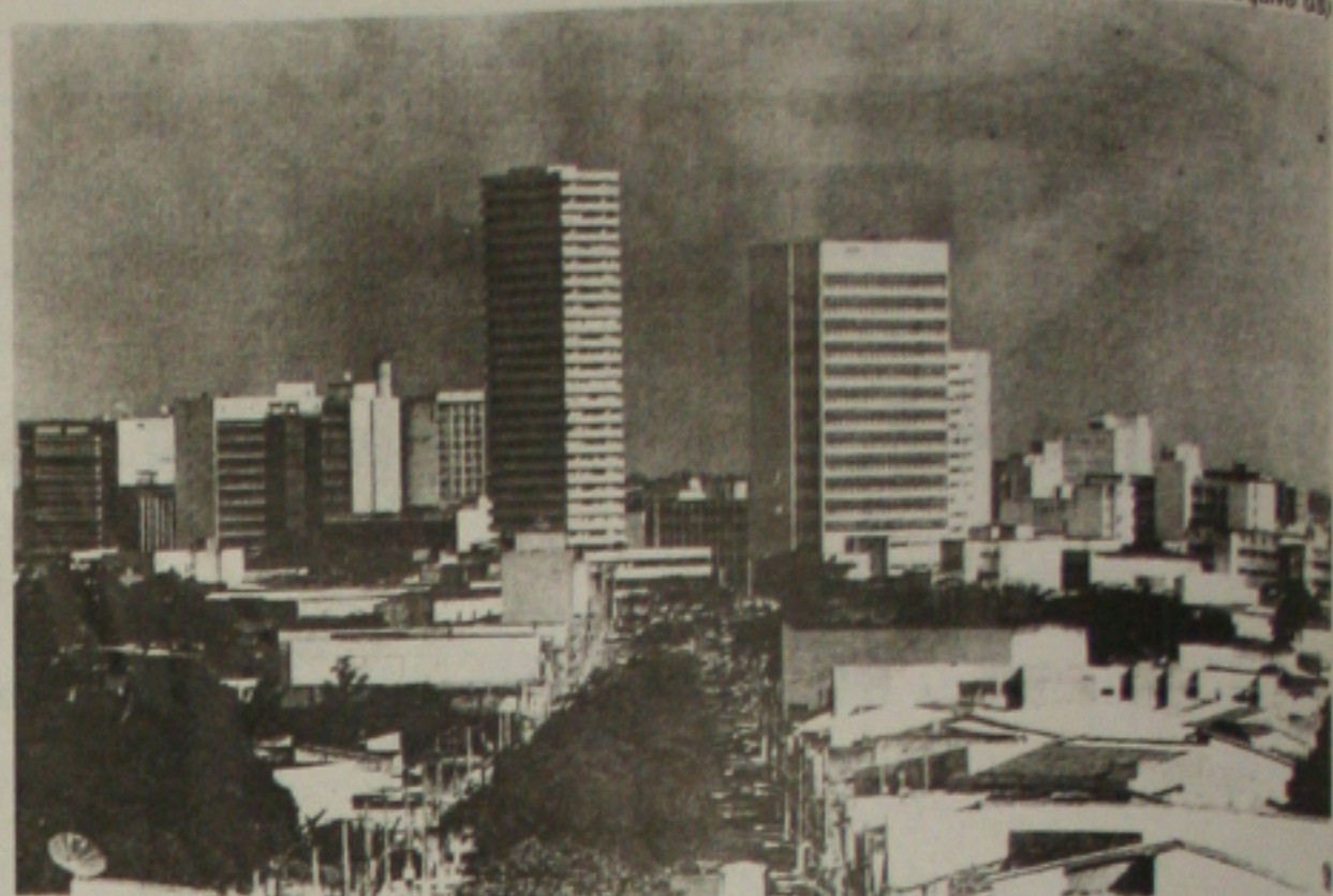
Aracaju é a segunda capital brasileira que registrou a maior alta no preço do óleo de soja

Comportamento dos preços - A extraordinária elevação do dólar, em julho, foi determinante para o aumento do preço de três produtos da cesta básica. Óleo de soja, com alta em catorze capitais, pão francês, em quinze, e farinha de trigo, nas nove cidades do Centro-Sul do país, onde seu preço é acompanhado. No primeiro caso, ainda que a produção nacional de soja seja suficiente para abastecer o mercado interno, como se trata de produto de exportação, com preço cotado internacio-