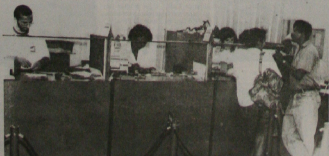
Bancários propõem a criação de dois turnos de trabalho para melhor atender sua clientela