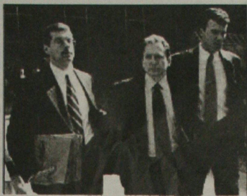
Executivos da WorldCom são presos e algemados nos EUA