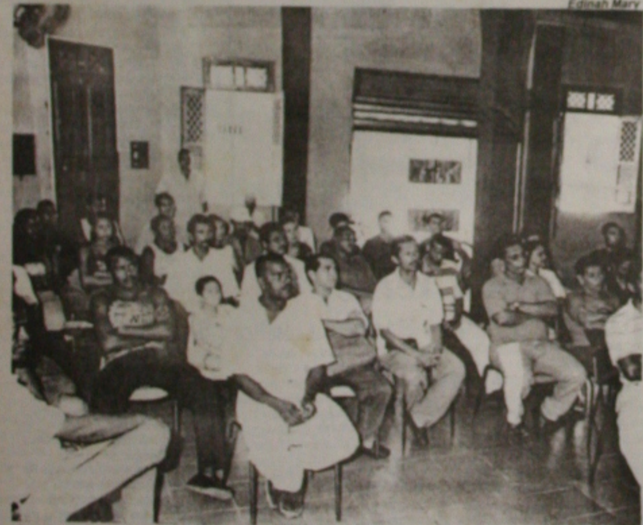
Operários da fábrica esperavam ontem uma solução negociada para evitar as demissões na Confiança