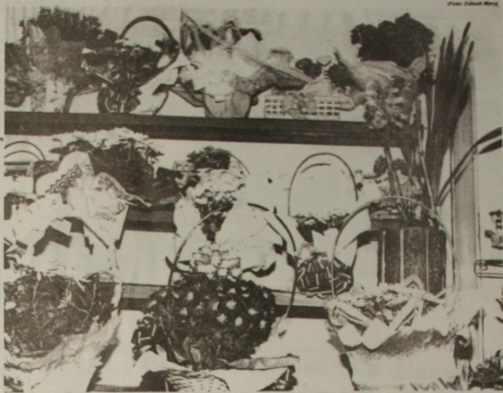
Floricultura aposta na primavera para aumentar o volume de vendas durante a estação

Com uma variedade de arranjos e flores diversificadas, as floriculturas esperam fugar os consumidores, antecipando a garantia de aquecimento de vendas nos próximos meses. (Kátia Simone)