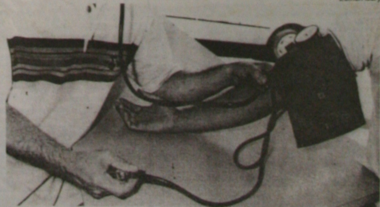
Com a aprovação do projeto, o serviço de controle da pressão arterial nas farmácias será legalizado