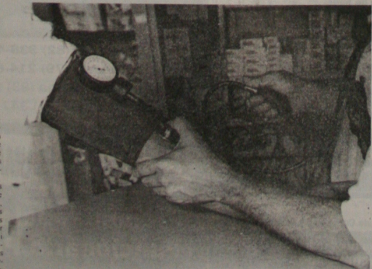
Projeto prevê que as farmácias poderão ajudar no controle da hipertensão dos brasileiros

As doenças cardiovasculares são responsáveis por 30% dos óbitos no Brasil entre pessoas de 30 a 39 anos, assim sendo, facilitará o acesso das pessoas quando necessitarem medir pressão.