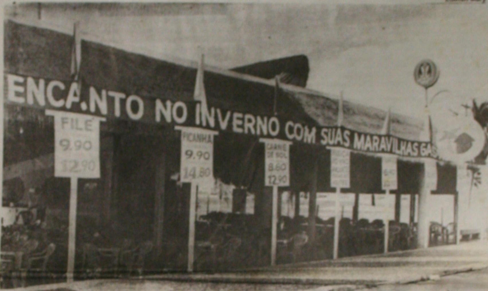
Os preços cobrados por bares e restaurantes da orla estão entre os mais caros do Nordeste