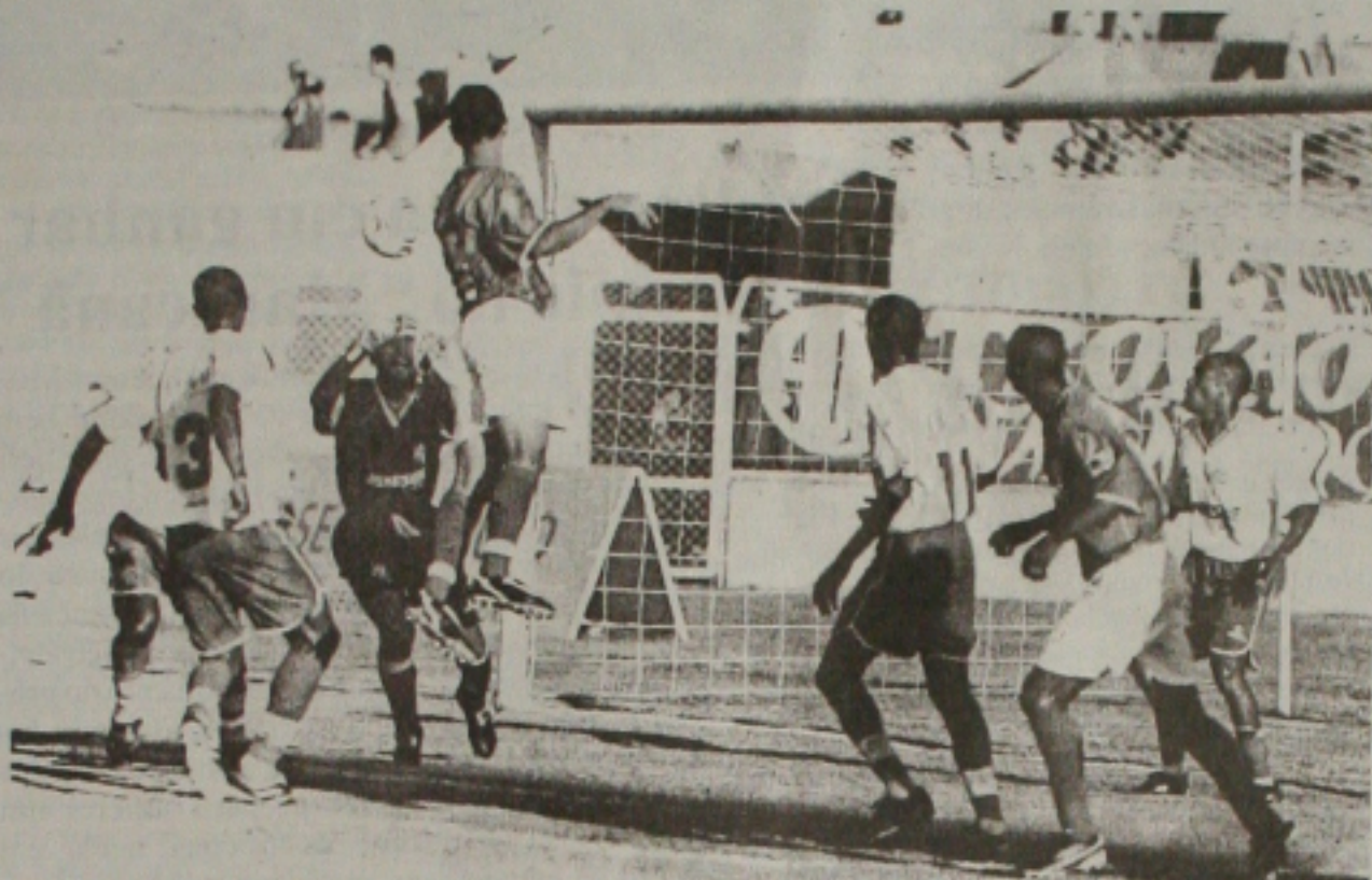
O Confiância foi superior e venceu o Sergipe por 2x0, classificando-se para a próxima fase

A vitória de domingo contra o Sergipe serviu para consolidar a hegemonia do time proletário no futebol sergipano no momento e mostrar que com um pouco de trabalho e