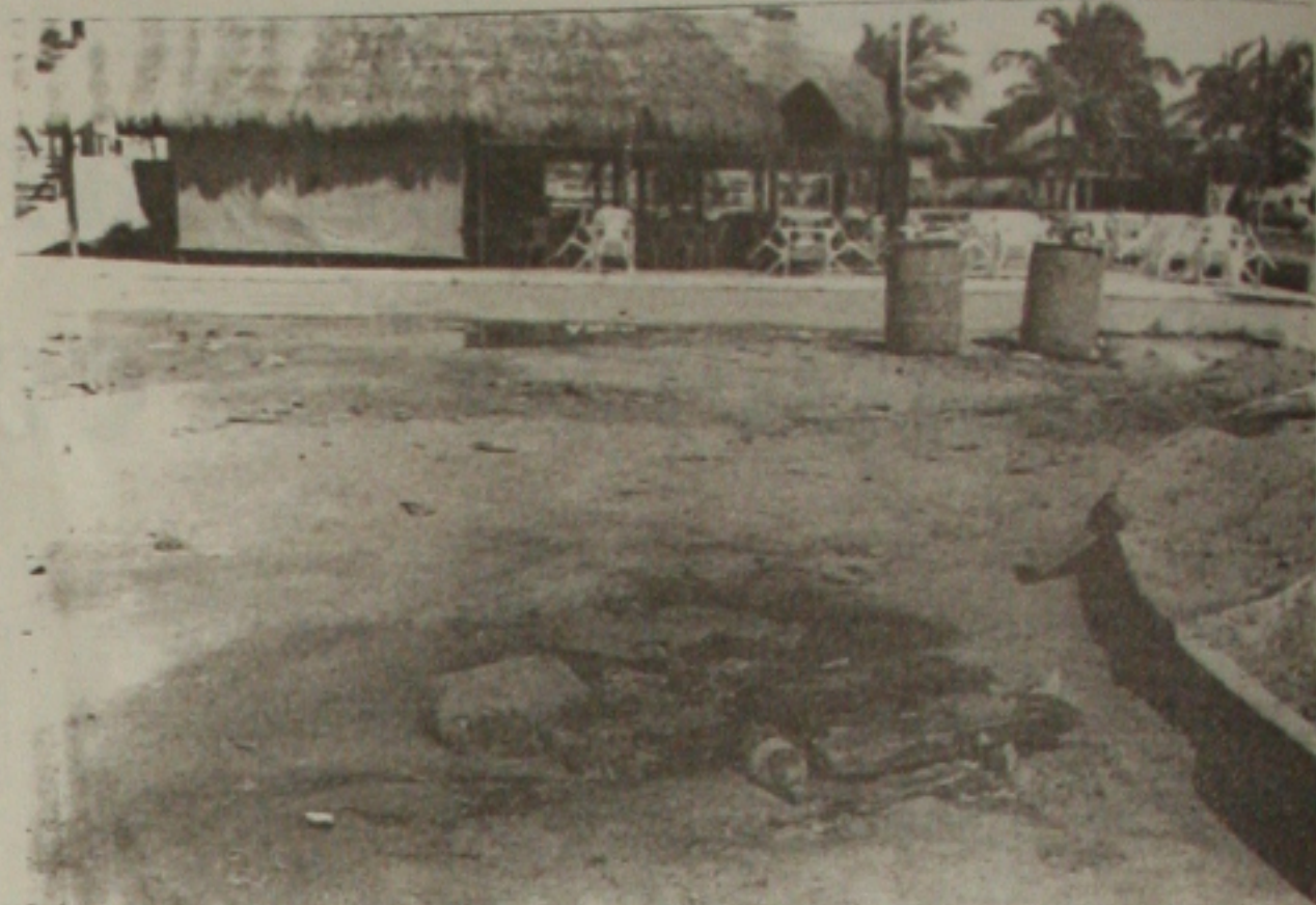
O abandono da orla da Atalaia tem motivado uma série de reclamações dos gerentes de hotéis

Lisboa lembrou que o fórum empresarial de Sergipe entregou aos candidatos ao governo do Estado, uma pauta com várias sugestões de diversos segmentos. E o trade turístico, também estará enviando sugestões para que o candidato eleito coloque em prática, melhorando dessa forma não só a orla de Atalaia, mas a cidade e o Estado como um todo.