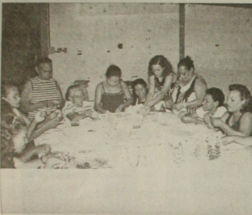
Os trabalhos estão em exposição no mirante da 13 de julho