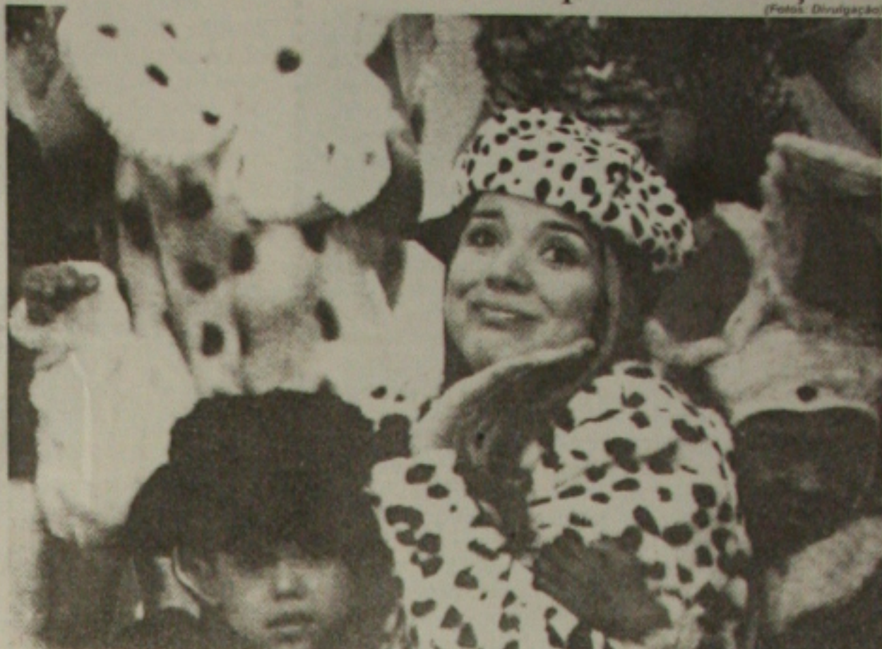
Mara Maravilha Para os Pequeninos o novo projeto da artista