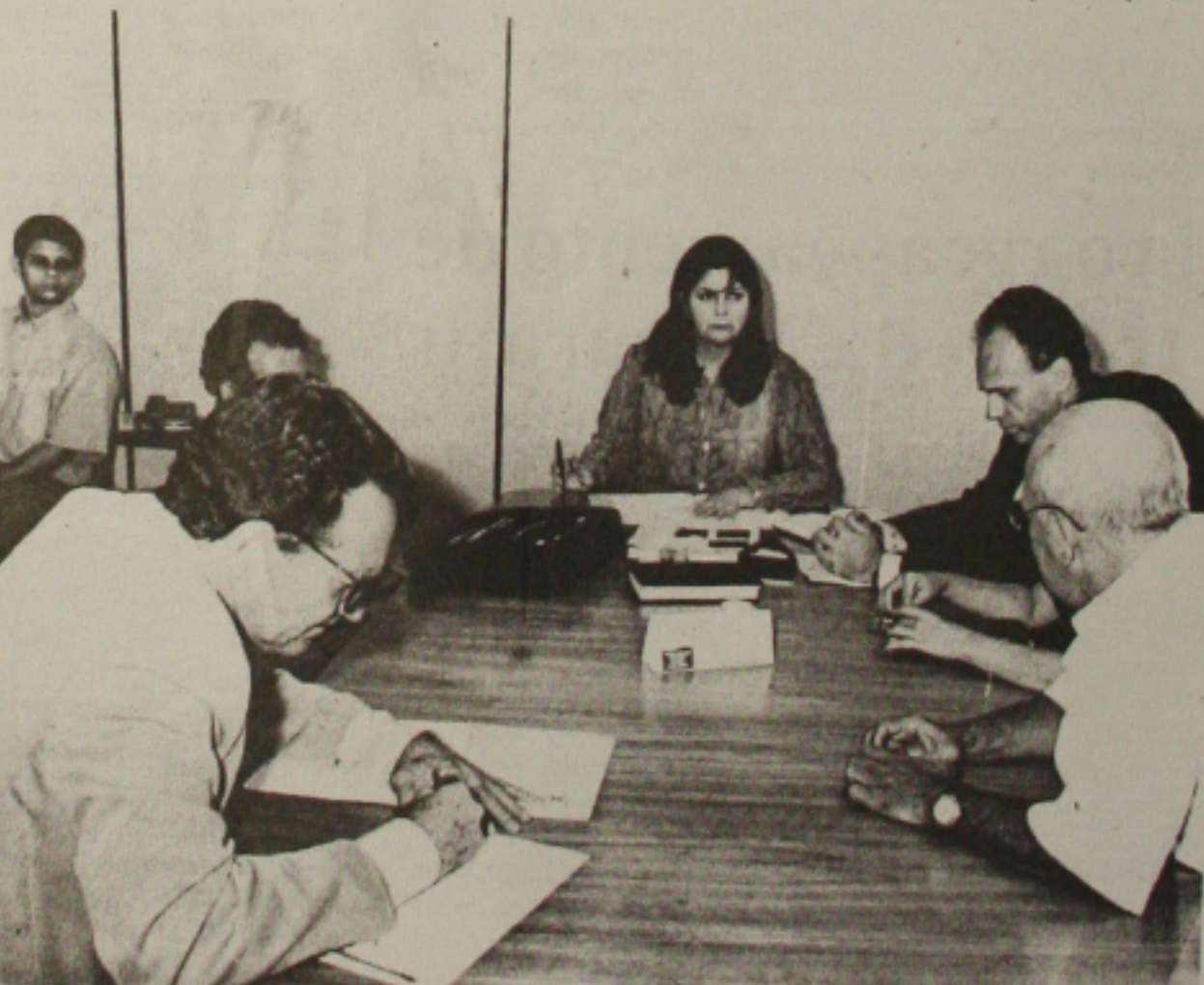
Dirigentes de empresas de ônibus e MP não chegam a um acordo sobre a questão das catracas

A outra discussão se deu a respeito da instalação de catracas nos ônibus, o que para muitos trabalhadores como os cobradores representa um grande problema. Eles temem que ocorram demissões por conta da mudança que provocará a substituição da mão-de-obra humana por máquinas.