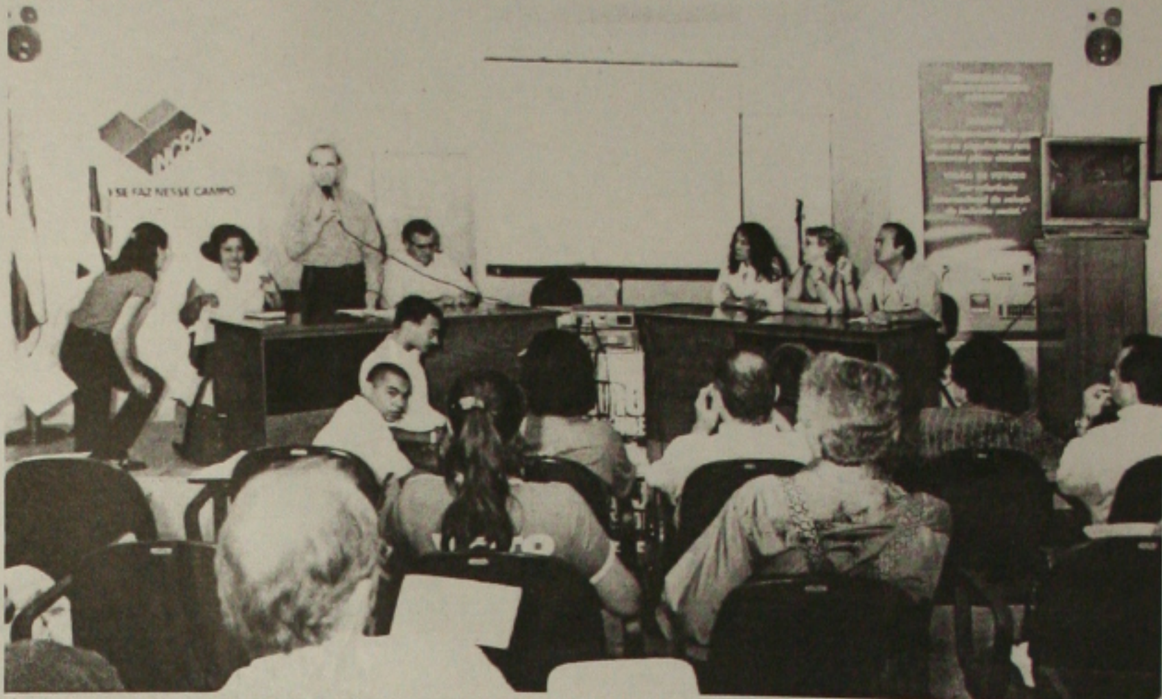
Inkra reúne à imprensa para discutir em seminário o Plano de Desenvolvimento Sustentável