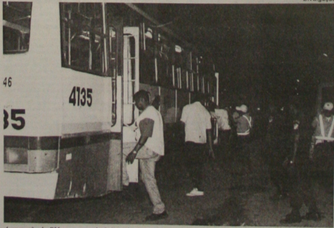
A operação da PM vem parando ônibus do sistema de transporte da cidade e revistando todos os passageiros