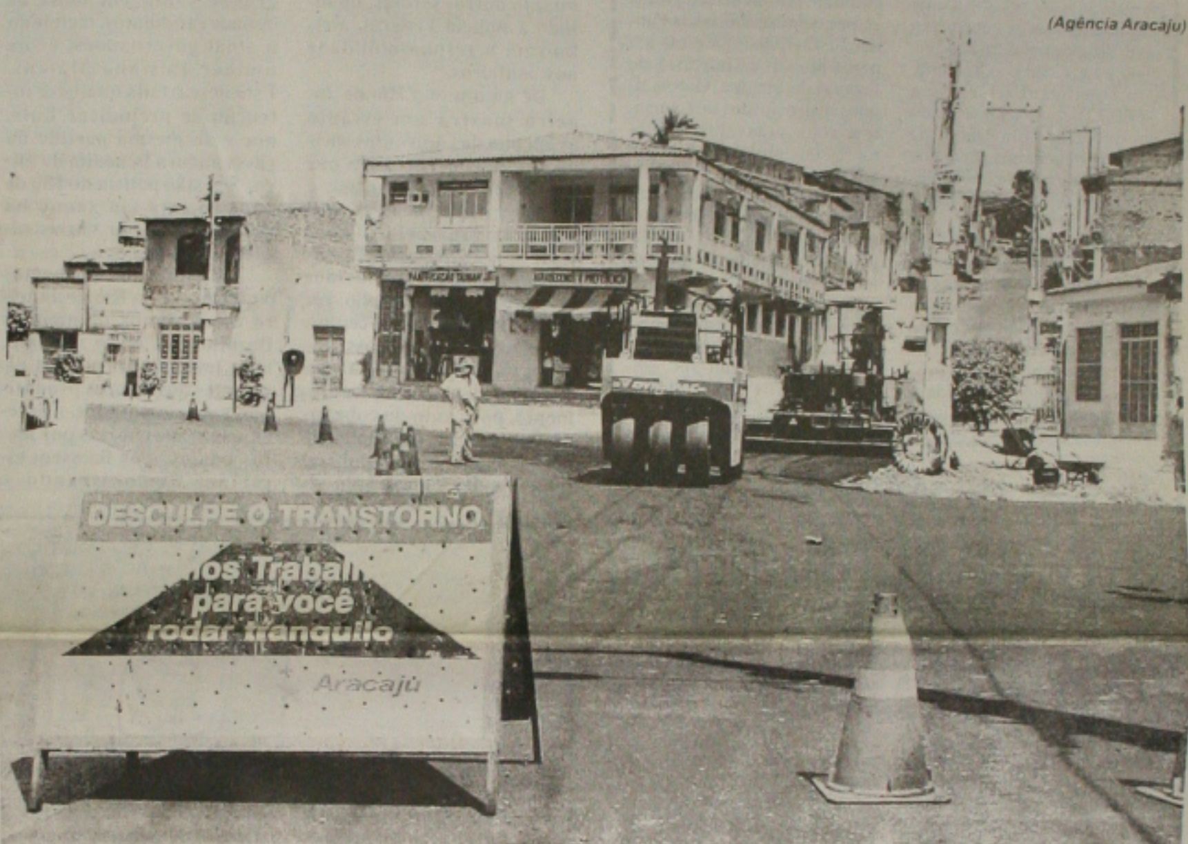
Homens e máquinas da Emurb iniciaram esta semana o recapeamento asfáltico de mais um trecho da avenida Visconde de Maracaju. (Página 3B)

eleger no primeiro turno ele precisa ter 50% mais um dos votos válidos). José Serra (PSDB) subiu um ponto e tem agora 19% das intenções, contra 16% de Anthony Garotinho (PSB), que também teve uma oscilação positiva de 1%. O candidato da Frente Trabalhista, Ciro Gomes (PPS), foi o único a registrar queda, de 1 ponto. O número de votos em branco, nulos e o número de eleitores indecisos também registraram redução. (Página 8A)