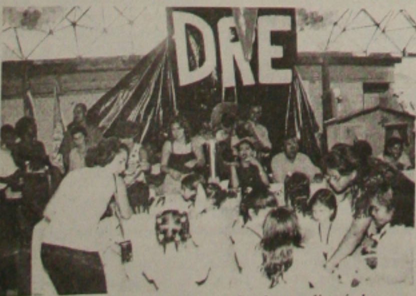
Semana da Criança é aberta pela Seed com olimpíada

Amanhã, após divulgação dos resultados, às três escolas com um maior número de vitórias nas modalidades receberão troféus.