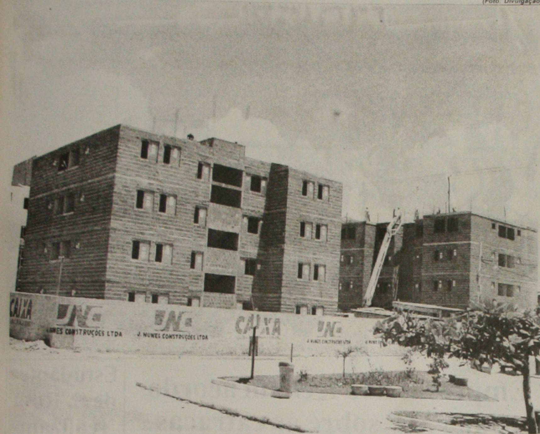
A apartamentos do Condomínio Pousada Verde deverão ser entregues aos mutuários no início de 2003

"A Vale nunca enfrentou um dissídio coletivo e indicativo de greve"