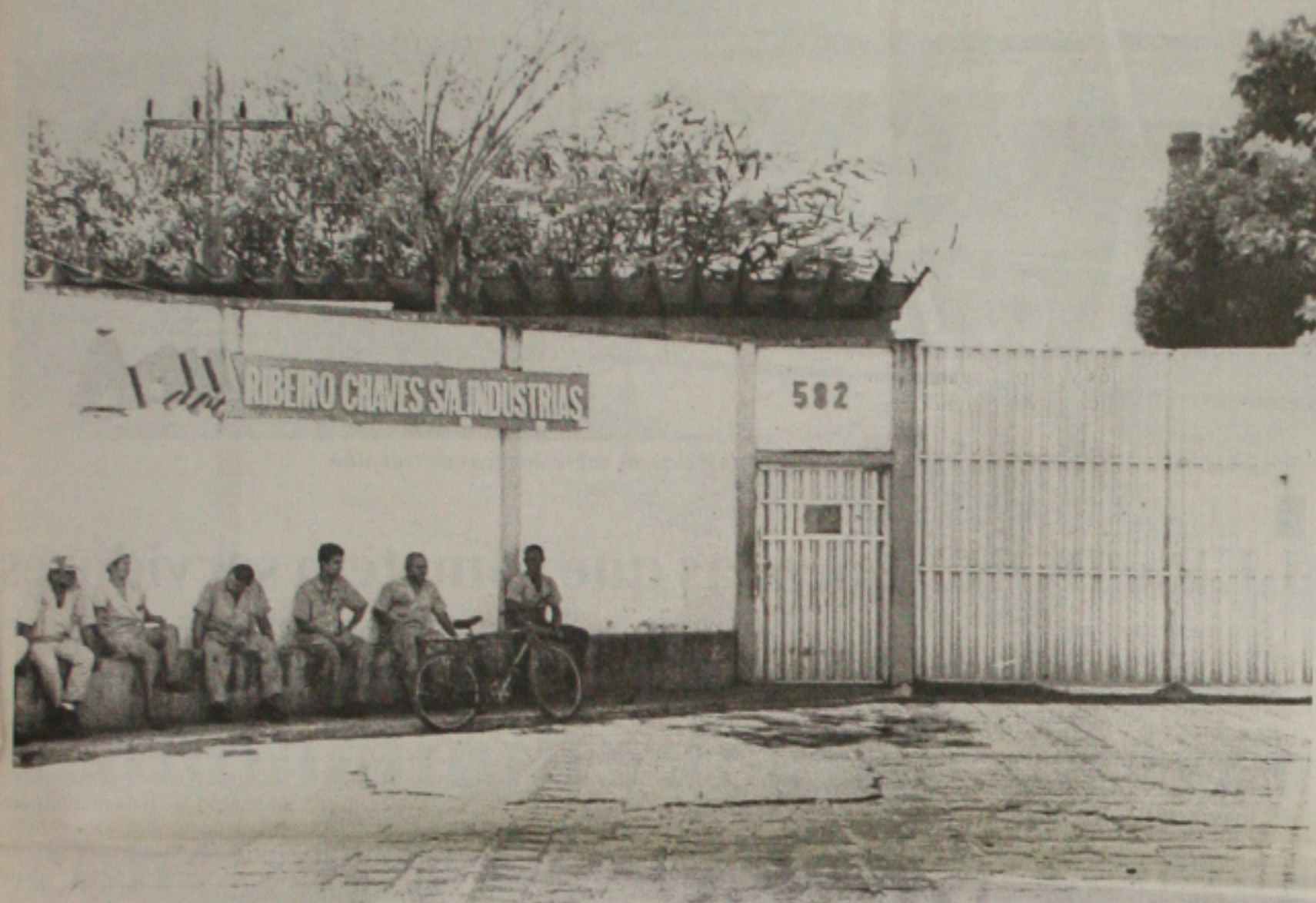
Os funcionários da Fábrica Confiança esperam hoje a decisão sobre a rescisão do contrato de trabalho

Hoje, o dia é decisivo para cerca de 50 trabalhadores da Ribeiro Chaves (Fábrica Confiança). Representantes da fábrica, do Governo do Estado e da diretoria do Sinditêxtil - Sindicato dos Trabalhadores nas Indústrias de Fiação e Tecelagem reúnem-se às 10h, na Codisc. Em pauta, a possibilidade do Governo adquirir um bem da fábrica e solucionar temporariamente o problema que a empresa enfrenta - a concordata. Dos 100 operários que saíram em férias, 50 demissões foram confirmadas