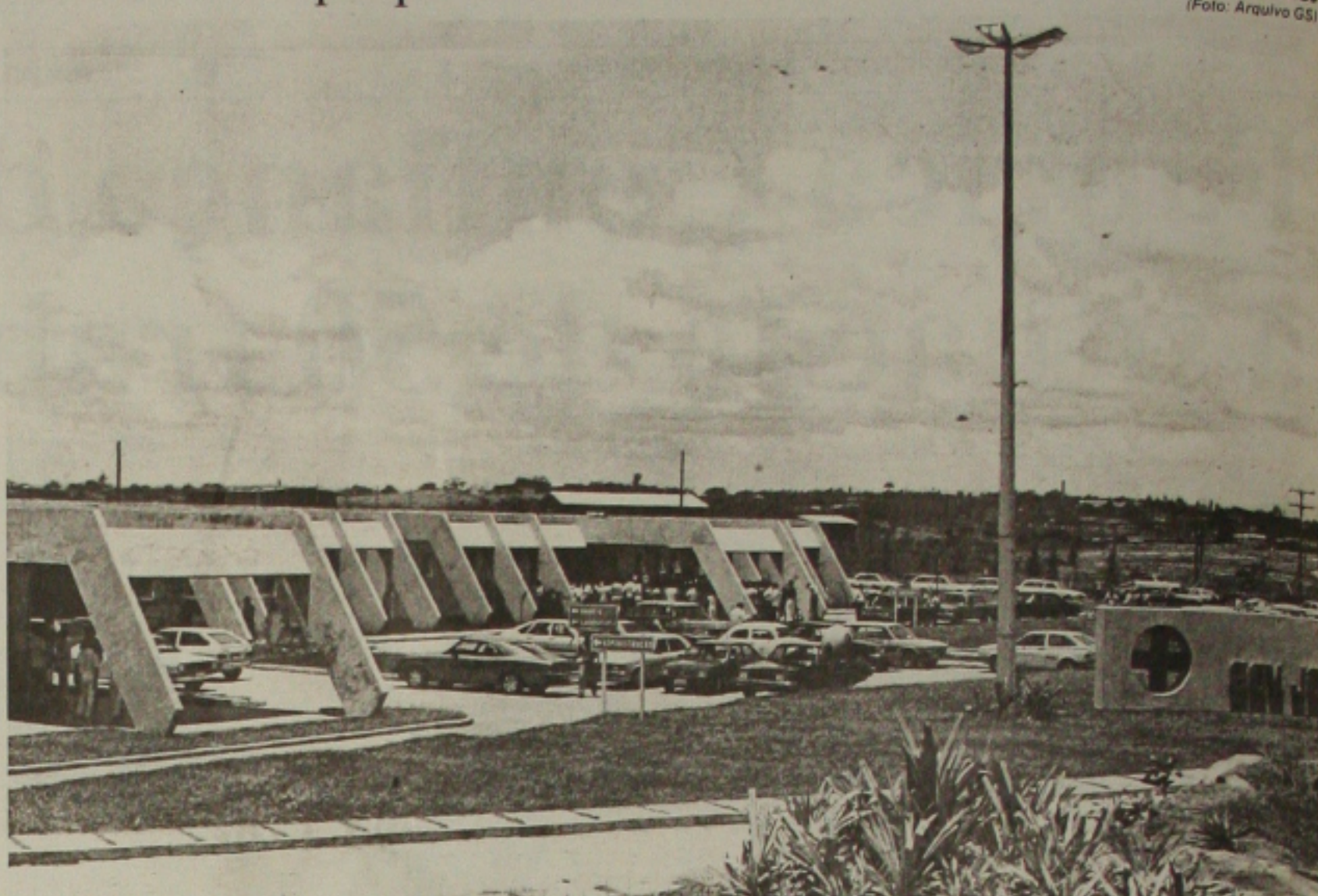
Os servidores do Hospital João Alves assistem ciclo de palestras sobre doenças do trabalho

"A horticultura deve prevalecer, por razões até de característica da região"