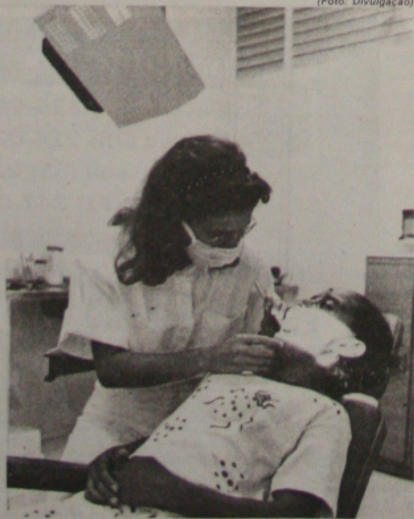
Dentista mostra à população