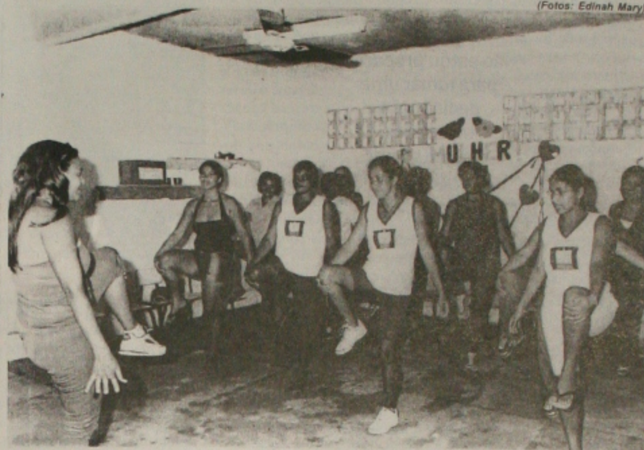
A participação da comunidade tem ajudado a escola a desenvolver um projeto pioneiro

Depois desse período, as mães passaram a frequentar a unidade todas as sextas-feiras para "brincar", relaxar, praticar atividades físicas. Apenas um dia foi insuficiente para atender aos anseios das mães. Hoje, a participação delas corresponde a três