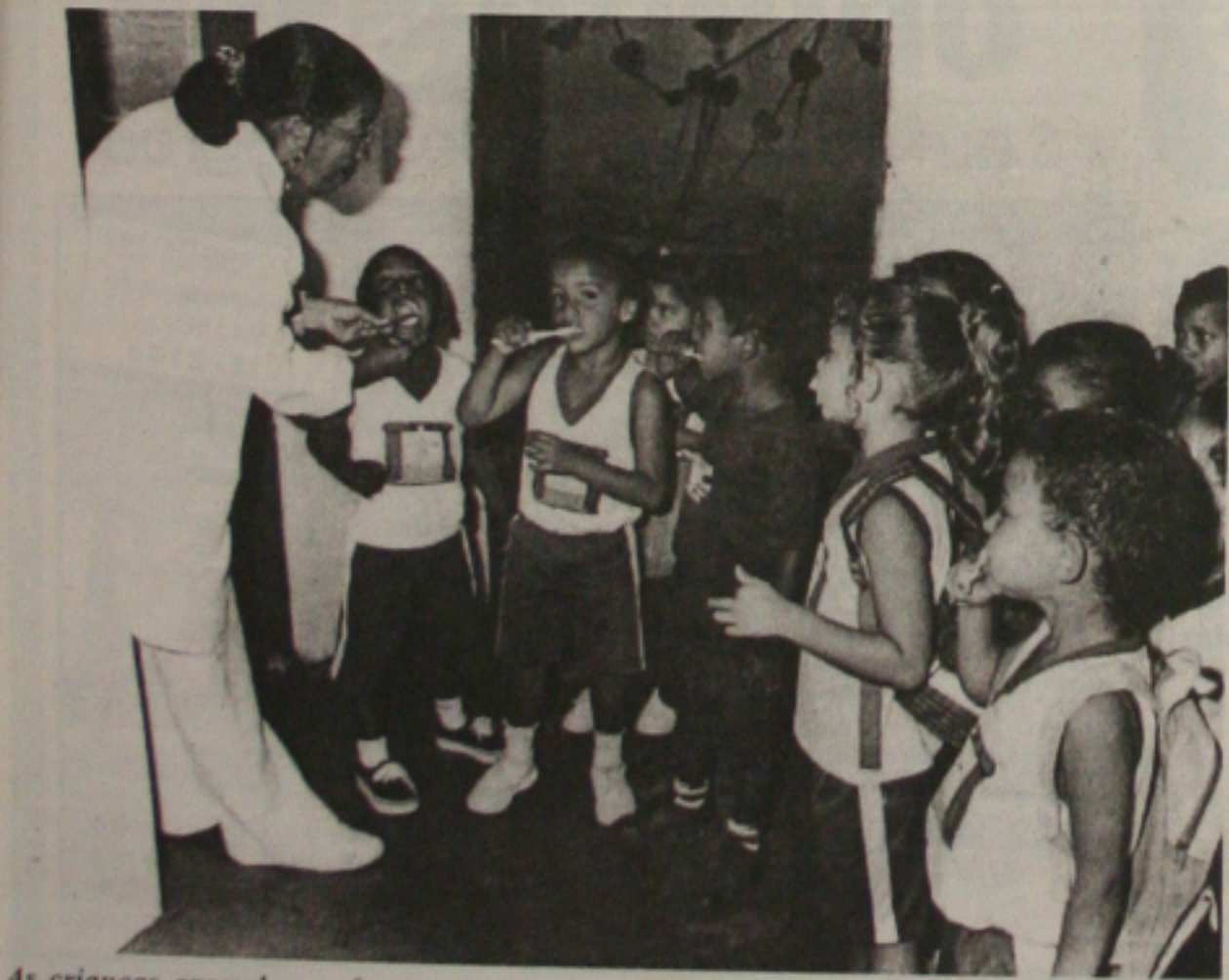
As crianças aprendem a fazer corretamente a higiene bucal para combater a cárie