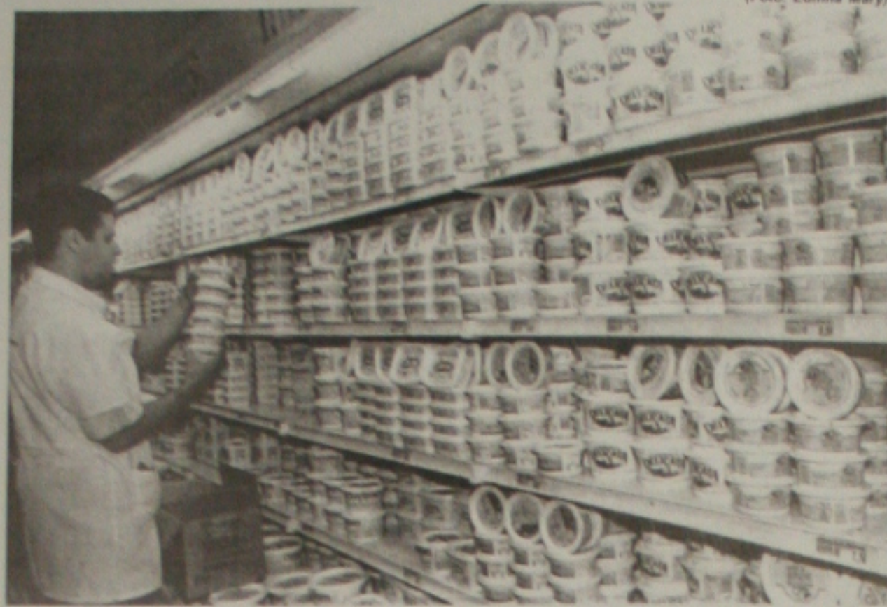
A manteiga está entre os produtos que mais sofreram reajuste como componente da cesta básica