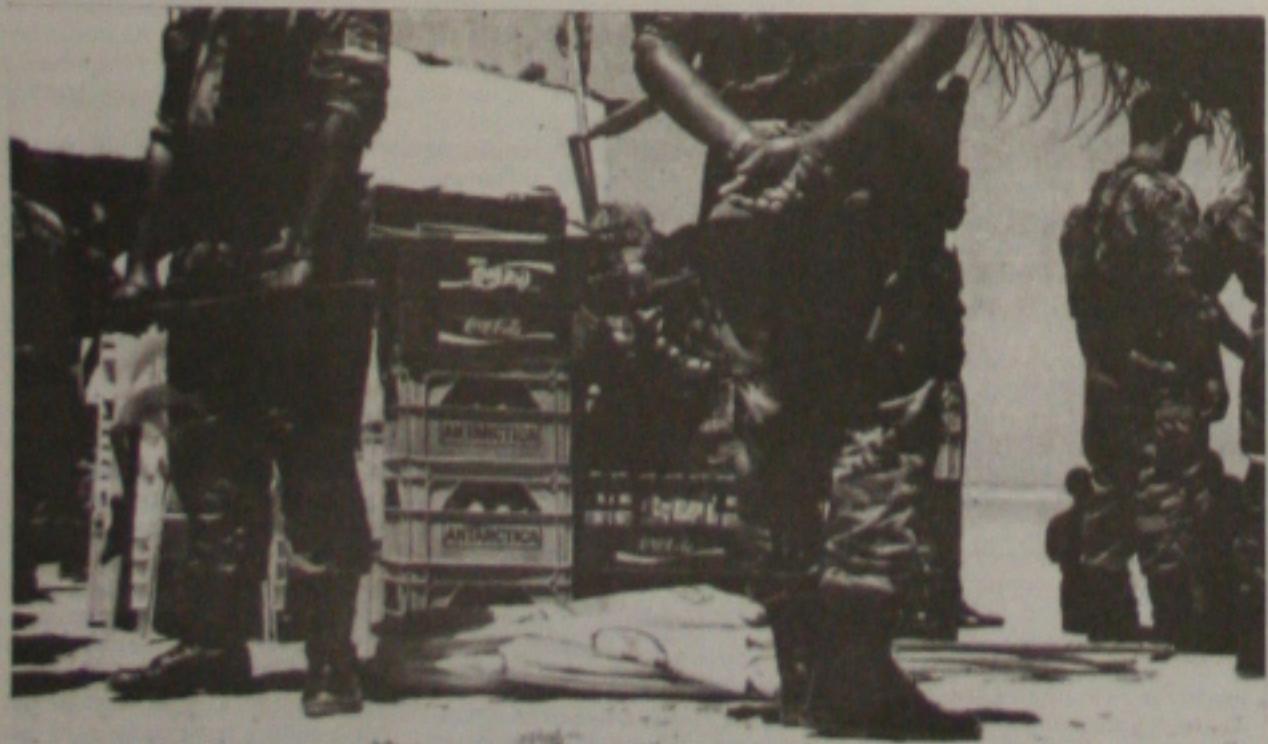
...e utensílios sendo retirados do bar, sob forte esquema policial, na Praia de Aruana