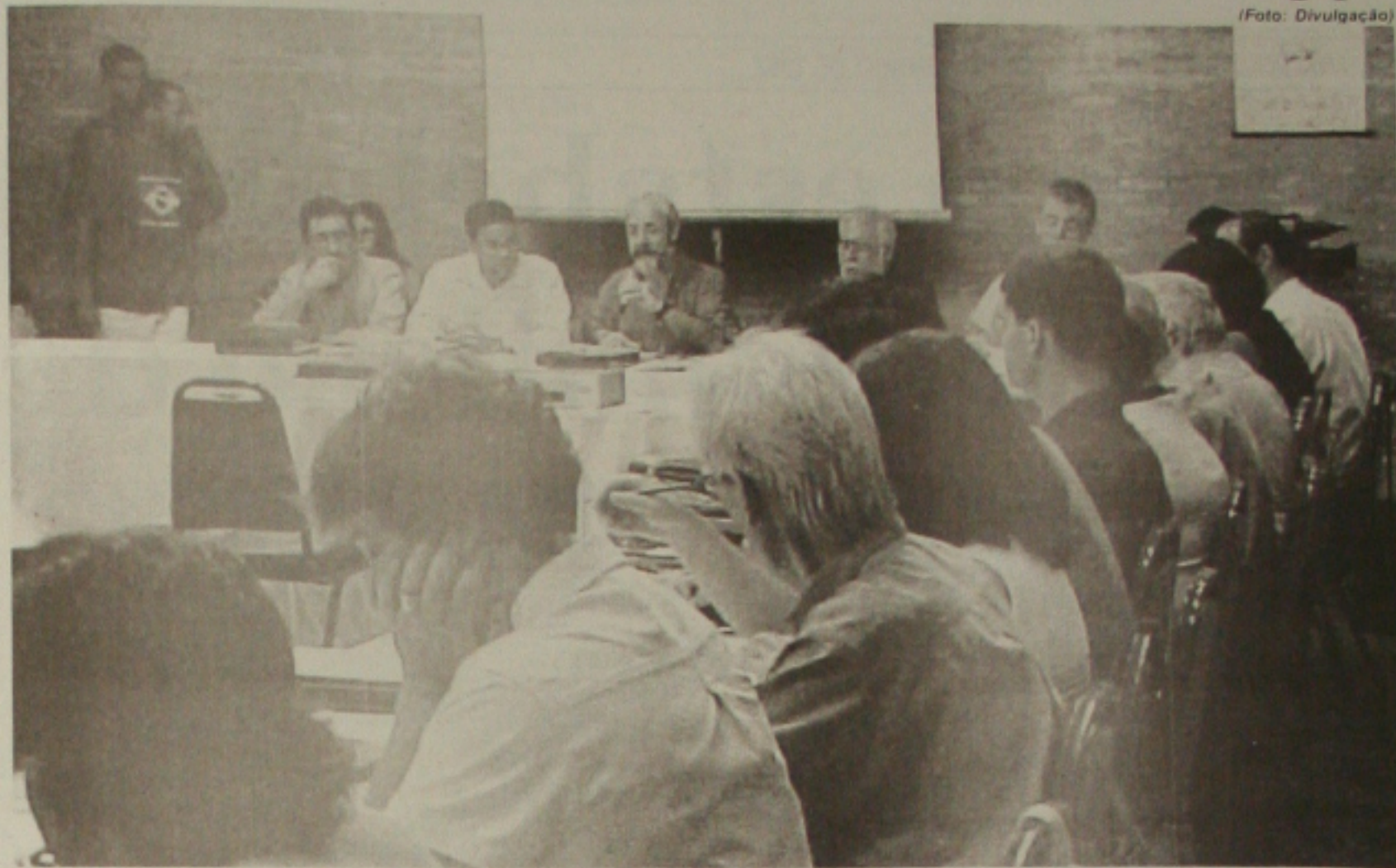
Reunião coordenada pela secretaria de Meio Ambiente discute a reserva da biosfera da Mata Atlântica