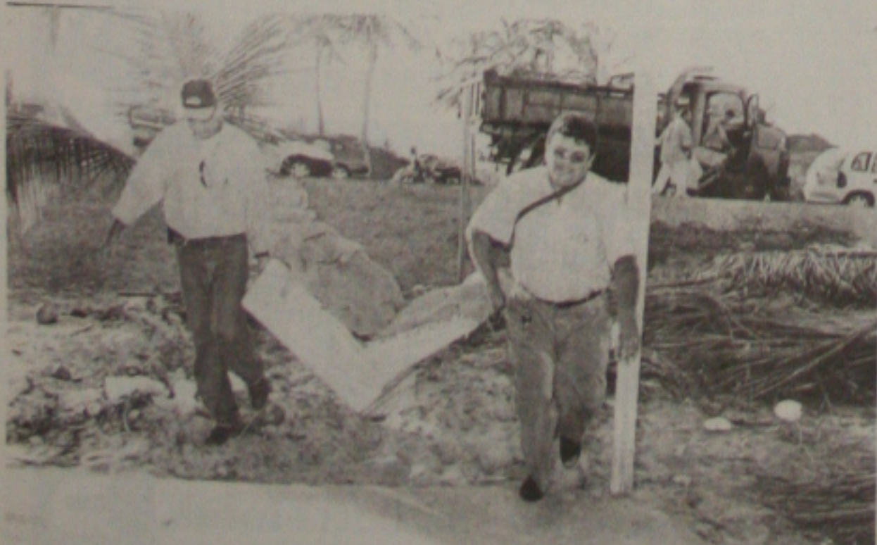
À tarde, funcionários da Justiça tiveram que devolver os móveis retirados pela manhã