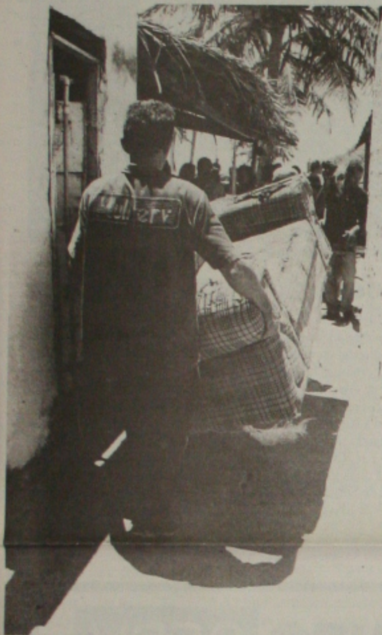
Funcionários da Justiça retiram móveis de um barraco