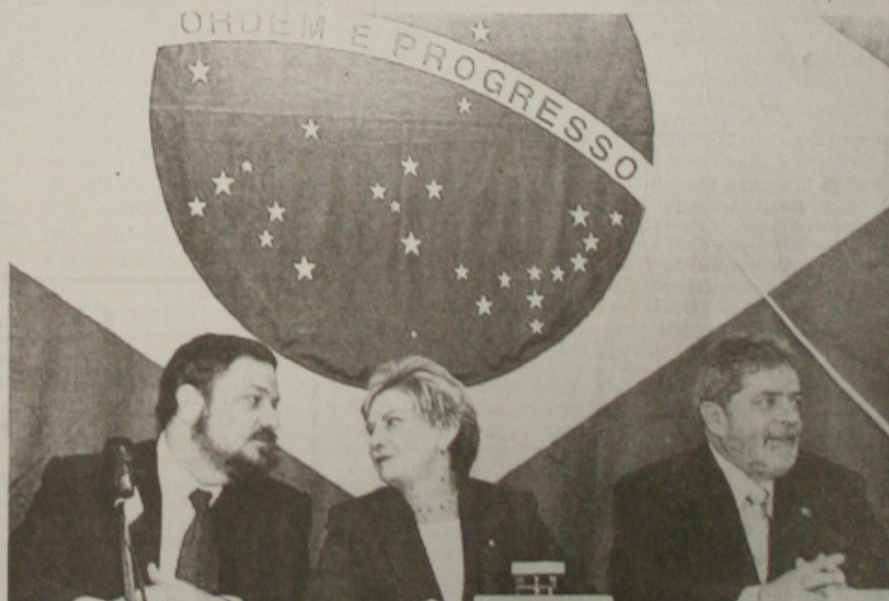
Ao lado da esposa, Marisa (C), Lula se reuniu ontem com trabalhadores e empresários