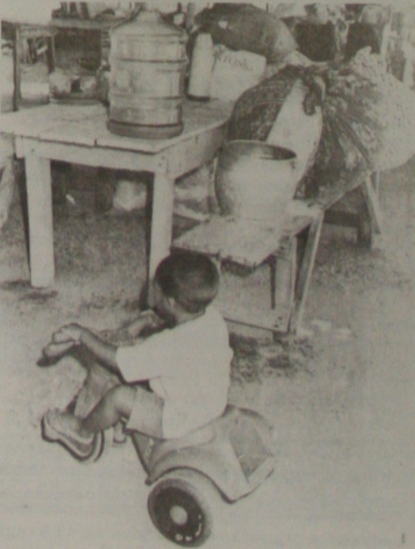
Alheio aos problemas, menino brinca em seu velocípede