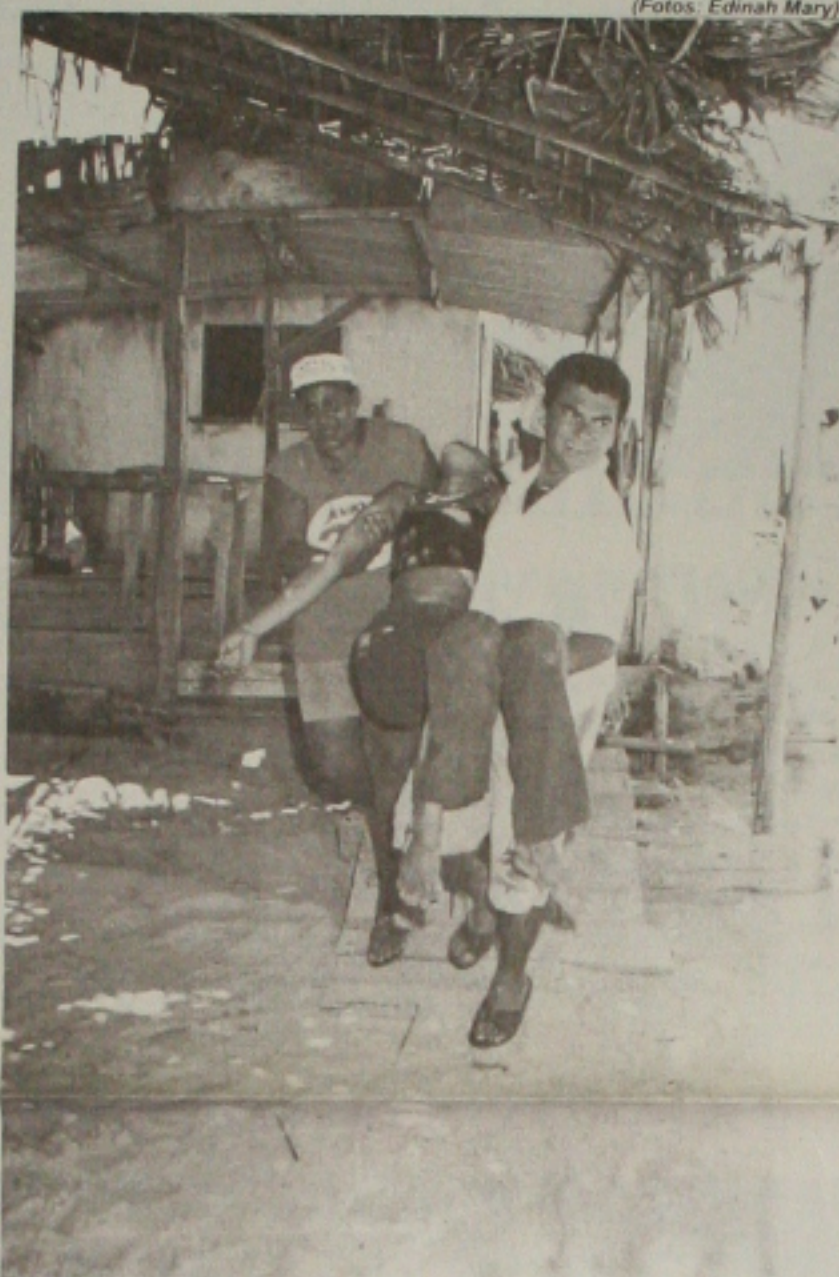
Mulher não resiste a demolição do barraco e é retirada