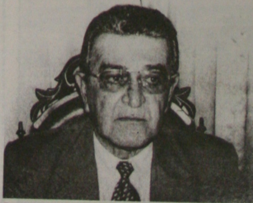
Desembargador Antônio Góes vai participar de encontro

que reunirá a partir do dia 21 do corrente, magistrados de todo o País em nossa Capital. Juntos, eles irão debater diversos assuntos importantes do mundo jurídico e com certeza, aproveitarão a oportunidade para conhecer um pouco da nossa Justiça e nossa cidade.