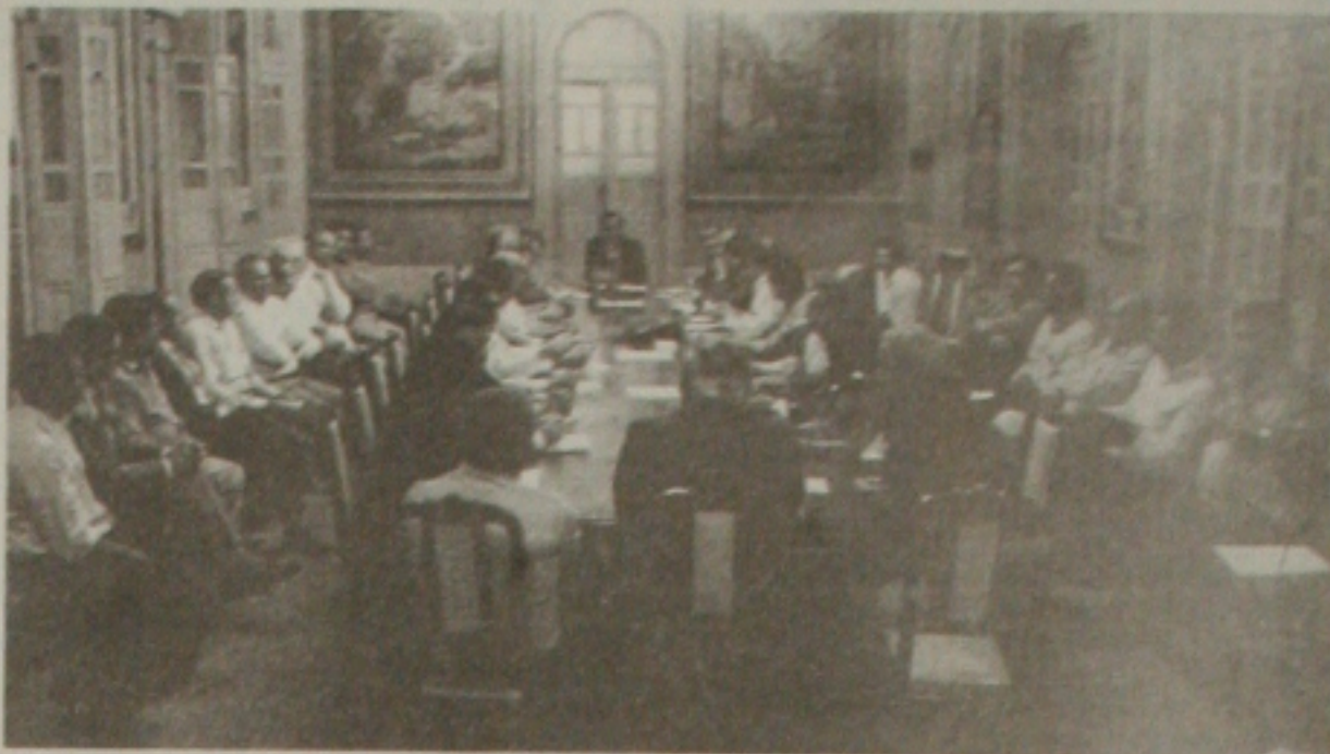
No túnel do tempo, o então Governador João Alves Filho reunido com o Secretariado no Palácio Olímpio Campos.

Pegue o seu carro, logo cedo, e percorra até o fim a rodovia que liga a Praia de Atalaia a Aruana e a José Sarney. No final uma belíssima visão, do encontro do Rio