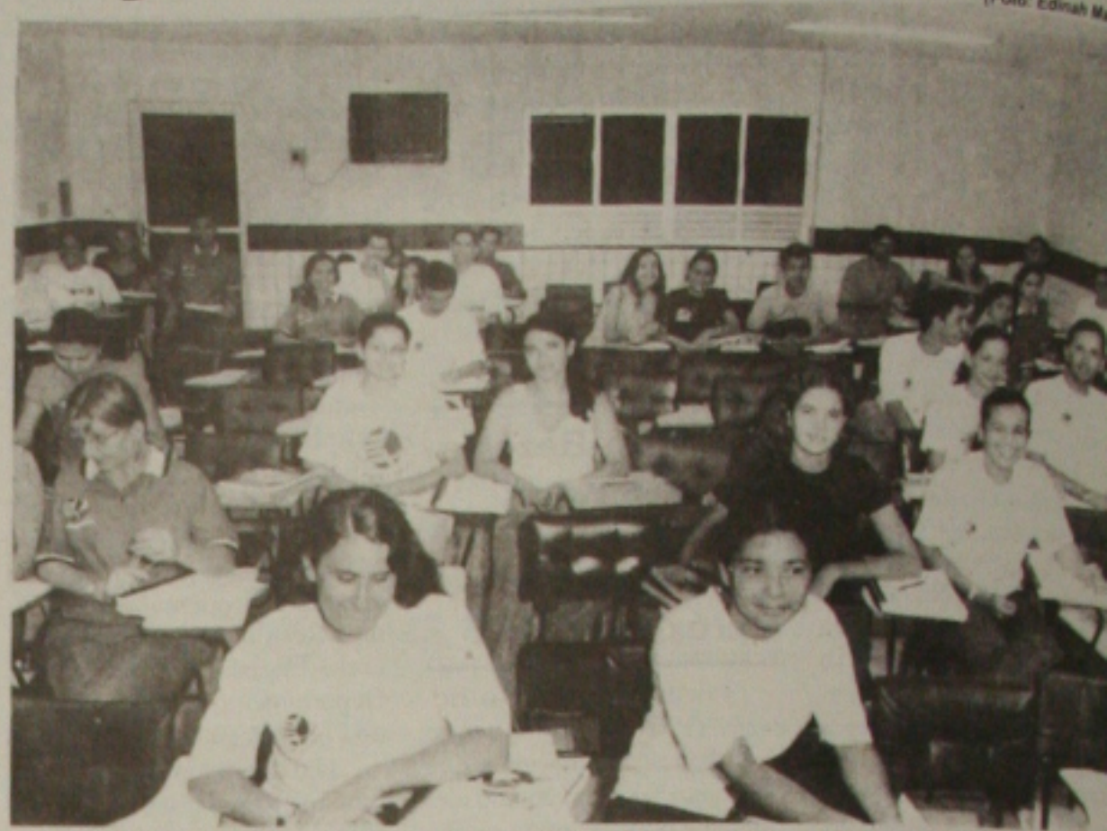
Qualidade do ensino brasileiro é destaque mundial

"Começamos a conhecer a realidade do País, a adotar políticas para superar esta realidade, um plano nacional. A