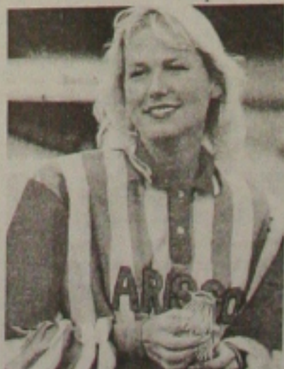
Xuxa realmente não tem o menor senso de autocritica