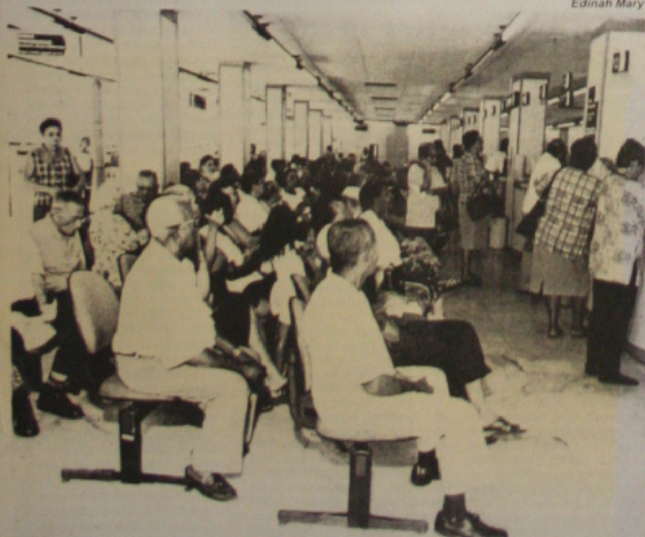
Na véspera de mais um feriadão, agências bancárias da capital, como as do Banese (foto), registram movimento intenso de clientes. (Página 1B)