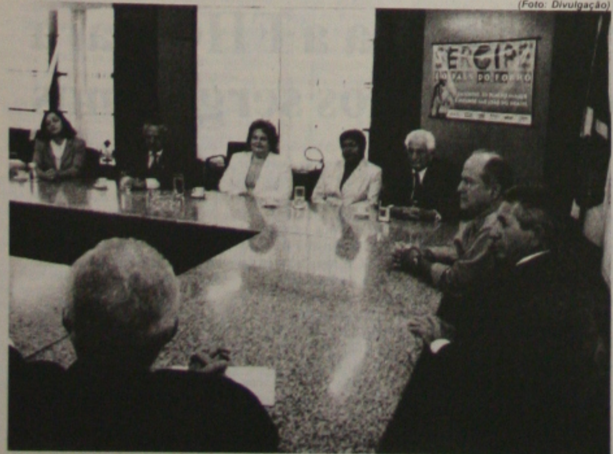
"Moção de Aplauso" foi entregue ao governador