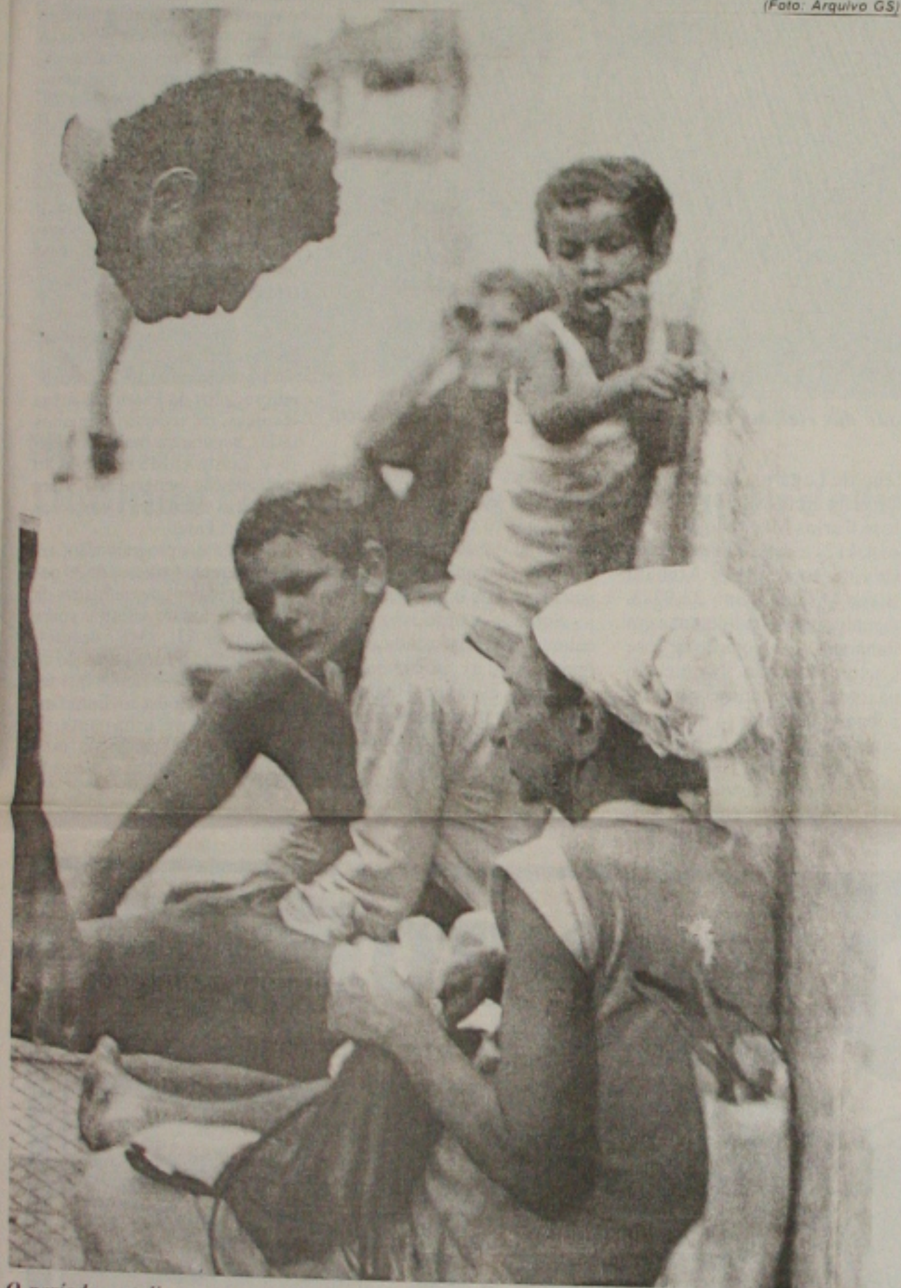
O período natalino tem contribuído para o crescimento da mendicância em Aracaju

É uma rotina na vida de milhões de brasileiros. Ao se aproximar às festas de final de ano, os pedintes reaparecem com frequência e invadem praças, calçadas, esquinas, enfim, qualquer lugar de movimento de pessoas, assim como embaixo das pontes. O Estado de Sergipe entre outros, abriga pessoas de outras cidades e, como exemplo aqui bem perto, no Estado vizinho de Alagoas, principalmente das cidades de Arapiraca, Palmeiras dos Índios e até de Penedo, vêm pessoas como mendigos para receber do povo solidário uma ajuda de qualquer natureza. É por conta disso que, menos de um mês para o Natal, os pedintes já começam a chegar em Aracaju. São pessoas de vários lugares e com pouco tempo na capital. Alguns deles não sabem se deslocarem de um lugar para outro em Aracaju, sem contar com pessoas viciadas que moram em periferia da cidade.