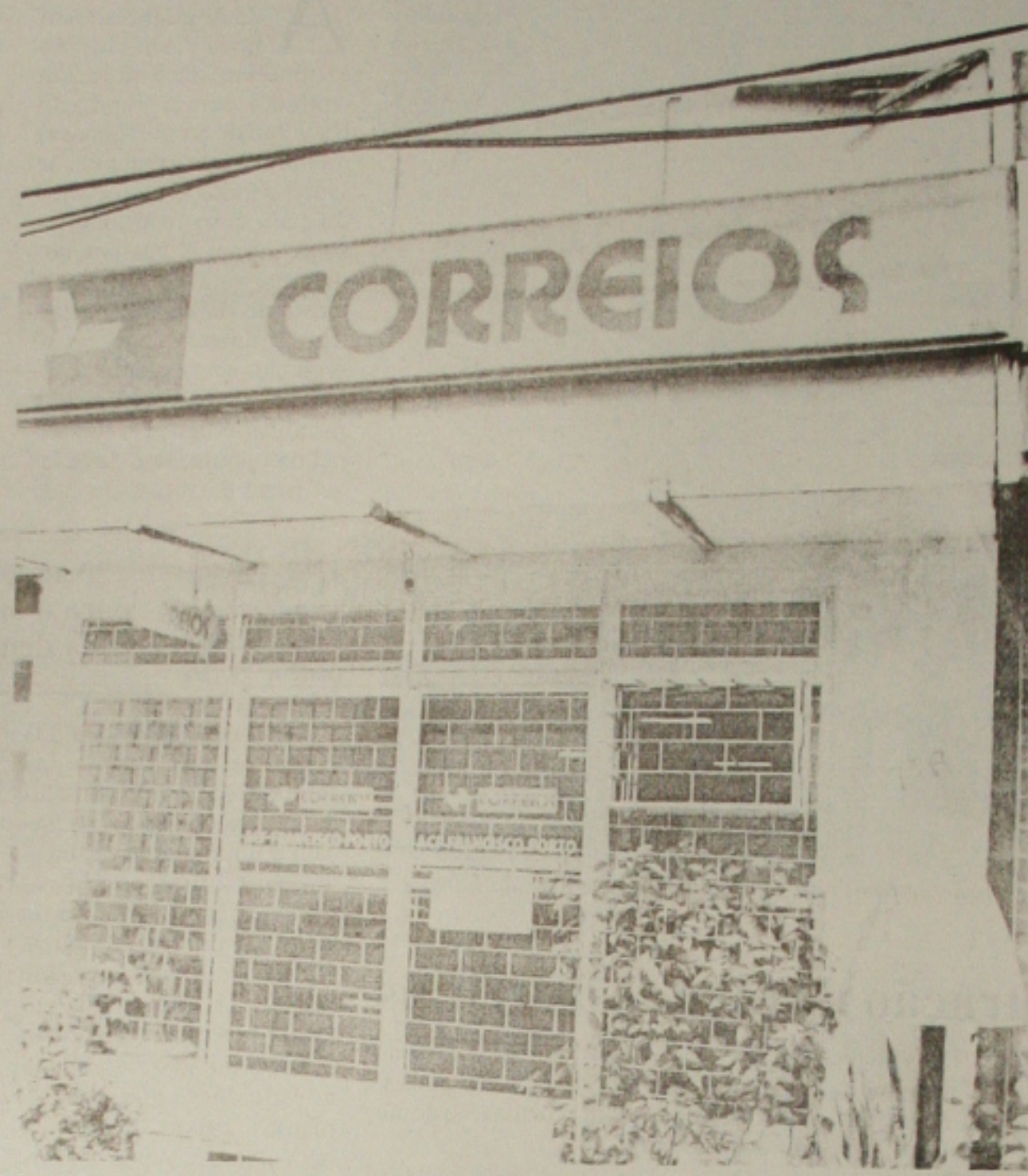
Correios lançam o projeto de escrevedores de cartas em Sergipe